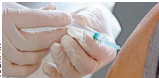
V ZD Kamnik bi si želeli več cepiva, a z vsemi odmerki, ki so jih doslej prejeli, so že cepili večino najstarejših.

13. uro. Interes za cepljenje lahko izkažete tudi pri osebнем zdravniku. »Čakalna vrsta je za zdaj kar dolga, a jo bo treba prečistiti, saj so se nekateri, verjetno v paniki, za cepljenje prijavi tudi po 16-krat, med tistimi, ki so izkazali interes, je denimo tudi dvajsetletnica,« še pravi direktor zdravstvenega doma.