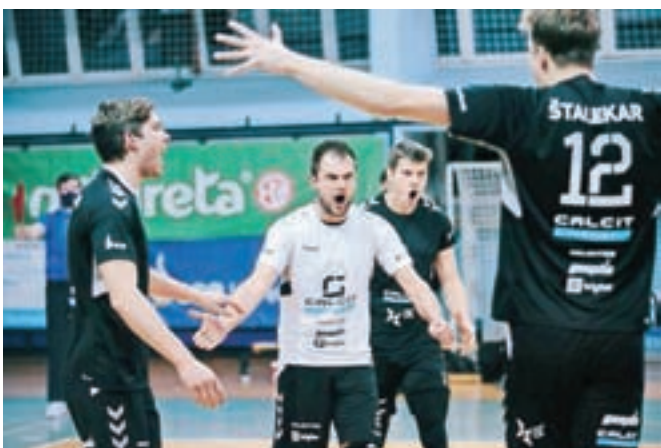
Odbojkarji se bodo zdaj usmerili v končnico državnega prvenstva.

»Dobro je, da smo v tekmi za tretje mesto premagali domačine in da se bomo lahko v miru pripravljali na končnico državnega prvenstva.«