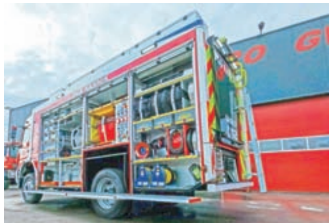
Novo vozilo PGD Kamnik

Kamnik – V petek, 19. februarja, so se člani PGD Kamnik in z njimi tudi številni občani razveselili nove pridobitve, ki bo še izboljšala varnost ob različnih nesrečah.