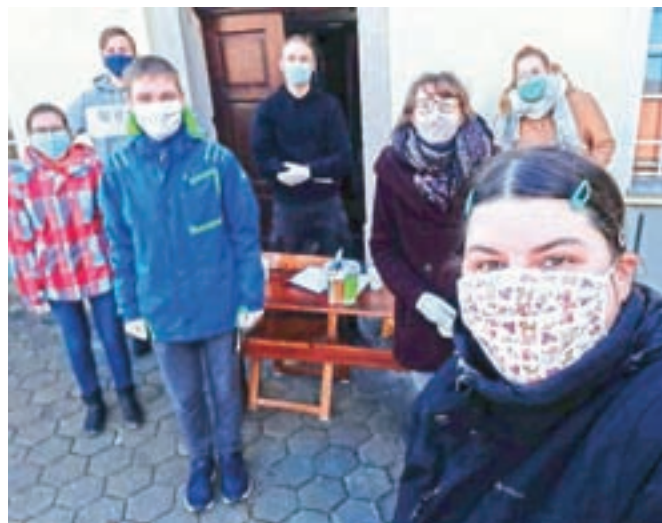
Del skupine mladih prostovoljcev iz Šmartnega v Tuhinju, ki je znova opravila veliko delo.