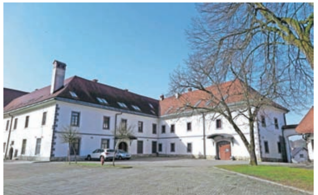
Mekinjski samostan vse bolj postaja prizorišče najrazličnejših dogodkov.

Časopis Kamničanka bo naslednjič izšel predvidoma 19. marca 2021, prispevke lahko pošljete najkasneje do četrta, 11. marca 2021.