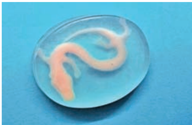
Človeška ribica, spominek v obliki mila

Vsak dan glasneje pa Darja Škulj razmišlja o tem, da bi njen hobi nekoč postal tudi njena služba.