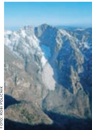
Pogled na skalni podor v steni Rzenika iz zraka

Kamniška Bistrica – Planinsko društvo Domžale, ki je skrbnik planinske poti iz Kamniške Bistrice po dolini Kamniške Bele do slapa Orglice in naprej do Presedlaja, Konja in Korošice, obvešča, da je planinska pot na odseku od slapa Orglice proti prelazu Presedlaj zaprta. V petek, 26. februarja, se je s severozahodne stene Rzenika, točneje v predelu, imenovanem Ojstri rob, sprožil obsežen skalni podor, ki je deloma zasul tudi planinsko pot. »Zaradi zasute poti, nestabilnega terena in velike nevarnosti nadaljnjih podorov je planinska pot na tem odseku zaprta,« opozarjajo v planinski organizaciji, hkrati pa tudi na večjo količino