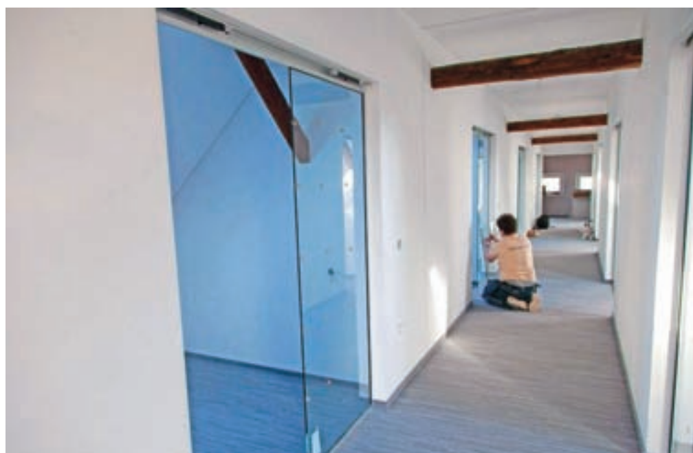
Novi mansardni prostori v KIKštarterju

Pisarne so med seboj ločene in zvočno izolirane, kar bo uporabnikom omogočalo pravo mero zasebnosti in dobre pogoje za delo. Prostor pa bodo primarno namenjeni podjetnikom, ki