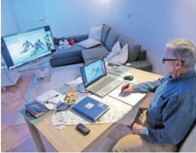
Izobraževanje na daljavo po Zoomu

Kamnik – Kot nalašč je bila letošnja zima že na začetku bogata s snegom, a pandemija koronavirusa je vse bolj omejevala prosto gibanje v naravi in nam onemogočala izvedbo ustreznih licenčnih seminarjev na snegu. Smučarji smo sicer vajeni raznih nevšečnosti in se znamo in moramo prilagoditi številnim težavam na terenu, kot so mraz, megla, veter, poledene-