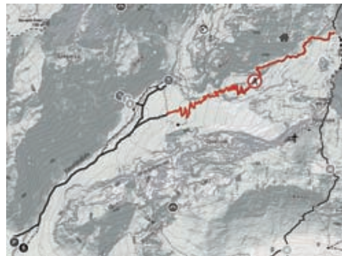
Zemljevid, ki označuje, kje je planinska pot zaprta

finega prahu, ki je kot posledica podora prisoten po celi dolini Kamniške Bele. Poti do priljubljenega slapa Orglice so normalno prehodne.