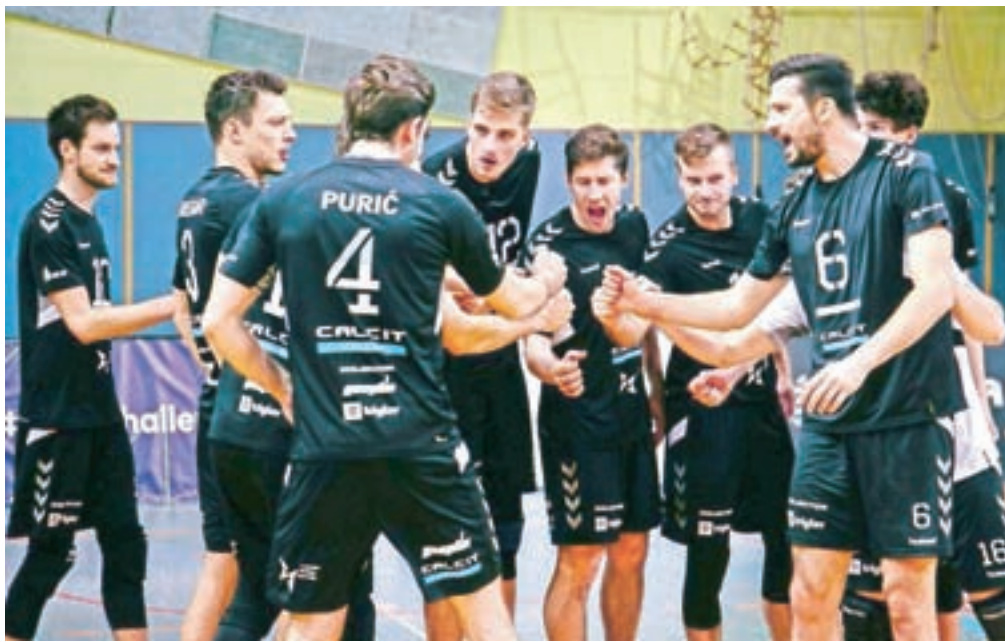
Čeprav je tretje mesto lep uspeh, v kamniškem taboru po zaključnem turnirju srednjeevropske lige niso bili najbolj zadovoljni.