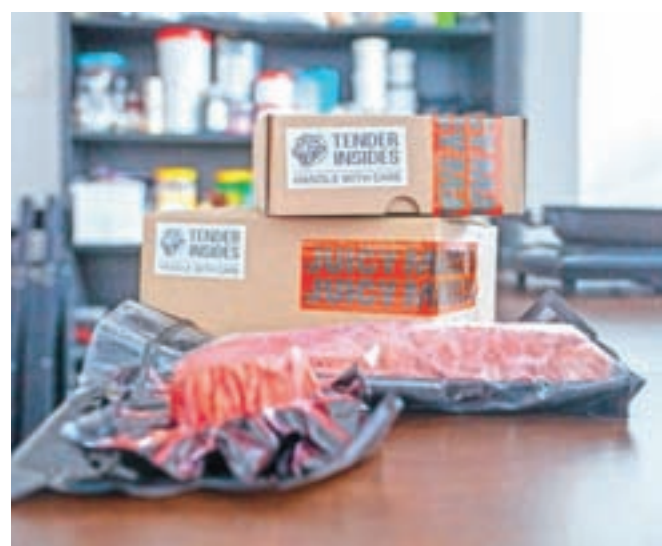
Izdelki Juicy Marbles so že na voljo kupcem.

navaja možnosti pridobivanja mesa z živalskimi celicami v bioreaktorju, iz gob in rastlin. Za to pot so se odločili v Juicy Marbles, saj verjamejo, da je najhitrejša in tudi najbolj trajnostna. S postopki transformacije beljakovin rastlinskega izvora so ustvarili izdelek, ki ima v nekaterih pogledih že zelo podobne lastnosti kot meso, v drugih pa ga celo presega. Tako je intenzivnost okusa njihovega mesa precej daljša kot pri živalskem mesu, nekaj več težav pa je z doseganjem prave teksture. »Težko bomo ustvarili povsem enako meso, kot je živalsko, kar niti ni bistveno. Glavno je, da zagotovimo toliko boljše lastnosti mesa, da bo med kupci prišlo do miselnega preskoka in se bodo raje odločali za alternativo,« pojasnjuje.