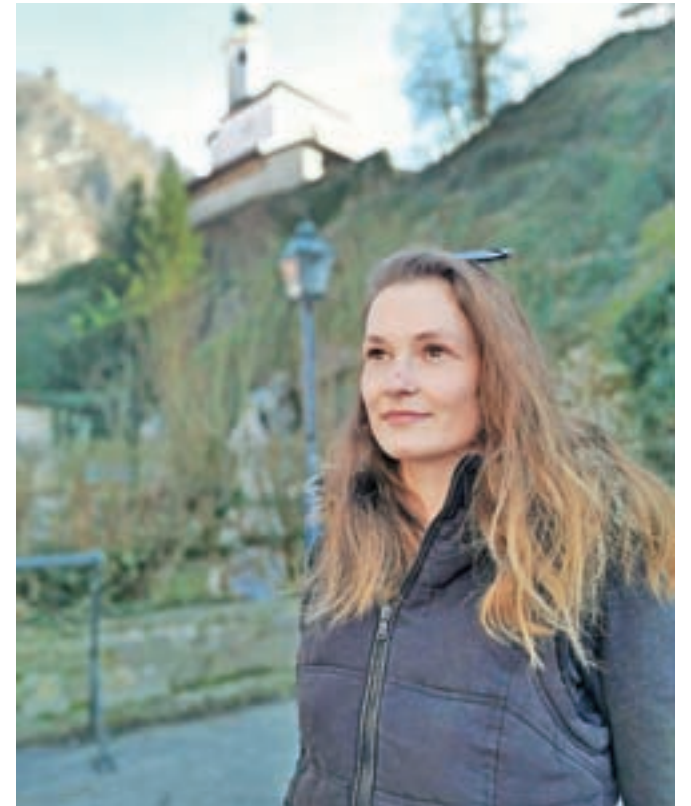
Darja Škulj

»Zelo dobro se spomnim, kako je na sejmu k meni pristopila lastnica trgovine z lokalnimi izdelki in me povabila k sodelovanju ter vključitvi mojih izdelkov v njeno pro-