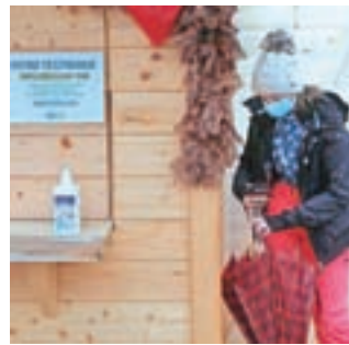
Testiranje s hitrimi antigenski testi opravljajo pri spodnji postaji nihalko.

V soboto, 23. januarja, so ob upoštevanju omejitvenih ukrepov lahko znova pognali nihalko in sedežnico, in čeprav je prvi napovedani smučarski dan »odplaknilo«