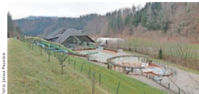
V Termah Snovik nestrpno čakajo vnovično odprtje.