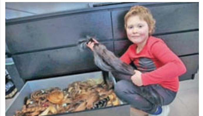
Čopi las prihajajo iz cele Slovenije. So različnih barvnih odtentov.