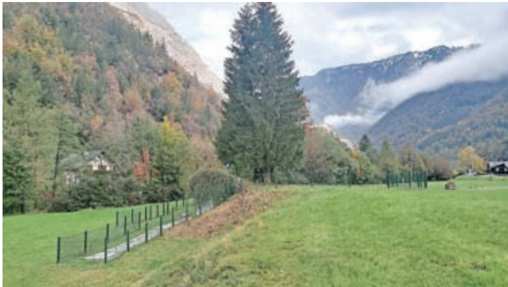
Vodovodno zajetje Iverje v Stahovici oskrbuje okoli dvajset tisoč občanov.

Na občini so se problematike lotili resno. Da ne bi bili več odvisni od pretoka reke Kamniške Bistrice (Iverje je namreč zajetje površinske vode), bodo izvedli tri globoke vrtine, ki bodo omogočale zagotovitev dodatnih količin pitne vode v primeru zmanjšanja količin pretoka vode iz Kamniške Bistrice v drenažno zajetje Iverje. Prvo vrtino bodo skopali že letos; v ta namen je v proračunu