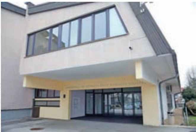
Gimnazija in srednja šola Rudolfa Maistra Kamnik

sel nova vprašanja in izzive. Različnost domačih razmer in dijaških učnih okolij posega v učni proces, vpliva na njihovo odzivnost in povečuje razlike med njimi. Na daljavo jih je veliko težje premostiti. Učitelji in svetovalni delavci so dijakom na razpolago tako rekoč ves čas. Omogočamo dodatne ure, svetovanje in usmerjanje, z dijaki in med seboj komuniciramo preko mnogih kana-