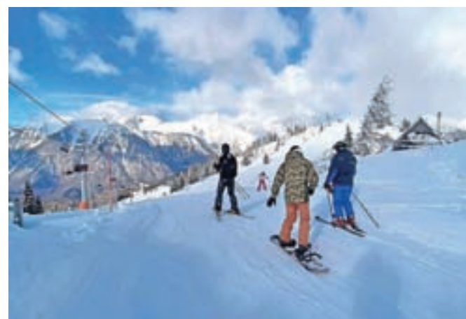
Na Veliki planini so konec januarja našli nekaj več kot tisoč tristo smučarjev.