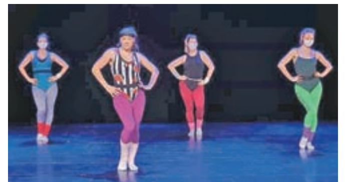
Na odru Doma kulture Kamnik