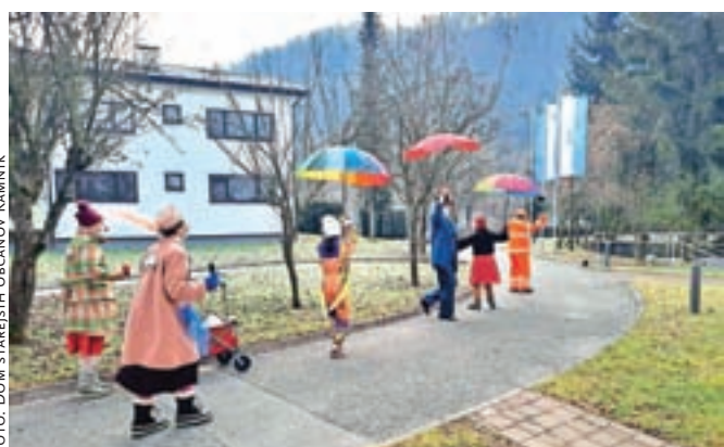
Rdeči noski so takole polepšali dan stanovalcem in zaposlenim Doma starejših občanov Kamnik.