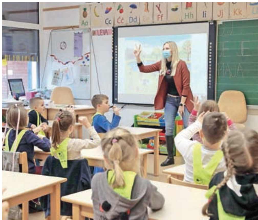
V svojo učilnico so k pouku z velikim veseljem prišli tudi učenci 1. b razreda Osnovne šole Toma Brejca Kamnik.

Zaposleni so morali pred odprtjem šol opraviti testiranje na koronavirus. Z OŠ Frana Albrehta se je testiranja udeležilo 79 zaposlenih (dve osebi ne, ker sta pred nedavnim preboleli covid-19, in dve iz osebnih razlogov) in vsi so bili negativni. Prav tako pozitivnega testa niso imeli na OŠ Toma Brejca, kjer se jih je testiralo 45, na OŠ Šmartno v Tuhinju (testiranih 42) in na OŠ Marije Vere (testirali so se vsi zaposleni). Posledično z organizacijo pouka za prvo triado v osnovnih šolah po občini za zdaj nimajo težav in pouk v šoli lahko obiskujejo vsi oddelki prve triade, tako kot je predvideno. Kljub vsemu imajo na šolah tudi nekaj težav z upoštevanjem vseh zapovedanih ukrepov. Na OŠ Toma Brejca tako denimo ne morejo zagotavljati jutranjega varstva za učence drugega in tretjega razreda. Ko so epidemiološko in organizacijsko zadostili vsem ukrepom, so učencem vrata