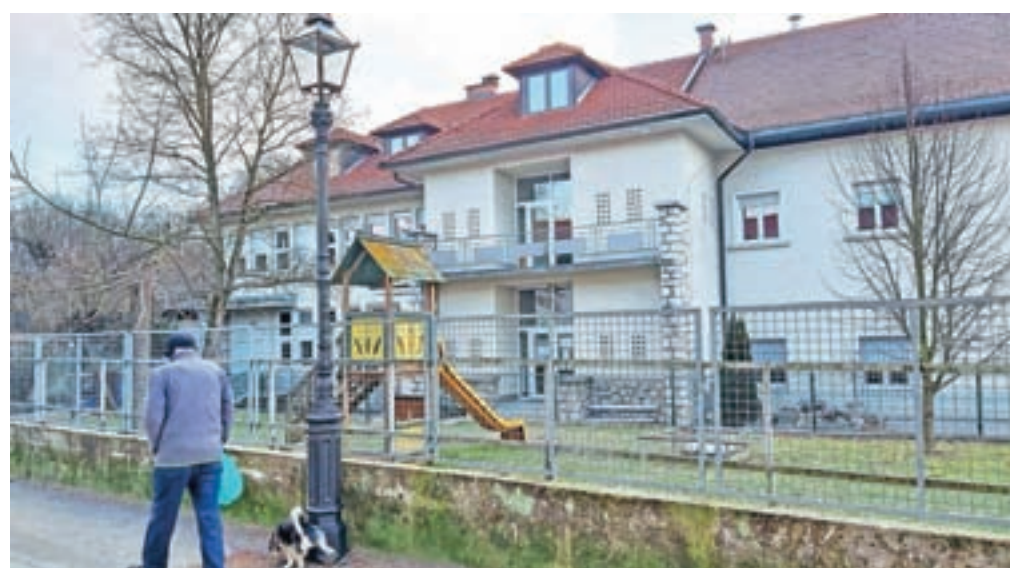
Osnovna šola 27. julij Kamnik je za zdaj edina šola v občini, kjer pouk poteka v razredih, a brez okužb januarja žal ni šlo.