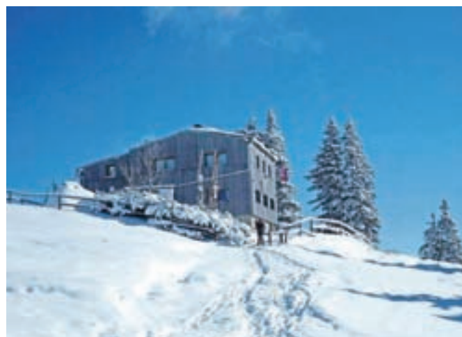
Za primerne male komunalne čistilne naprave oziroma greznice morajo poskrbeti tudi planinski domovi na planini.

Na občini podatka, koliko pastirskih in planinskih koč na planini je ustrezno komunalno opremljenih (z izjemo omenjenih prejemnikov subvencij), nimajo, saj so vrsto let lastniki oziroma najemniki objektov sami skrbeli za odvoz grezničnih gošč ter muljev iz MKNČ. »Skupaj s koncesionarjem smo že začeli vzpostavljati evidenco števila koč na širšem območju Velike planine, v letu 2021 pa bomo pristopili k vzpostavitvi evidence opremljenosti koč tudi glede načina odvajanja in čiščenja odpadnih voda (MKNČ, nepropustne greznice itd.) ter začeli uvažati sistemske in dolgoročne rešitve za omenjeno področje. Pri pripravi podatkov so nam v veliko pomoč tudi podatki pridobljeni s strani JP CCN Domžale - Kamnik, ki nam poročajo o količini pripeljanih gošč z območja Velike planine,« še pravi Kadunčeva.