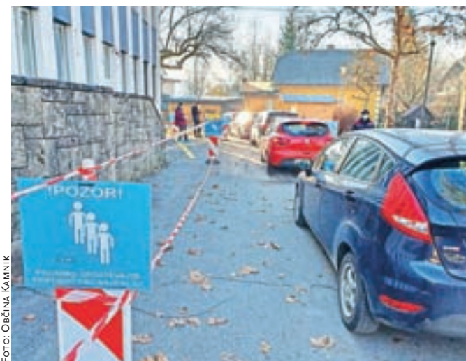
Testiranje s hitrimi testi poteka v Domu kulture Kamnik.