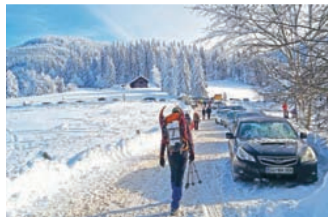
Gneča na Kranjskem Raku