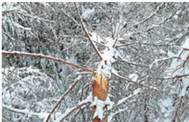
Zaradi snega polomljena drevesa pod Veliko planino

na terenu opazili kamniški gozdarji, so poškodbe utrpela predvsem posamezna mlajša drevesa listavcev, ki so v fazi drogovnjaka, in posamezna drevesa smreke zaradi neenakomerne preobremenitve krošenj na legah, izpostavljenih vetru. Zaradi snežnih razmer in s tem povezano nedostopnostjo celovite ocene škode še ni, a po prvih pregledih sodeč obseg poškodb ni skrb vzbujajoč, še pravi Zabret.