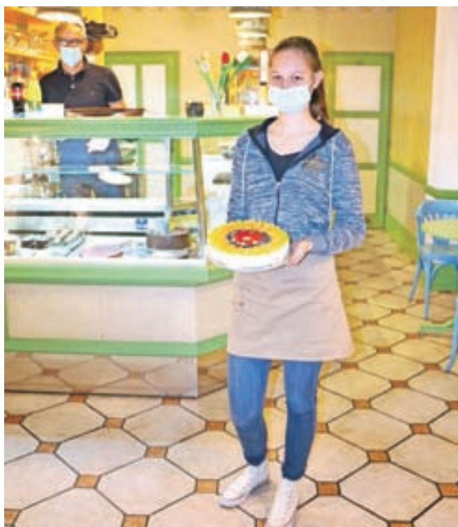
V Čarobnem vrtičku pripravljajo dnevno sveže slaščice. Letos bodo praznovali že petindvajseti rojstni dan.

Klasičnih sladice v vitrini ne manjka. Izbirate lahko med dnevno svežimi tortami, kremnimi rezinami, indijančki, ježki, delajo tudi svoj sladoled in okusne presne torte.