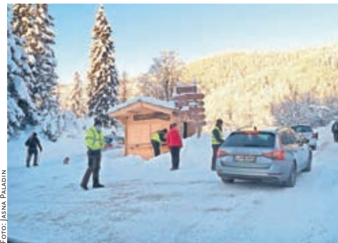
Za parkiranje na Rakovih ravneh je treba plačati sedem evrov. Za red in pretočnost skrbijo tudi člani AMD Kamnik.

»Na območju Velike planine so policisti letos izdali 25 obvestil o nepravilnem parkiranju. Kršitev Zakona o nalezljivih boleznih niso ugotovili, saj so se vsi na območju nahajali na podlagi izjeme po odloku, ki dovoljuje gibanje znotraj regije med občinami zaradi izvajanja individualnih športnih aktivnosti, smo pa več ljudi opozorili na druge kršitve s tega področja. Policisti so na območju Velike planine za-