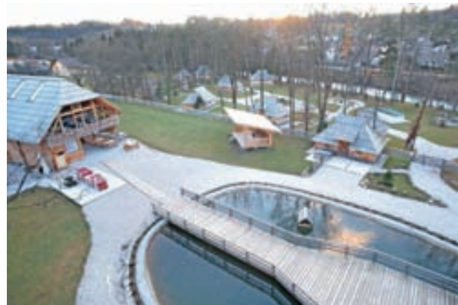
Slovenia Eco resort v Godiču

dogodkov, odpovedane rezervacije in nenazadnje vsi stroški v zvezi s prekinjenimi pogodbami o zaposlitvi. Sama višina škode bo znana, ko se bodo vsi škodni elementi sestavili, sodni izvedenci pa bodo ocenjevali škodo iz naslova negativnega poročanja medijev, ki so bili kot posledica nezakonitega odklopa in nezakonite odločbe inšpektorja,« nam je zapisal v odgovoru.