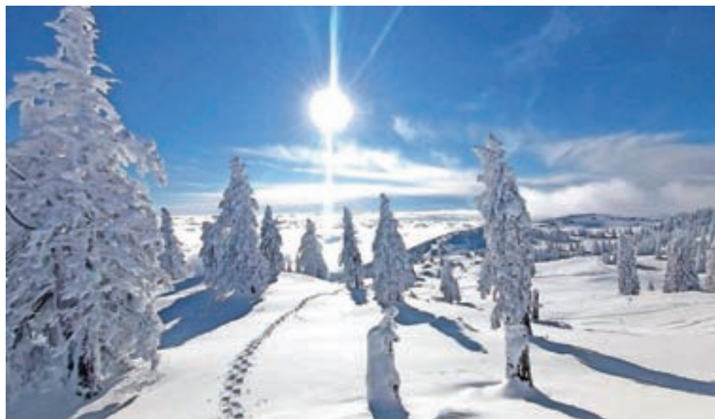
Velika planina in druga višje ležeča območja so se v letošnjem januarju pogosto sončila v pravi zimski idili.

»Občina Kamnik takšnega obiska ni pričakovala, je pa