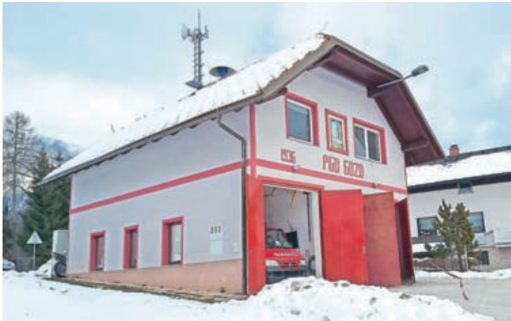
Gasilski dom na Gozdu

Ureditev dovoljenj bi v vsakem posameznem primeru