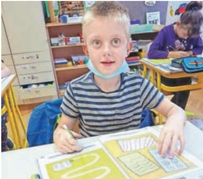
Prvi šolski dan so se lotili dela z veliko vneto, brez želje po odmoru, in napredek je bilo moč ugotoviti že po petih dneh.

»Glede na to, da imamo majhne oddelke in k sreči dovolj zdravega kadra, je sam pouk stekel kot po navadi, brez nekih posebnih prilagoditev, vezanih na samo poučevanje. Prilagoditve prostorov, organizacija malice in kosila, zračenje, razkuževanje ... je bilo določeno že ob začetku šolskega leta, tako da tu ni bilo nekih sprememb. Ob vrnitvi v šolo učitelji ugotavljajo določene vrzeli v zanj, čeprav je v primerjavi s spomladanskim šolanjem na daljavo delo tokrat potekalo bolj tekoče. Dejstvo je, da naši učenci potrebujejo fizičen kontakt z učiteljem, dobre pogoje za delo, ki jih nekateri doma žal nimajo, saj so družine veččlanske in ni pravega miru za delo. Za mlajše učence je zelo pomembna socialna nota, stik z učiteljico in sošolci. Prvi šolski dan so se lotili dela z veliko vneto, brez želje po odmoru, in napredek je bilo moč ugotoviti že po petih dneh. Z gotovostjo lahko trdim, da je bil za večino učencev, gotovo pa tudi njihovih staršev, povratek v šolo veliko olajšanje. Nekih