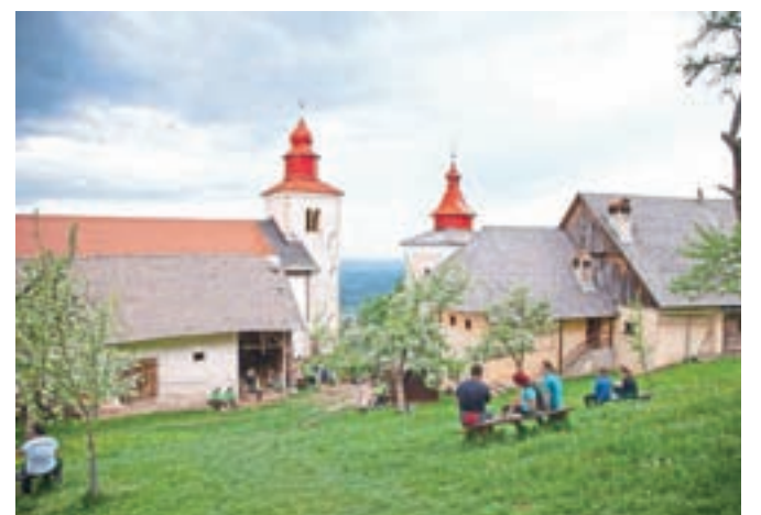
Sv. Primož je priljubljena izletniška točka v vseh letnih časih.