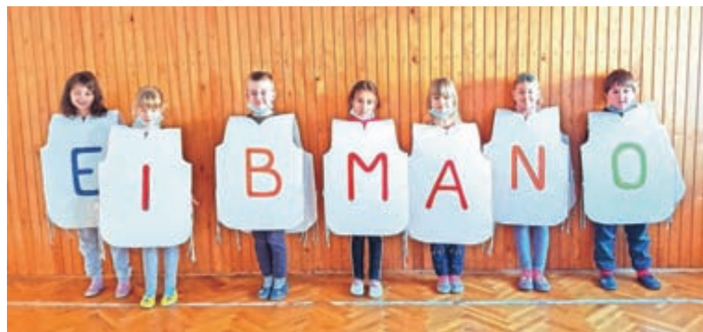
Učenci Osnovne šole 27. julija so komaj čakali, da se znova usedejo v šolske klopi in učijo skupaj s svojimi sošolci.