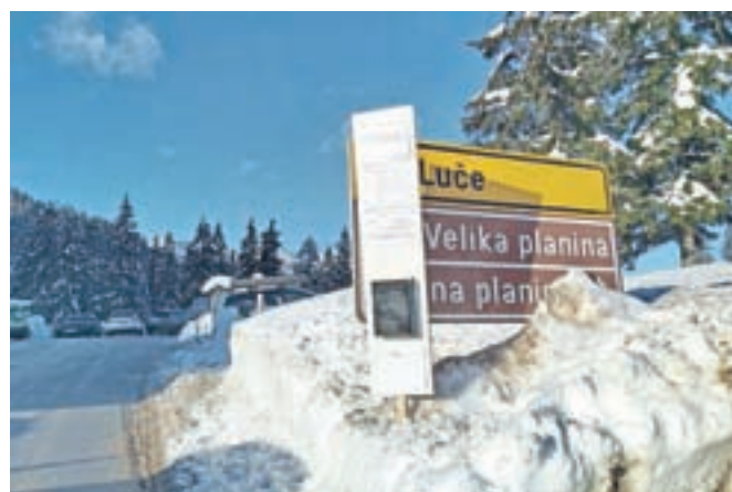
Nabiralnik ob zasebnem parkirišču, kamor v zameno za parkiranje lahko daste prostovoljni prispevek za gasilce PGD Gozd.

radi velikega števila obiskovalcev izvedli fizično usmerjanje prometa, kjer je zaradi nepravilno parkiranih vozil prišlo do zastoja in nepretočnosti prometa, ki so ga preusmerjali v smeri Luč,« so nam odgovorili na Policijski upravi Ljubljana.