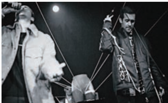
Trojica so razmišljujoči posamezniki, ki jih zanima umetnost temnih koticov sveta, kar osmišlja njihovo skupno vizijo ...

so nas skupni interesi in med drugim ljubezen do hip hop glasbe,« razložijo. Kot trojica, ki sliši na ime Matter, se pri kreiranju vsebin ne opredeljujejo žanrsko. »Večji poudarek damo čustvu dotične pesmi. Naša glasba je po formi in strukturi najbližje rapu, po ideji in čustvu pa blizu panku. Smo razmišljujoči posamezniki, ki nas zanima umetnost temnih koticov sveta, kar osmišlja našo skupno vizijo. Poslušalcem rišemo svet, kot ga vidimo – od temačnih realnosti do peterpanovske sanjivosti, ki vliva pogum,« se glasi odgovor na vprašanje, kam se uvrščajo glede na glasbeni stil. Glede na poetičnost od-