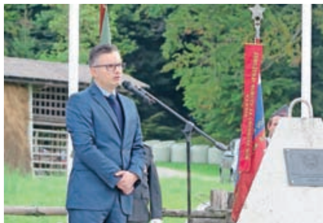
Slavostni govornik Marjan Šarec

netenja delitev so danes še kako prisotni. Verjamem, da nas to ne bo uničilo. Naj se politiki še tako prepiramo, slovenski narod in Republika Slovenija bosta preživela tudi v bodoče,« je še pouda-