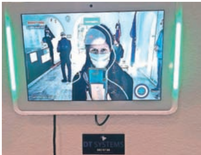
Vstop v občinsko stavbo je mogoč le ob merjenju telesne temperature, ki ne sme biti povišana.

»Tako kot doslej strankam predlagamo, da v čim večji meri izrabijo možnost urejanja zadev po telefonu oziroma po elektronski pošti,« sporočajo z občine in dodajajo, da so kljub uvedbi novega ukrepa v občinski stavbi še vedno obvezni tudi nošenje zaščitnih mask, razkuževanje rok in varnostna razdalja.