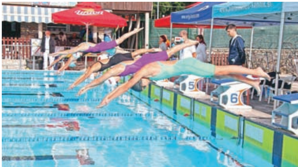
Plavalni miting Veronika je letos prišel na vrsto konec septembra

Za odličja in dobre rezultate se je na tekmovalju potegovalo tudi 36 domačih plavalcev (17 deklic in 19 dečkov) iz štirih tekmovalnih selekcij, pod vodstvom trenerjev Emila Tahirovića, Mihe Potočnika in Lare Seretin. Najmlajši so se borili za dobre osebne rezultate in norme za državna prvenstva, izkušenejši so stopali na stopničke. V skupnem seštevku obeh tekmovalj so kamniški plavalci osvojili 68 odličij: 22 zlatih, 22 srebrnih in 24 bronastih.