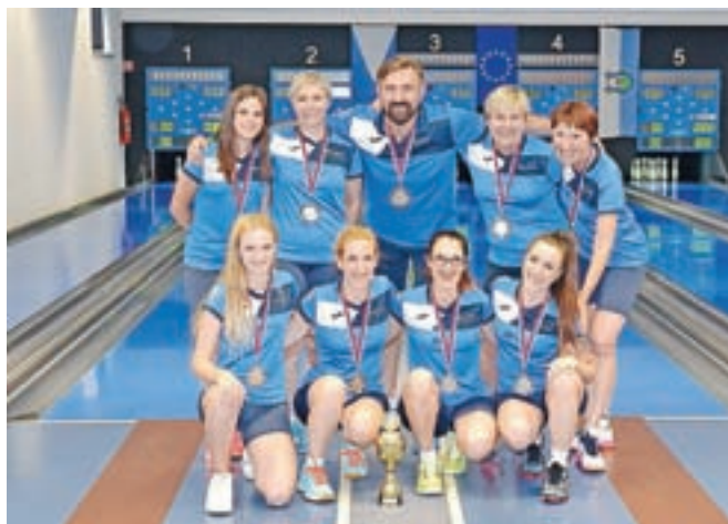
Prva ženska ekipa Kegljaškega kluba Calcit Kamnik