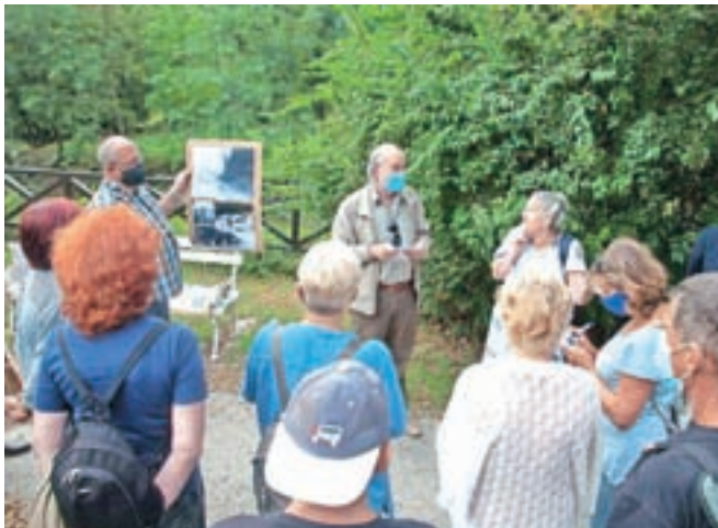
Krajani KS Kamnik – center so skozi zgodbe domačinov spoznavali svojo okolico.

Krajani KS Kamnik – center se sicer že šesto leto zapored redno dobivajo na septembrskih druženjih, zadnji dve leti pa so program začeli s sprehodom po mestnih soseskah. Tako so lani spoznavali Šutno in Glavni trg, letos pa so se skozi spomine in zgodbe domačinov približje seznanili z danes že skoraj pozabljeno sosesko