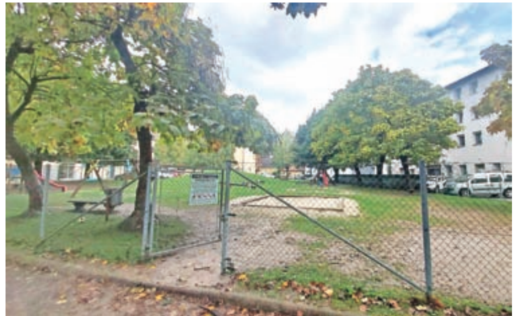
Igrišče med Ljubljansko in Kranjsko cesto ni edino v občini, kjer prihaja do vandalizma in neprimerne vedenja predvsem mladih.

Ker gre za otroško igrišče, ki je v občinski lasti, smo se po vprašanja, kako spremljajo omenjeno problematiko in kako jo nameravajo rešiti, obrnili tudi na občino in Zavod za turizem, šport in kulturo, ki igrišče upravlja. »Vrata na južni strani igrišča so bila ob gradnji kolesarske steze na tem delu nekaj časa preventivno zaprta. To lahko storimo ponovno, a verjetno to ne bo rešilo omenjene problematike. Kar se tiče uničenih ograj, smo jih že popravili, a nemogoče je zavezati vandalizem, ki se pojavlja na vseh igriščih. Opažamo, da je več vandali-