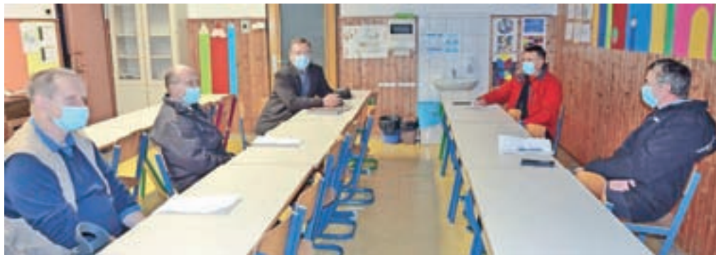
Srečanje članov duhovnega gibanja Možje sv. Jožefa iz kamniške dekanije

sprejema stvari in dogodke ter nanje gleda z zdravo mero razuma, kritičnosti do vsega, kar se danes dogaja na političnem prizorišču, in prebujenosti, ko je treba reči in narediti, kar je mož dolžan. To je: postaviti se za prave vrednote, cilje in poti do njih. To je tudi naloga Mož sv. Jožefa. Udeleženci srečanja so sklenili, da bodo v prihodnje še trdneje povezani v molitvi, pomoči drug drugemu z nas-