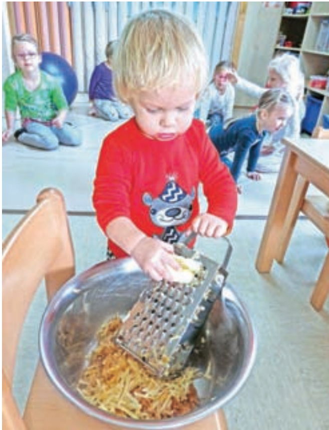
Otroci radi in z veseljem sodelujejo pri vseh postopkih priprave. In ne, niso premajhni za rezanje, gnetenje, mešanje.

različnih letnih časih. V gozdičku, v katerega radi zahajamo z otroki iz enote Mojca, raste marsikaj. Spomladi je tam veliko čemaža, zato smo otroke seznanili z njegovo vsestransko uporabo. Tako smo tudi neposredno pokazali, da hrana ni nujno nekaj, kar kupimo samo v