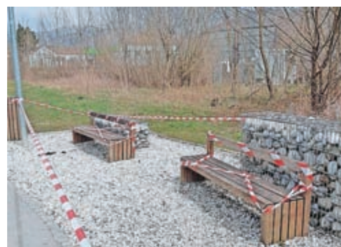
V skladu s pozivom #ostani doma posedanje po klopeh in na avtobusnih ali železniških postajah ni več dovoljeno.

pešpoti ob Kamniški Bistrici, pred srednješolskim centrom, ob izvihu Kamniške Bistrice in drugod. Lokacije, kjer se ne sme zadrževati, so s trakovi označili delavci Komunalnega podjetja Kamnik, ki so pogodbeni izvajalci Občinskega štaba Civilne zaščite. V teh dneh po večini javnih površin in pred trgovskimi centri izvajajo tudi dekontaminacijo.