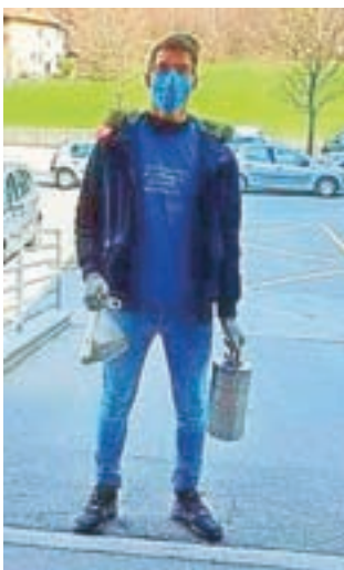
Prostovoljec Žiga pred kuhinjo Doma starejših občanov Kamnik s kosilom, ki ga vsak dan dostavi starejši občanki na dom

prejeli veliko podporo skupnosti, ki je delila našo objavo, oglašil se nam je tudi e-servis, naš poziv so objavili lokalni mediji ... – vsi z namenom, da o prostovoljstvu razširijo glas.« Ker so se zadeve želeli lotiti kar se da odgovorno, so se najprej obrnili na občino in jim pojasnili, da želijo pomagati le z njihovo odobritvijo. »Le pet minut po poslanem elektronskem sporočilu me je klical župan osebno in se iz dna srca zahvalil za našo pripravljenost pomagati ter poudaril, da bodo dodatne roke zagotovo prišle prav. Že naslednji dan smo imeli usposabljanje na štabu Civilne zaščite in sestank z vsemi predstavniki zdravstvenih institucij, da so povedali svoje potrebe. Vsi so nas sprejeli z veseljem, nam pomagali pri organizaciji prostovoljcev, z varnostnimi navodili, opremo, usposabljanji, bili dosegljivi