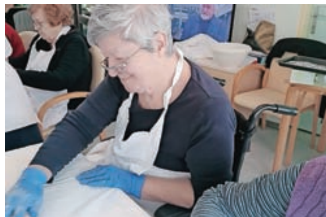
Čas v izolaciji si v DSO Kamnik krajšajo z najrazličnejšimi aktivnostmi.