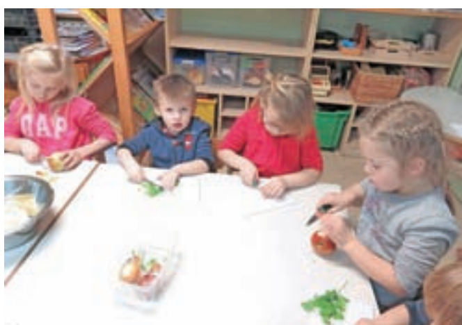
Priprava jabolčne juhe s polnozrnat gorčico