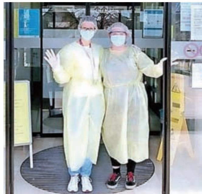
Študentje-prostovoljci so v dneh pred zaprtjem Zdravstvenega doma Kamnik takole na vhodu pričakali obiskovalce, jim zmerili temperaturo in jih posamezno spuščali v notranjost.