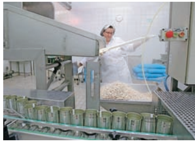
V času epidemije se je v Eti Kamnik povečala prodaja pripravljenih jedi. Zaposleni imajo sedaj tudi zaščitno opremo.