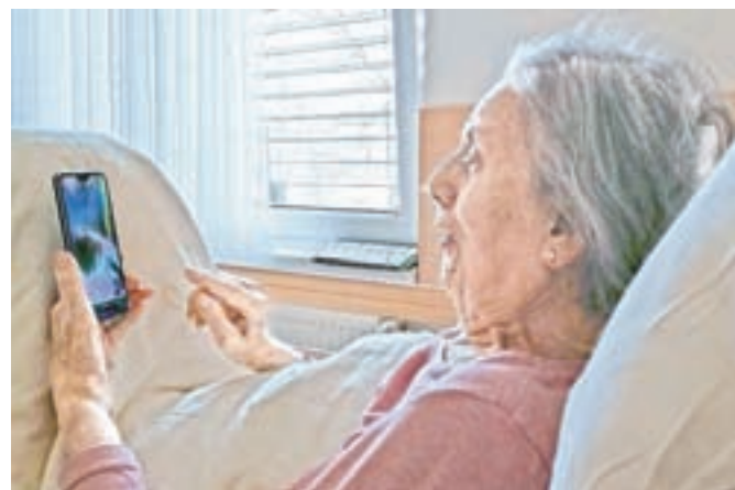
Stanovanke DSO Kamnik stik s svojci ohranjajo po telefonu in drugih napravah.