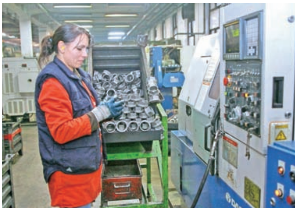
Tako kot v številnih drugih podjetjih, so tudi v Livarni Titan sprejeli različne ukrepe za preprečevanje širjenja koronavirusa. Livarna za zdaj deluje nemoteno.