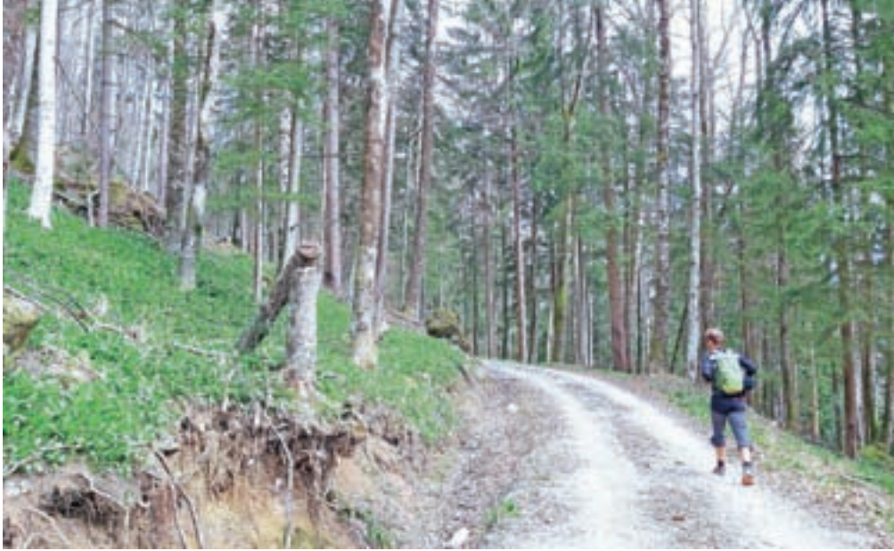
Možnosti za lažje sprehode je v kamniški občini več kot dovolj.

»Družbena omrežja so še vedno polna aktualnih fotografij iz gora, na katerih se turno smuča, gorsko kolesari, pleza ... Gorski reševalci smo v prejšnjih dneh pozvali javnost, naj se za čas izredne situacije odpove vsem dejavnostim v gorskem svetu, kamor sodi tudi plezanje v plezališčih, ker je s tem povezano tveganje za poškodbe, poleg tega pa so jasna navodila, da v primeru poškodbe v gorah in suma na okuženost s covidom-19 posadka helikopterja ne bo odobrila prevoza,