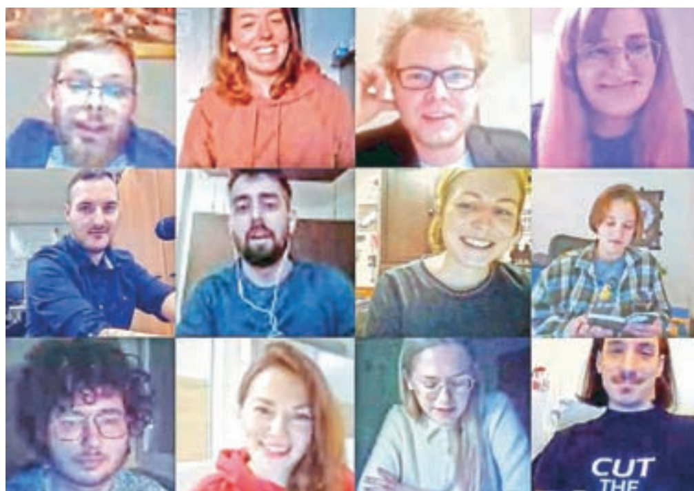
Ob svetovnem dnevu poezije so v Mladinskem centru Kotlovnica recital preselili na svetovni splet.