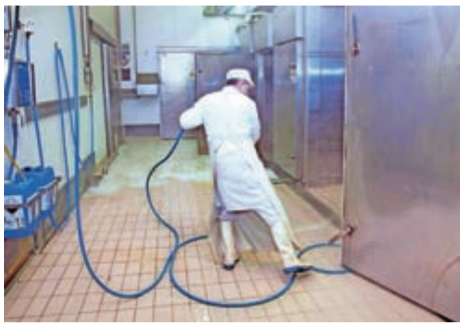
V Mesu Kamnik za zdaj dokaj normalno poslujejo, pravijo pa, da se položaj lahko že jutri popolnoma spremeni.

V podjetju Dom-Titan dnevna prilaganja usklajujejo s koriščenjem presežka ur, z delavci se dogovarjajo tudi o morebitnem koriščenju dopustov, v režijskih službah pa so, kjer je možno, uvedli delo od doma. Upad naročil že beležijo.