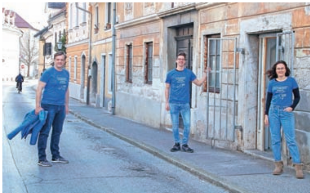
Kamniške prostovoljce boste prepoznali tudi po modrih majicah z napisom Za solidarnost, da odženemo korona nevarnost.

vino ali celo opravljati osnovnih domačih opravil. Tako vsak dan dostavimo kosilo starejši občanki, ki ga pripravijo v Domu starejših občanov, saj gospa okreva po operaciji. Moram poudariti, da Civilna zaščita Kamnik skrbi za varnost tako prostovoljcev kot seveda občanov. Vsi naši izpostavljeni prostovoljci so prejeli zašči-