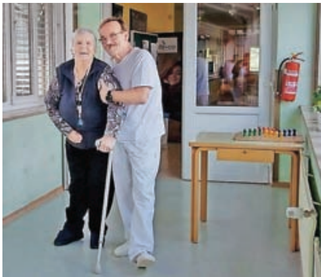
Zaposleni se v teh dneh še skrbneje posvečajo starostnikom.