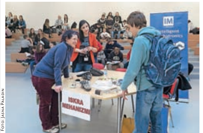
Podjetja na Karierni tržnici iščejo bodoče štipendiste in morebitne zaposlene, dijaki pa informacije o študiju.

Na Gimnaziji in srednji šoli Rudolfa Maistra Kamnik so že četrto leto zapored pripravili Karierno tržnico.