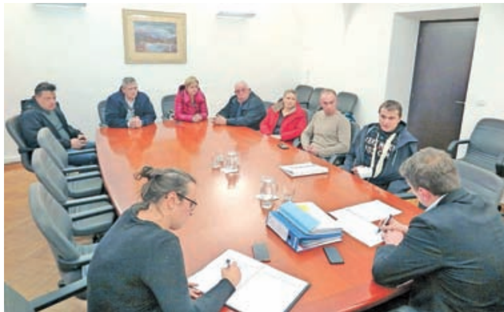
Člani Sveta Krajevne skupnosti Podgorje na sestanku z županom

»Pred časom smo bili s strani Občine Kamnik naprošeni, če jim pomagamo pri ureditvi podpisov glede izgradnje kolesarske ceste, ki naj bi potekala po podgorskem polju, kjer so večinski lastniki kmetije iz KS Podgorje. Občina bo tu uredila povezovalno kolesarsko stezo oz. cesto širine štiri metre, tako da naj bi imeli na podgorskem polju asfaltirano štirimetrsko kolesarsko stezo, skozi vas pa naj se vozimo po uničeni, že skoraj makadamski cesti. Za nas in za naše krajske Podgorce je to nedopustno. Vztrajamo, da se najprej