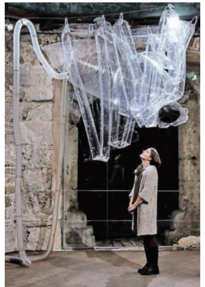
Ninina instalacija Ostani tako dolgo, kot želiš / FOTO: NADA ŽGANIK