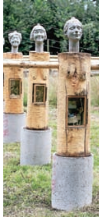
Poznavalcem umetnosti so v spominu ostale tudi Obsesije.

Za konec. Kamnik je od nekdaj veliko mesto. Veliko