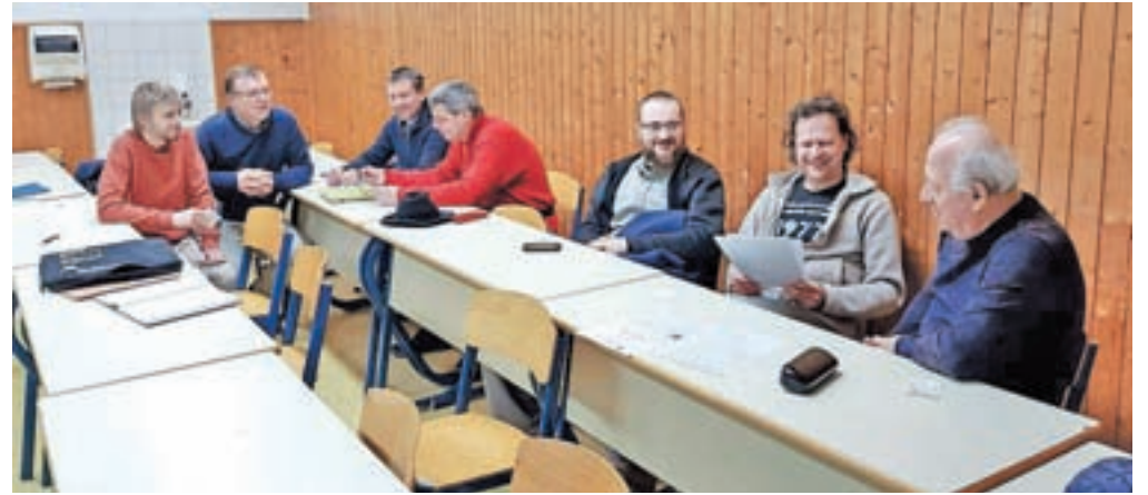
V bratskem razpoloženju in pomenku

Moč in pomoč, kako obvladati, kar se zgrne nanje, dvigniti glavo in iti naprej k