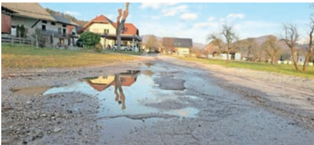
Cesta skozi Podgorje je dotrajana, a takšnih in tudi še slabših je v občini žal še precej.