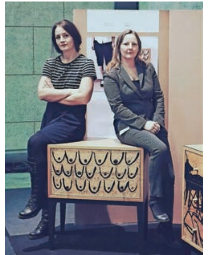
Skupaj z Manco Kemperl ustvarja tudi umetniško pohištvo, ki pobira nagrade širom po Evropi.