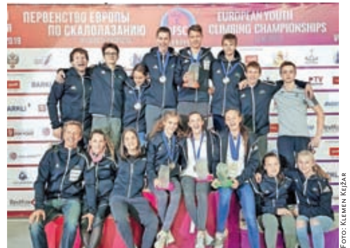
V slovenski mladinski reprezentanci v športnem plezanju so bili tudi trije člani Plezalnega kluba Kamnik.