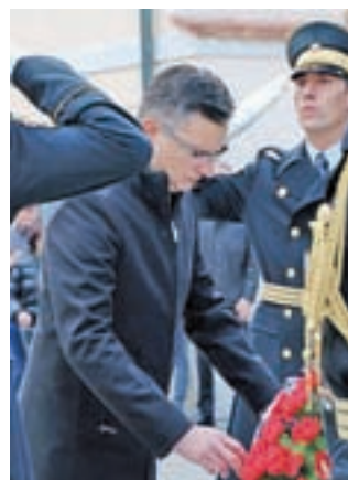
Venec je položil tudi predsednik vlade Marjan Šarec.