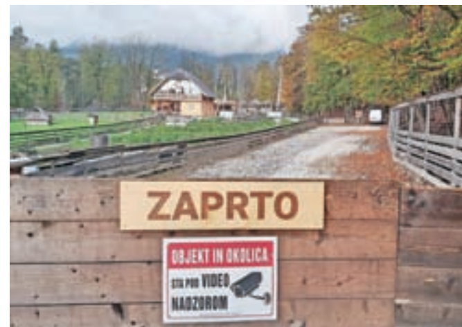
Slovenia Eco Resort, ki je zaradi sprememb občinskega prostorskega načrta zgrajen na črno, je zaprl svoja vrata, saj je ostal brez elektrike.

Kot so nam pojasnili, je bil postopek v zadevi kozolca že odločen, a je sledil upravni spor, pri katerem pa je bila tožba zavezanca kot neutemeljena zavrnjena. Slediti bi morala izvršba, a je inšpektorat ugodil prošnji zavezanca za odlog in tako izvršbo inšpekcijskih ukrepov odložil do uveljavitve prostorskega akta, vendar za največ pet let. Kaj pa preostali objekti? »V zadevi gradnje 19 hišic, lesene kapelice in zunanega bazena je bila v ponovljenem postopku izdana odločba za odstranitev objektov, zoper katero je bila vložena pritožba, ki ji je bilo delno ugodeno, vendar je bil v zvezi s tem sprožen tudi upravni spor, o katerem pa še ni odločeno. V zadevi gradnje devetih manjših lesenih objektov je bila izdana odločba