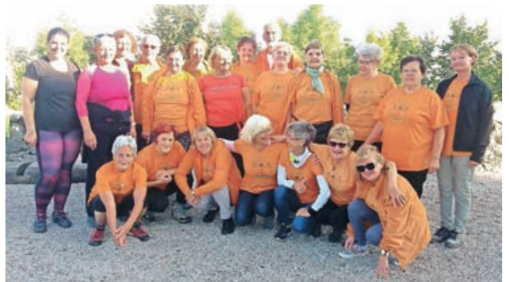
Udeleženci podgorske Šole zdravja na Starem gradu / FOTO: TONE VRTAČIČ

Dogovorili smo se, da se na cilju dobimo ob 8. uri, saj se je velika večina udeležencev odločila, da bo prišla na Stari grad peš, kar predstavlja slabe pol ure hoda iz doline. Tako smo se telovadci v oranžnih majicah iz različnih smeri vzpenjali proti cilju. In za ta vzpon s 380 metrov višine, kjer leži mesto Kamnik, do 577 metrov visokega hriba, smo bili bogato nagradjeni. Pod nami je bila bela odeja