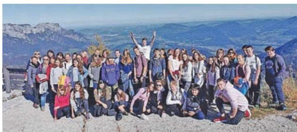
Skupinska slika udeležencev izleta

Na strokovni ekskurziji, ki je bila zanimiva in poučna, smo spoznali veliko novega.