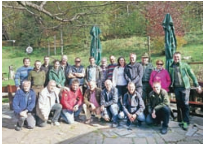
Udeleženci srečanja – posveta na Kraljevem hribu

like Plečnikove stvaritve – lovskega dvorca, Predaslja, Brsnikov in nekaterih drugih delov bistriškega gozda. Končalo se je pri Planinskem orlu z odlično malico. Poleg same predstavitve delovanja MKK so ves čas potekali tudi zelo zanimivi pogovori in izmenjava izkušenj ter mnenj glede vračanja in odškodnin, o denacionalizaciji, možnih odškokninah, problemih upravljanja gozdov in podobnem. Precej je bilo govora tudi o pripravi novega zakona o lovstvu, po katerem naj bi bilo enostavneje pridobiti pravico do svojega lovišča, ki ga sicer mogoče imeti tudi sedaj, a pod pogojem, da se upravlja več kot dva tisoč hektarov ustreznih površin.