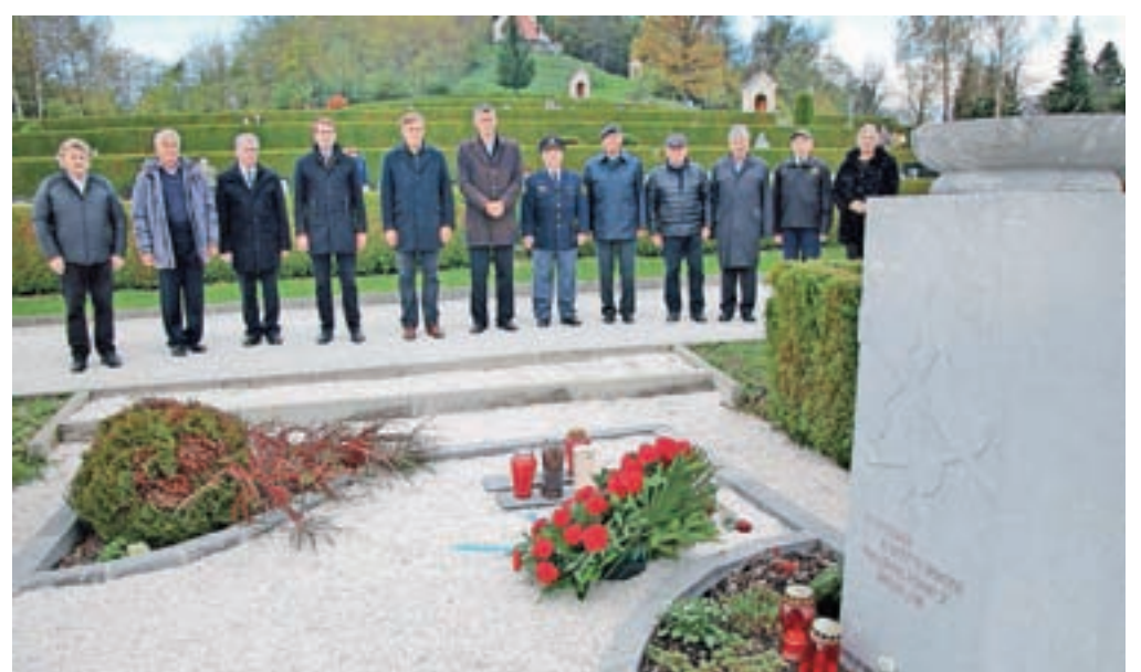
Poklon žrtvam vojn na kamniških Žalah