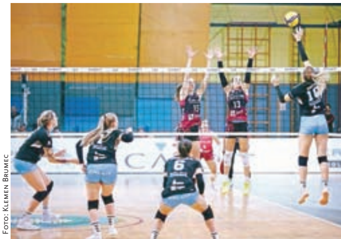
Tako ženska kot moška ekipa Odbojarskega kluba Calcit Volley sta napovedali boj za naslov državnih prvakov.