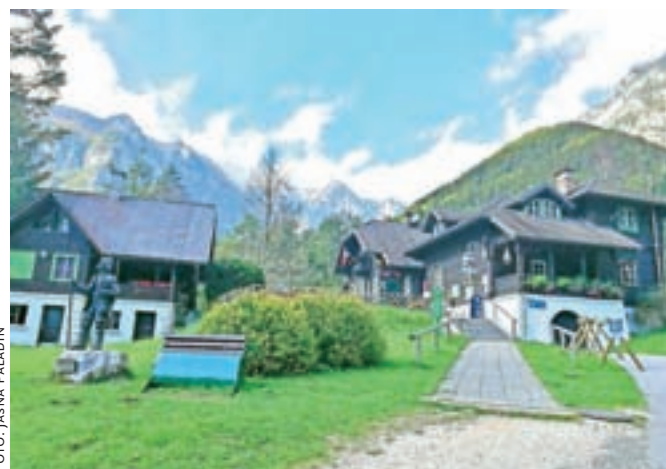
Planinski dom v Kamniški Bistrici je s pravnomočno odločbo prešel v last Meščanske korporacije Kamnik.

Mobilni telefon tako vse bolj postaja naprava, ki združuje vse, kar potrebujemo za sodoben življenjski stil. Za plačevanje in druge vsakodnevne opravke, za katere smo včasih morali obiskovati banko, lahko uporabimo kar mobilni telefon. Le izbrati moramo pravo aplikacijo – »za plačevanje s karticami na brezstičnih plačilnih mestih in za dvig gotovine na brezstičnih NLB Bankomatih uporabimo mobilno denarnico NLB Pay. Če želimo preprosto plačati položnice (s funkcijo »Slikaj in plačaj«) ali plačati prijateljem (s funkcijo »In-plačila«), pa uporabimo mobilno banko Klikin,« še zaključijo sogovornica.