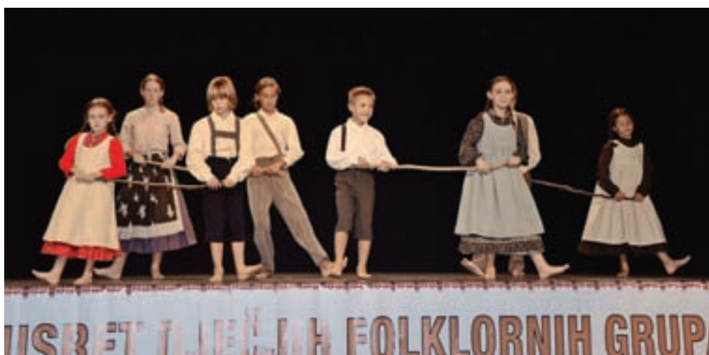
Mlajša folklorna skupina Verine zvezdice

(otroška skupina Tičeki) iz Poljanice Bistranske. Otroška folklorna skupina Verine zvezdice se je predstavila z dvema odrskima postavitvama, in sicer mlajša skupina s plesno točko Ovečke so nam ušle, kjer gre za splet pastirskih plesov, starejša pa je zaplesala splet plesov Igre na mestnem trgu.