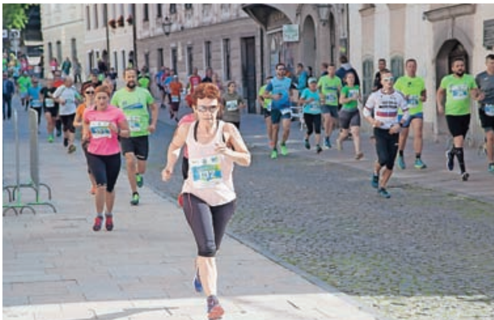
Več kot dvesto tekačev in tekačic se je udeležilo Veronikinega teka.