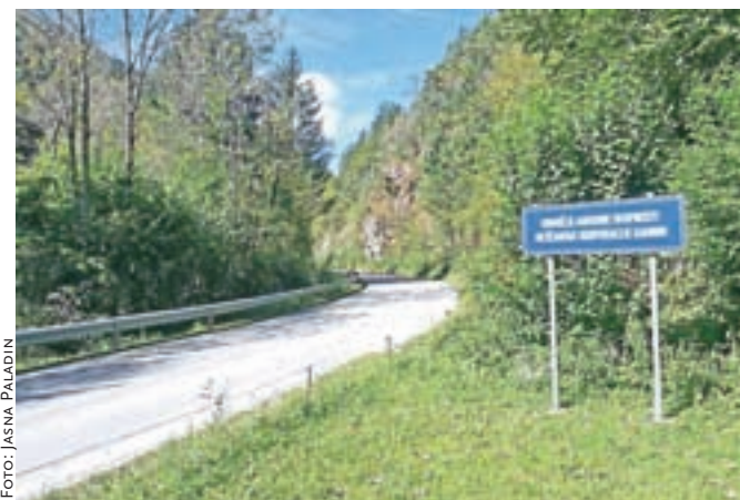
Tablo ob cesti v Kamniško Bistrico bodo najverjetneje odstranili oz. premaknili, da bo v skladu s pravilniki.

Pa so za postavitev tabel pridobili kakšno soglasje? Zatrjujejo, da ga ne potrebujejo, saj so table postavili na svojem zemljišču oz. pet metrov od ceste, kot določajo pravilniki. To trditev smo preverili na Direkciji za infrastrukturo RS. Kot so nam pojasnili, vse predloge za po-