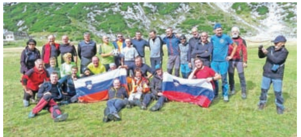
Skupinska slika »nogometašev«, ki so tudi letos na Korošici odigrali tekmo na najvišji ravni.

Kamniška Bistrica – Ideja za njo se je porodila na odpravi Everest 79 kot parodija na »visoko raven« takrat še jugoslovanskega nogometa. Predvidena je bila tudi kot nekakšen zaključek kopne alpinistične sezone. Najprej malo plezanja, nato pa nekaj druženja kamniških in celjskih alpinistov in zabave ob »nogometu«. Sprva so jo igrali predvsem alpinisti iz kranjske in štajerske dežele. Če so zmagali Štajerci, je bila nato »fešta«, če pa Kranjci, pa nič ... Zaradi slabega vremena je kakšno leto tudi ni bilo. Da ji rečemo še vedno tekma med Kranjci in Štajerci, je bolj posledica začetnih iger, a se je to ohranilo vse do danes, čeprav se na Štajerskem živeti Štajerci (planinci, alpinisti) te prireditve bolj malo udeležujejo in jih v glavnem zastopajo Štajerci, ki so se bolj ali manj izselili s Štajerskega na Kranjsko ali pa njihovi potomci ... Tekme v jubilejnem letu se je udeležilo kar lepo število tako igralcev kot tudi gledal-