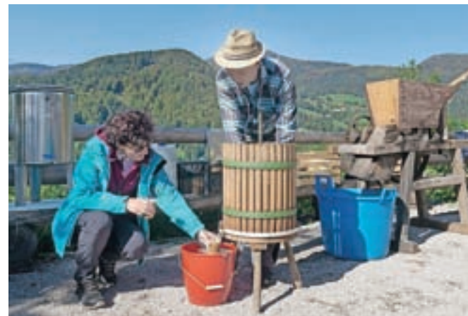
Sveže stisnjen jabolčni mošt se je izkazal za odlično osvežitev.

prireditev je namenjena v prvi vrsti vsem, ki so včasih živeli na kmetiji, da se ponovno spomnijo, kaj so nek-