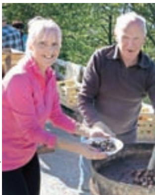
Obiskovalcem je teknil tudi pečen kostanj.

letih prireditev med domačini že dobro 'prijela', navdušeno pa jo vedno sprejemajo tudi gostje, ki dopustujejo v bližnjih Termah Snovik. Ne nazadnje vsa prikazana stara kmečka opravila – veliko se jih na kmetih opravlja še dandanes – niso zanimiva le za otroke, temveč tudi za odrasle. Obiskovalci so lahko pri opravilih tudi pomagali, nekateri pa so se celo spomnili, da so to nekdaj tudi sami znali in delali. Vsem, ki so se sprehodili do cerkve