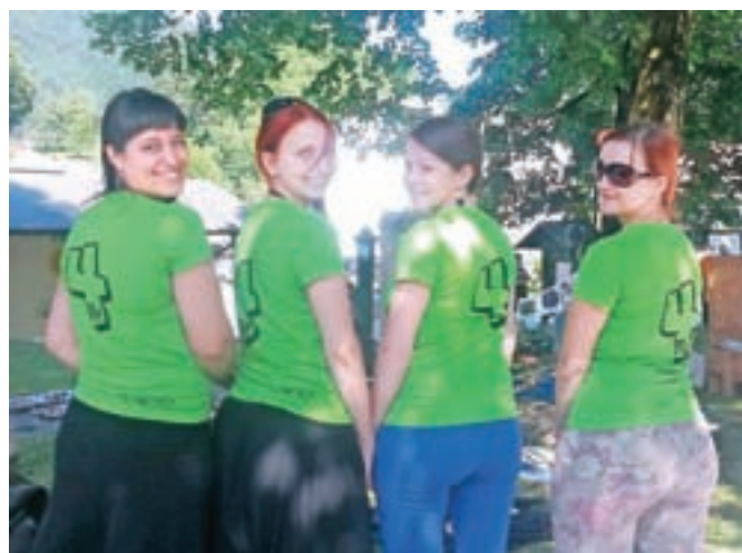
Članice motniške skupine Me4

sta, bodo v Motniku pripravile slikarsko kolonijo in slikarsko delavnico v okviru prireditve Slovo poletju, delavnico za otroke bodo pripravile tudi ob noči čarovnic, decembra pa še igrico za otroke.