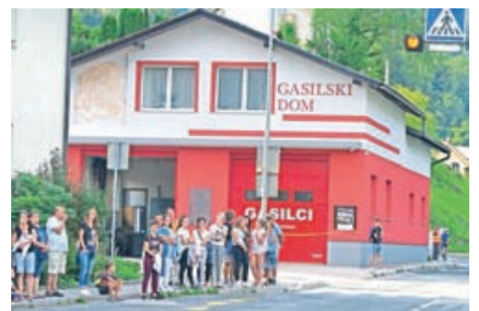
Gasilski dom PGD Kamniška Bistrica v Zgornjih Stranjah je ob jubileju dobil novo fasado.