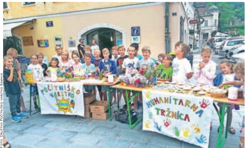
Humanitarna stojnica Društva Počitniško varstvo Kamnik na Glavnem trgu