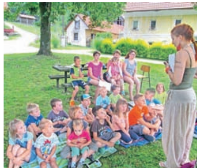
Delavnic se navadno udeleži okoli petindvajset otrok iz Motnika in okolice.

Vse delavnice izvedejo prostovoljno, brezplačno, starši prispevajo le za material, jim pa ob strani stoji Turistično društvo Motnik. »Vsi smo povezani, vsi se poznamo in tako tudi znamo stopiti skupaj in poskrbeti za to, da se imamo lepo. Trudimo se, da najmlajši čim več časa kakovostno preži-