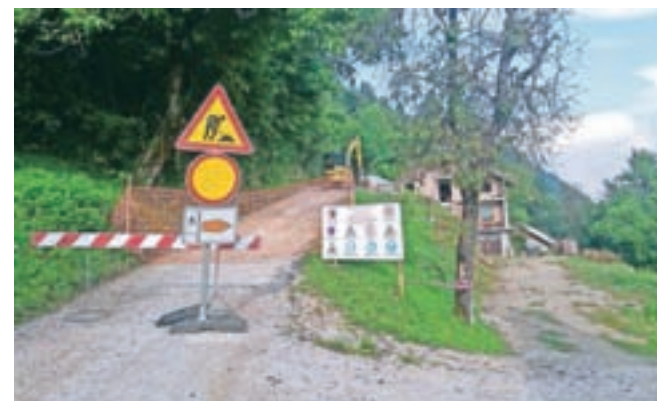
Popolno zaporo ceste zaradi sanacije usada morajo upoštevati tudi pohodniki na Sveti Primož, ki so preusmerjeni na kratko nadomestno pot.

Zaradi sanacije usada na cesti pa dela te dni potekajo tudi na cesti pod Svetim Primožem pri hišni številki Črna 24, zaradi česar je cesta do 6. septembra za vozila zaprta, urejen pa je obhod za pohodnike, ki so s tablammi preusmerjeni na nadomestno pot.