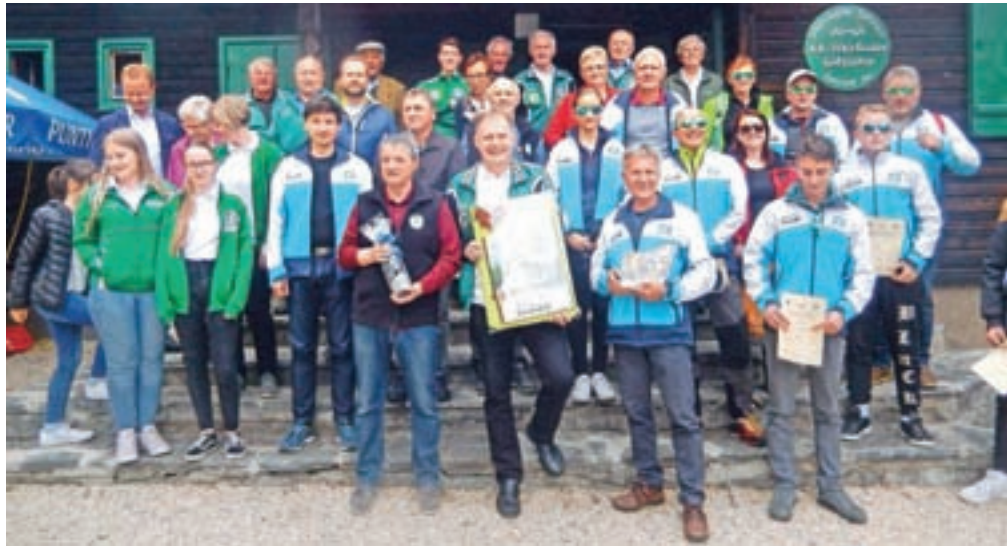
Druženje strelcev iz Kamnika in pobratene Trofaiacha

Kamnik – Srečanje preciznih iz obeh občin, ki ju družijo zgodovina pridelave smodnika, postaja tradicionalno. Tokratno je tretje leto zapored. Na hladen poletni dan smo se Kamničani v zgodnjih urah odpravili na prijateljsko tekmovanje. Po jutranji kavi in sprehodu skozi urejeno mestno jedro smo se na strelišču, urejenem z elektronskimi tarčami, pomerili v streljanju z zračno puško ter zračno pištolo v treh starostnih skupinah: mladinci, člani in seniorji. Strelci v občini Trofaiach so bolj vešč streljanja z večjimi kalibri, tako da so rezultatsko prevladovali gosti iz Kamnika. So pa številni avstrijski strelci dokazali, da so natančni predvsem, ko gre za streljanje s pištolo. Toda kot je na popoldanskem pikniku na strelišču za orožje malega kalibra, ki je umeščeno v avstrijsko podeželsko idilo, poudaril predsednik tamkajšnjega strelskega društva