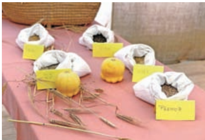
Bi znali prepoznati različne vrste žit?