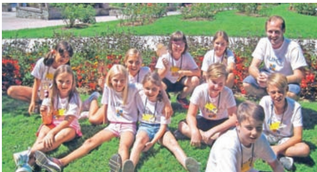
Otroci so angleški jezik utrjevali tudi v Arboretumu.

Otroci so ves teden v vsakdanjih situacijah utrjevali znanje angleščine na sproščen in naraven način, kar je bila tudi dobrodošla priprava na prihajajoče šolsko leto. Jezikovna šola Dude se vsem udeležencem iskreno zahvaljuje za dobro voljo in odlično preživet teden.