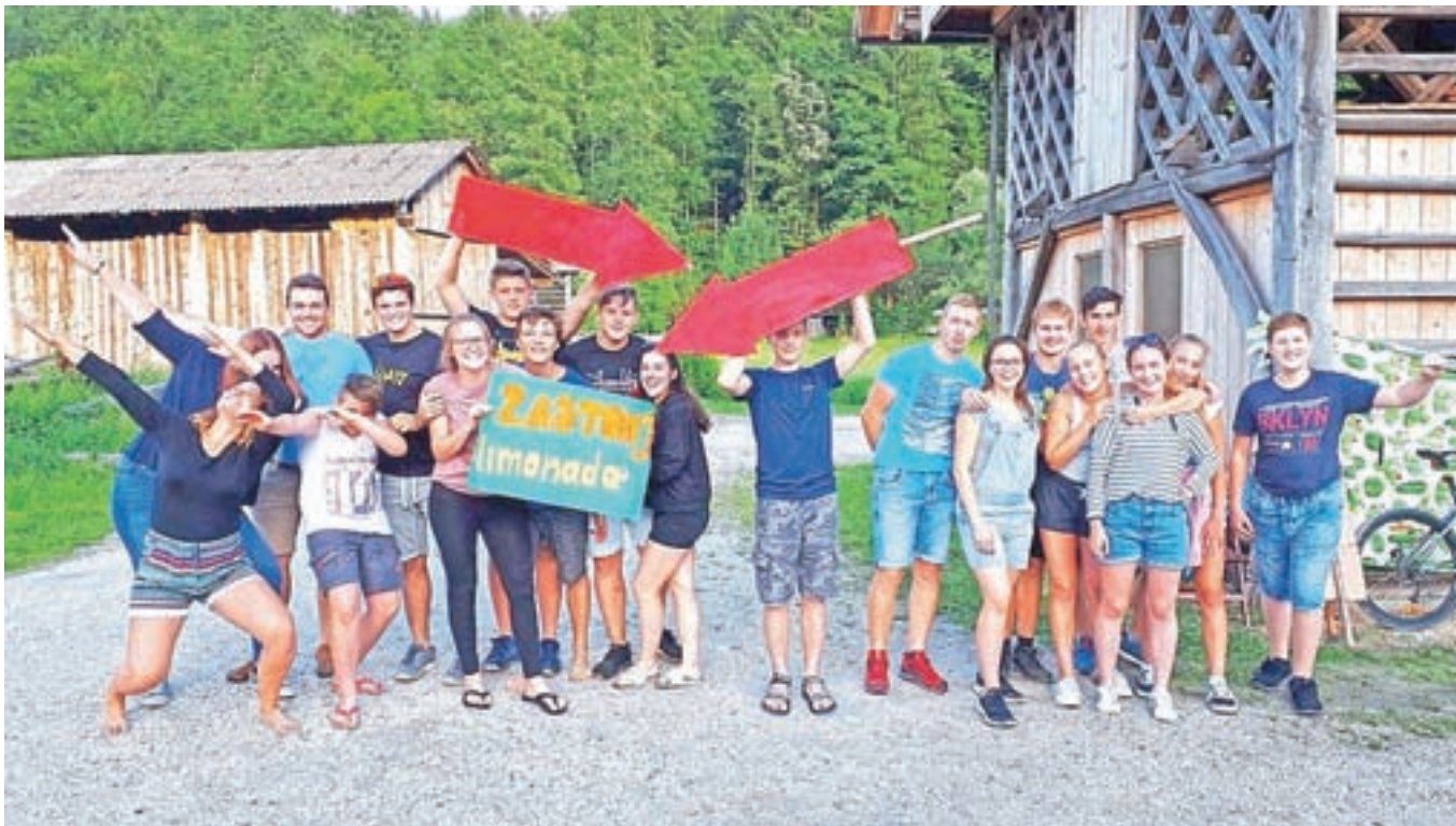
Mladi v Šmartnem v Tuhinju so s plakati, puščicami in smerokazi tudi letos vabili mimovozeče, da se ustavijo na palačinkah in limonadi.

precej uspešna, saj je bil ob koncu dneva izkupiček akcije 525 evrov, kar skupaj nanesse 1125 evrov, ki jih bodo animatorji osebno predali družini malega Rožleta, saj so v stiku z njegovo mamo. Glede na večinsko pozitivne odzive tistih, ki so se ustavljali ob cesti ali vozili mimo, bodo tovrstne akcije nemara nadaljevali tudi v prihodnje. V bližnji in daljni okolici je namreč vse preveč ljudi, ki potrebujejo našo pomoč, mladi pa so dokaz, da ima vsak moč vsaj nekaj spremeniti na bolje.