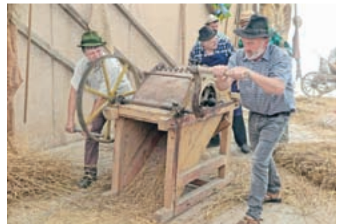
Domačini so predstavili tudi delo z mlatilnico.