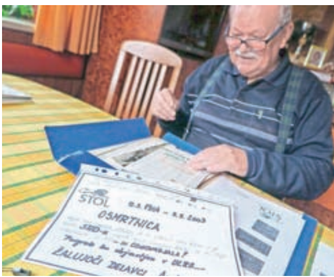
Tine Breznik z osmrtnico, ki so jo zaposleni napisali ob stečaju Stola oz. zadnje družbe Ambienti.

na Korenovo cesto,« nam pove in s ponosom doda, da je bil dvajset let tudi nepoklicni predsednik sindikata Stolovih delavcev (vse do leta 2003), kar ni bil mačji kašel, saj je tovarna v zlatih časih zaposlovala okoli 1600 delavcev. Prizna, da je bil večkrat na razpotju, ali držati z vodstvom ali z delavci, a očitno mu je to dobro uspevalo, saj je veljal in še vedno velja za zelo priljubljenega. Spomni se, kako so vsako leto 8. marca delavkam razdelili rdeče nageljne. In kako so 1. maja generalno čistili delavnice. Vse stroje so razstavili, temeljito očistili in namazali, nato pa vanje zataknilo bukovo vejico, saj so do strojev čutili veliko spoštovanje. Delavke, ki so bile zaposlene v obratih z lepili, so zaradi vdihavanja hlapov vsako pomlad in jesen za teden dni z družinami poslali na brezplačen dopust v tovarniške namestitve, ki so jih imeli v Podčetrtku, Piranu, na Krku, v Novigradu ... Spomni se tudi velikega obrata družbene prehrane, kjer so dnevno za zaposlene in številne druge Kamničane skuhali po 3200 obrokov. Eden od glavnih dogodkov zaposlenih, za katerega je v času