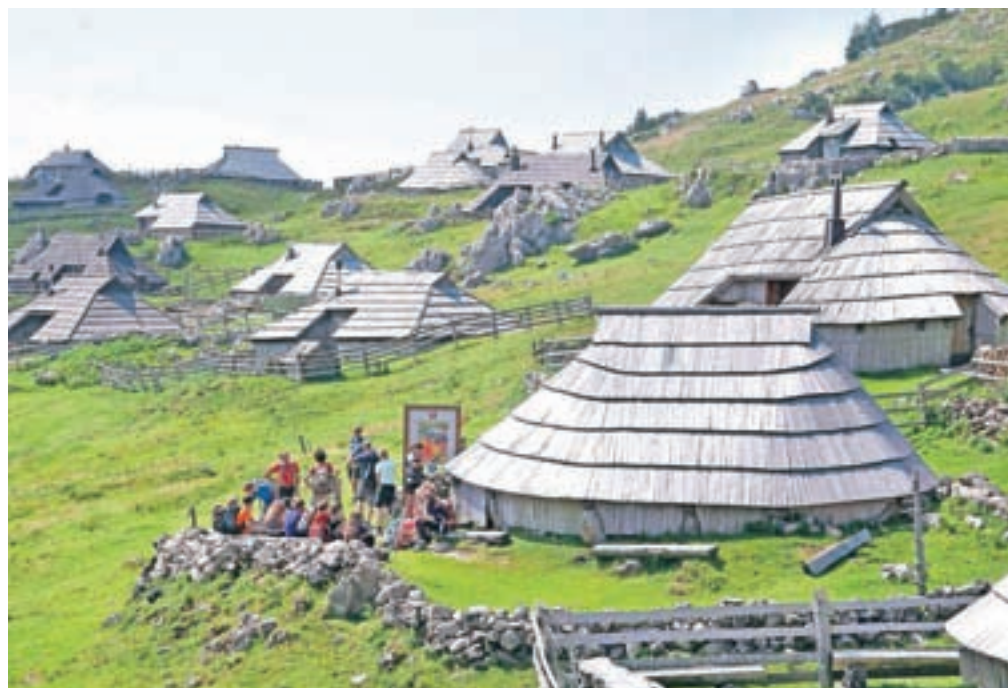
Število obiskovalcev Velike planine je vsako leto večje.

Glede na to, da družba Velika planina, ki je v stoodstotni lasti občine, vrsto let ni delovala pozitivno brez konkretnih finančnih injekcij iz občinskega proračuna, so podatki seveda razveseljivi, mnogo manj pa težave, ki jih povečan obisk planine predstavlja za okolje. Analize vode v izvirov pod planino so pokazale na onesnaže-