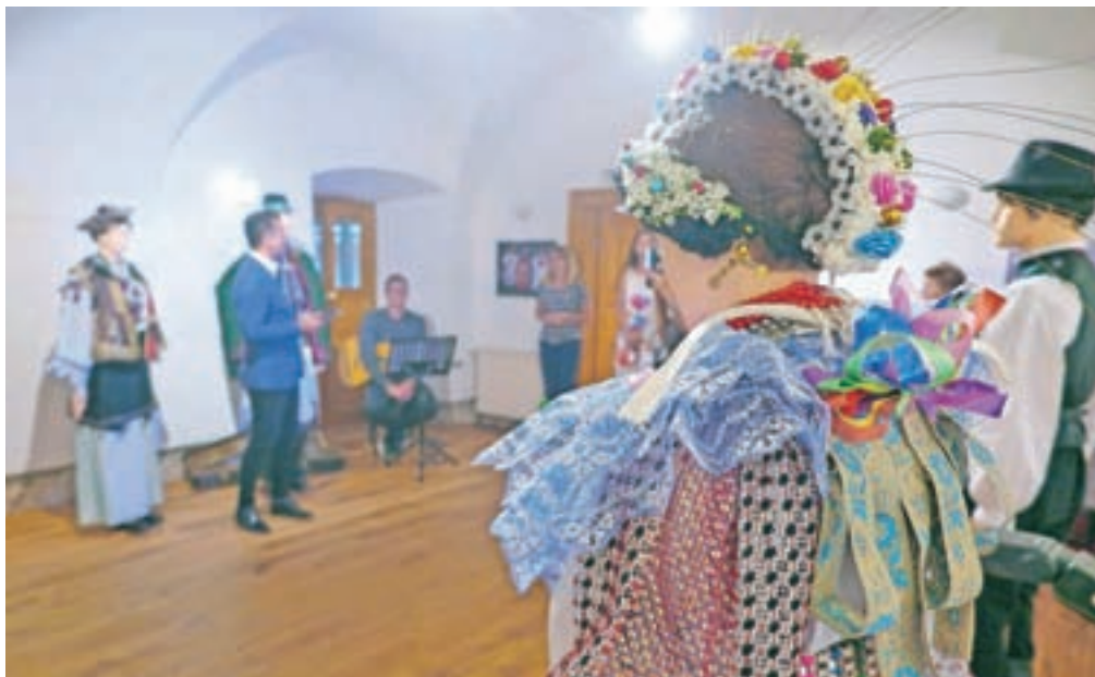
V Samostanu Mekinje je na ogled nekaj čudovitih primerkov oblačilne dediščine slovenske in hrvaške manjšine v sosednih državah.

»Na to spremembo še posebej opozarjamo tiste obiskovalce, predvsem iz Tunjic, Mekinj, Stranj in podobno, ki so si povorko običajno ogledali na Medvedovi ulici. Vabimo jih, da se tokrat po-