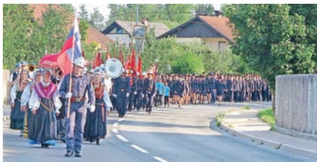
V slavnostni paradi so gasilce pospremili tudi člani Mestne godbe Kamnik, praporščaki in člani Folklorne skupine Kamnik v narodnih nošah.

devate, da dobro sodelujete tudi s sosednjimi prostovoljnimi društvi, med vsemi drugimi prostovoljnimi gasilskimi društvi naše lokalne skupnosti pa imate visok operativni ugled,« je med drugim dejal župan. Ob jubileju so podelili priznanja in odlikovanja članom društva za zasluge in delo na področju preventivne, operativne, vzgoje in usposabljanja ter druge organizacijske dejavnosti v prostovoljni gasilski organizaciji. Po blagoslovu vozila, ki ga je opravil stranski župnik Anton Prijatelj, pa je sledila še gasilska veselica.