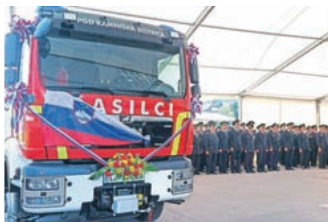
Novo vozilo gasilcev PGD Kamniška Bistrica je posebej prilagojeno za gašenje požarov v naravi.