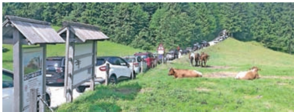
Prometni kaos na Kranjskem Raku na praznični dan, 15. avgusta

ročnega razvoja Velike planine in hkrati tudi proces usklajevanja glede prometnega režima. Prometna neurejenost je namreč izjemno problematična, zato zahteva vzporedne ukrepe ob pripravi strategije. Pripravljene so strokovne podlage in predlogi rešitev, ki jih je pripravilo podjetje ZaVita. Na osnovi letnih smo že odkupili zemljišče pri kamnolomu na Rakovih ravneh, kjer je predvideno največje parkirišče (projekt za ureditev parkirišča je v zaključni fazi), izdelan pa je tudi že projekt za asfaltiranje ceste Kranjski Rak-Rakove ravni.«