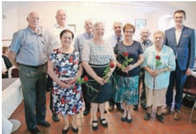
... sta priznanja podelila sedemnajstim diamantnim, bisernim in zlatim parom.