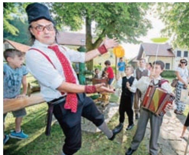
Na svoj račun so prišli tudi najmlajši.