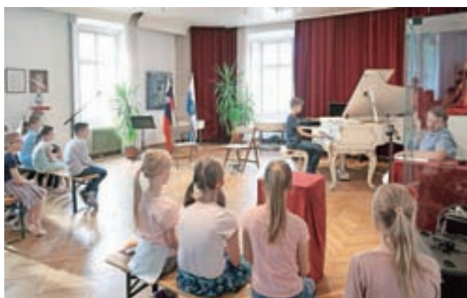
Koncert učencev Glasbene šole Skalar

vsak dan pol ure berite: knjige, stripe, časopisne članke, revije, recepte. Septembra boste povabljeni na zaključno prireditev, kjer boste dobili priznanje in majico ter sodelovali v nagradnem žrebanju – glavna nagrada je skiro,« pozivajo v knjižnici. Zgibanko najdete v knjižnici, seznam bralnih dni s svojimi podatki pa lahko oddate do 10. septembra.