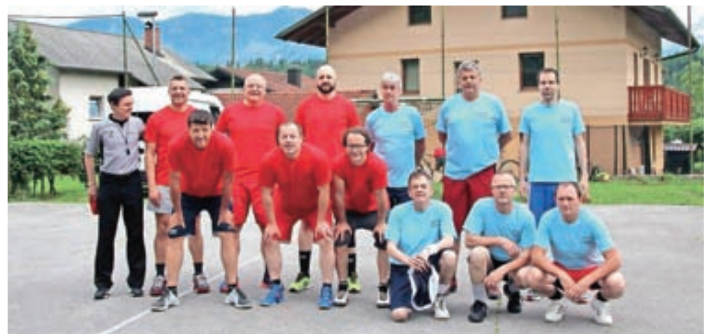
Košarkarji obeh ekip po koncu tekme