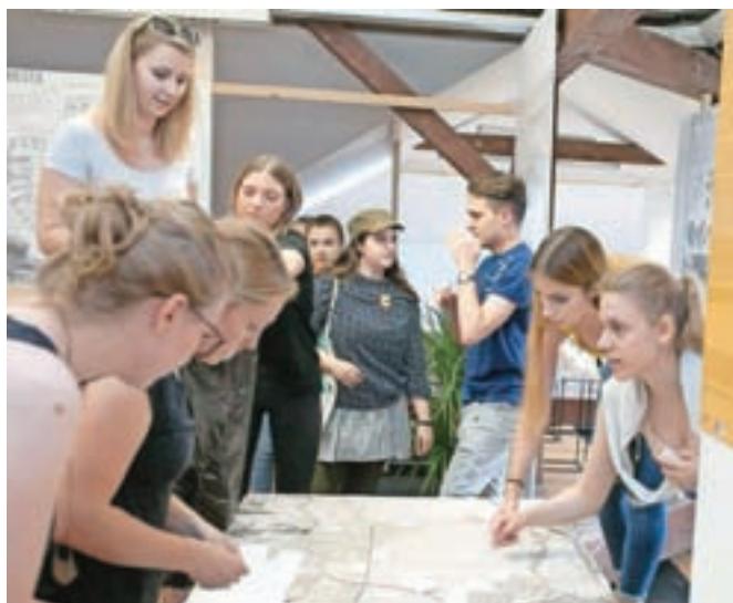
Študenti so pripravili svojo vizijo razvoja somestja Kamnika, Mengša, Domžal in Trzina.

helčič, so se na fakulteti prvič resno lotili celostne obravnave tega velikega območja, pri tem pa študentom pustili precej proste roke. "Realen projekt nastaja v biroju, med študijem pa se nam zdi pomembnejše, da študenti odkrivajo nove svote, da gredo izven ustaljenih okvirjev in na ta način zberejo dobre ideje, kijih vrnejo v prostor," je dejal Mihelčič in kot enega od glavnih ciljev projekta izpostavil spodbujanje k razpravi in sodelovanju med občinami. "Med občinami vsekakor prihaja do povezovanja, kar je razvidno tudi iz nekaterih dobrih skupnih projektov, vsekakor pa sodelovanja ni nikdar preveč, še zlasti, ker je to področje tesno povezano in odločitve, sprejete na enem delu, lahko vplivajo na celotno področje," je še poudaril sogovornik, ki upa, da bodo s projektom spodbudili razpravo o urejanju prostora in iskanju celostnih rešitev za to področje. Priložnost za to bo že jeseni, ko bo razstava na ogled v vseh štirih občinah, tudi v Kamniku.