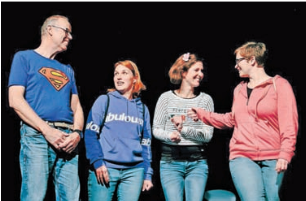
Kok ti men zdej dol visiš ali ko učitelji postanejo najstniki