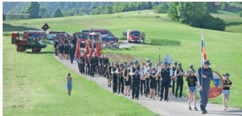
Uvod v praznovanje je bila gasilska parada.