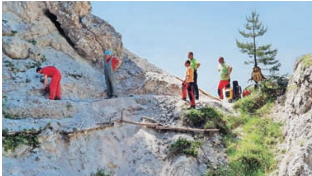
Zahtevna prenova odseka poti na Osredek je končana.