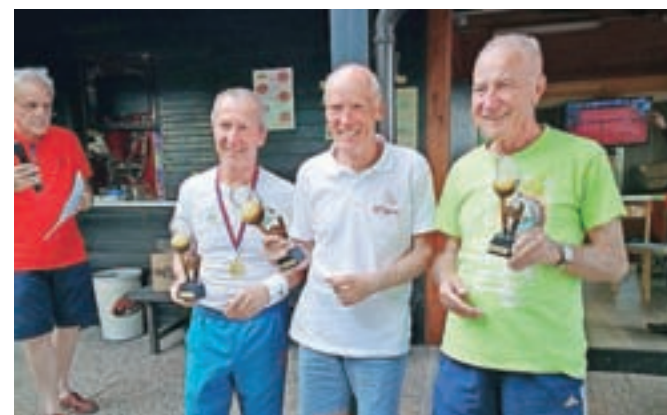
Podelitev pokalov moškim ekipam