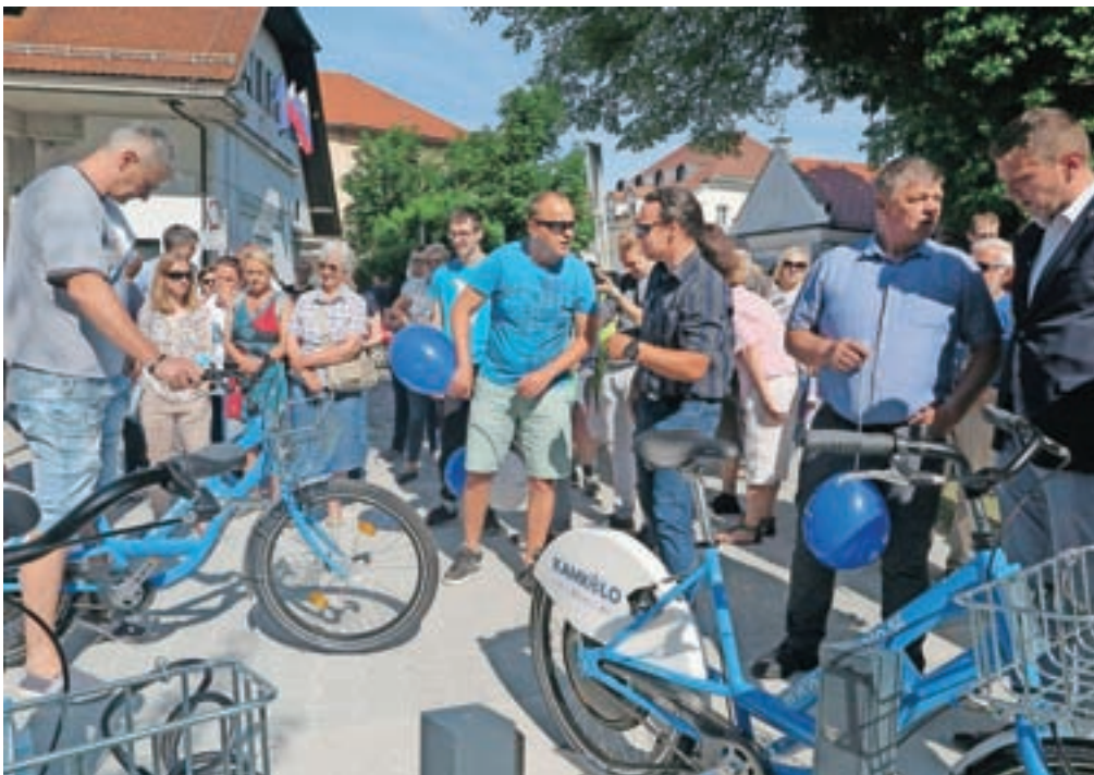
Predstavitve sistema Kamkolo je med občani naletela na precej zanimanja.