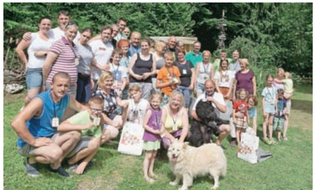
Prireditve se je letos udeležilo osemtrideset pohodnikov.