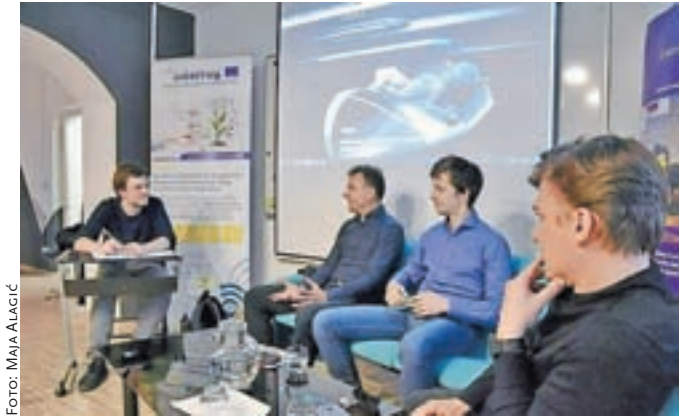
Pogovor z gosti v KIKŠarterju o električni mobilnosti