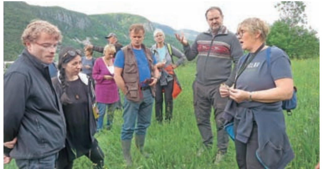
Pomen ohranjanja biodiverzitet je v Bohinju spoznavalo šest Kamničanov.