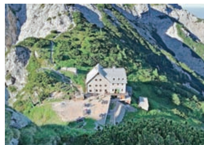
Koči na Kokrskem in Kamniškem sedlu sta odprti od 8. junija; na fotografiji Cojzova koča.

Poletna planinska sezona se je začela, a gorski reševalci opozarjajo, da so razmere v visokogorju lahko še povsem zimske. Koči na Kamniškem in Kokrskem sedlu sta odprti, obnovljenih pa je tudi nekaj novih odsekov planinskih poti.