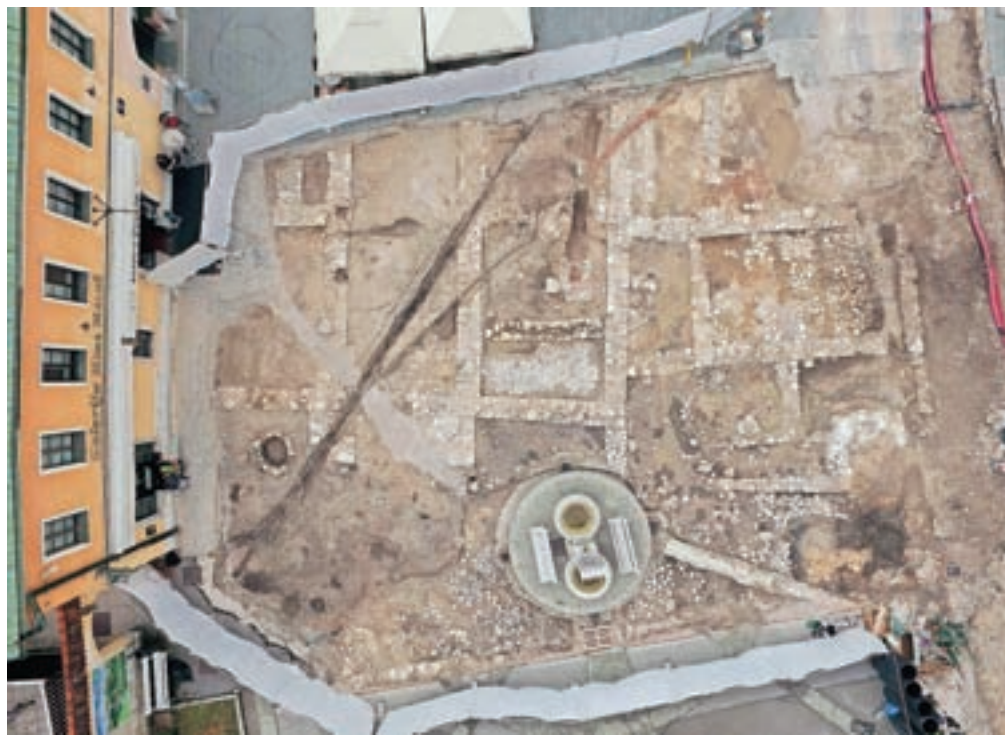
Temelji mestne hiše, odkriti na Glavnem trgu

A arheologi so kopali še globlje in pod ostanki teh omenjenih kamnitih stavb odkrili ostanke še mnogo starejših – še lesenih objektov, kar je po besedah Grudna tisto, kar jih je najbolj navdušilo. Ti leseni objekti segajo v 13. in 14. stoletje, torej v čas prvih