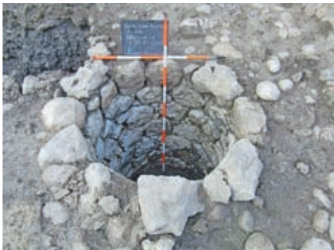
Vodni zbiralnik na današnjem Glavnem trgu

Poleg temeljev so našli tudi več predmetov. Med njimi