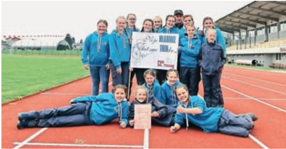
Ekipa mladink iz PGD Zgornji Tuhinj