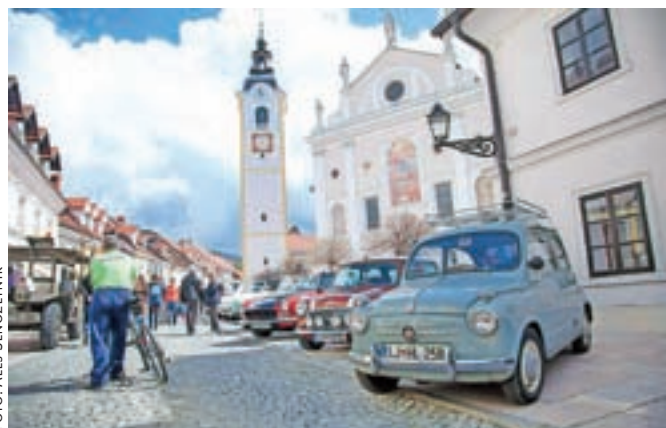
Večina avtomobilov je bila starih med 45 in šestdeset let.

osemdeset let, ki ga je slednji restavriral sam. Kamničani so si v precejšnjem številu ogledali zloščene jeklene konjičke, kakršnih človek danes ne vidi več na vsakem koraku.