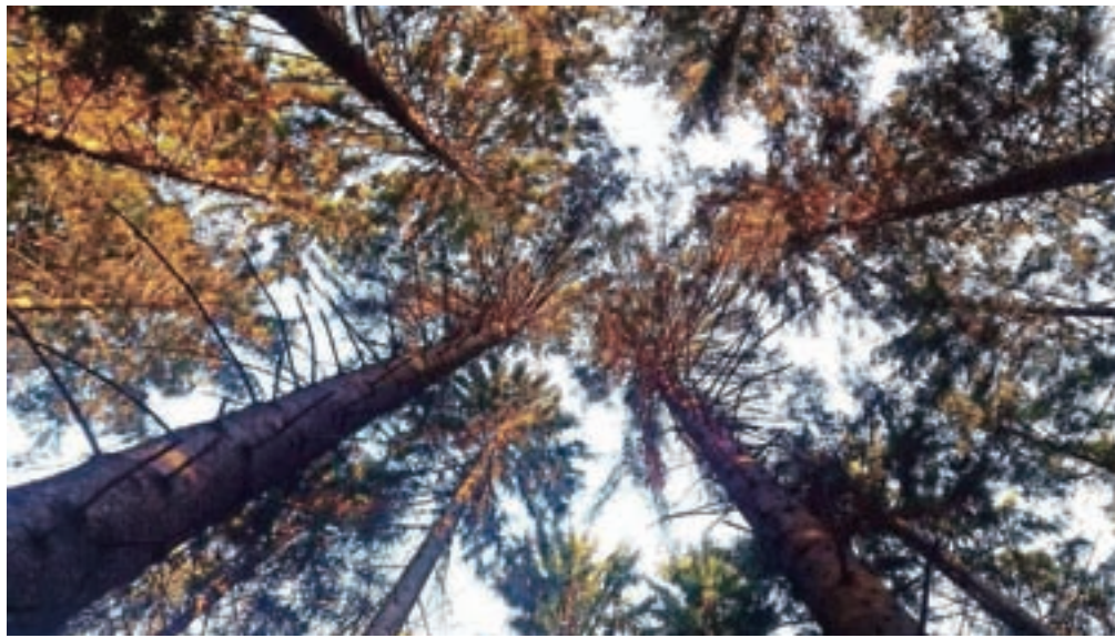
Preteklo leto je bilo za kamniške gozdove dokaj mirno, ugotavljajo gozdarji.

Kamnik – Letošnji mednarodni dan gozdov je potekal pod sloganom Učimo se z gozdom – gozd je modrost in gozdarji Krajevne enote Kamnik se zelo dobro zavedajo, kako zelo pomembno je slediti kazalnikom, ki opredeljujejo stanje gozdov, in primerjati podatke skozi leta. Iz njihove gozdne kronike je razvidno, da je bilo preteklo leto za kamniške gozdove dokaj mirno in nestresno, vendar je iz okoljskih pojavov in analize zdravstvenih nevarnosti gozdov slutiti, da prihajajo tudi za gozdove v naši bližini drugačni časi ne glede na občutek njihove večnosti. Kot ugotavljajo v svoji gozdni kroniki, si bomo leto 2018 zapomnili po toplem vremenu. To je bilo v večjem delu Slovenije namreč drugo najtoplejše doslej, takoj za letom 2014. Vremenske razmere so bile skupaj s prizadevnostjo lastnikov gozdov ugodne v korist zdravstvenega stanja smrekovih dreves in zelo neugodne za razvoj prekomerne populacije podlubnikov. Evidentirana je bila slaba četrtnina napadenih dreves v primerjavi s preteklim letom v vseh treh gozdnogospodarskih enotah (Kamnik, Kamniška Bistrica in Tuhinj-Motnik). V primerjavi s predlani se je povečalo sušenje velike-