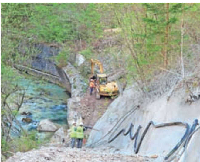
Sanacija podpornega zidu pod cesto v Kamniško Bistrico je v polnem teku.

Kot so nam pojasnili na Direkciji RS za infrastrukturo, je bila pogodba z izbranim izvajalcem v vrednosti 311.681,05 evra podpisana že 5. septembra lani, a z deli je bilo treba počakati. »Glede na omejitve, ki izhajajo iz