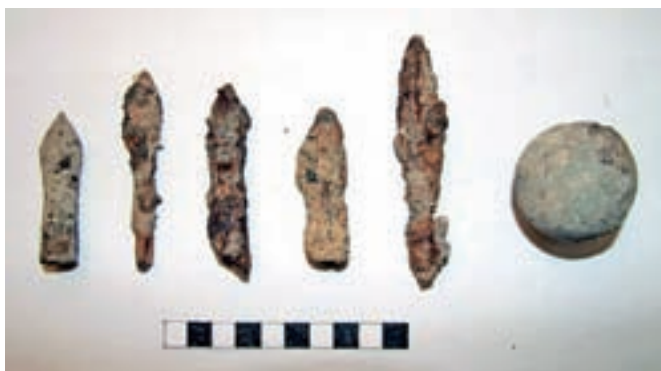
Puščične konice za samostrel in svinčena krogla za malokalibrski top

dvanajst novcev, pri čemer jih večina sega v obdobje Marije Terezije in Franca Jožefa, našli pa so tudi dva mnogo starejša še iz rimskih časov. Kot je povedal Gregor Gruden, so jih izkopali v peščeni plasti, ki je bila namenjena nasutju tal v hiši in so jo izkopali v reki Kamniški Bistrici. Našli so tudi nekaj orožja (tri kamnite krogle iz katapulta,