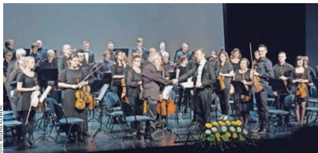
Člani Simfoničnega orkestra Domžale - Kamnik na svojem pomladanskem letnem koncertu