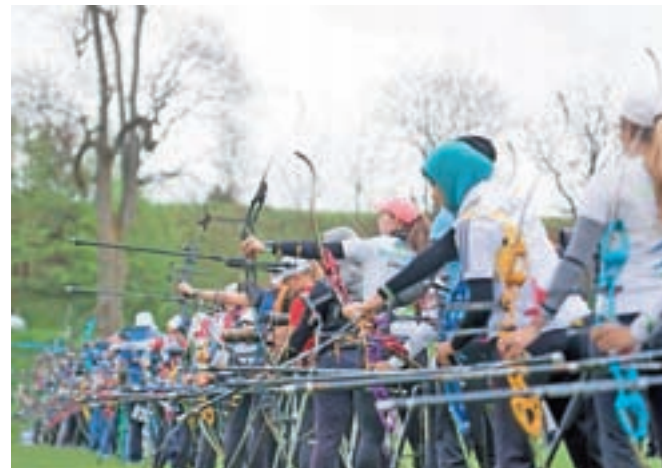
Na tekmi za Veronikin pokal je tekmovalo več kot dvesto lokostrelcev iz dvajsetih držav.

Raznoliko vreme, ki pa ni bilo tako moteče, je prikazalo Kamnik v vseh svojih barvah. Tujci so bili nad kuliso naših planin in nad mestom in okolico samega Kamnika