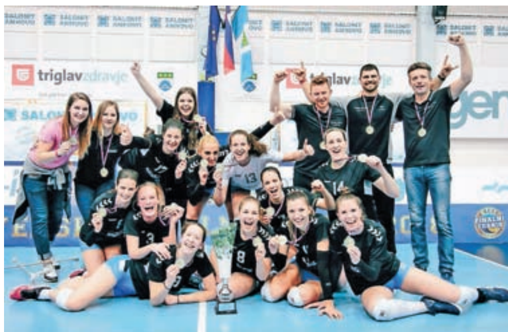
Odbojkarice prve ekipe Calcita Volleyja so v vitrine kamniškega kluba po treh sezonah spet prinesle novo lovoriko.