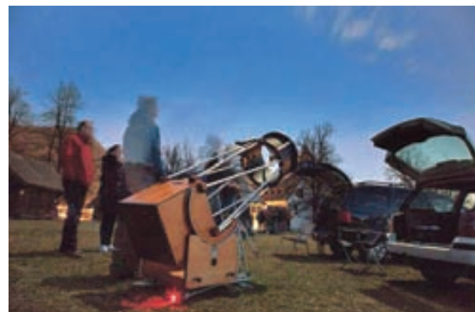
Nočno nebo vedno ponuja številne zanimivosti.