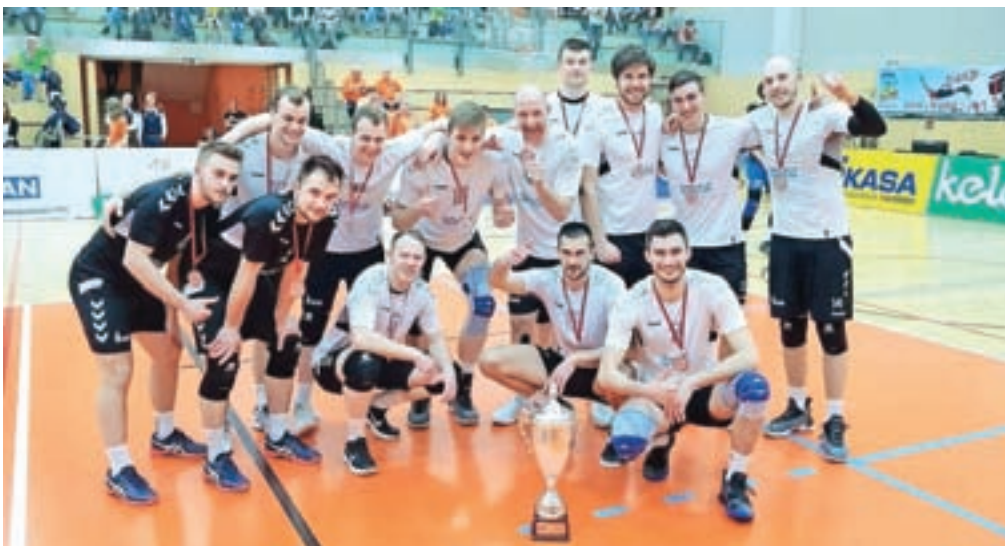
Na svojem četrtem zaključnem turnirju srednjeevropske lige so kamniški odbojkarji še tretjič osvojili tretje mesto.