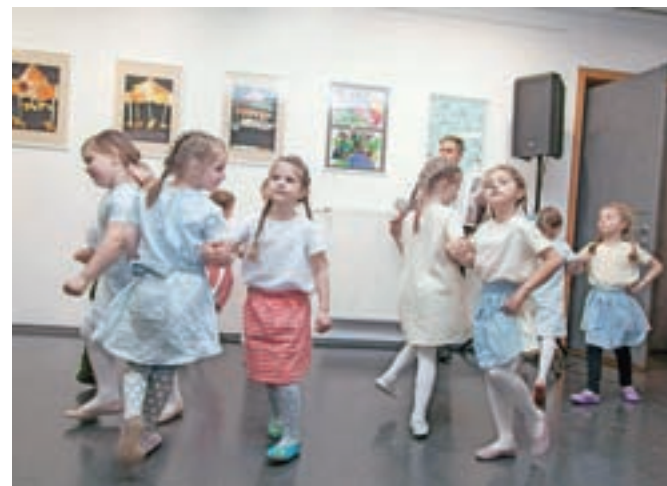
Simpatičen nastop nadobudnih folkloristov

Na mednarodni likovni natečaj Zasebnega vrtca Zarja je prispelo kar devetsto del. Najboljša so razstavljena v avli Doma kulture Kamnik.