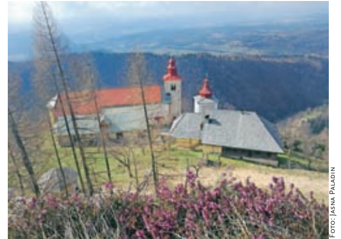
Pogled s cerkvice svetega Petra na cerkev svetega Primoža in Felicijana z mežnarijo in samostojnim zvonikom

Pot k Svetemu Primožu iz Stahovice vodi že več kot dva tisoč let in vse do sredine prejšnjega stoletja (do gradnje žičnice) je bila tod glavna pot na Veliko planino. Pot je bila tlakovana, še danes pa je ob njej nekaj kapel in znamenj, gre namreč za starodavno romarsko pot in sveti kraj, kar dokazuje tudi to, da so se mu pastirji, ki so gнали na planino svojo živino, izognili. Tu je bila nekdanji srednjeveška naselbina z obzidjem, ki je deloma še ohranjeno, kamor so se vaščani zatekli v nemirnem obdobju preseljevanja ljudstev v 5. in 6. stoletju. Prvi zametki cerkve segajo v