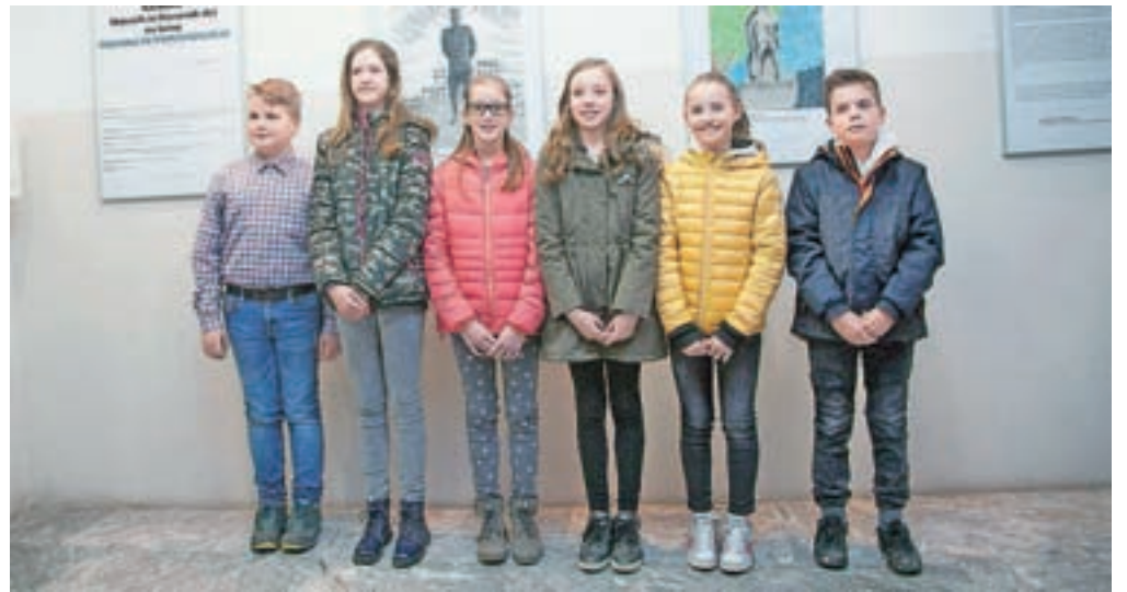
Letošnji nagradenci natečaja

Kamnik – Koordinacijski odbor veteranskih in domoljubnih organizacij, ki združuje Območno združenje veteranov vojne za Slovenijo Kamnik - Komenda, Zvezo združenj borcev za vrednote NOB Kamnik, Policijsko ve-