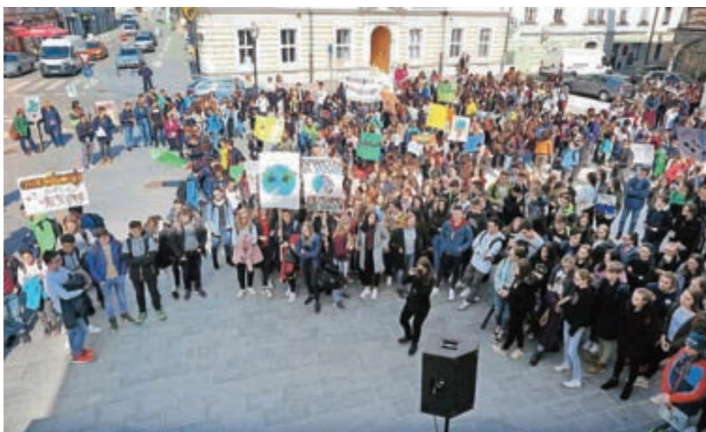
Na Glavnem trgu se je prejšnji petek z zahtevami za podnebno pravičnost zbrala množica mladih.

Iz GSŠRM in drugih šol so se dijaki in učenci s svojimi profesorji in ravnatelji s transparenti, tudi glasnimi vzkliki in piščalkami podali do središča mesta, kjer jih je pričakal tudi župan Ma-