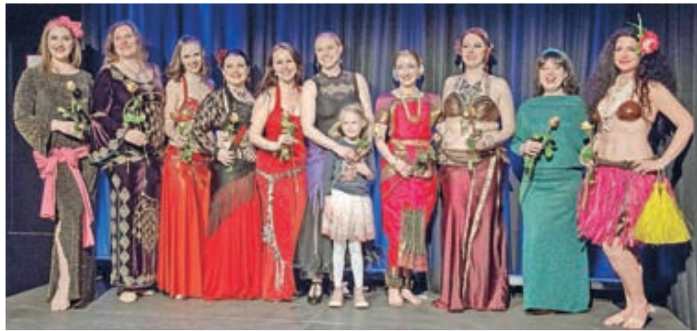
Nastopajoče na dogodku United colours of KUOD Bayani