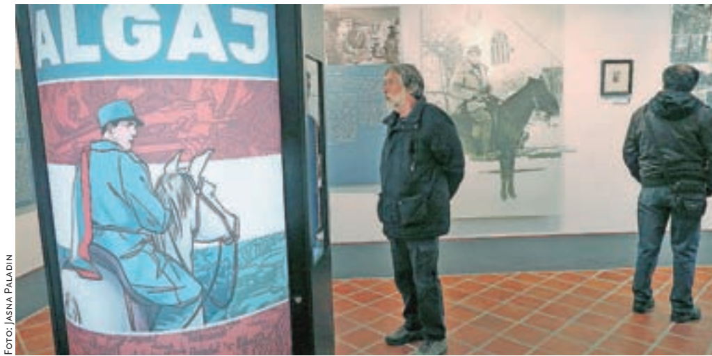
Razstava o Franju Malgaju bo v Rojstni hiši Rudolfa Maistra na ogled še do konca aprila.

»Vemo, kdo je bil Rudolf Maister in kako pomembno so njegova dejanja vplivala na slovensko zgodovino, premalo pa vemo, kdo je bil Franjo Malgaj, čeprav gre za posameznika, ki ni razmišljal, kaj bo z njim, ampak se je odločil in naredil tisto, kar je bilo v dani situaciji prav za domovino. Domovini je dal tisto, kar človek največ lahko da – svoje življenje,« je v svojem nagovoru – prvem v imenu