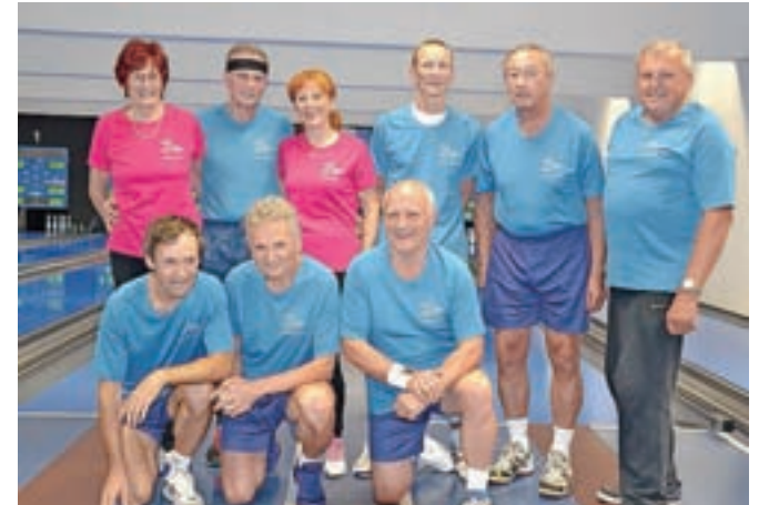
Ekipa DU Kamnik