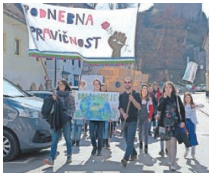
S transparenti so se sprehodili skozi Kamnik in opozarjali, da jim ni vseeno za naš planet.

Da ni ostalo zgolj pri lepih besedah, so dijaki in zaposleni na GSŠRM ta dan v še večji meri v šolo prišli peš ali s kolesi, k čistejšemu okolju pa bodo pripomogli tudi z uporabo steklenih kozarcev in stekleničk. Prejšnji petek so na šoli namreč prenehali uporabljati plastične kozarce.