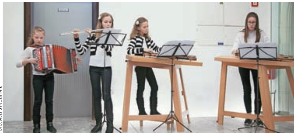
Odprte razstave so z glasbenim nastopom popestrile učenke Glasbene šole Kamnik.

Razstava bo v času uradnih ur Občine Kamnik na ogled do sredine aprila.