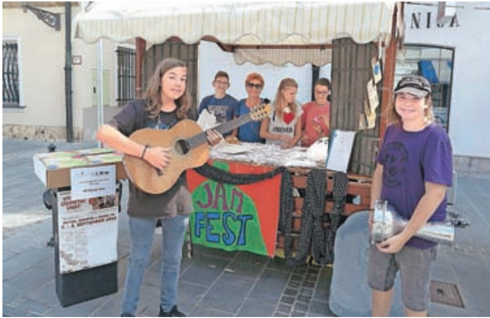
Učenci iz Osnovne šole Marije Vere v Kamniku so predstavili svoj Jamfest na Dnevih narodnih noš in oblačilne dediščine.

Gre za enodnevni kulturno-turistični dogodek Jamfest, ki bi potekal v poletnem času na Jamci na Duplici. Udeleženci bi se zbrali že v zgodnjih dopoldanskih urah in se po interesu razdelili v več skupin. Programi v skupinah bi bili v ekološkem duhu prijazni z naravo. Večina udeležencev bi šla peš v Kamnik, kjer bi si ogledali srednjeveško ulico, grad nad Kamnikom, izvedli bi tudi nekaj o pomembnih Kamničanih in si ogledali muzej in rojstno hišo Rudolfa Maistra. Za popotnico bi udeleženci dobili »jamburger«, na sodoben način pripravljeno značilno jed s kamniško kajzarico, klobaso in kislim zeljem. Na Jamci bi potekal