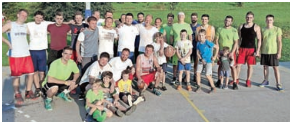
Pod koši igrišča v Mekinjah so se na šesturnem košarkarskem maratonu pomerili igralci Športnega društva Tuhinj in Športno-kulturnega društva Mekinje.

svojega igrišča, smo morali turnir organizirati na različnih lokacijah (na parkirišču tovarne Kemostik in za domom ŠKDM, kjer smo morali zapreti cesto, ki vodi v Nevlje), sedaj pa se na našem igrišču nekajkrat letno odvijajo razni dogodki. Mekinjčani in Tuhinjci se bomo seveda srečali tudi prihodnje leto, saj je šesturni turnir prijateljska vez, ki veže oba kraja.