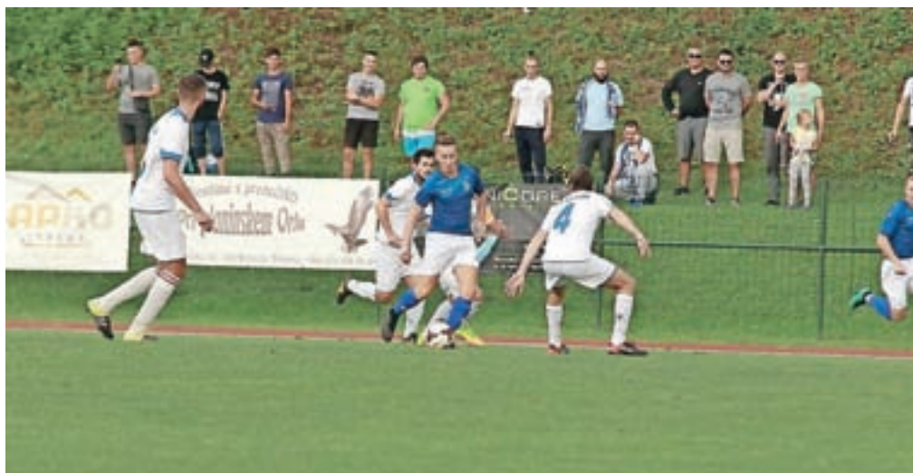
Kamniški nogometaši so se pogumno borili z gostujočo ekipo iz Litije.

minuti zadeli – na koncu se je izkazalo – odločilni zadevek. Po zadnjem pisku so igralci potrto zapuščali zelenico, ponosni, vedoč, da so dali vse za klubski grb, pa vseeno žalostni, ker je ena napaka botrovala prejetemu zadetku, so pozdravili navijače, ki so tudi po zaključku srečanja nagradili naše mlade fante z velikim aplavzom. Hvala vsem, ki ste bili priča izjemnemu dogodku, igralci že stremijo proti naslednjemu koncu tedna, ko se bodo v gosteh pomerili z Dolom, čez dva tedna pa vnovič v Mekinjah.