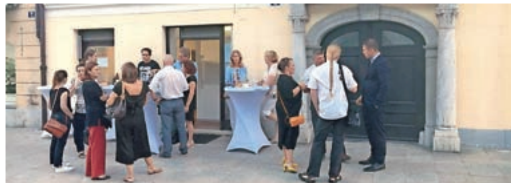
Arkada psihoterapija ima svoje prostore na Šutni.