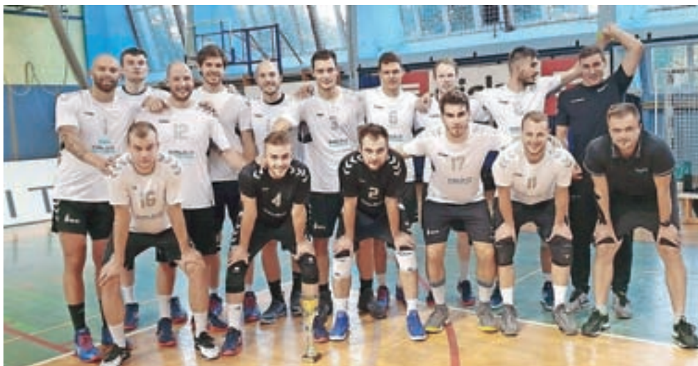
Kamniški odbojkarji so na prvih dveh pripravljalnih tekmah zabeležili zmago in poraz.

»Mislim, da smo na pravi poti, čeprav se nam še pojavlja precejšnje število lastnih napak, a je to po svoje logično, saj do zdaj praktično še nismo igrali. Do zdaj napada sploh še nismo trenirali, bolj smo se ukvarjali s servisom in obrambo. V teh dveh elementih smo že naredili določen korak naprej, medtem ko se nam v napadu pozna, da imamo še veliko stvari odprtih. Zelo dobro stojimo glede telesne pripravljenosti, s prihodnjim tedom pa bomo več pozornosti namenili odbojgarskim elementom in taktiki,« je po domačem turnirju