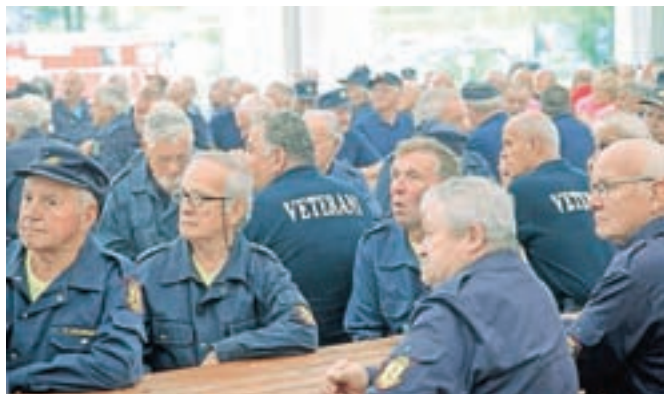
Kakšnih petsto veteranov in veterank regije Ljubljana III se je zbralo v Snoviku.

Osemnajsto srečanje gasilcev veterank in veteranov regije Ljubljana III je potekalo v Snoviku.