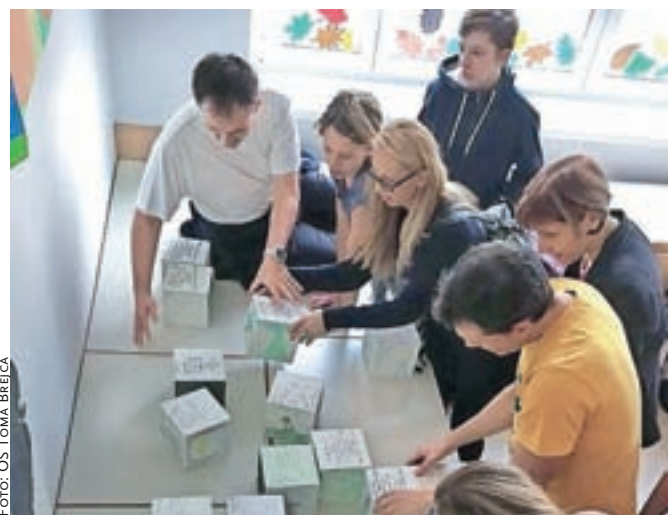
Udeleženci so morali reševati različne naloge.

Gledalci oz. aktivni udeleženci doživljajske igre Escape School so bili nad konceptom igre navdušeni – med igro so se zabavali, sodelovali, nekoliko napenjali možgane in začutili nekaj napetosti ter tudi nekoliko tekmovalnosti. Na koncu so učence in mentorje nagradili z močnim aplavzom. Sledil je še sklepni del: učenci glasbene delavnice so zapeli pesem v angleščini o moči sodelovanja med ljudmi, vsi udeleženci smo prejeli certifikate o sodelovanju na mednarodni delavnici, vsi mentorji in učenci smo se skupinsko fotografirali. Tako učenci kot mentorji smo se poslovili z besedami ponosa, zahvale in lepih želja. Ni manjkalo objemov in obljub, da bomo nedvomno negovali svoja nova prijateljstva ter spominiti v Sloveniji, ohranili za vedno.