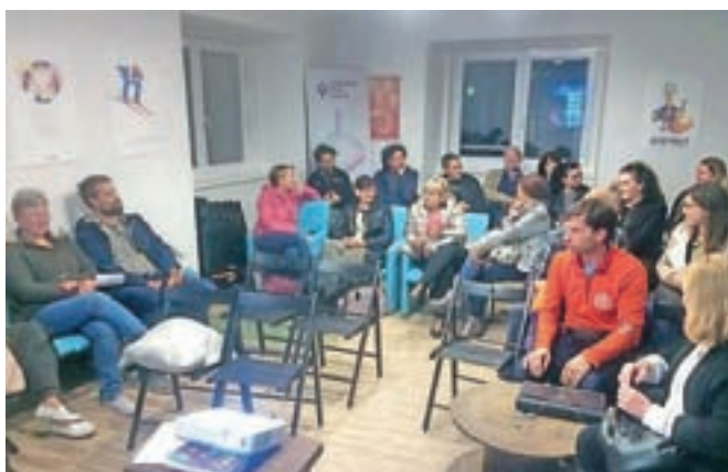
Srečanje trgovcev in gostincev iz starega mestnega središča v KIKštarterju

čanj zaželeli tudi v prihodnje, tokrat pa je beseda tekla o decembrskih prireditvah, možnostih, kako ponudbo mestnega središča predstaviti širši skupnosti, ukrepom, ki bi prinesli dolgoročno oživitve, ter znanjem, ki bi jih trgovci, gostinci in drugi podjetniki lahko pri-