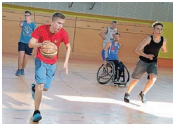
Košarka / FOTO: TINA DOKL