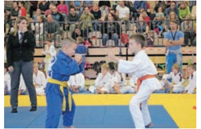
Za nekatere je bila to prva tekma v življenju, a so kljub temu hrabro nastopili.

V soboto, 14. oktobra, je Judo klub Komenda v domači športni dvorani že drugo leto zapored priredil judo tekmovanje za 2. Pokal Komende.