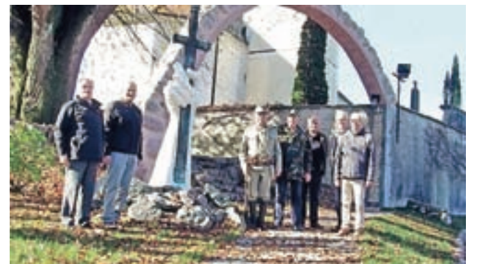
Prižig luči miru pri spomeniku na kamniških Žalah

prve svetovne vojne prižgali luč miru. Z prižigom luči in minutnim molkom so se spomnili 100. obletnice preboja pri Kobaridu in konca Soške fronte ter vseh žrtev prve svetovne vojne.