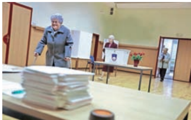
V kamniški občini je zanj glasovalo dobrih 58 odstotkov vseh, ki so odšli na volišča.