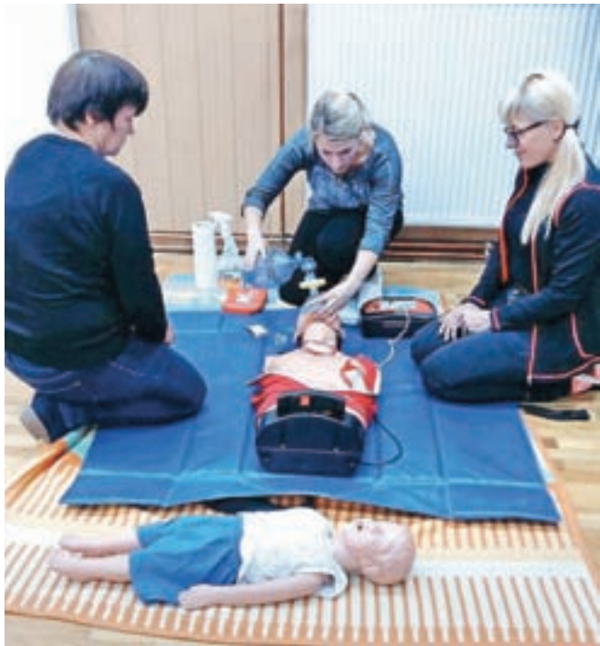
Po predavanju smo znanje prve pomoči preizkusile tudi v praksi.

Po predavanju je sledil krajši premor. Nato smo se razdelile v skupini in smo prvo pomoč tudi praktično potrenirale. Na eni delovni točki smo predelale pristop k poškodovancu, temeljne po-