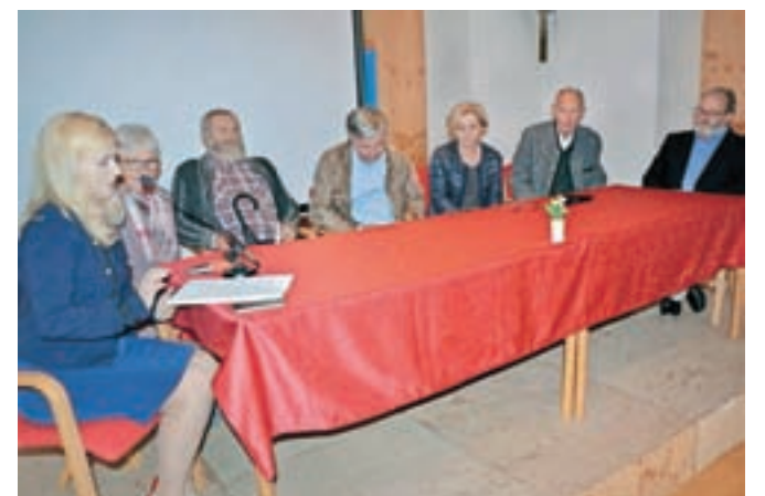
Okrogla miza z Ziljani 14. oktobra v dvorani frančiškanskega samostana v Kamniku