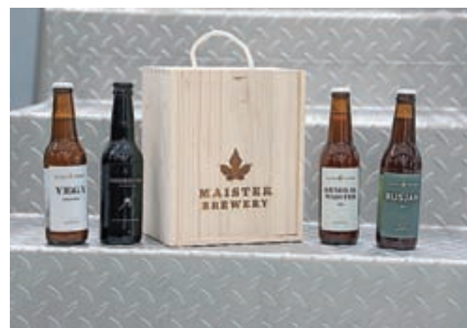
Piva Pivovarne Maister nosijo imena znamenitih Slovencev.