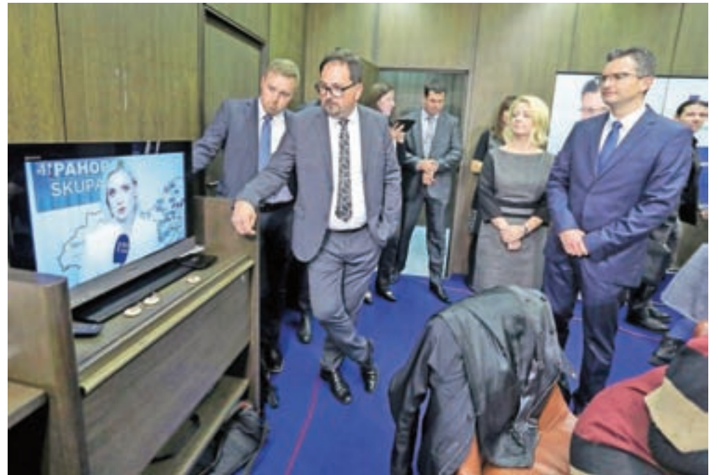
Pričakanje rezultatov na sedežu volilnega štaba na Duplici

S štetjem glasov je v nedeljo zvečer njegov odstotek le še rasel in se (po prešteti 99,9 odstotka glasovnic) povzpelo do 24,93 odstotka. Po pričakovanjih je Marjan Šarec največ glasov dobil v volilnih okrajih Kamnik, Domžale I in Domžale II, v kamniškem okraju, kjer je bila volilna udeležba 55,81-odstotna, so volivci glasovali takole (podatki so še neuradni): za Marjana