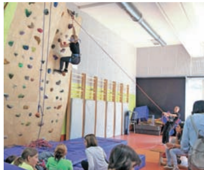
Športno plezanje

Medtem ko so osnovnošolci športni dan nadaljevali v naravi, so se srednješolci pomerili v namiznem tenisu, košarki na vozičkih, krlingu, plavanju in športnem plezanju. Rezultati niso bili pomembni, čeprav zavzetosti med mladimi ni manjkalo, bolj pomembno je bilo, da se čim več mladih vključi v šport, ki ima v vseh pogledih zgolj pozitivne učinke.