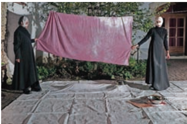
Jatun Risba in Miša Gams