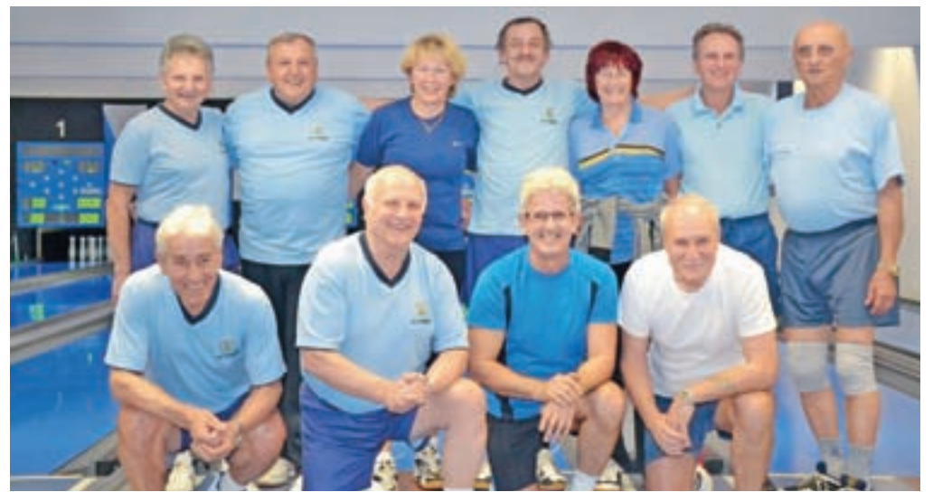
Ekipa Društva upokojencev Kamnik

Medtem pa se je začela tudi občinska liga. Letos nastopa v občinski ligi sedem ekip,