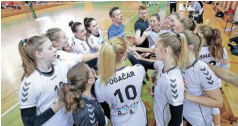
Kamniške odbojkarice doma letos še niso bile poražene.

»Ne sme se nam dogajati, da z lastnimi napakami tekme vrnemo v igro, kar se nam je zgodilo v prvem nizu tekme proti Triglavu in tudi