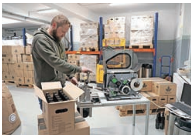
V novi pivovarni imajo vse, kar potrebujejo, tudi etiketirnico.