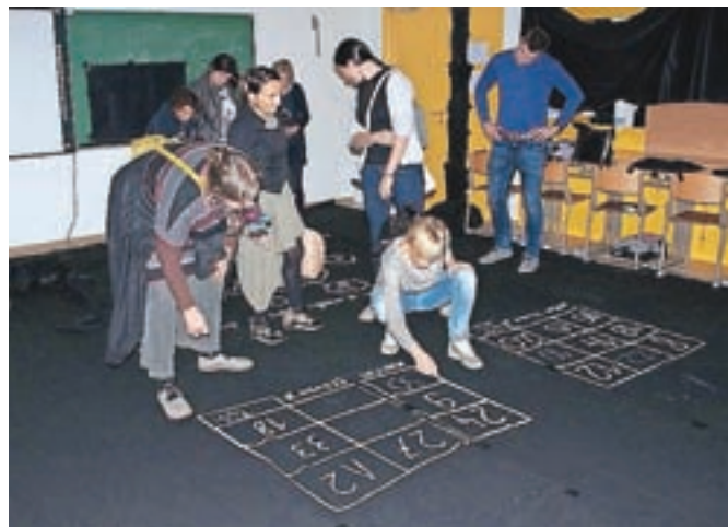
Druženje na naši šoli smo sklenili z doživljajsko igro Escape School.

Na Osnovni šoli Toma Brejca smo mednarodno izmenjavo zaključili z doživljajsko igro Escape School.