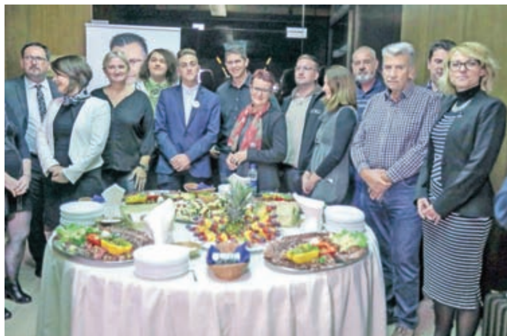
Podporniki predsedniškega kandidata z Liste Marjana Šarca