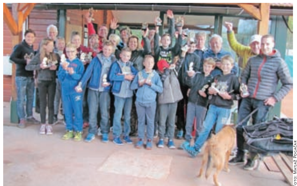
Podelitev priznanj najboljšim igralcem na klubskih tekmovanjih v letu 2017