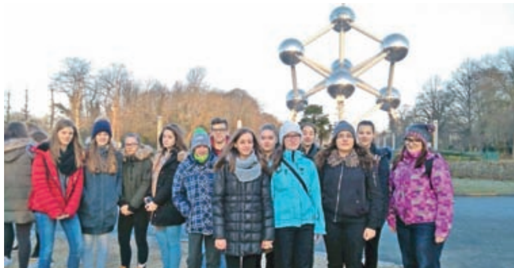
Skupinska fotografija pred Atomiumom