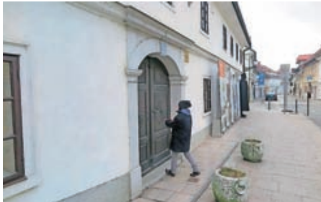
Z odkupom dodatnih prostorov bodo v hiši lahko uredili tudi glavni vhod.