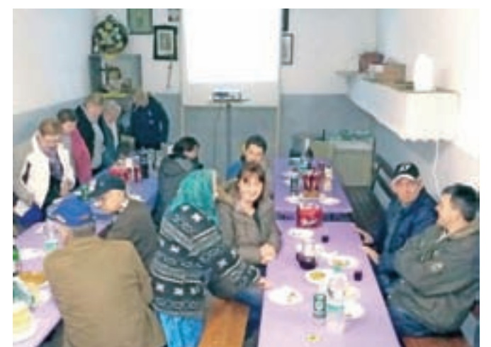
Vaščani smo se zbrali Pr' Ocvirk.

jih starih fotografij na diapozitivih. Vsaka od družin je imela nalogo, da poišče svoje stare in najbolj zanimive fotografije. Nekatero od teh so bile resnično zelo stare. Da bi vse skupaj malo popestrili, smo vsako fotografijo pokomentirali in se ob tem dobro nasmejali. Naše druženje je trajalo dobri dve uri in pol. Po uradnem delu je sledila pogostitev in kot se za Prešernov praznik spodobi, smo praznični dan zaključili s kozarčkom sladkega vinca.