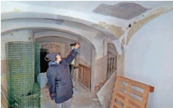
V notranjosti hiše se v konservatorskem smislu skriva pravi zaklad.

z ureditvijo muzejskih prostorov. Ker gre za kompleksno obnovo z jasnim ciljem, naj poudarim, da je to mogoče tudi zaradi izjemno dobrega sodelovanja Občine Kamnik, projektanta Roka Vetorazzija, izvajalcev, Medobčinskega muzeja Kamnik in ZVKDS, OE Kranj,« nam je povedala odgovorna konservatorka Maja Avguštin. Prostore bo tudi naprej upravljal Medobčinski muzej Kamnik, obnovili, napolnili z vsebino in odprli za obiskovalce pa naj bi jih predvidoma jeseni.