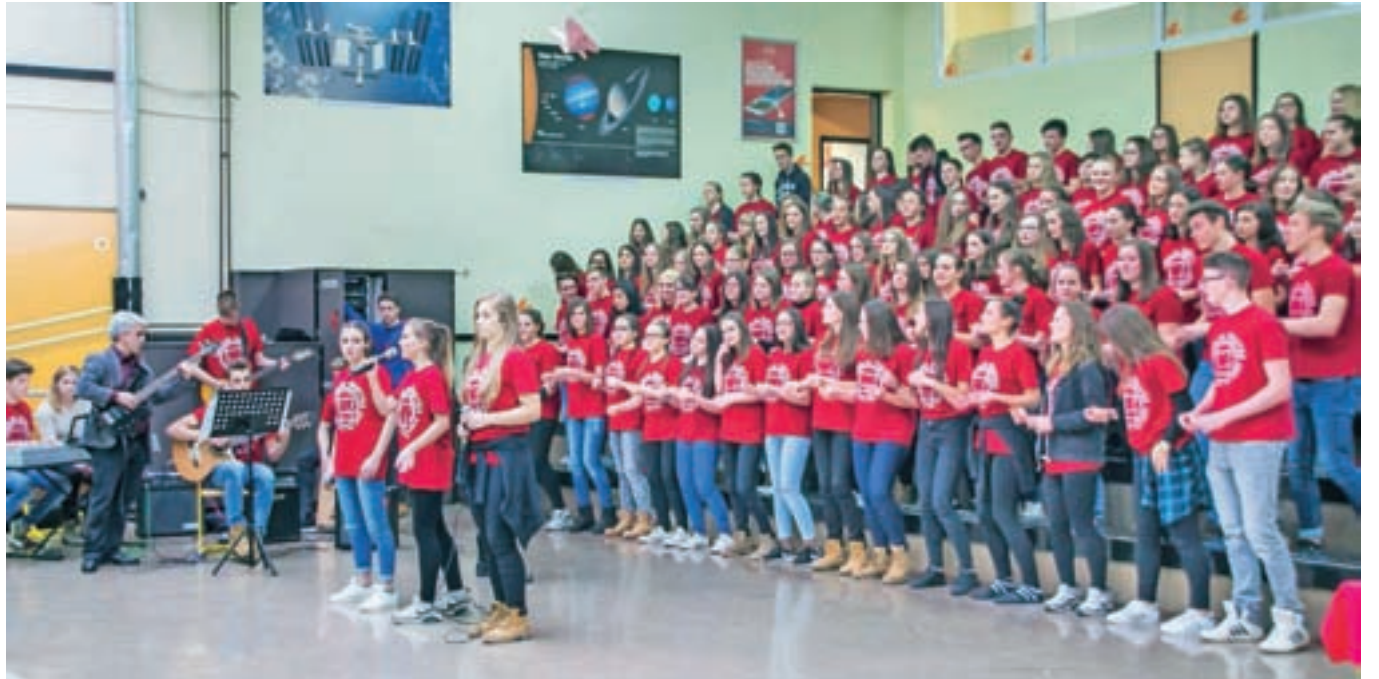
Odziv in številnost obiska osnovnošolcev in njihovih staršev sta bila na vseh treh dogodkih informativnega dne na GSŠRM zelo dobra in v skladu s pričakovanji šole.

GSŠRM odlikujejo inovativno učno okolje, pester nabor učnih programov, vrhunski dosežki dijakov, številne obšolske dejavnosti, prijazno šolsko okolje, strokovnost zaposlenih. Vpetost v lokalno okolje zagotavljamo s povezovanjem z vrtci, osnovnimi šolami, podjetji, občino in drugimi, je bilo moč slišati na informativnem dnevu, ravnateljica pa je v imenu sodelavcev še posebej poudarila: »Strokovnost zagotavljamo s strokovno odličnostjo, izkušnjami in predanostjo delu. V svoji prilagodljivosti sledimo potrebam okolja in se nanje ustvarjalno odzivamo. V duhu teh vrednot vzgajamo svoje dijakke, njihovo nemirno odraščajočo energijo pa