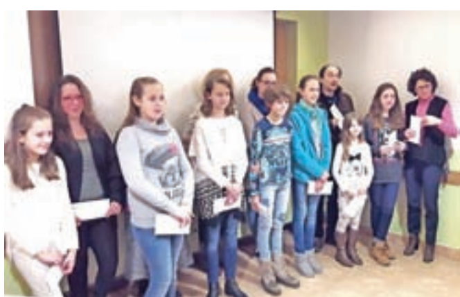
Skupinska fotografija sodelujočih na letošnjem literarnem natečaju

Ob jubilejnem 10. Literarnem večeru bodo v Termah Snovik prihodnje leto izdali tudi priložnostno zbirko pesmi, prispelih na vseh deset natečajev.