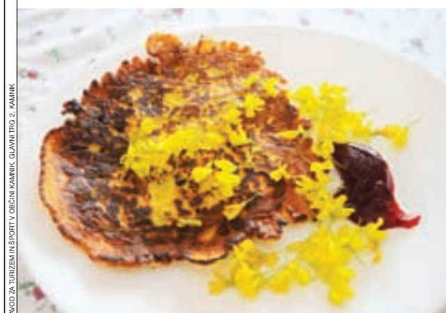
ZAVOD ZA TURIZEM IN ŠPORT V OBČINI KAMNIK, GLAVNI TRG 2, KAMNIK

Recepte že pozabljenih jedi pošljite na naslov TIC Kamnik, Glavni trg 2, 1241 Kamnik, lahko pa jih osebno prinesete vsak dan od 9. do 16. ure. Zraven pripišite kraj in ime gospodinje, ki je po tej recepturi pripravljala lokalno kamniško jed. Vsak recept bo nagrajen s kuhalnico Okusi Kamnika.