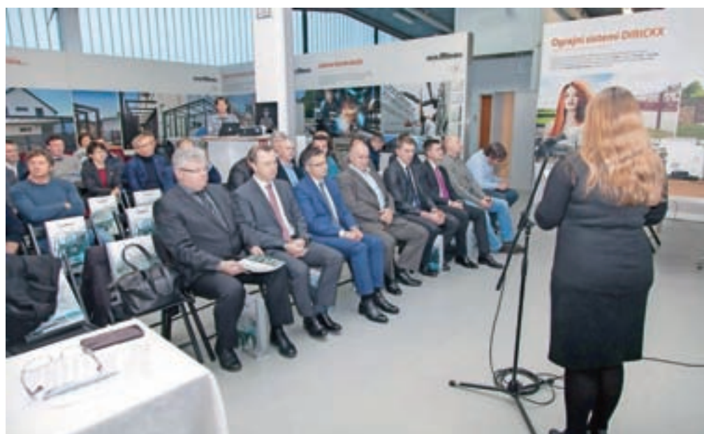
Člani Podjetniškega kluba Kamnik na svoji tretji skupščini

Potencialna podjetja za investiranje bodo preko pospeševalnika iskali v okviru t. i. start up vikendov in podobnih predstavitev podjetniških idej, ki so jih v sopslovnem centru KIKštarter že večkrat pripravili. V zameno za vložek v podjetje pa je pospeševalnik praviloma upravičen tudi do lastniškega deleža v podjetju, v katerega je vložil kapital. »Vprašanje, kaj mi – kaj jaz – kot podjetnik lahko naredim za premik na bolje, je rodilo odgovor in ustanovitev podjetja, katerega namen bo investiranje semenskega kapitala v zagonska podjetja iz celotne regije. Program in model dela nameravamo prenesti na ostale regije in na ta način ustvariti kritično maso podjetni-