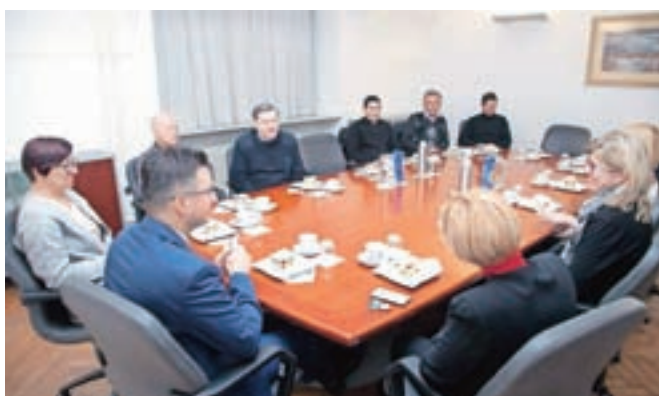
Kamniški župniki so se na občinski upravi sestali z županom.

število sakralnih objektov v občini, med katerimi jih je precej tudi na seznamu kulturne dediščine, kar zahteva še dodatno skrb pri obnovah. Šarec je izrazil zavedanje, da je sredstev manj, kot bi si želeli, hkrati pa dodal, da ob premajhni povprečini, ki jo občinam namenja država, povišanje proračunske postavke za sofinanciranje obnove sakralnih objektov za zdaj ni mogoče. Tako kot v preteklih letih ta tudi v nedavno sprejetem dvoletnem proračunu ostaja na višini 14 tisoč evrov.