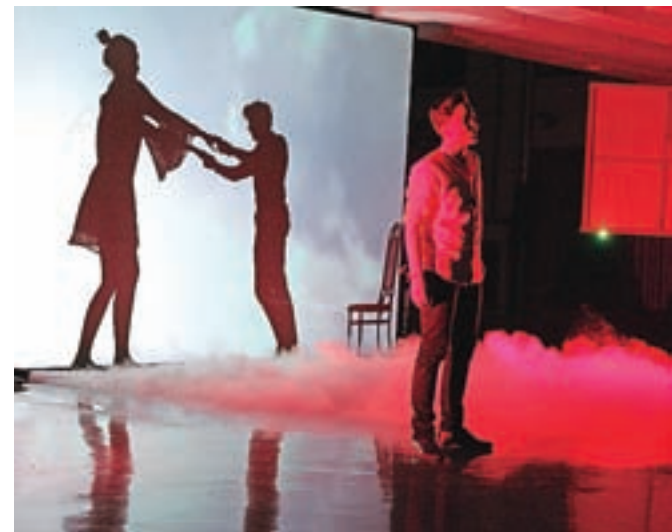
Prešernov Povodni mož v izvedbi kamniških dijakov

V enotah Medobčinskega muzeja Kamnik (v muzeju na Zapricah, v Galeriji Miha Maleš in v Rojstni hiši Rudolfa Maistra) so svoje stalne inčasne razstave obiskovalcem ob kulturnem dnevu predstavili brezplačno, v Domu kulture Kamnik pa se je v sredo zvečer v organizaciji JSKD odvila že 38. Območna revija pevskih zborov občin Kamnik in Komenda, na kateri se je predstavilo deset zborov.