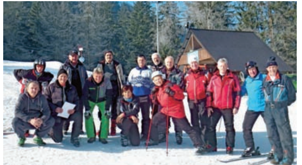
Veleslalomisti Društva upokojencev Kamnik

Letos smo prvokrat na smučišču Osovoje, ki leži nad dolino Črne, organizirali društveno tekmovanje v veleslalomu, ki se ga je udele-