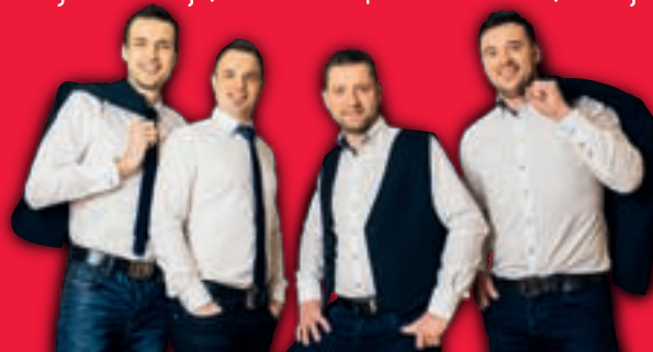
ŠMARTNO V TURINJU 2016, LAZEV TURINJU