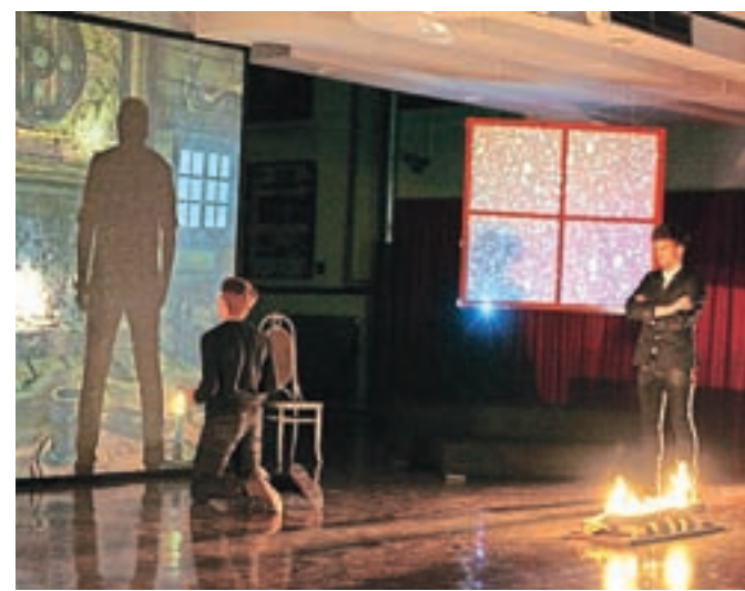
Na GSŠRM so navdušili z recitalom Balade in romance.