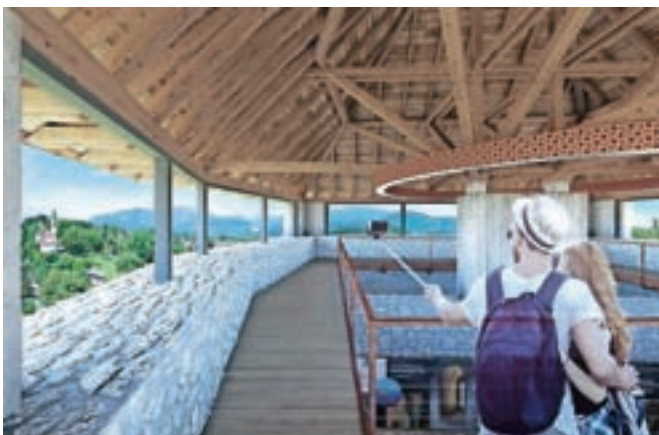
Razgledna ploščad bi ponujala izjemne razglede na celotno mesto v obsegu 360 stopinj.

Kaj menijo o idejnem projektu in kako oz. če ga nameravajo uresničiti, smo vprašali tudi župana Marjana Šarca. »Že pri pripravi proračuna smo za leti 2017 in 2018 namenili sredstva za obnovo grajskega območja, torej še preden smo bili seznanjeni z omenjeno pobudo. Omenjeni projekt smo skupaj z arhitektoma pogledali in prvi vtis je dober. Projekt namreč ni zastavljen megalomansko, temveč upošteva danosti. Vsekakor je predlog upoštevanja vreden in bi ga kazalo izvesti, saj nam sedanje stanje ni v ponos,« nam je odgovoril.