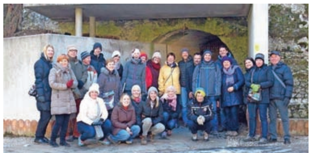
Kamniški vodniki pred vhodom v malograjski tunel

Verjetno ni veliko ljudi, ki bi šli mimo Trga svobode in