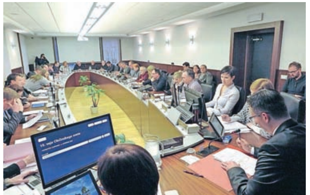
Svetniki so svojo prvo sejo v letu 2017 imeli v sredo, 1. februarja.