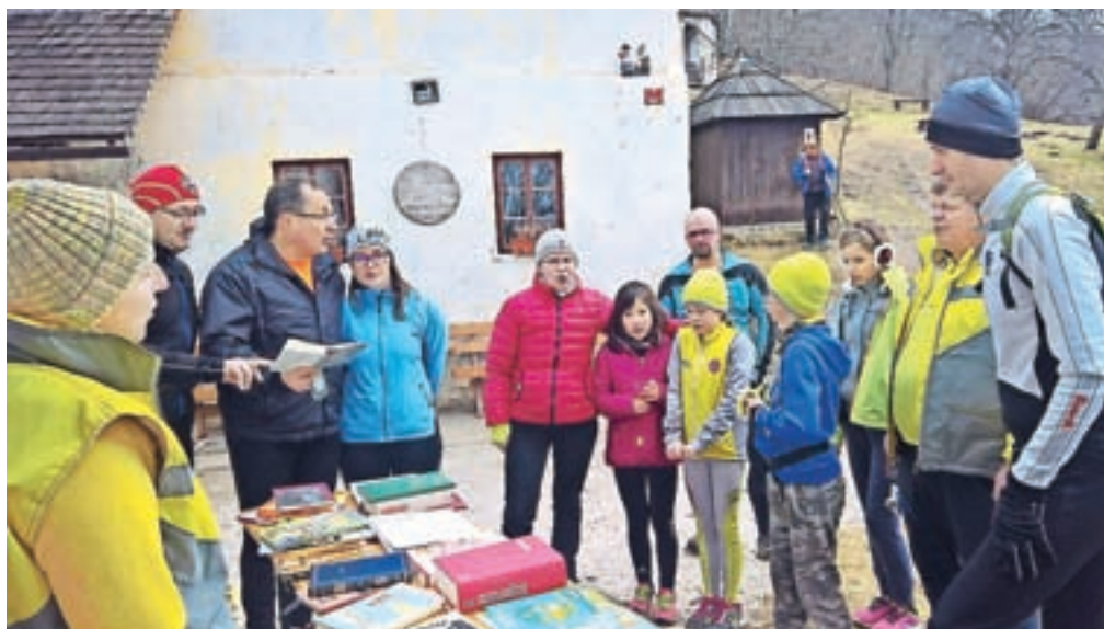
Po knjigo na ligo na Svetem Primožu