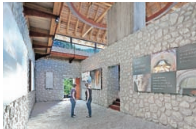
Vstopna dvorana bi lahko bila namenjena razstavam, koncertom in drugim dogodkom.