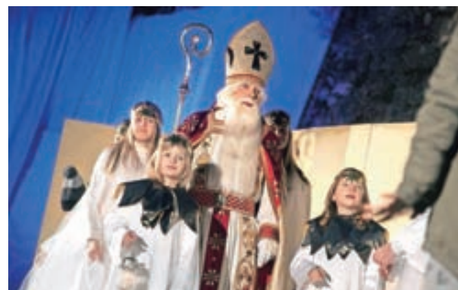
Tudi letos je kamniške otroke obdaroval Miklavž.

Ko je Miklavž počasi praznil malho daril, so se prizadevni člani društva iz Tunjic že ozirali v prihodnje leto, ko bodo Miklavžu že tridesetih pomagale najti pot do kamniških otrok. »Razmišljamo o pripravi muzikala, ki bi ga radi ponovno umestili v čaroben ambient pobočja Ma-