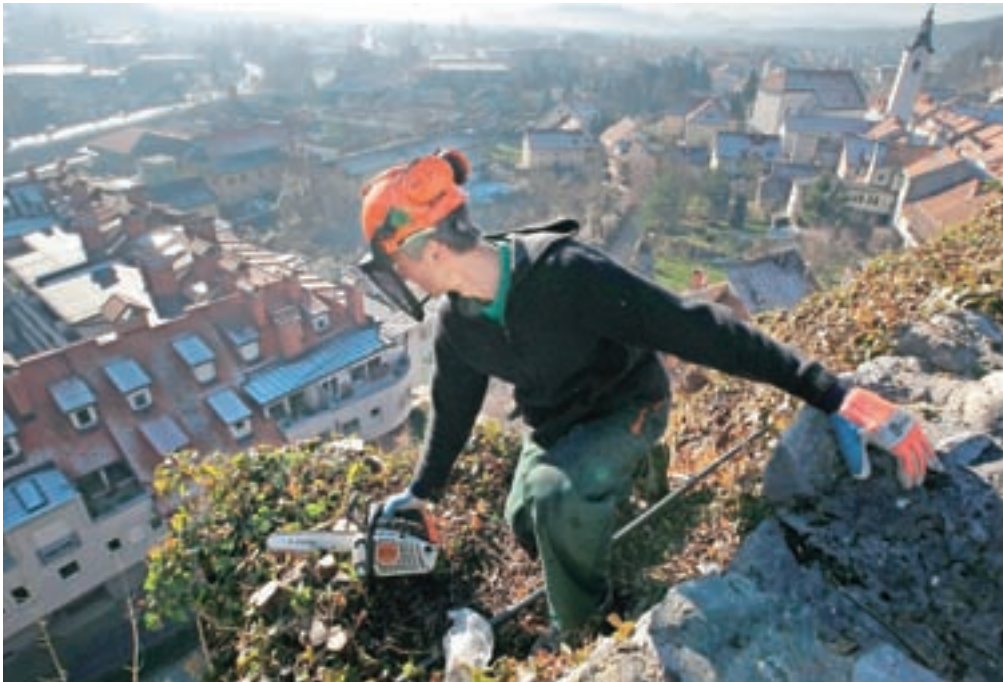
Dela na strmem pobočju zahtevajo dobro usposobljene izvajalce.

Poleg zaščite severnega pobočja Malega gradu bodo predvidoma še vse do božiča izvajali tudi čiščenje celotnega pobočja Malega gradu, ki zajema odstranjevanje