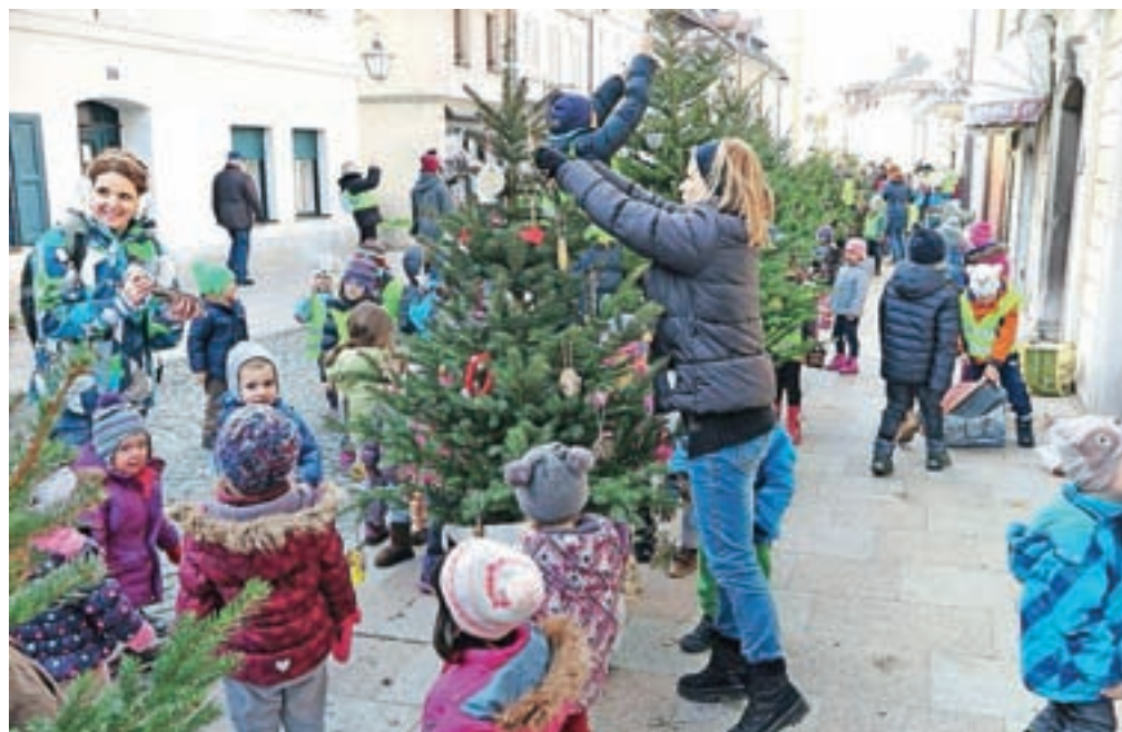
Drevesca na Šutni so okrasili otroci kamniških vrtcev in šol.

Otroci so pod vodstvom vzgojiteljic in učiteljic izdelali okraske, ponekod pa so k temu zabavnemu opravilu povabili tudi dedke in babice, tako da so otroci okraske izdelovali tudi doma. Kot denimo v Zasebnem vrtcu Peter Pan.