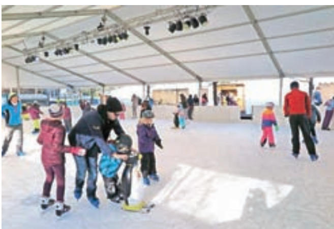
Dršališče je še posebej dobro obiskano ob koncih tedna.

Dršališče je polno predvsem ob koncih tedna, ko na drsalni ploskvi ne manjka tudi