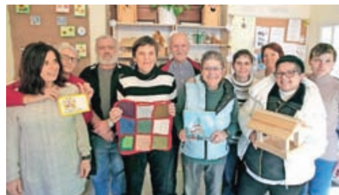
Uporabniki in zaposleni Dnevnega centra Štacion so tudi letos dokazali, da imajo zelo spretnne roke.

kov, ki so jih sami izdelali preko celega leta. Kot so nam povedali, je bil odziv obiskovalcev tudi letos dober, največ povpraševanja pa je bilo po čajih, marmeladah, obeških, predpasnikih, voščilnicah ... Prostovoljne prispevke, ki so jih zbirali v zameno za izdelke, bodo namenili za delovanje centra, z veseljem pa bodo ustvarjali tudi v prihodnje, še pravijo.