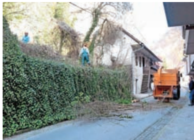
Zaradi mletja podrasti bodo na Parmovi ulici še nekaj dni občasne popolne zapore prometa.