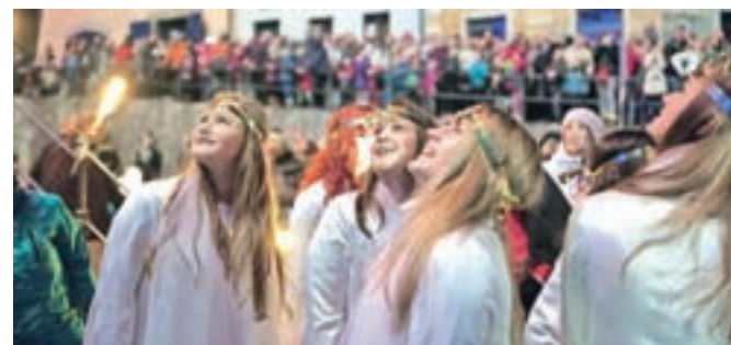
Miklavža so spremljali tudi angelčki ...