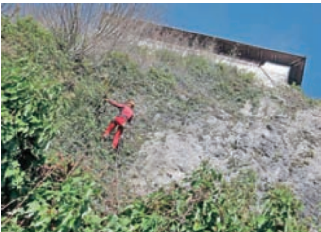
Pobočje malega gradu bodo zaščitili z mrežami in očistili nizke podrasti.

obzidja, a šele prihodnje leto, saj zaradi nizkih temperatur izvajalci ne morejo več zagotoviti ustrezne kakovosti del.