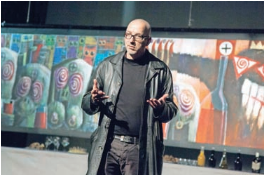
Tomaž Schlegl ponovno kritično presoja ustroj družbe.

Animaliz reford, razstava, s katero Schlegl drami družbo iz kolektivnega sna, je tudi v drugi izvedbi odprla številna vprašanja in ponudila več možnih interpretacij. Predvsem pa je zbudila na pravem mestu, kar je nujna lastnost vsakega angažiranega umetniškega dela. Vse ostalo je zgolj dekor, razbijanje praznine beline sten, kot pravi Schlegl.