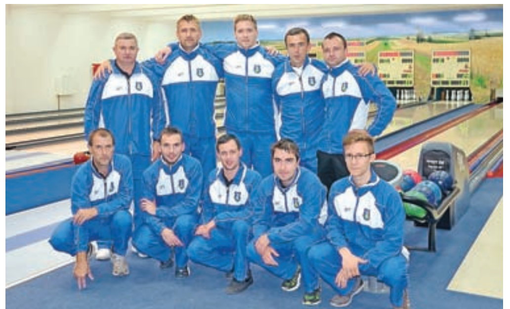
Ekipa KK Calcit Kamnik, ki je nastopila na Pokalu Evropa v Srbiji.

Pöhlten (Avstrija). Tekma z Avstrijci je bila sprva dokaj izenačena, toda avstrijski kegljači so bili na tej tekmi boljše ekipa in zmagali z rezultatom 2:6 (3444:3523). Poraz proti Avstrijcem je pomenil, da se bodo Kamničani pomerili za 3. mesto drugega polfinalnega obračuna, to pa so bili člani madžarskega kegljaškega kluba Zalaegerszeg. Tekma, ki je po prvi polovici kazala na zmago Kamničanov, saj so