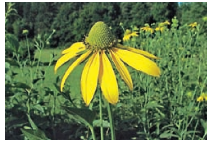
Deljenolistna rudbekija

Z upoštevanjem nekaterih pravil vsakdo lahko pripomore k ohranjanju pestrosti rastlinskega in živalskega sveta. V jesenskem času veliko ljudi čisti svoje vrtove, na žalost pa mnogi med njimi