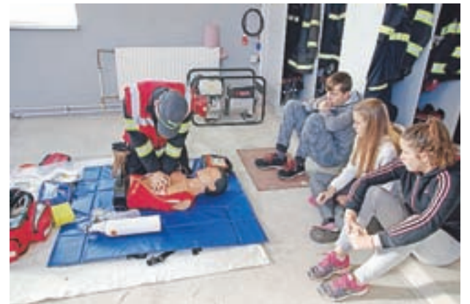
Zavzeti poslušalci

Srednja vas – V soboto, 29. oktobra, so gasilci PGD Srednja vas v sklopu meseca požarne varnosti organizirali predstavitev gašenja in oživljanja. Udeležili so se je tako mladi gasilci kot tudi njihovi starši. Udeleženci smo lahko preizkusili, kako je v vlogi reševalca. Spoznali smo tudi delo z defibrilatorjem. Naučili smo se, kako ukrepati v primeru manjšega požara. Seveda je bilo najbolj zanimivo gašenje.