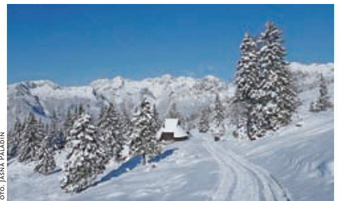
Na Veliki planini je že prava zimska pravljica.