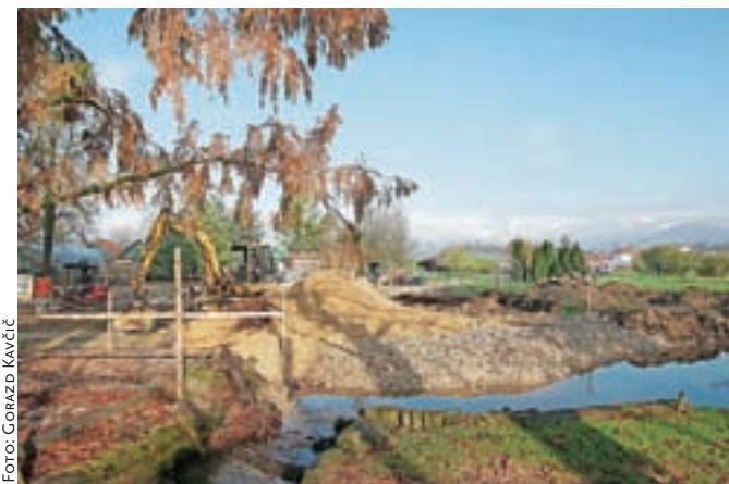
Novi vhod, ki ga že gradijo, bo umeščen med dosednji vhod in vrtni center ter malenkost zamaknjen v sam park.