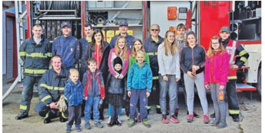
Udeleženci predstavitev gašenja in oživljanja