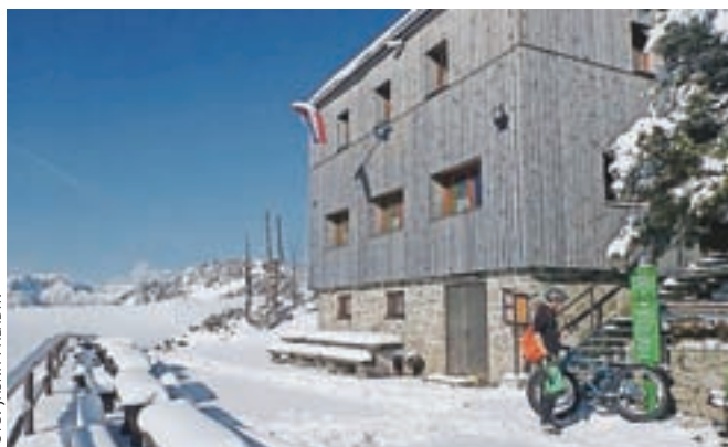
Zasnežena planina privablja najrazličnejše rekreativce.

dosti že lahko preizkusili sanki – sankiška proga bo, če bo le dovolj snega – odprta tudi prihodnje sobote in nedelje. Dokler ne bodo odprli smučišča, bo sankanje mogoče med 9.30 in 16. uro.