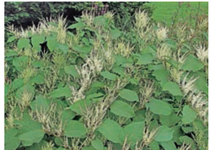
Japonski dresnik