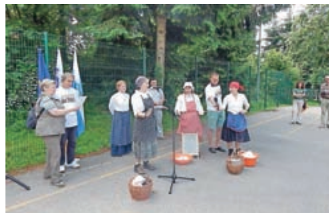
Dupličane je ob prazniku obiskala tudi skupina iz krajevne skupnosti Perovo.