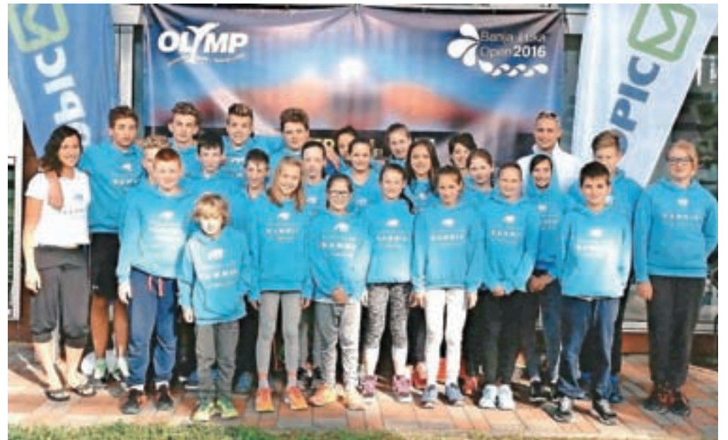
Kamniški plavalci na tekmi v Banjaluki