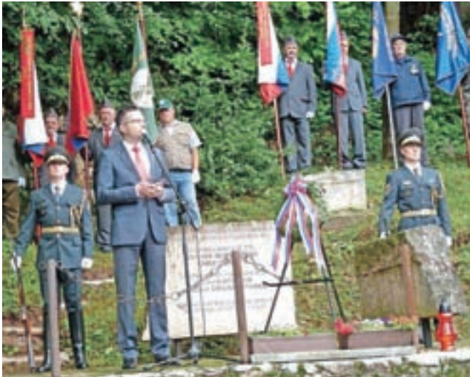
Spomenik v Češnjicah stoji v spomin na padle borce, tudi ameriške in britanske vojake, ki so se borili na območju Menine planine.

Prav zato se slovesnosti vsako leto udeležijo tudi predstavniki ameriškega veleposlaništva. Letos se je domačinom in vsem Slo-