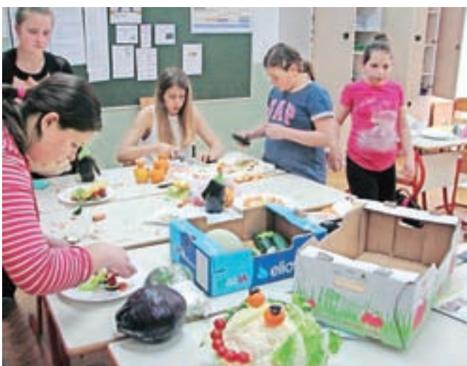
MLADE PROSTOVOLJKE OŠ STRANJE SO NA TEMO SADJA IN ZELENJAVE V LETOŠNJEM ŠOLSKEM LETU PRAVILILE TUDI RAZSTAVO.