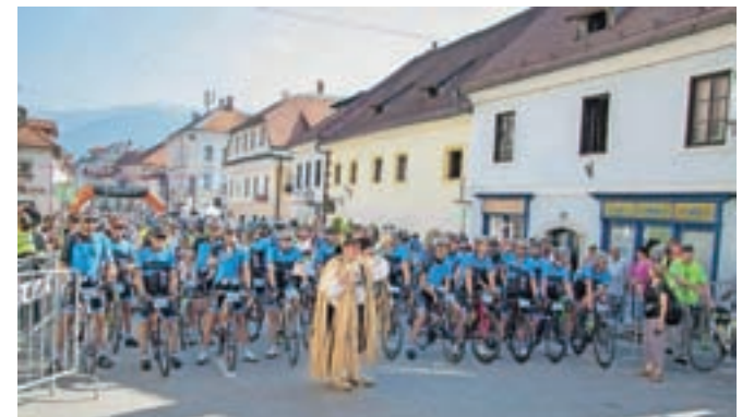
Na jubilejnem, desetem Maratonu Alpe Scott pričakujejo okoli sedemsto kolesarjev, številne tudi iz tujine.

Predvidena časovnica Maratona Alpe Scott je: Komenda – 9.10, Cerklje – 9.20, Preddvor – 9.35, Zgornje Jezerko – 10.00, Jezerski Vrh – 10.30, Pavličovo sedlo – 10.50, Logarska dolina – 11.00, Solčava – 11.10, Luče – 11.20, Ljubno – 11.35, Radmirje – 11.40, Gornji Grad – 11.50, Črničev -12.20.