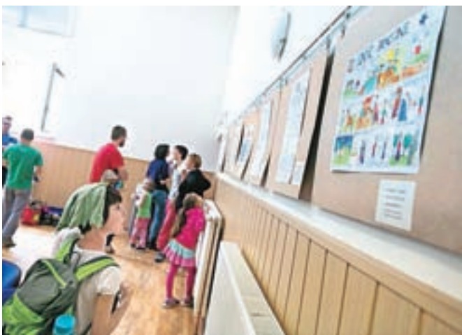
Na letošnjem likovnem natečaju na temo Križnikovih pravljič je sodelovalo kar 180 otrok.