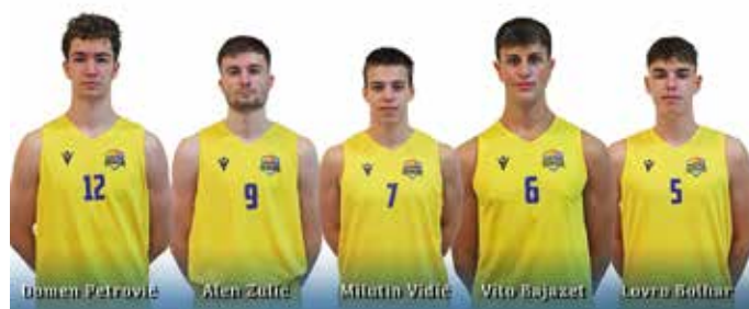
Več pozornosti so usmerili v mlade igralce.