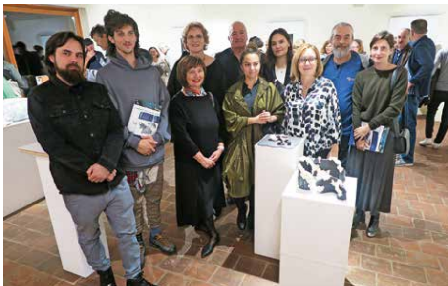
Odprtja razstave se je udeležila tudi večina avtorjev predstavljenih del.