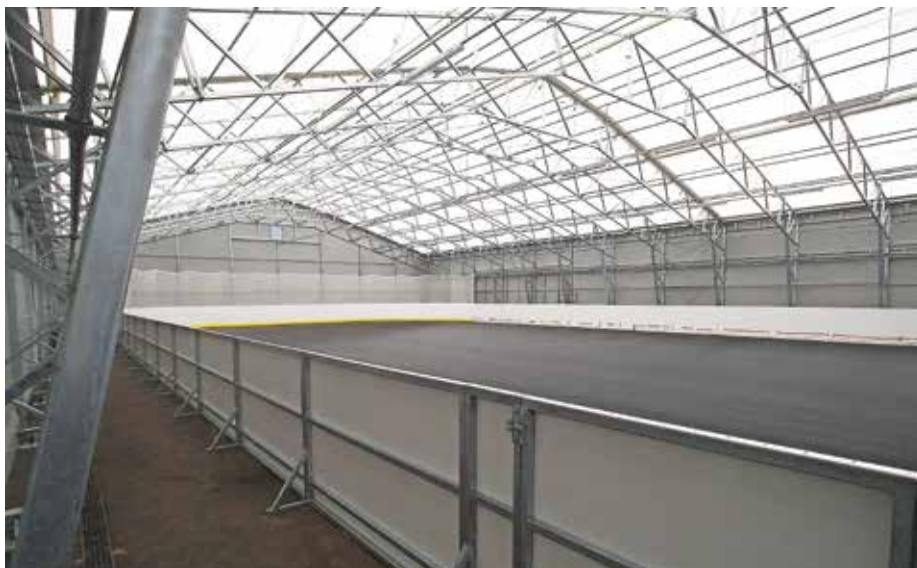
Pokrito drsališče v Športnem parku Šenčur bodo odprli predvidoma v začetku prihodnjega leta.

Problematika umestitve objekta, kjer bi Komunalna Kranj skladiščila in obdelovala odpadke, ima dolgo zgodovino. Ker lokacija v Kranju, kjer se trenutno izvaja dejavnost zbiranja odpadkov, ni ustrezna, občine solastnice že vrsto let iščejo ustrezno rešitev. Predlagateljica ene od lokacij je bila v preteklosti tudi Občina Šenčur, a do dogovora ni nikoli prišlo. Že več kot pred desetletjem smo predlagali umestitev sortirnice odpadkov ravno na območje znotraj avtocestnega priključka Kranj vzhod. Ker se Mestna občina Kranj (MOK) tedaj ni odločila za odkup našega zemljišča na omenjenem območju, smo ga prodali na javnem