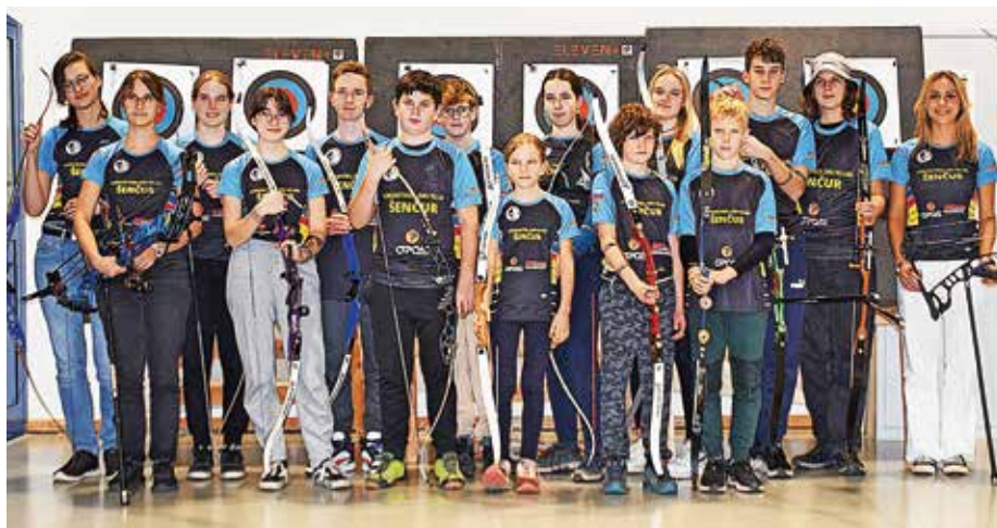
Lokostrelski klub Šenčur deluje od leta 1983.

Zimska sezona se je že začela. Ena izmed tekem za slovenski dvoranski pokal bo potekala tudi v Šenčurju v organizaciji Lokostrelskega kluba Šenčur. Tekmovanje bo 16. decembra v Športni dvorani Šenčur, kjer bodo nastopali tekmovalci v več kategorijah in slogih. Tekmovanje je še toliko bolj zanimivo, ker poleg tega, da se bodo v vrstah lokostrelcev borili tudi naši člani, v LK Šenčur letos zaznamujemo štirideset let obstoja. V teh letih je pod spretnim vodstvom trenerjev in mentorjev vzkl-