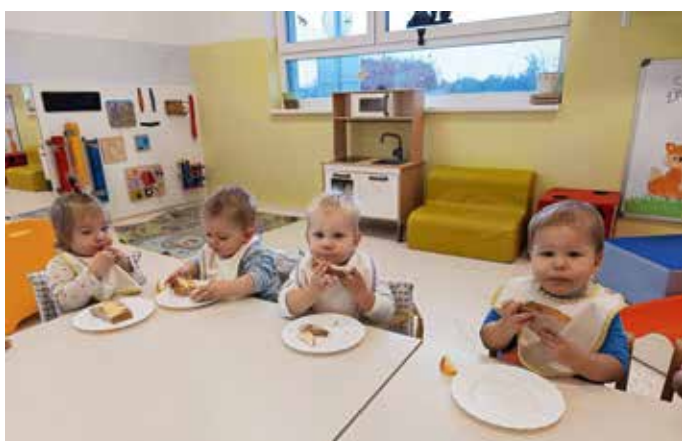
Ob tradicionalnem slovenskem zajtrku