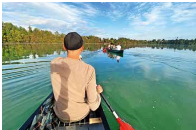
Vozili so se s kanuji.

V ponedeljek, 11. decembra, je bil objavljen javni natečaj za novi kulturni dom s sodobno knjižnico v središču Šenčurja, ki ga ja Občina Šenčur pripravila v sodelovanju z Zbornico za arhitekturo.