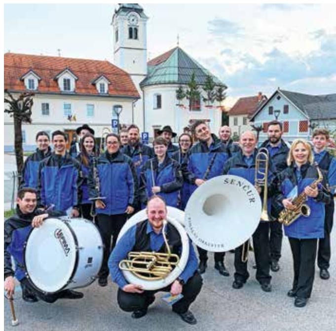
Pihalni orkester občine Šenčur bo letos pripravil božično-novoletni koncert z naslovom Pod šenčursko marelo.

Če pa še ne igrate instrumenta, ki spada v pihalni orkester, pa najprej vabljeni v Godbeno glasbeno šolo Šenčur. Letos jo