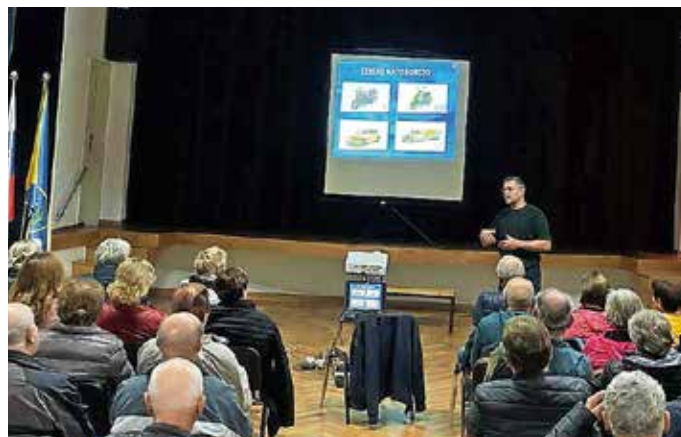
Pripravili so predavanje, namenjeno osvežitvi znanja o cestnoprometnih predpisih.