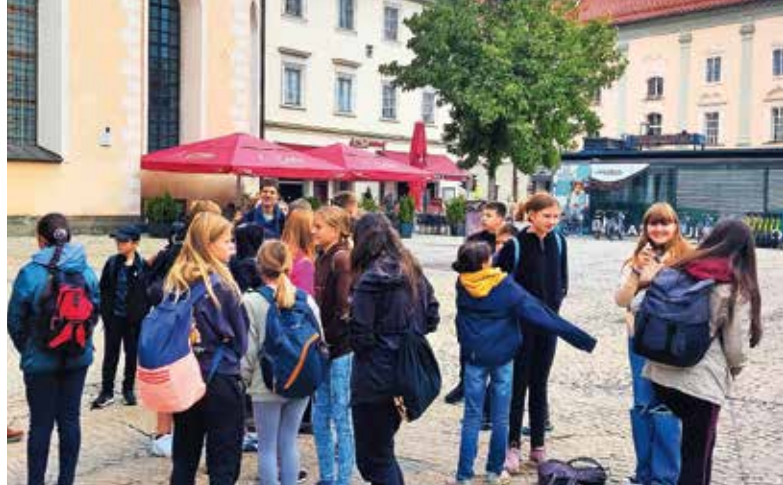
Izlet Osnovne šole Šenčur na avstrijsko Koroško

Pot nas je vodila do romarskega središča Gospa Sveta, najstarejše cerkve na slovenskem ozemlju. Zgraditi jo je dal misionar Modest, ki je med Karantance širil krščanstvo. Gospa Sveta je dala ime Gosposvetskemu polju, kjer je v slovenščini potekalo ustoličevanje karantanskih knezov. Tam sta stala knežji kamen (od 1862 v celovškem muzeju) in vojvodski prestol, na katerem sta sedela knez in škof ter podeljevala zemljo vazalom, ki so jima zato nudili pokorščino in vojaško službo. Mimo križevega pota smo prilezli do Krnskega gradu, političnega središča Karantanije. Tu smo se soočili s ponemčevanjem zamejskih Slovencev, slovenska imena in priimke na nagrobnikih so spremenili v nemška. Sledila je atrakcija,