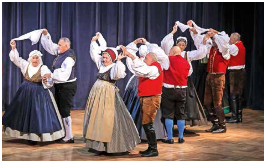
Bilo je nekoč in je še vedno – s folklorno skupino Folklornega društva Šenčur.

Konec oktobra so plesalke in plesalci v zrelih letih navdušili z dobro pripravljenimi koreografijami in ljudsko pesmijo ter s prikazom starih običajev občinstvo popeljali v nekdane čase, hkrati pa so dokazali, kako lepa so lahko leta v tretjem življenjskem obdobju. S sodelovanjem v folklorni skupini še posebno, bi dodali člani domačega Fol-