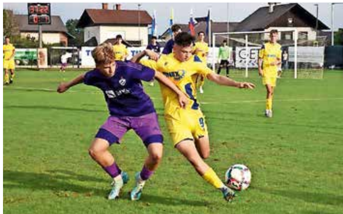
Šenčurski nogometaši nizajo uspehe.

Z dobrimi rezultati se lahko pohvalijo tudi mlajše ekipe, ki nastopajo na tekmovanjih pod okriljem MNZ Gorenjske. Vse mlajše selekcije od decembra naprej nastopajo na tekmovanju zimske lige. V Nogometnem klubu Šenčur se letos lahko pohvalijo s kar 16 ekipami – od najmlajših iz programa vrtec pa vse do članske ekipe – ter z več kot 300 člani društva, kar je največ uradno registriranih ekip in članov do sedaj.