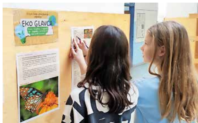
Letos smo akcijo poimenovali Ekoteden.

Letos smo akcijo poimenovali Ekoteden, saj smo aktivnosti načrtovali za vsak dan v tednu od 20. do 24. novembra. Projekt smo povezali s projektom Erasmus+, ki poteka na naši šoli. Ponedeljku smo namenili eko čvek, pri pouku smo se pogovarjali o ekoloških temah, si ogledali poučne videoposnetke, brskali po knjigah. V torek smo pri uri oddelčne skupnosti izvedli dejavnosti, kjer so učenci spoznavali okoljsko problematiko na različnih področjih, krepili občutek soodgovornosti in povezanosti med ljudmi. Učenci višjih razredov so tudi kritično razmišljali ter argumentirano izražali svoja mnenja in stališča. Učenci iz vsakega razreda so zapisali po štiri zanimivosti iz ekologije, ki smo jih poimenovali eko dejstva in jih izobesili v eko kotičku. V sredo smo izvedli eko kviz, ki smo ga poimenovali Eko glavca, in preverili znanje naših mladih eko nadobu-