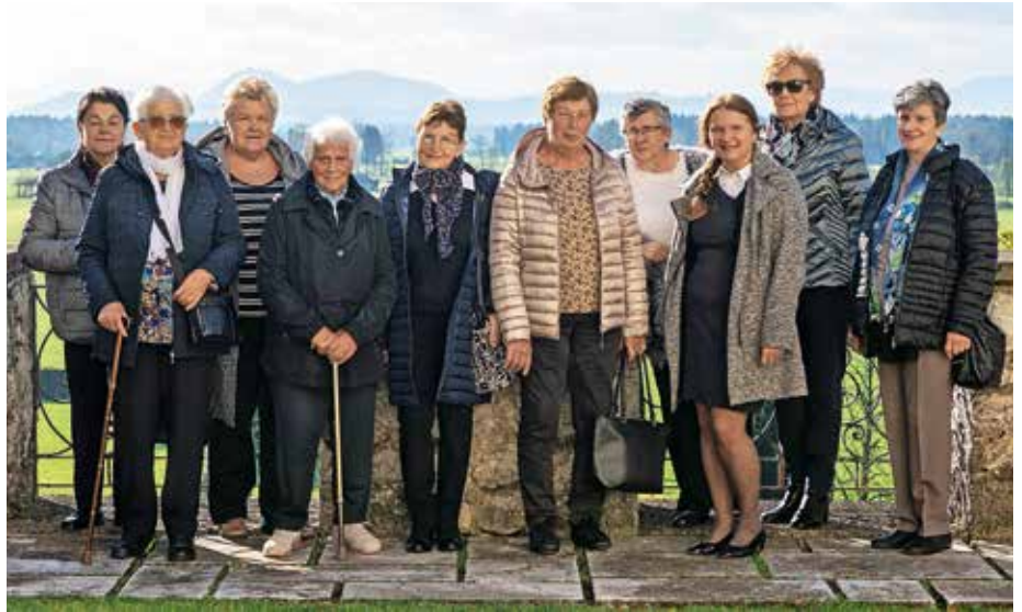
Skupina Koprive ob praznovanju desetletnice

Pravila skupine so jasna, nič politike in cerkve, pa tudi sosede bomo pustile na miru – in tega se držimo še danes. Tako nam ostajajo lastne teme, zgodbe, ki nam jih piše življenje, letni časi, naši najdražji, kdaj pa kdaj tudi vreme. Učimo se govoriti o sebi, o lepih in tistih manj lepih trenutkih, si dovolimo biti ranljive in ravno skozi ranljivost smo odkrile tudi moč ženske podpore. Postale