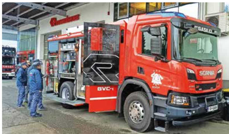
Gasilci PGD Šenčur so pred kratkim prevzeli novo vozilo, uradni sprejem in blagoslov bosta predvidoma v maju prihodnje leto.

Glede na obsežne naravne nesreče in številne požare je bilo leto precej stresno in nič kaj prijazno, zlasti ne za gasilce in pripadnike Civilne zaščite. Naj se jim ob tej priložnosti še enkrat zahvalim za njihovo požrtvovalnost in nesebično pomoč. Kar se tiče investicij, jih nismo uresničili toliko, kot bi si želeli. Ovirala so nas soglasja oziroma dejstvo, da jih nismo pridobili. Smo pa začeli graditi drsališče, ki so si ga občani dolgo želeli. Gradi se tudi Dom starejših Šenčur, ki bo velika