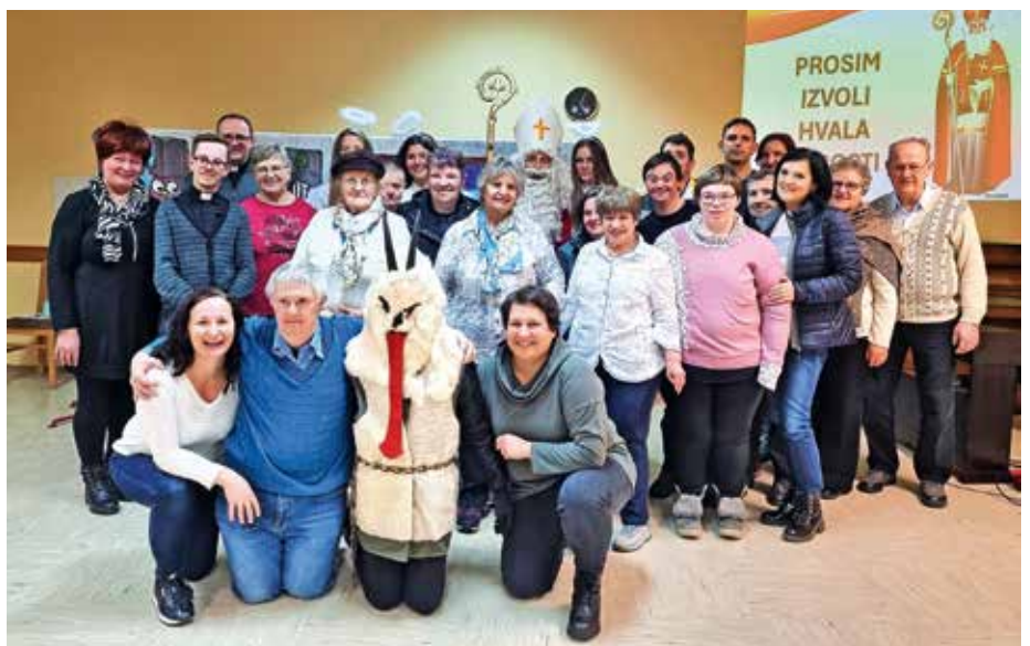
Miklavž je obiskal skupino Vera in luč

Oprosti, prosim, hvala, izvoli ..., ki se nam rade izmuznejo iz naših pogovorov. Skupaj z igralci smo priklicali Miklavža v spremstvu angelov in parkeljnov. To je mož ne le dobrote, tem-