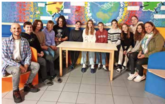
Učenci OŠ Šenčur pred slovensko-špansko steno