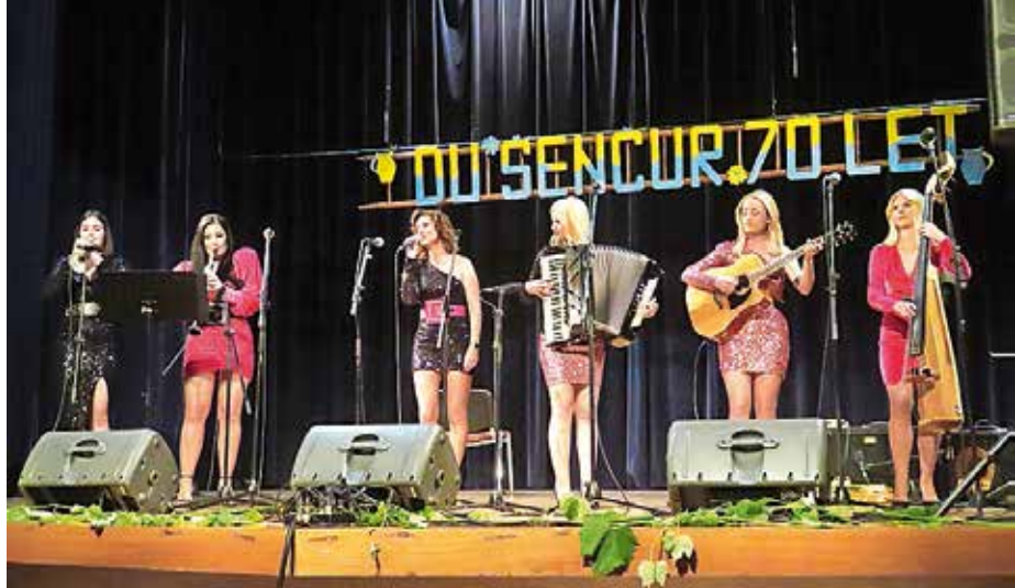
Skupina Ladies je navdušila šenčursko občinstvo.

Oktoberja je v Domu krajanov Šenčur potekal 14. koncert Šenčurska glasbena srečanja.