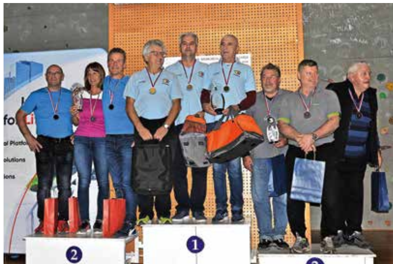
Prve tri ekipe na Memorialu Borisa Brezarja

Hkrati je potekalo še tekmovanje v metu v tarčo, na katerem so svoje prstometne spretnosti lahko preizkusili tako tekmo-