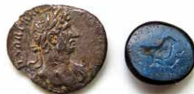
Rimski srebrnik in rimska gema

Na današnjem prostoru občine Šenčur je znanih tudi več mest, kjer naj bi stale rimske vile rustike. Vila rustika je sklop več stavb, obdanih z obzidjem, na večjem posestvu, ki je oskrboval s hrano vojsko in mesta. Na osnovi te rimske poseljenosti so rimske najdbe, ki ponazarjajo in razkrivajo tedanji čas in pomembnost. Med drugimi najdbami sta tudi rimski srebrnik in rimska gema, ki sta registrirana v Narodnem muzeju v Ljubljani. Na rimskem srebrniku je rimski cesar Hadrijan,