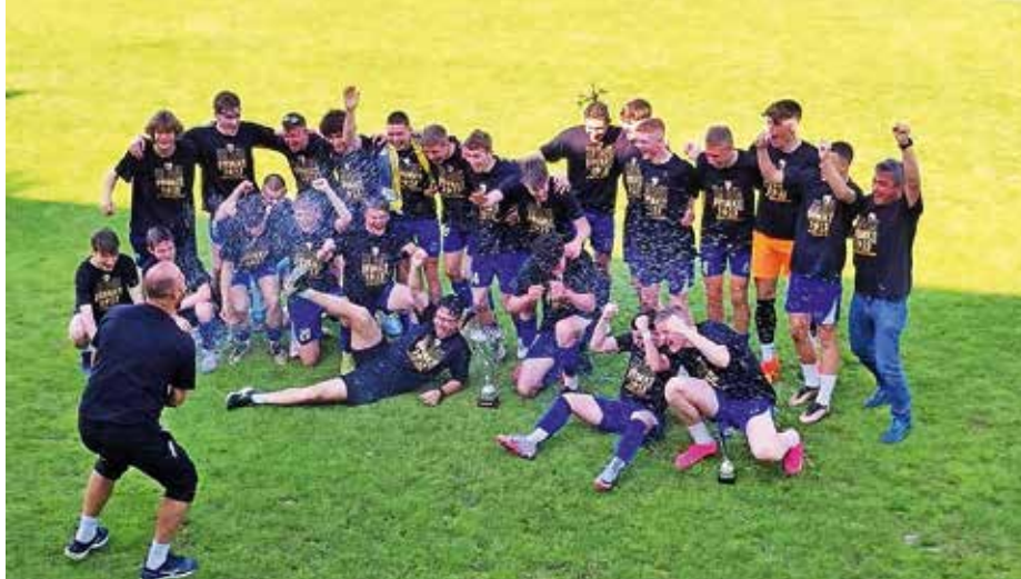
Ekipe kadetov je osvojila prvenstvo v drugi slovenski kadetski ligi.

Ekipe kadetov je zanesljivo osvojila prvenstvo v drugi slovenski kadetski ligi, kar pomeni, da bomo v športnem parku Šenčur v prihodnji sezoni spremljali najvišji državni rang tekmovanja za starejše dečke in kadete. Kadeti so v zadnjem krogu gostovali pri Dobu, ki je končal prvenstvo na drugem mestu, in remizirali z 1 : 1. Pred tem so dosegli neverjetnih 17 zaporednih zmag in so se na koncu z desetimi točkami prednosti uvrstili v prvo ligo. V prvi slovenski ligi pa bodo še naprej nastopali starejši dečki, ki so tudi tokrat presenetili in v 14-članski prvi ligi zasedli osmo mesto. Članska ekipa, ki je bila vse do zadnje-