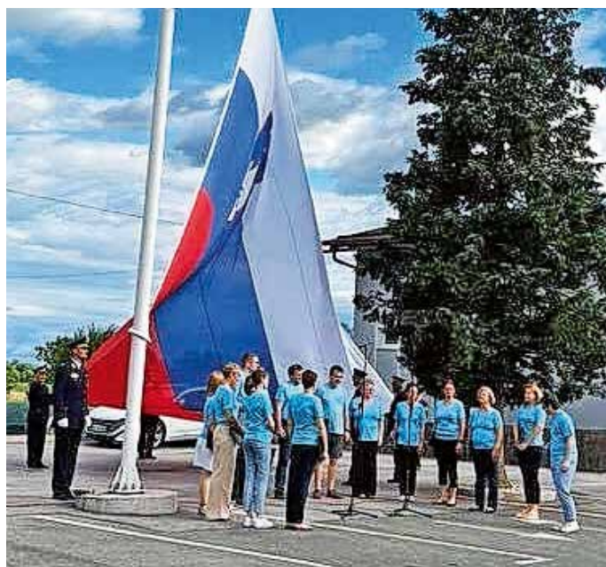
Obletnica dviga zastave v Hotemažah