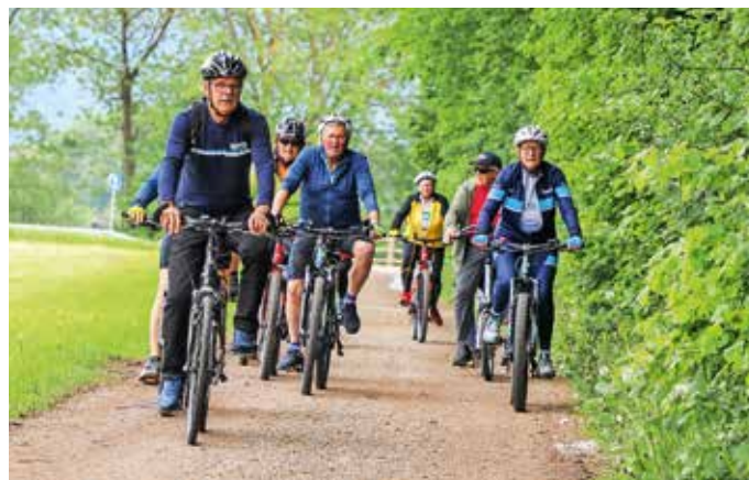
Nekateri so se odločili za skupinsko kolesarjenje

Udeležba je brezplačna, člani društva so poskrbeli tudi za brezplačno malico, poleg tega pa so izvedli nagradno žrebanje, v katerem so lahko sodelovali vsi, ki so z žigi dokazali obisk vseh kontrolnih točk. Glavno nagrado, gorsko kolo znamke