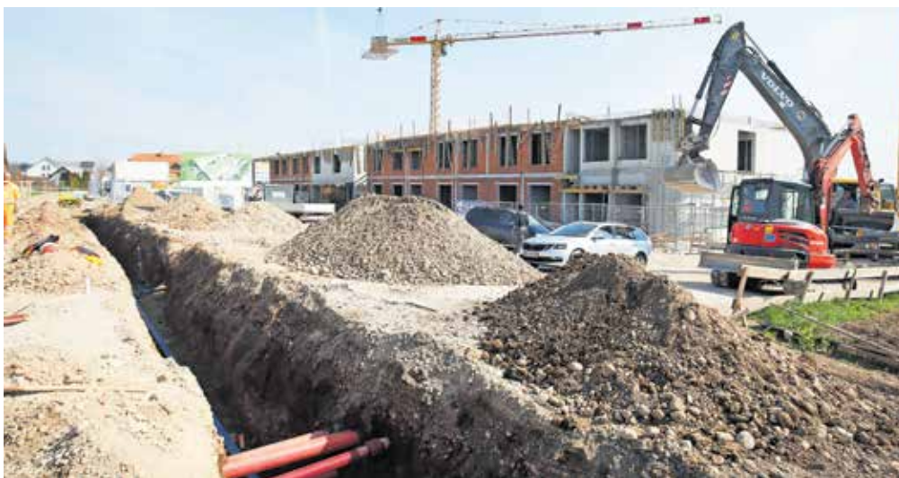
Na Weingerlovi ulici Občina Šenčur gradi vodovod in ustrezne priključke za potrebe Doma starejših Šenčur, ki že dobiva prve obrise svoje podobe.

Med osrednjimi investicijami, ki so trenutno v teku, je obnova treh cest, in sicer ceste Šenčur zahod, Šenčur–Britof in Weingerlove ulice. Na cesti Šenčur–Britof je že zgrajeno krožišče, v skladu s projektom bo urejen odsek na Partizanski ulici do novega krožišča, ki se bo povezoval z obstoječim priključkom Weingerlove ulice, ki bo prav tako obnovljen. Na omenjeni