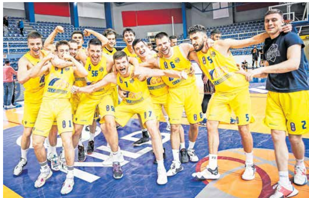
Članska ekipa Gorenjske gradbene družbe Šenčur

Trener Pavković je uvodno sezono lige ABA 2 pospremil z naslednjimi besedami: »Tekmovanje v ligi ABA 2 je nagrada za naš klub, ki je stabilen slovenski prvotigaš že nekaj let. To so tudi neprecenljive izkušnje za košarkarje, ki še niso imeli priložnosti igrati v regionalni ligi. V drugem delu lige se je razpoloženje popravilo, pa tudi samoza-