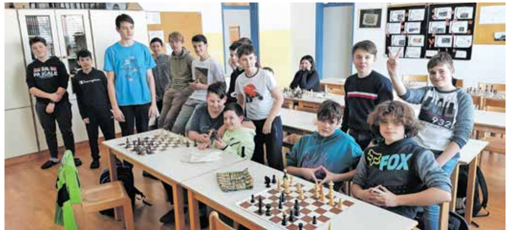
Učenci se na šahovskem krožku družijo vsak ponedeljek po koncu pete šolske ure.

pri vsem napisanem pomembni vztrajnost in vaja. Učenci se v šahovskem krožku družijo vsak ponedeljek po koncu pete šolske ure. V tem šolskem letu se še nismo udeleževali šahovskih tekmovanj, je pa naša skupna želja, da začnemo na tekmovanja hoditi v naslednjem šolskem letu. Kot skupina smo si zelo različni, tako po znanju igranja šaha kot po starosti, krožka se udeležujejo tako fantje kot dekleta. Družijo pa nas veselje do igranja šaha in komaj čakamo, da pride ponedeljek, ko se lahko družimo ob partijah.