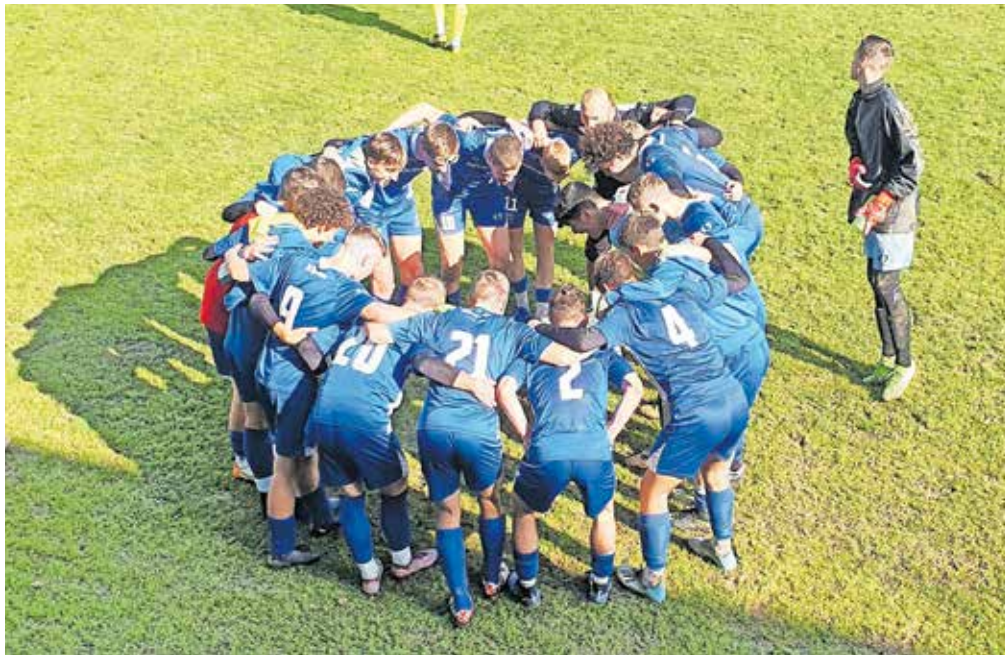
V Šenčurju igra nogomet skoraj 270 nogometašev.

Trenutno organizirano igra nogomet skoraj 270 nogometašev in ponosni smo, da se število povečuje iz dneva v dan. Nogometaši so razporejeni v 16 selekcij – starostnih skupin, tako da pokrivamo celotno nogometno piramido.