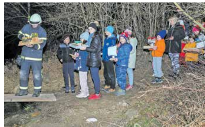
Gregorčke so spustili po reki Kokri.