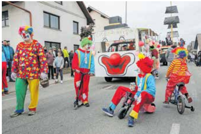
Godlarji so ohranili sloves največje pustne povorke na Gorenjskem.