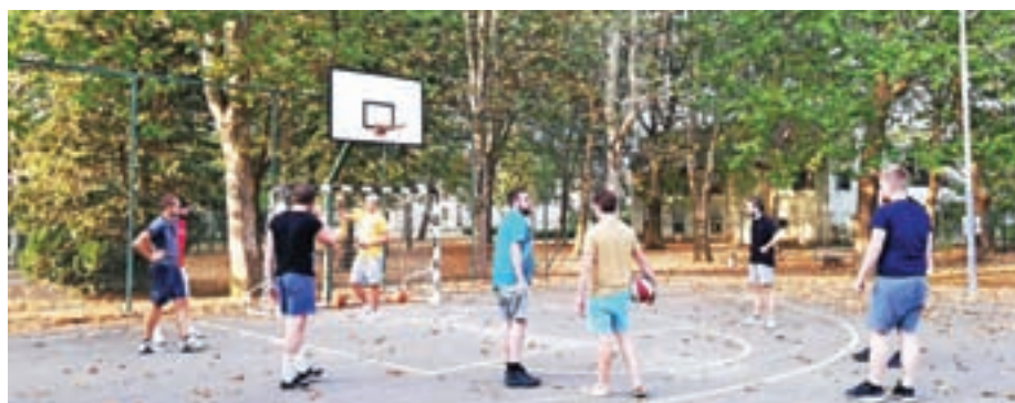
V Vogljah so poleti organizirali košarkarski turnir.