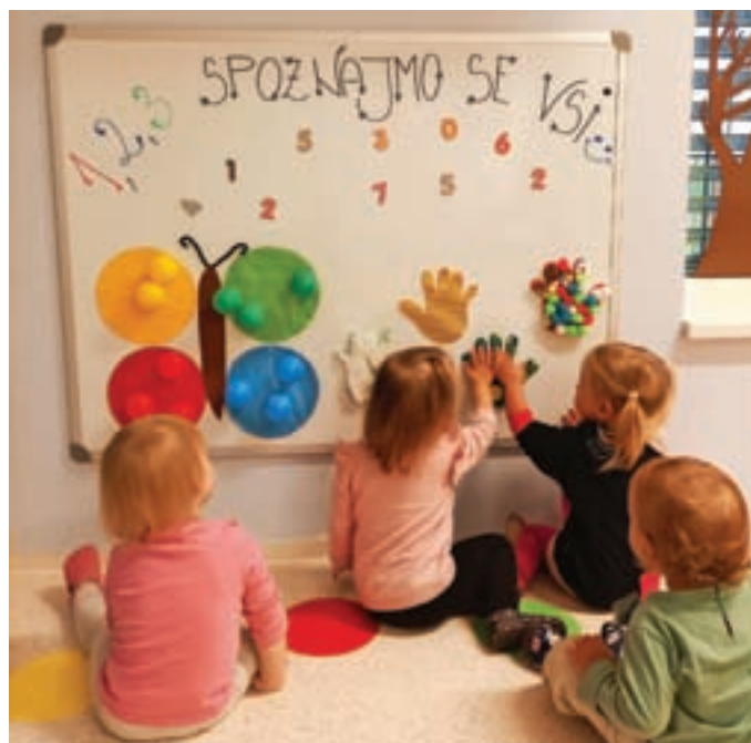
Spoznajmo se vsi.

Verjamemo, da nam v vrtcu ne bo dolgčas, saj naše prijazne vzgojiteljice skrbijo, da se male glavice ves čas podijo med pestrim dogajanjem. Poleg igranja, rajanja in ustvarjanja kot pravi umetniki nas bo v letošnjem vrtčevskem letu razveseljevala prav matematika. Ampak pozor! Ne ne, nismo še v šoli, nikar se ne ustrašite. Naša matematika je enostavna. S štetjem, razvrščanjem predmetov in spoznavanjem barv se lahko že kaj hitro pohvalimo, da je matematika naš vsakdan. A poleg matematičnih izzivov ne bomo pozabili na gibanje. Neizmerno uživamo v igri na našem igrišču, se sprehodimo