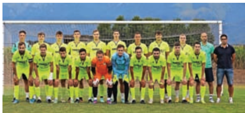
Šenčurški nogometaši so začeli novo sezono tekmovanj.

Tudi v letošnji sezoni nogometni klub Šenčur uspešno sodeluje z okoliškimi klubi. Tako v tekmovanju MNZ Gorenjske nastopajo skupne ekipe U14 Šenčur-Velesovo in U15 Šenčur-Preddvor ter pa ekipa U16 pod imenom Getris Velesovo-Preddvor. Vse ekipe so uspešno začele sezono in so v vrhu prvenstvenih lestvic. »Veseli nas, da so si vse ekipe, ki nastopajo v tekmovanjih NZS, izborile obstanek in da imamo tudi v tej sezoni visok nivo tekmovanj, kar je ne nazadnje tudi