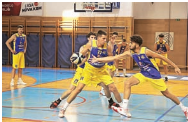
Članska ekipa je v zadnji sezoni prve slovenske lige zasedla tretje mesto.