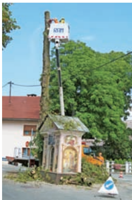
Lipo so odstranili.

Na Lužah so rasle tri vaške lipe. Te lipe so bile posajene s slovesnostjo ob takratnem državnem prazniku Kraljevine Jugoslavije, in sicer v čast trem sinovom kralja Aleksandra Karađorđevića in soproge kraljice Marije. Ena izmed lip je bila posajena v čast prestolonasledniku Petru, rojenemu leta 1923, druga v čast kraljeviču Tomislavu, rojenemu leta 1928, in tretja v čast kraljeviču Andreju, rojenemu leta 1929. Vrstni red poimenovanja lip ni znan. To mi je povedal moj pokojni oče, ki je s konjsko vprego slavnostne goste pripeljal z gradu Brdo. Ena lipa je rasla ob starem gasilskem domu in bila odstranjena ob izgradnji novega gasilskega doma. Druga lipa je rasla na križišču pred hišo Luže 46 (pred Alušnekom) in je bila odstranjena ob posodobitvi križišča. Tretja lipa pa je rasla sredi križišča cest Visoko-Cerklje-Olševke, tik ob vaškem znamenju iz leta 1856, na katerem je pritrjena spominska plošča vaščanom, padlim v prvi svetovni vojni. To znamenje je bil tudi kraj, kjer se je ustavila pogrebna povorka s krsto, kjer