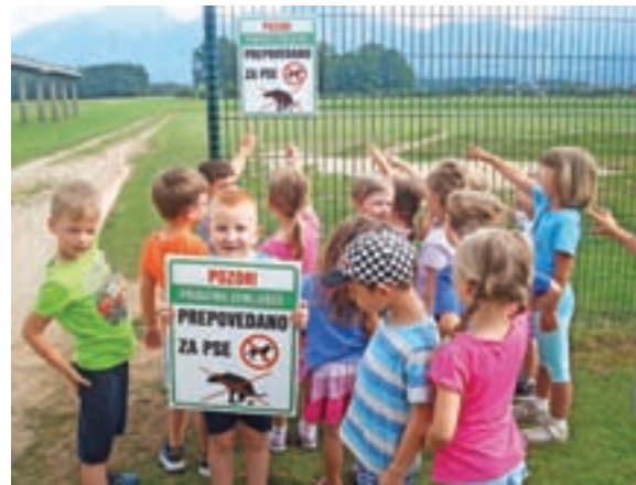
Otroci so postavili opozorilne table.

Odločili smo se, da postavimo table z opozorilom, da se lastniki s psi ne smejo sprehajati čez travnik, s čimer se je strinjala tudi lastnica. Na internetu smo poiskali primerna opozorila za table. Otroci so predlagali, da prvo postavimo na začetku travnika, drugo pa na koncu travniške poti. Kužki zaradi prepovedi prehoda čez travnik ne bodo