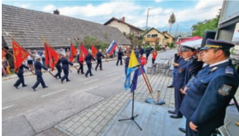
Parada gasilcev ob jubileju PGD Srednja vas