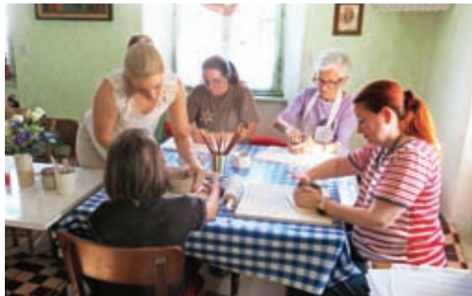
Na delavnici z glino