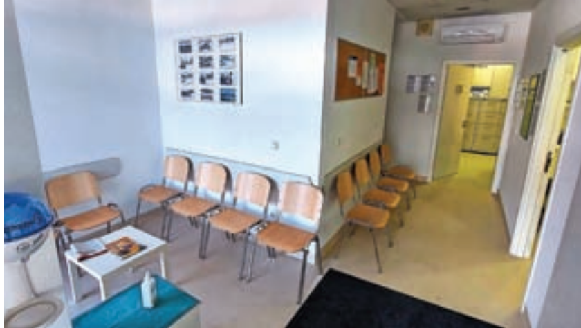
Nova tla v čakalnici šenčurskih ambulant