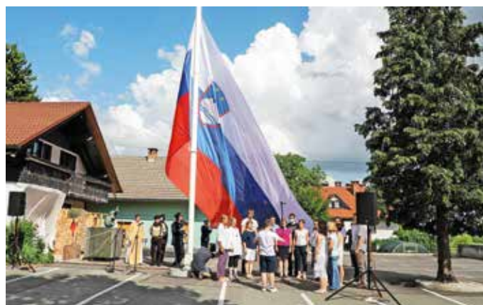
Slovesnost ob prvi obletnici dviga zastave