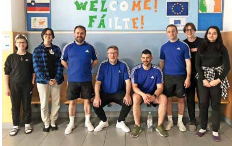
Na Osnovni šoli Šenčur so gostili pedagoške strokovnjake iz Irske.