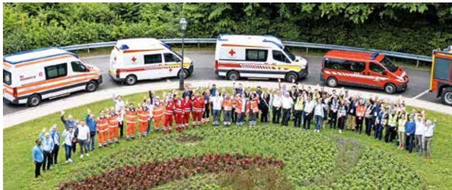
Mednarodno sodelovanje gasilcev PGD Visoko - Milje in DVD Kupinec