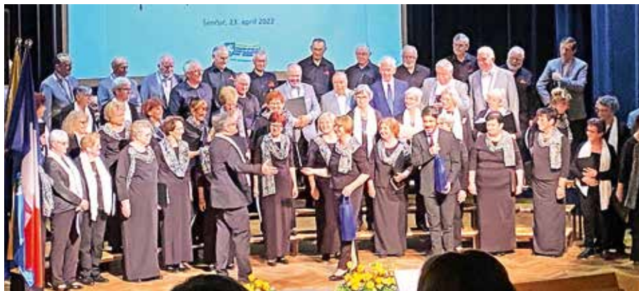
Pevci MePZ Društva upokojencev Šenčur in zbora Chorale Melodie