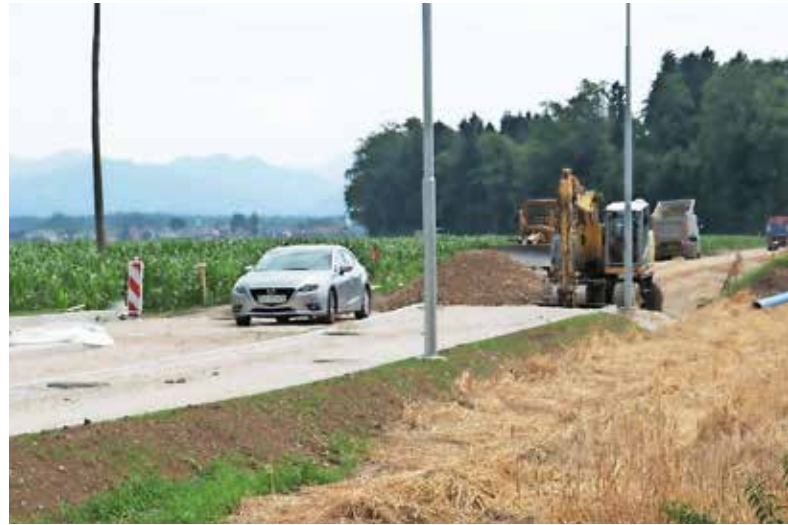
Rekonstrukcija lokalne ceste Voklo–Trboje, kjer bo v prvi fazi urejen odsek od naselja do gozda, bo predvidoma sklenjena v juliju.