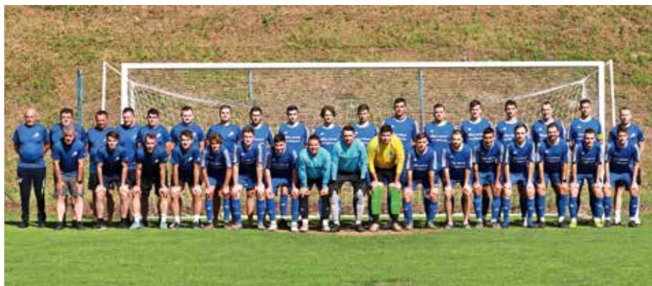
Nogometaši nogometne sekcije ŠD Visoko so gorenjski članski prvaki.