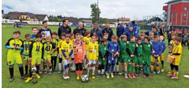
Nogometna sekcija Športnega društva Šenčur