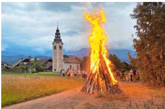
Kres ob vaškem prazniku na Lužah

Na predvečer goda vaškega zavetnika sv. Janeza Krstnika, na kresno noč, so na Lužah pripravili praznovanje vaškega praznika. V ta namen je bila v domači cerkvi sveta maša, ki so jo popestrili pevci in pritrkovalci. Pripravili so tudi kresovanje s kulturnim programom in družabnim srečanjem s pogostitvijo. M. L.