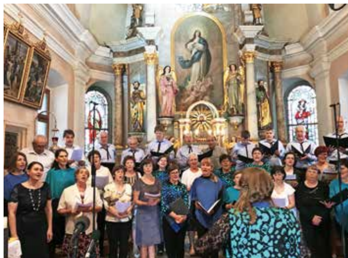
Slavnostni koncert Cerkvenega mešanega pevskega zbora Sveti Mihael