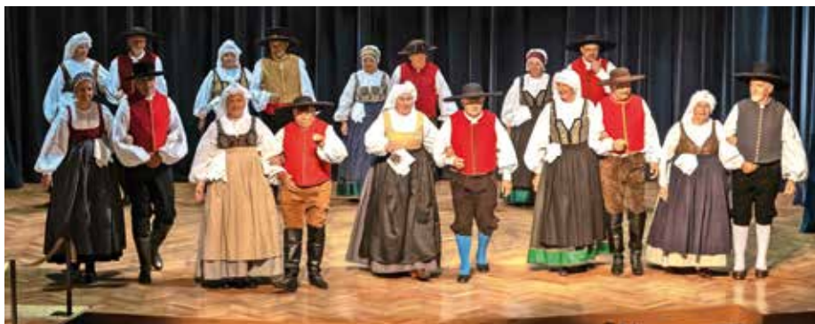
V Šenčurju so se predstavili člani Folklornega društva Šenčur.

Maja je v Šenčurju potekala tudi prireditev Šenčur folkloro na ogled postavi 2022, kjer so nastopili Šolska folklorna skupina Knofki, pevci Hiše čez cesto in Folklorno društvo Šenčur. Maja se je odvila tudi 24. Občinska revija odraslih pevskih zborov in vokalnih skupin občine Šenčur.