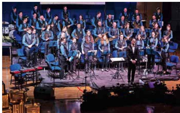
Slavnostni koncert ob jubileju Pihalnega orkestra občine Šenčur