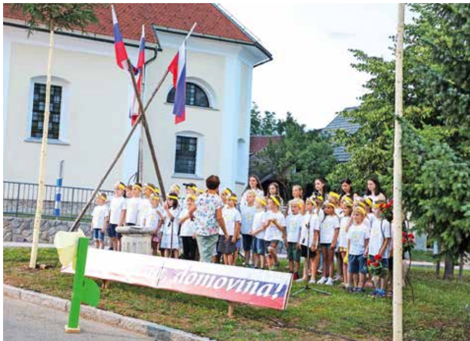
Osrednja občinska proslava ob dnevu državnosti v Vogljah