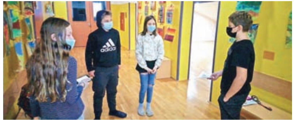
Pogovor z učenci

Iva: V naši družini hrano od kosila pogrejemo in jo pojedemo kasneje. Če pa je malo slabša, jo nesemo pujskom v bližnjo vas.