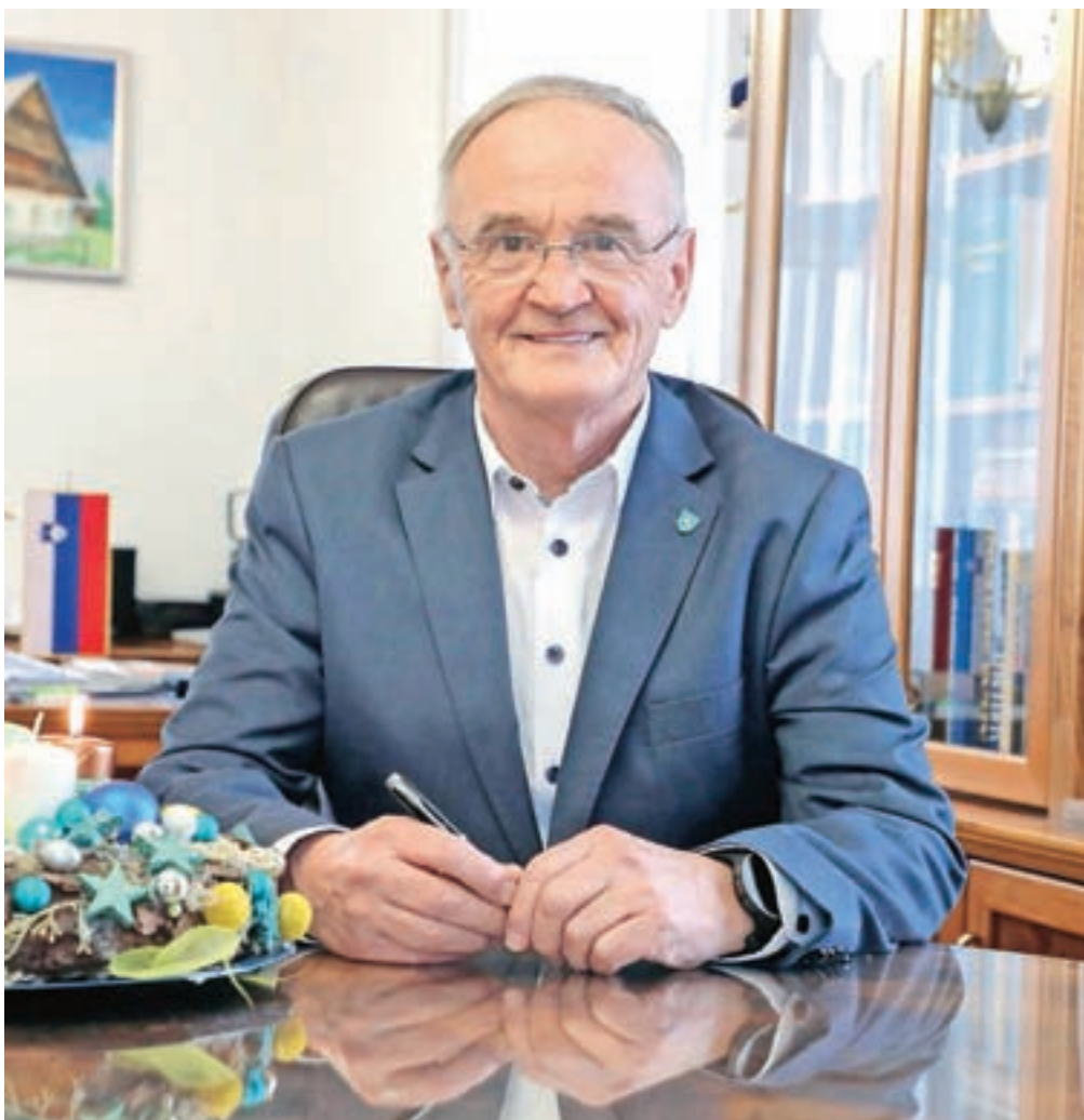
Župan Ciril Kozjek

Tudi šenčurski gasilci bi radi gradili gasilski dom, saj se vsi strinjamo, da je obstoječ premajhen. Vprašanje pa je, ali je smiselno, da ga gradimo na zdajšnji lokaciji, ali pa bi ga bilo bolje umestiti kam drugam. Treba je namreč razmišljati dolgoročno. Tako kot doslej pa bomo tudi v prihodnje podpirali gasilska društva.