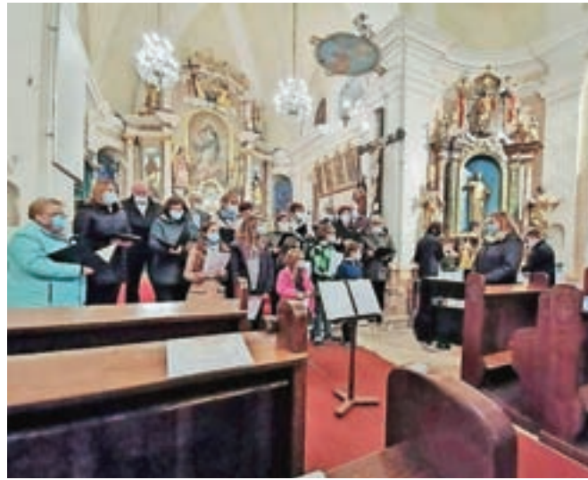
Koncert sta oblikovala Cerkevni mešani pevski zbor Sveti Mihael in Otroški pevski zbor Mladi upi.

"Začutili smo, da smo sicer maloštevilne gledalce nav-