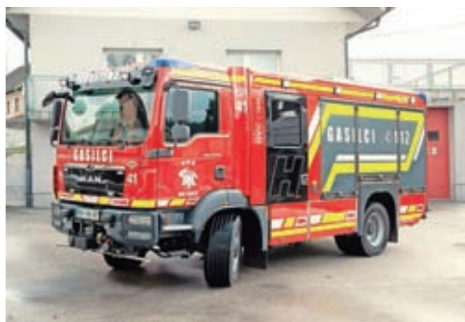
Novo gasilsko vozilo

Vaško gasilskega doma Hotemaže organizirani dve javni predstavitvi projekta nakupa GVC 16/25, ki pa sta bili sorazmerno slabo obiskani. To je botrovalo odločitvi, da se člani komisije poslužijo obveščanja »od vrat do vrat«. Več kot tri mesece so potekali delovni obiski gospodinjstev v Hotemažah, kjer je bil vaščanom podrobno predstavljen namen