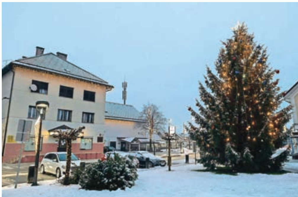
Šenčurski občani si v novem letu 2022 želijo zdravja in več medsebojnega razumevanja. Na fotografiji praznično okrašen center Šenčurja.

Zdravja si prav tako želi Marija Kranjec z Visokega. "Epidemiološki leti sta precej prikrajšali tudi kulturno dejavnost, zato si želim, da bi ta ponovno zaživela, da bi gledališča in druge kulturne ustanove odprla svoja vrata in delovala v polni meri. Posledično bi tudi sin in njegova žena lahko dobila več igralskih vlog. Družba bi bila lahko bolj strpna in razumevajoča; namesto da si mečemo polena pod noge, bi morali biti bolj solidarni eden do drugega," je dejala Kranjčeva in dodala: "Novoletnih zaobljub si ne postavim, ker se jih nikoli ne držim. Praznike običajno preživim v krogu družine." Četudi je po mnenju Jožeta Kerčmarja iz Hotemaž novoletna želja "srečnega in zdravega" že nekoliko izpepeta, pa je v epidemičnih časih