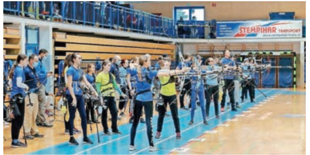
Lokostrelci so se pomerili v Šenčurju.

Šenčur – Lokostrelski klub Šenčur je v sodelovanju z Lokostrelsko zvezo Slovenije konec novembra organiziral državno prvenstvo v dvoranskem tarčnem lokostrelstvu, ki je štel tudi za svetovno dvoransko serijo (IWS). Kljub omejitvam zaradi epidemije se je tekmovanja v športni dvorani v Šenčurju udeležilo 181 tekmovalcev. "Domačih tekmovalcev je letos deset, kar je nekaj manj kot prejšnja leta, ko je na domačih tekmah sodelovalo tudi dvajset ali trideset naših članov. Poleg tega, da se kakšen od članov kluba tekmovanju odreče zaradi organizacijskega dela, je največji razlog za manjšo domačo udeležbo epidemija, zaradi katere opazamo upad zanimanja predvsem