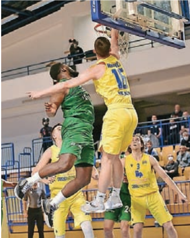
Članska ekipa (v rumenih dresih) nastopa odlično.

"V zahvalo smo se odločili, da vsem občanom omogočimo ogled košarkarske tekme prve slovenske lige, s kuponom za brezplačni ogled tekme (ob izpolnjevanju pogoja PCT), ki ga najdete na tej strani," še doda-