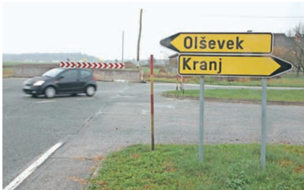
Nedokončan odsek bodo začeli graditi v prihodnjem letu.

Investicija, ki jo v celoti financira država, je ocenjena na 5,3 milijona evrov. Gradnja se bo začela predvidoma takoj po končanem postopku za izbiro izvajalca del, predvidoma spomladi prihodnje leto. Čeprav gre za državno investicijo, pa so bili v postopke ves čas vključeni tudi predstavniki lokalne skupnosti, na čelu z Občino Šenčur. »Z župani okoliških občin smo se trudili, da bi pridobili čim več manjkajočih soglasij lastnikov zemljišč, in si ves čas prizadevali za čimprejšnji začetek projekta,« je pove-