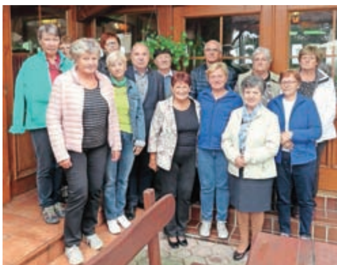
Zaupniki projekta starejši za starejše

Zaradi slabih zdravstvenih razmer skupnega srečanja prostovoljcev društev upokojencev PZDU Gorenjske v letošnjem letu ni bilo mogoče organizirati. Srečanje je bilo treba razdeliti na več skupin. Tako so se v začetku oktobra srečali v Cerkljah prostovoljci iz Društva upokojencev (DU) Šenčur in DU Cerklje, ki so si izmenjali izkušnje dela na terenu ter ugotavljali in predlagali nove zasnove dela. Srečanja se zaradi zadržkov ni udeležil koordinator za