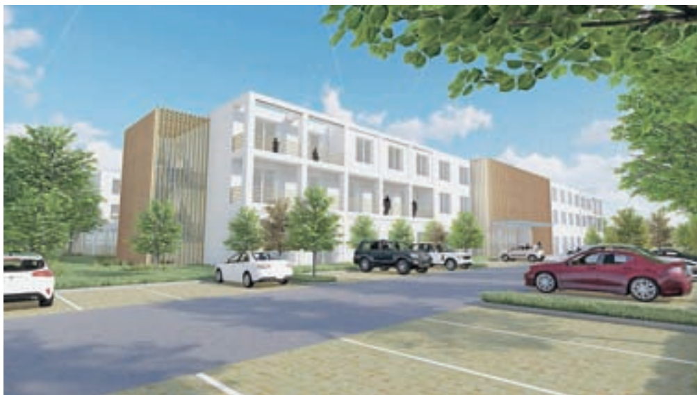
V Šenčurju bodo zgradili sodoben dom starostnikov.