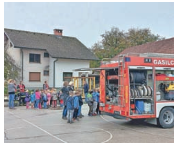
Gasilci na obisku

Učenci so si v mehurčkih po skupinah lahko ogledovali različne postaje, ki so jih zanje pripravili gasilci: prikaz gasilske opreme in tehnike, ki služi za gašenje požarov, pri poplavih in reševanju po potresu; na ogled so bili tudi gasilski avtomobili.