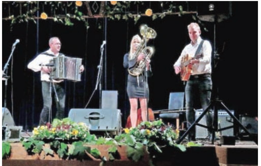
Navdušil je tudi Trio Denisa Novata.

Hišni ansambel Avsenik je znova dokazal, da gre za uveljavljen ansambel z dol-