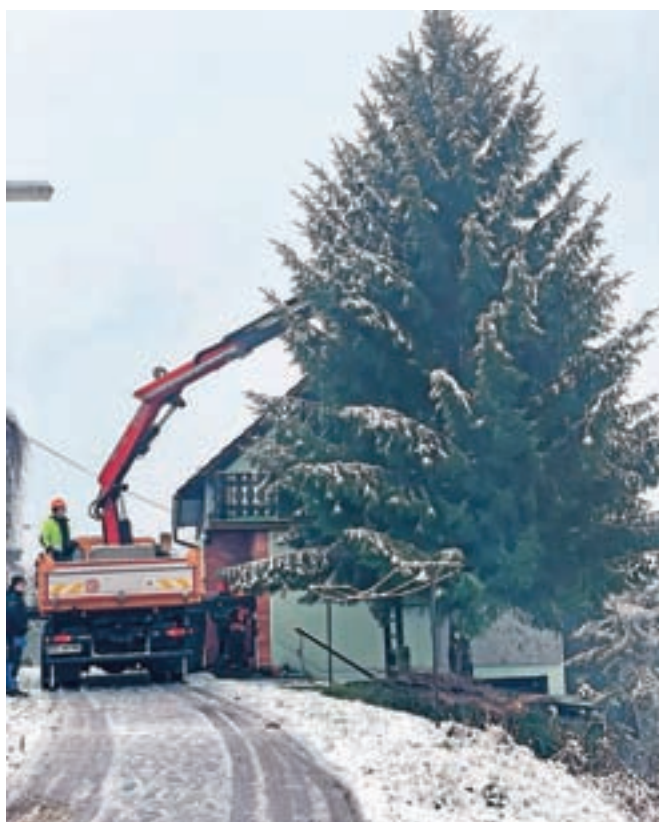
Podiranje smreke na Prebačevem