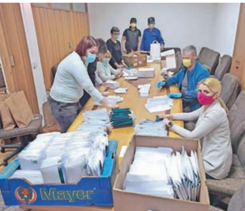
Delo z zaščitnimi maskami

Res je, da je naše največje letališče zaprto in ni preletov nad Šenčurjem, kar nas veseli, po drugi strani pa so na letališču tudi zaposleni iz občine Šenčur, želimo si tudi nadaljnega razvoja letališča. Tako denimo z občinami Cerklje, Kranj, Vodice, Komenda in Škofja Loka sodelujemo z letališčem pri skupnem projektu na prometnem področju. Ta čas pa je tudi manj prometnih tokov skozi občino, kar je dobra novica. Vsi skupaj si pa želimo čimprejšnjo odpravo ukrepov ter vrnitev v normalne tirnice življenja.