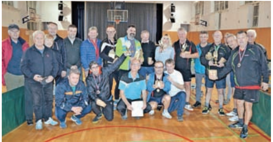
Udeleženci decembrskega namiznoteniškega turnirja ekip, kjer si je domača ekipa Šenčur delila tretje mesto z ekipo Stara Fužina - Podnart