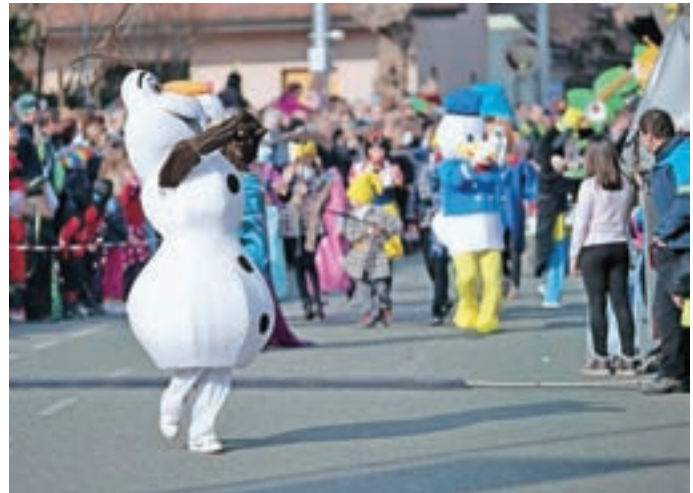
Jubilejno, trideseto pustno povorko Godlarjev so zaznamovale tudi otroške teme in pravljичni junaki.

"Erjavec nam je žal predčasno ušel iz politike, a v Šenčur je vseeno prišel. Prah sta dvignila Jelinčič in Monika. V rekordnem času nam je uspelo skozi Šenčur speljati tudi drugi tir,