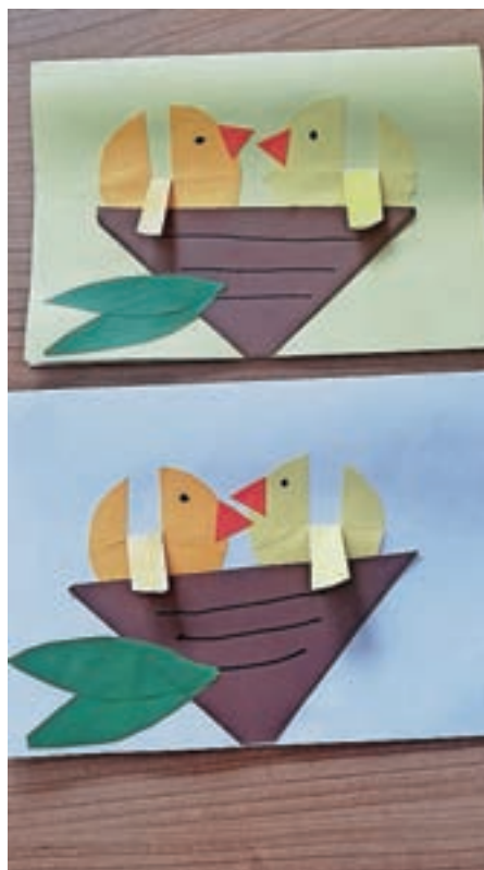
Voščilnica; Ula Osojnik