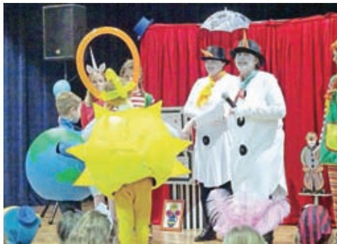
Utrinek z letošnjega otroškega pustovanja