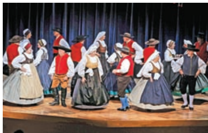
Folklorna skupina Folklornega društva Šenčur