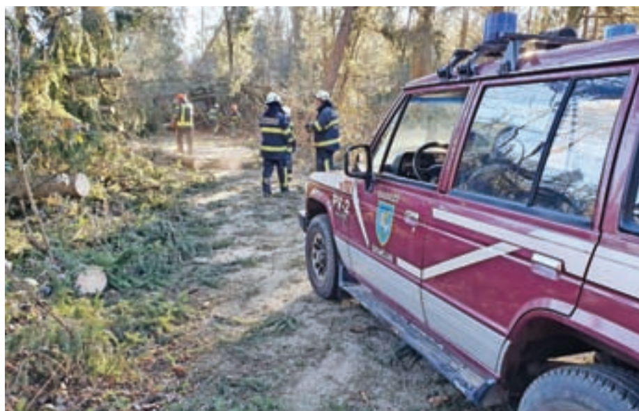
Gasilci pri odstranjevanju posledic vetroloma

TOMAŽ LANIŠEK, POVELJNIK PGD ŠENČUR MATEJ REGINA, POVELJNIK OBČINSKEGA GASILSKEGA POVELJSTVA