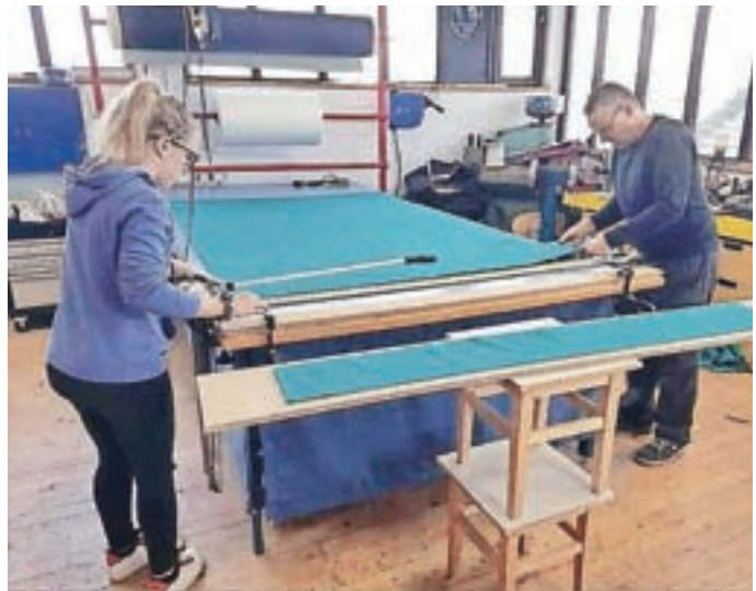
Blago za maske so razrezali na ustrezne dimenzije

najemnike poslovnih prostorov, ki so v lasti Občine Šenčur, oprostimo najemnine za obdobje od 15. marca in 30. aprila. Apeliramo tudi na druge pravne in fizične osebe, naj v zvezi z najemninami v tem obdobju ravna enako.