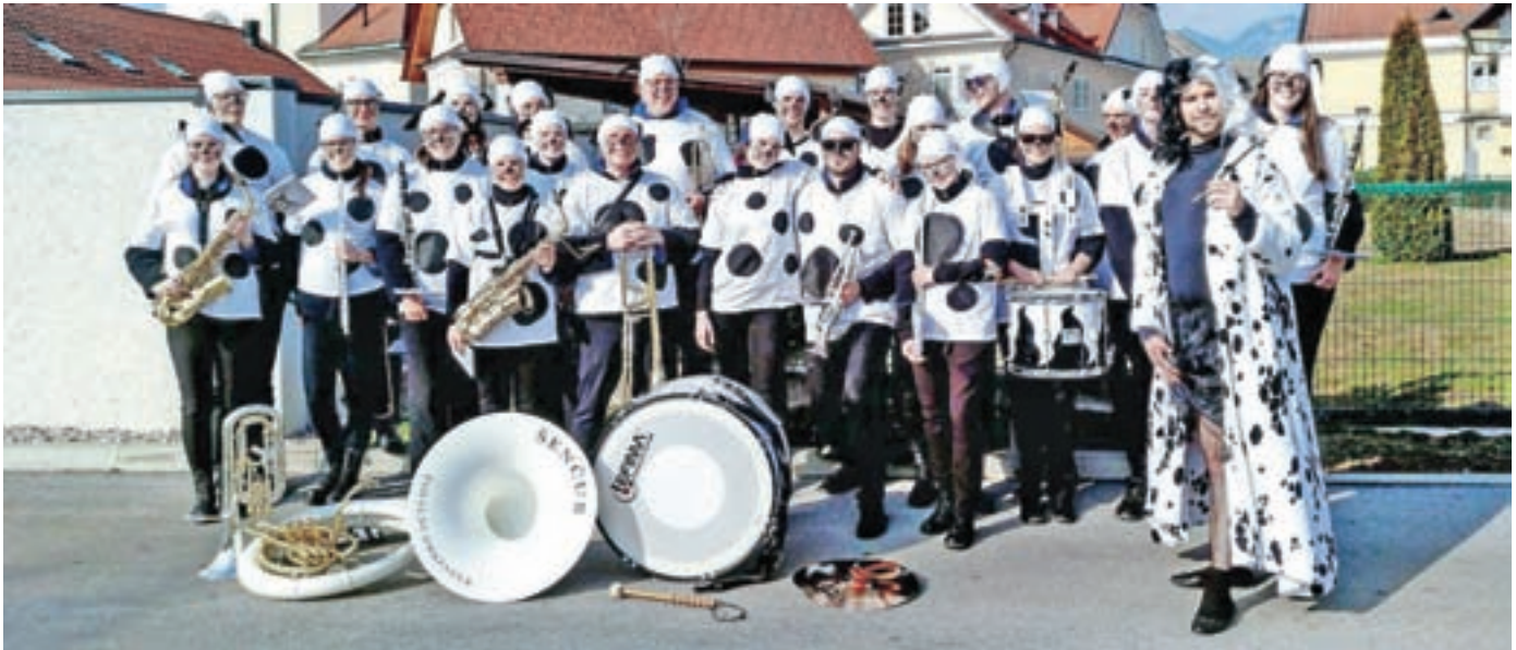
Godbeniki v skupinski maski 101 dalmatincec

Pihalni orkester občine Šenčur letos praznuje osemnajsto leto delovanja. Trenutno so vse naše aktivnosti ustavljene, kar pa ne pomeni, da nismo nekaj zanimivih projektov že izpeljali.