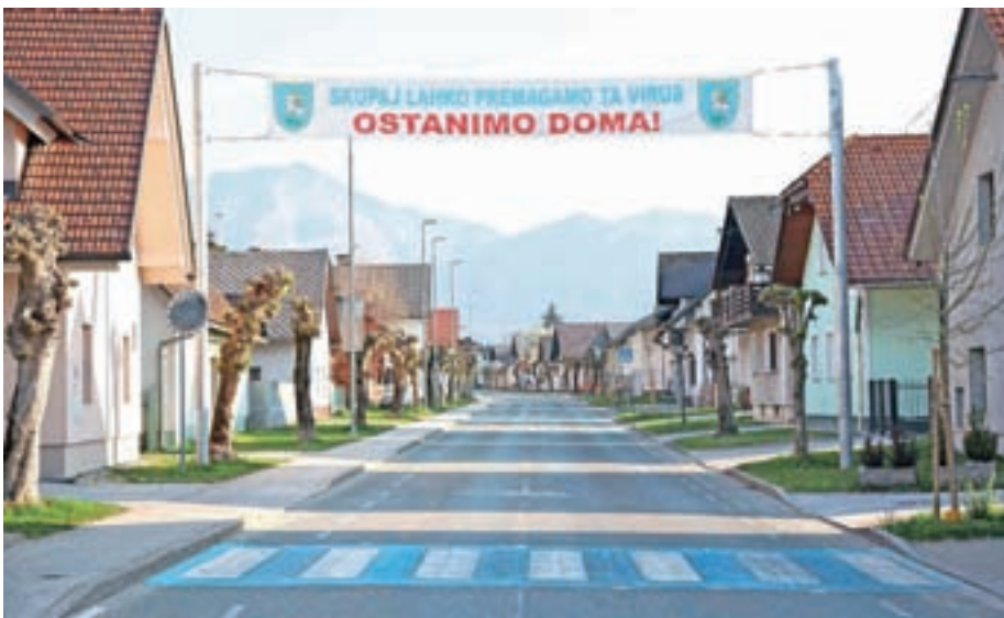
Za vse velja: #ostanimo doma

Kot vsi drugi se poskušam izogibati neposrednim stikom. Pri nujnih odhodih od doma vsi uporabljamo zaščitno opremo in poskušamo ostati zdravi.