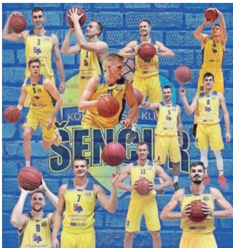
Člani KK GGD Šenčur