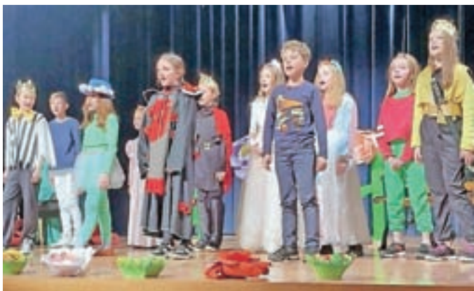
Z otroške ljubezenske igrice Modra vrtnica.