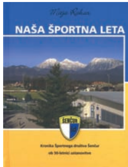
Naslovnica zbornika Naša športna leta