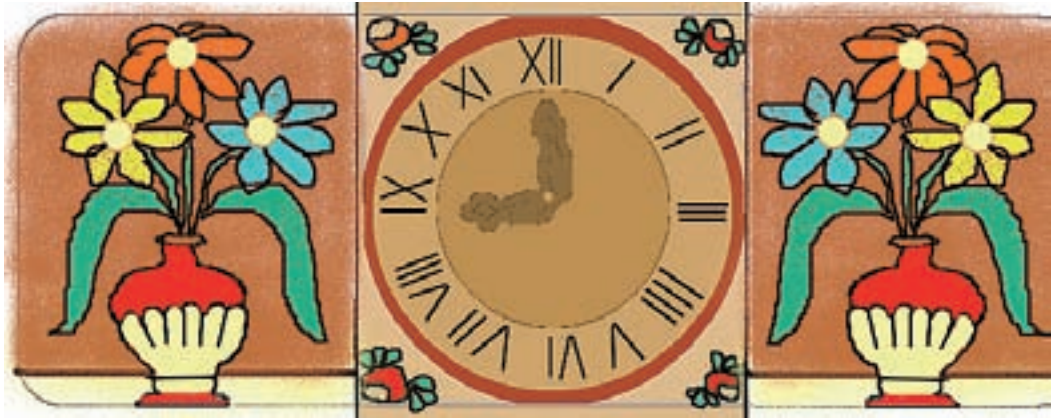
Prizadevni učenci so izdelali veliko izvirnih panjskih končnic, da bo čebelicam lepo v čebelnjaku.

Nadarjeni učenci so napenjali svoje možgane v sobotni šoli; delovni fantje pa so se udeležili občinske očiščevalne akcije skupaj s starši. Učenci 8. in 9. razreda so že realizirali tehnične dneve. V polnem razmahu so tekmovanja iz ZGO, FIZ, GEO, KEM, MAT, SLO - seveda že na področni oz. republiški ravni. Predavatelji Rdečega križa so izvedli zelo uspela predavanja: Varna vožnja s kolesom, Preventivni ukrepi ob morebitnem srečanju z drogo, Reševanje konfliktnih situacij in Torbica prve pomoči. Učenci 6. razreda so si ogledali mesto Škofja Loka in