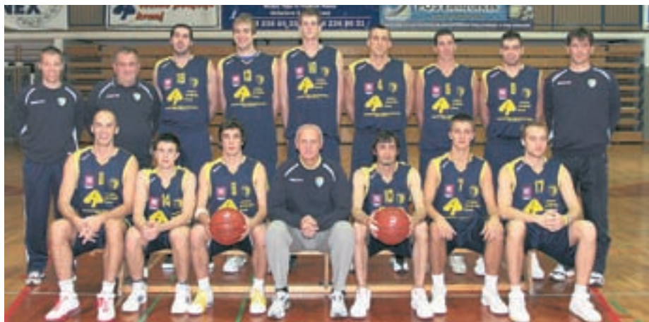
Košarkarska ekipa Šenčurja CP Kranj je prvo sezono v 1. B ligi končala na petem mestu.

V klubu bodo tudi vnaprej glavno pozornost namenjali delu z mladimi, postavili pa so si tudi tekmovalne cilje. Za prihodnjo sezono ostane večina sedanjih igralcev, pogovarjajo pa se tudi za morebitne okrepitve. ”Ob tem se želimo zahvaliti vsem sponzorjem in pokroviteljem, predvsem pa občini Šenčur in Cestnemu podjetju Kranj, za vso pomoč in sredstva, s ka-