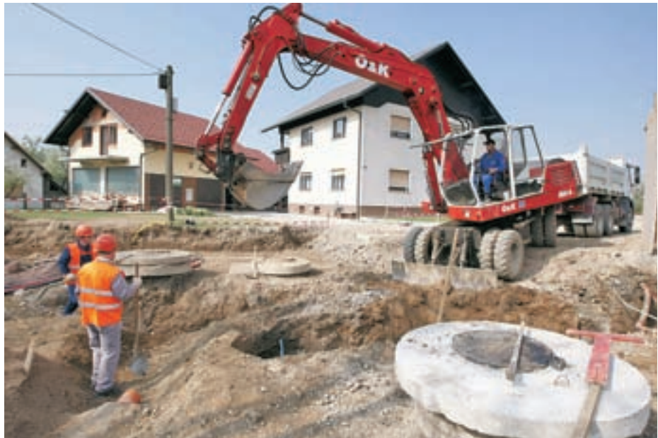
Obsežna gradbena dela v Vogljah bodo zaključena avgusta.

Občina Šenčur se je prijavila tudi na razpis Agencije za kmetijske trge in razvoj podeželja za sofinanciranje ureditve vaškega jedra v