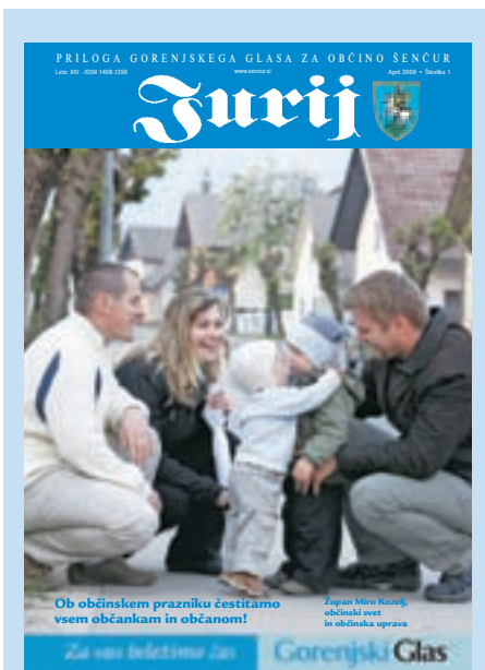
Na naslovnici: Utrinek iz Šenčurja

JURIJ (ISSN 1408-1350) je priloga Gorenjskega glasa za občino Šenčur. Prilogo pripravlja Gorenjski glas, odgovorna urednica Marija Volčjak, urednik priloge Simon Šubic, fotografija Gorenjski glas. Oglasno trženje Mirjam Pavlič, 031/698-627. Priprava za tisk Gorenjski glas, d.o.o., tisk: SET, d.d., Vevče. Jurij številka 1 je priloga 30. številke Gorenjskega glasa, 17. aprila 2009, dobijo pa jo vsa gospodinjstva v občini Šenčur brezplačno. Naklada: 2.850 izvodov.