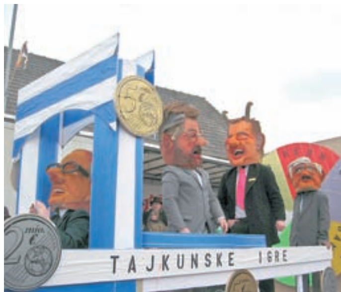
Tajkuni so igrali na prav posebno ruleto.