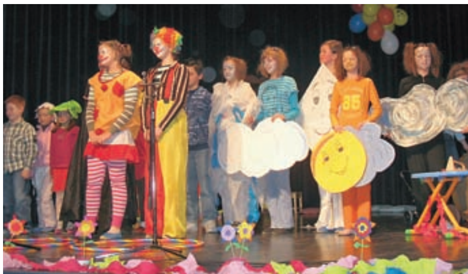
Ob materinskem dnevu so predstavili zgodbo o klovnih, v katero so vpletli tudi glasbeno pravljico.

Enkrat na mesec, v soboto dopoldne, organiziramo tudi dvourne brezplačne otroške ustvarjalne delavnice. Delavnic se vsakič udeleži od 10 do 15 otrok, ki ustvarjajo z različni-