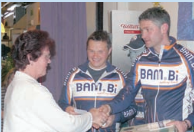
Zasluzeno priznanje za pohodniško transverzalo

Društvo je najbolj prepoznavno po kolesarski dejavnosti in po tradicionalno zanimivi BAM.Bi pohodniški transverzali. Poleg tega se je ŠD BAM.Bi izkazal tudi kot odličen organizator športnih prireditev na najvišji državni ravni. Najbolj odmeven je kolesarski vzpon za kralja in kraljico Krvavca, ki bo letos na sporedu v soboto, 20. junija. Več kot 400 evidentiranih članov je vključeno v različne aktivnosti na rekreativni in tekmovalni ravni. Na tekmovalnem področju je v tem obdobju potrebno izpostaviti 47 naslovov državnih prvakov in tri medalje s svetovnih prvenstev ter eno zlato medaljo z evropskega prvenstva.