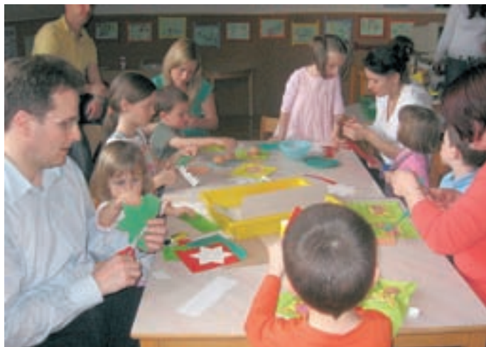
Utrinek s srečanja s starši

Poletje se že bliža z velikimi koraki, zato smo z mislimi že pri zaključku šolskega leta, kar za nas pomeni zaključek projektov (Unicef, Bralni nahrbtnik, Glasbeni nahrbtnik, Knjigobube, Zlati sonček, Ciciban planinec, Žabja šola kašlja ...). Vključili smo se tudi v mednarodni projektu Pomladni dan, ki letos poteka na temo ljubezni. Pripravljamo izdelke za likovni natečaj in prispevke za plesni natečaj. Čisto ob koncu šolskega leta pa bodo potekali še zaključni izleti znotraj posameznih skupin,