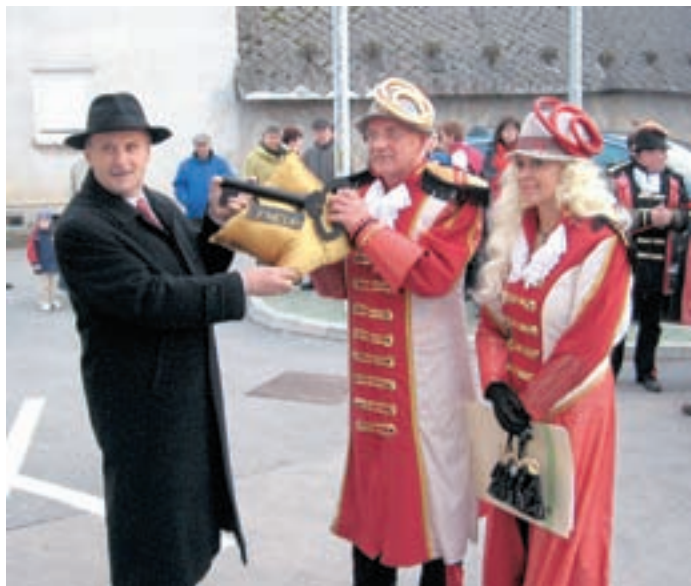
Predaja občinskega ključa godlarskemu princu in princesi

Franci Erzin, foto: Franci Erzin in Tina Dokl