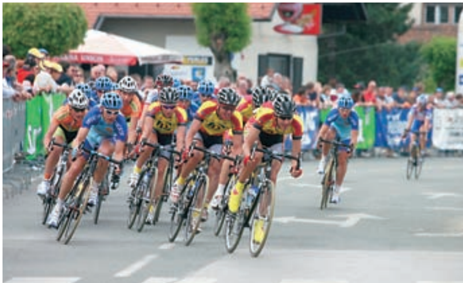
Kolesarska dirka po ulicah Šenčurja je vedno zanimiva za gledalce.

Kriterij po ulicah Šenčurja se je v desetih letih že dobro uveljavil v slovenskem kolesarstvu, dobro pa so ga sprejeli tudi gledalci, ki se vedno v lepem številu zberejo na šenčurskih ulicah. "Naša dirka je za gledalce zelo zanimiva, saj kolesarji velikokrat pripeljejo mimo njih, dodatno pa jo popestrijo tudi leteči cilji. Zanimiva je tudi trasa kroga; start in cilj je pred okrepevalnico Alo-Alo, dirka pa bo potekala po Pipanovi, Beleharjevi, Stružnikovi in Velesovski cesti," je razložil Kozjek. Kriterij se bo na dan upora začel ob 15. uri z dirko mlajših mladincev (21 krogov) in starejših mladincev (30 krogov), nazadnje pa bodo po