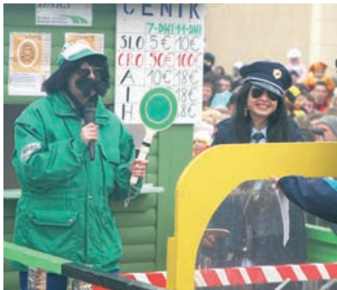
Hrvatom so prodajali pregrešno drage vinjete.