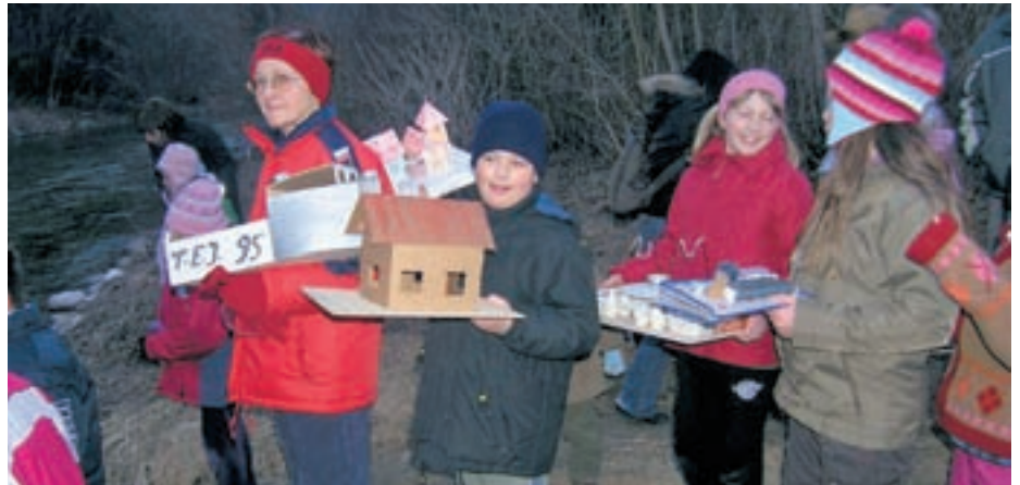
V Hotemažah so že tretje leto zapored "vrgli luč v vodo".

Že tretje leto zapored so "vrgli luč v vodo". Otroci so izdelali "gregorčke" (ladjice), katere je bilo mogoče dva dni občudovati na razstavi v Domu vaščanov in gasilcev Hotemaže. Ocenjevalna komisija je imela zelo težko delo pri izboru najboljših treh gregorčkov, še najbolj pa jih je prepričal grad, prepleten z bršljanom. S