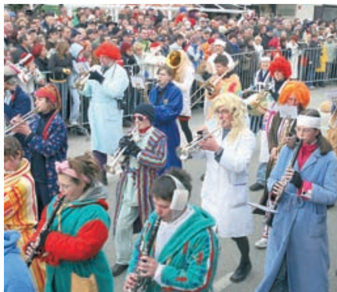
Tudi godbeniki so se oblekli pustu primerno.