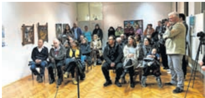
Kulturni praznik v DPD Svoboda