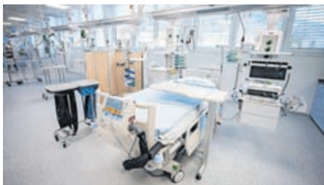
Novi prostori so pomembna pridobitev za vse gorenjske paciente in omogočajo optimalno oskrbo za kritično bolne in poškodovane.