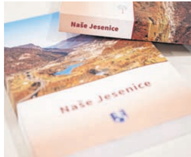
Knjiga Naše Jesenice