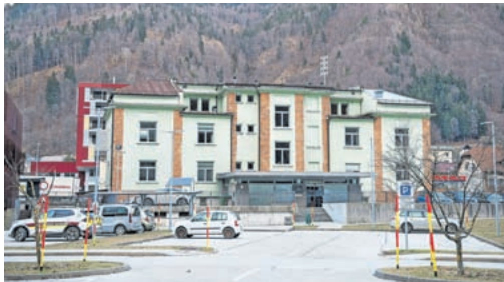
Letos mineva 95 let, kar je kralj Aleksander trg Jesenice skupaj s Plavžem in Savo razglasil za mesto.

V sklopu praznovanja bo tudi letos potekal tradicionalni Jožefov sejem, in sicer od sobote, 16. marca, do torika, 19. marca, na Stari Savi. Uradno odprtje sejma bo v