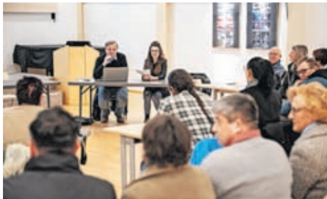
Predstavniki društev so izrazili kar nekaj pomislekov glede prvotne ideje mreže.

izhaja iz potrebe po organiziranju prostovoljstva, še posebej v situacijah, kjer so ljudje želeli pomagati, vendar niso vedeli, kam se obrniti. V okviru mreže naj bi delovala tudi prostovoljska pisarna s sedežem na Jesenicah, kamor bi se potencialni prostovoljci lahko zatekli