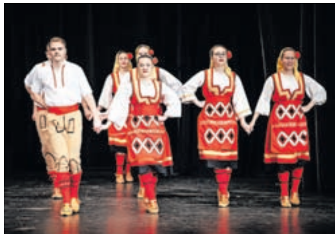
Odrske postavitve z bogatim programom folklornih plesov in glasbe je predstavilo osem skupin.