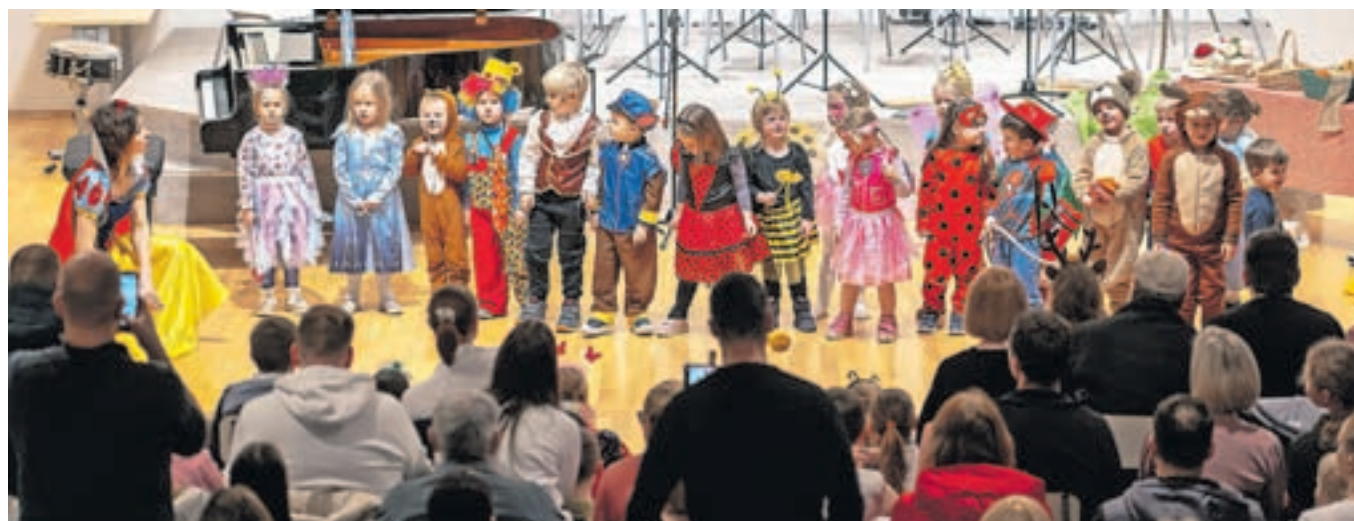
Glasbeni vrtec na pustnem nastopu / FOTO: GREGOR VIDMAR

bene pripravnice, učenci prvega in drugega razreda baleta, godalni orkester, komorne zasedbe in solisti. Učitelji pa so pripravili zanimivo pustno dramatizacijo in jo vpletli med glasbene nastope.