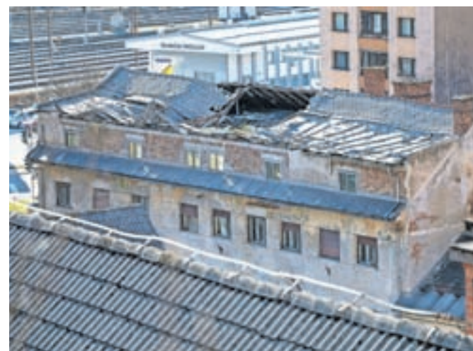
Konec lanskega leta se je ob deževju vdrla tudi streha, kar je stanje stavbe, ki stoji v Centru 2, najbolj gosto poseljenem delu Jesenic, še poslabšalo.

Stanovalci, ki živijo v bližini opuščenega Hotela Pošta sredi Jesenic, že dalj časa opozarjajo, da je objekt nevaren. Pred meseci se je ob močnem deževju celo ugreznila streha, kar je stanje stavbe, ki stoji v Centru 2, najbolj gosto poseljenem delu Jesenic, še poslabšalo.