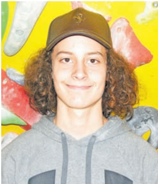
Maj Travnik

Z letošnjim začetkom sem res zadovoljen, saj sem bil na obeh tekmah Zahodne