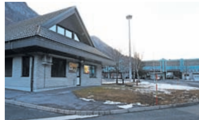
Po načrtih naj bi poslovno stavbo podjetja Conditus odstranili.