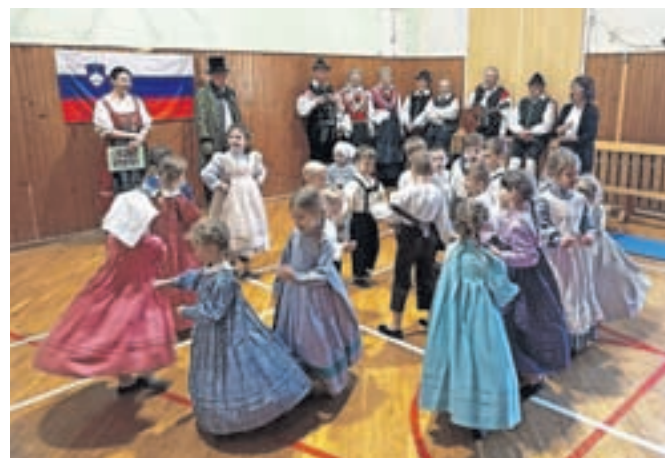
V vrtcu na Koroški Beli je bilo ob osmem februarju razigrano.

V enoti Vrtca Jesenice na Koroški Beli se vsako leto v februarju, mesecu kulture, spomnijo na največjega slovenskega pesnika dr. Franceta Prešerna. Letos so strokovne delavke otrokom predstavile njegov lik in zasluge pri krepitvi narodne zavesti in kulturne identitete. Prebirale so njegove pesmi, s pomočjo različne literature ter avdio in video tehnike so spoznavali njegovo življenje in čas, v katerem je živel. Otroci so poslušali ljudske pravljice in plesali ob slovenski ljudski glasbi. Posebej prisrčno in razigrano je izzvenel program na prireditvi v počastitev slovenskega kulturnega praznika z nastopi šestih oddelkov enote vrtca. Vrtčevska folklorna skupina Jabčki je pripravila ordrsko postavitev Jaz pa grem na zeleno travco, kot gostje so zaplesali člani Folklorne skupine Juliana Kulturno-športnega društva Hrušica.