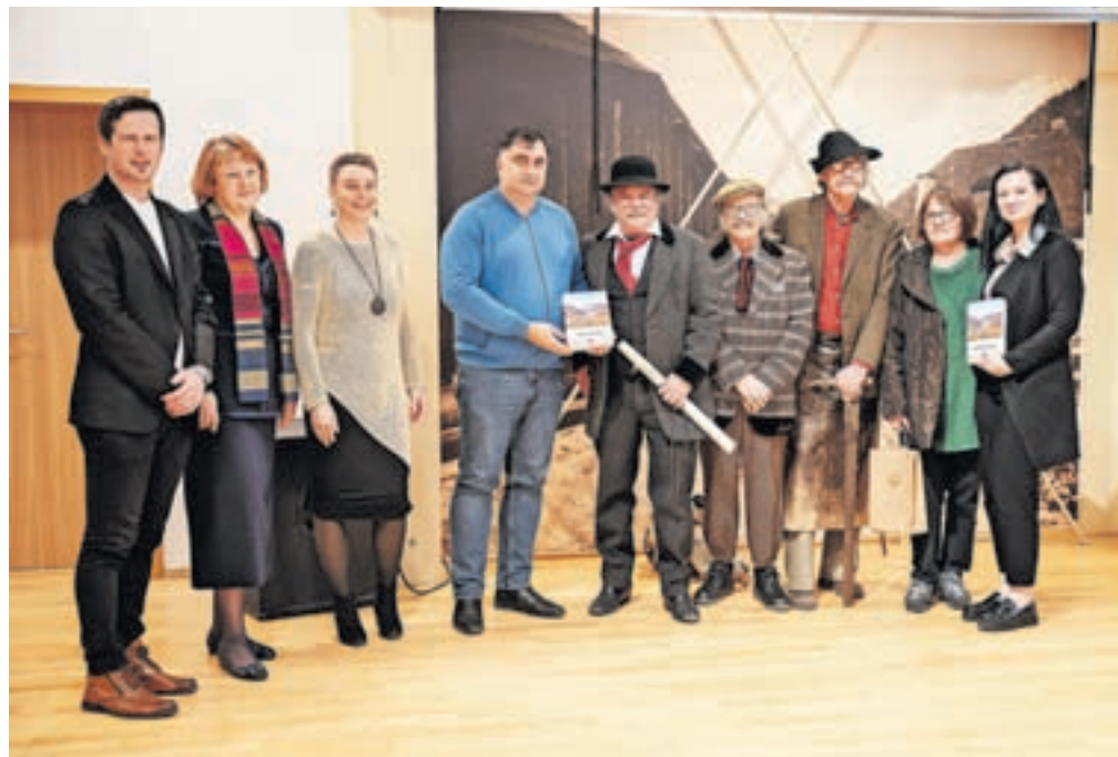
Sodelujoči na predstavitvi knjige z županom

Potem ko je predlani nastala v elektronski verziji, je knjiga Naše Jesenice zdaj izšla tudi v tiskani obliki. Predstavili so jo v Kolpernu na Jesenicah. Kot so povedali snovalci, gre za knjigo, ki so jo napisali Jeseničani. V njej so na 374 straneh zbrane zgodbe Jeseničanov o tem, kako so živeli nekoč. Te so nastale na osnovi pripovedovanj domačinov na študijskih krožkih v sklopu projekta Raziskovanje kulturne dediščine v lokalni skupnosti, ki so zapisana tudi v knjižnicah z naslovom Kako so včasih živeli. Zbrane zgodbe krajanov so združili z zapisi lokalnih zgodovinarjev, etnologov, arheologov in drugih poznavalcev krajevnih zgodovine. Tako knjiga združuje že zapisano zgodovino mesta s spomini in življenjskimi zgodbami njegovih prebivalcev. Obogatili so jo z izborom starih fotografij, ki so jim ponekod dodali današnje vzporedne podobe.