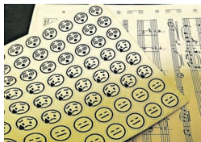
Z lepljenjem emotikonov so učenci ocenjevali pripravo, izvedbo in počutje.

po njenih besedah plod sinergije celotnega kolektiva. Da je resnično šlo za skupinsko prizadevanje, kaže že dejstvo, da so prav vsi člani kolektiva opravili posebna izobraževanja, kjer so pridobili še dodatna znanja in veščine, povezane s premagovanjem strahu pred nastopom.