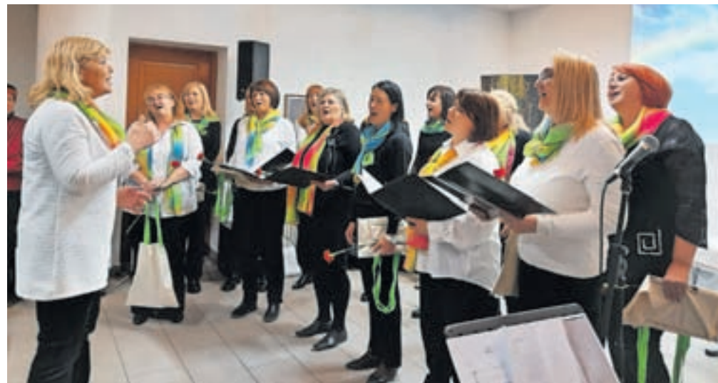
Ženski pevski zbor Mavrica Jesenice med nastopom v Ukvah v Kanalski dolini