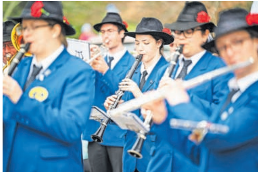
Tema letošnjega kviza je 150-letnica Pihalnega orkestra Jesenice - Kranjska Gora in 95-letnica mesta Jesenice.

V sklopu praznovanja občinskega praznika pa pripravljajo tudi spletno obliko kviza, ki bo objavljen na spletni strani Občine Jesenice (na elektronski povezavi www.jesenice.si/kviz ), in sicer v tednu od 14. do 20. marca, in bo namenjen vsej zainteresirani javnosti. Na spletni strani Občine Jesenice bo tudi gradivo z informacijami, ki bo v pomoč pri reševanju kviza.