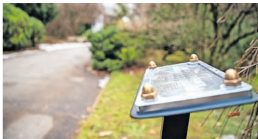
Manjkajoča drevesa in grme v Spominskem parku bodo posadili glede na preostale gravirane ploščice in načrt parka.

V Neodvisni listi Za boljše Jesenice so dali tudi pobudo glede Spominskega parka. »Projekt označitve dreves in grmovnic v jeseniškem Spominskem parku je zaključen. A iz objave na Facebooku profilu enega od uporabnikov smo zasledili, da je ostalo nekaj neporabljenih, a že graviranih kovinskih ploščic. Ne bomo se spuščali v to, da je bil morda