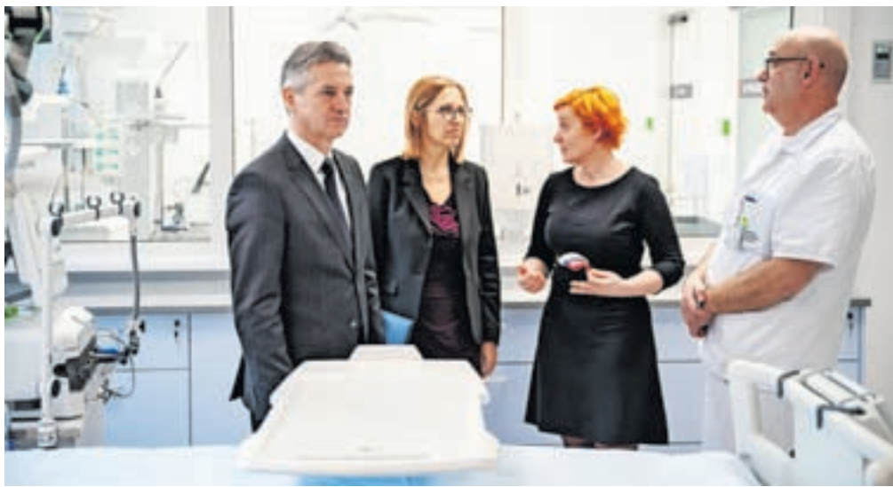
Tudi premier Robert Golob in ministrica za zdravje Valentina Prevolnik Rupel sta izrazila zadovoljstvo nad novo pridobitvijo jeseniške bolnišnice.

Investicijo v gradnjo prizidka je v zadnjem času vodil