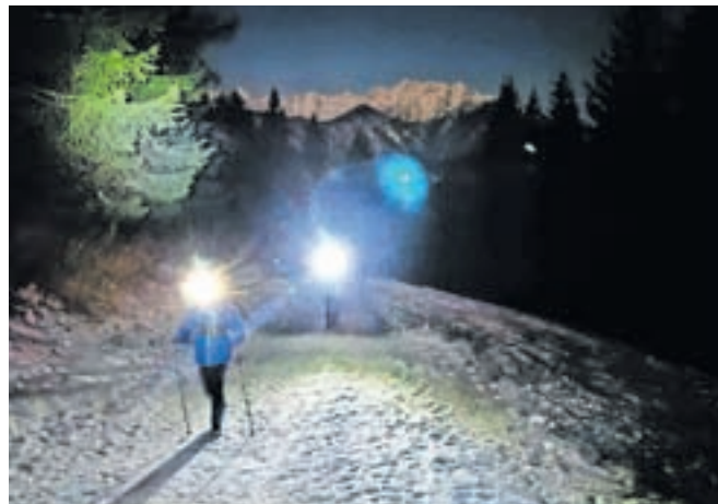
Pohod ob prvi januarski polni luni je posebno doživetje.