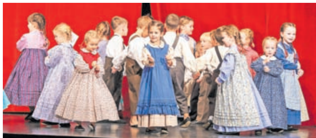
Otroška folklorna skupina Jabčki je poskrbela za kar nekaj vzdihljajev navdušenja in razneženosti.