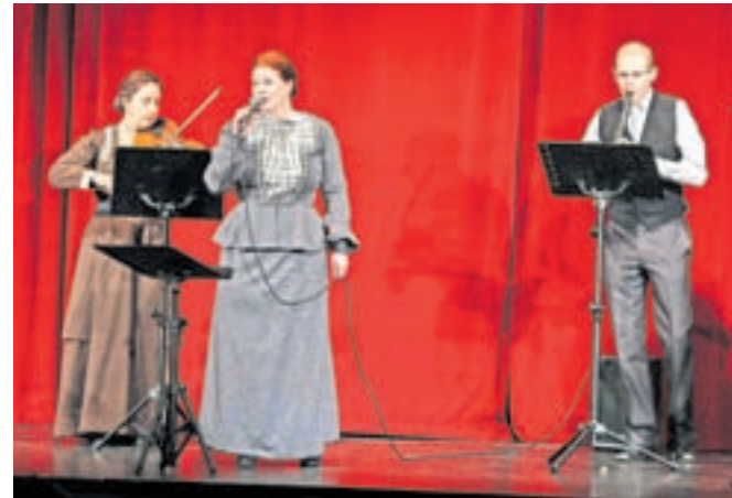
Suhe hruške so pripravile prijeten glasbeno ter tudi plesno obarvan večer. Njihov cilj pa je bila dobra volja.

koledniško vsebino, medtem ko so v drugem delu godci izvajali bolj zabavne ritme, vključno z nekaj popevkami. Šolar je poudaril, da je njihov repertoar osredotočen na ljudske in narodnozabavne zvoke, včasih pa presenetijo tudi z nečim posebnim. Koncert je poleg godcev, »oboroženih« s harmoniko, violino,