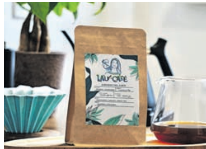
Kavo sta poimenovala Lau Café, kar v prevodu pomeni Laurina kava, na embalaži pa je podoba Laure, ki jo je narisal njen brat.

»kofetarica«, v Kolumbiji po navadi pijejo kavo na način »tinto«, medtem ko si pri nas kavo pripravlja na različne načine, od espresa, filter kave do tako imenovanega french pressa. Nad kolumbijsko kavo pa se je navdušila tudi Tonijsva mama, ki jo običajno pripravi na klasičen način, po turško.