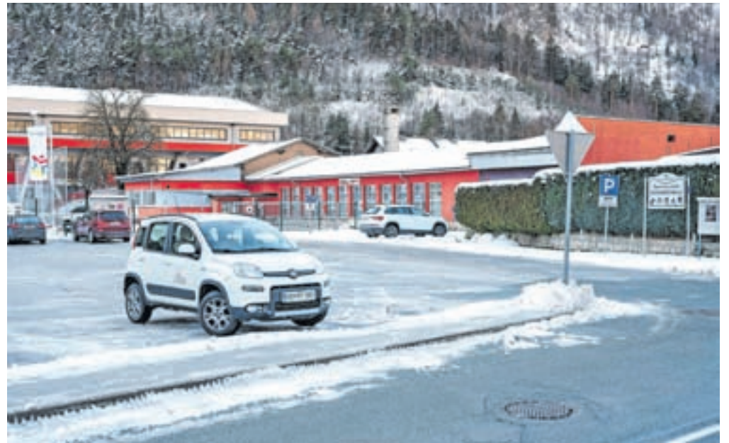
Parkirišče pred Športnim parkom Podmežakla naj bi v prihodnje postalo plačljivo.

Občinski svetniki so začeli tudi obravnavo predloga, po katerem bi parkiranje na asfaltiranem parkirišču pred Športnim parkom Podmežakla postalo plačljivo. Gre za parkirišče za osebna vozila pred zapornico ob vstopu v park, ki je v upravljanju Zavoda za šport. Kot so pojasnili v občinski upravi, je namenjeno uporabnikom Športnega parka Podmežakla, od pomladi do jeseni pa ga kot izhodiščno točko množično uporabljajo kolesarji, ki se po daljinski kolesarski povezavi odpravijo proti Kranjski Gori. Svoja osebna vozila pustijo na parkirišču večji del dneva, s tem pa zasedajo parkirni prostor, namenjen uporabnikom športnega parka. Zato so pripravili predlog novega parkirnega režima, občinski svetniki pa so v razpravi