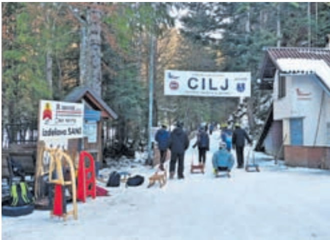
Naravno sankališče Savske jame

zati po spletni banki. Progo sicer urejajo povsem prostovoljno, prispevke pa porabijo