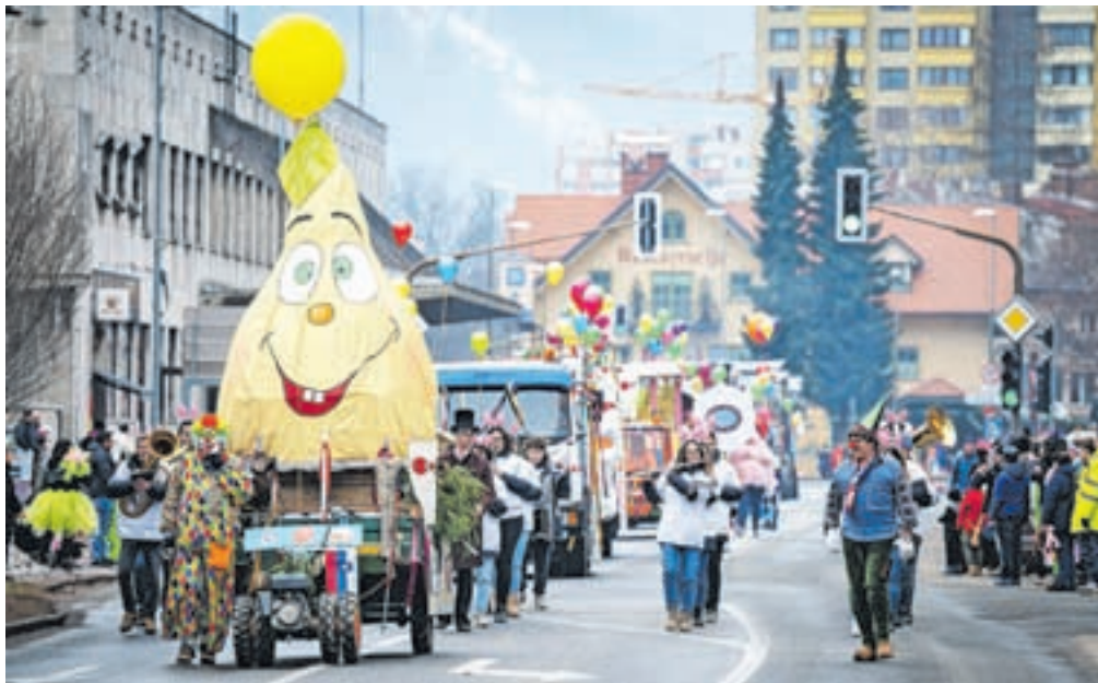
Organizatorji obljublajo še večji, daljši in izvirnejši karneval.

Tako kot v prejšnjih izvedbah bo tudi tokrat povorka krenila s Placa na Hrušici ob 10. uri. Pustne maske bodo med 10.30 in 10.45 klicale pomlad na poti po krožišču na državni cesti do Splošne bolnišnice Jesenice, nadaljevale bodo po glavni cesti do slaščičarne Metuljček, po Cesti Cirila Tavčarja ter po glavni cesti do Trga Toneta Čufarja, kamor naj bi prispele med 11.30 in 12. uro. Med povorko so načrtovani tudi postanki, da si boste lahko ogledali unikatne vozove ter se poveselili, kot se za praznovanje pusta spodobi. Med 12. in 14. uro se bo