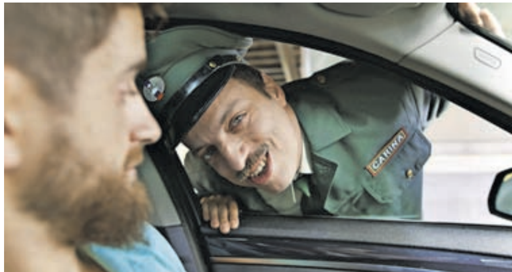
Komedija Finida je bila premierno na ogled tik pred začetkom Čufarjevih dnevov.