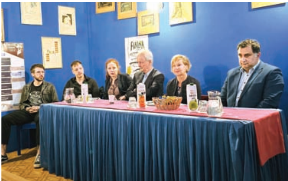
Na novinarski konferenci so predstavili letošnje Čufarjeve dneve in domačo premiero komedije Finida.

Na uvodni večer so občinstvo že navdušili domači gledališčniki z uspešnico Kajmak in marmelada, sredin večer je zaznamovala izvrstna komedija v izvedbi Loškega odra Škofja Loka Predstava Hamleta v vasi Spodnja Mrduša, četrtkovega pa satira Salto mortale v izvedbi Kulturno-umetni-