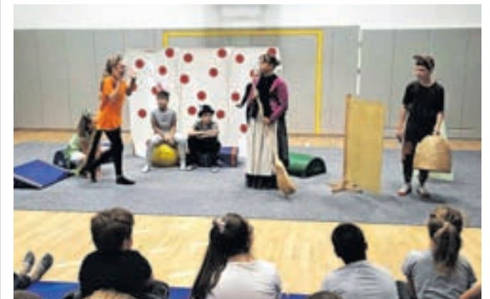
Gledališka skupina je navdušila.

drugem nadstropju razredne stopnje so učenci preživljali aktivne odmore z različnimi talnimi igrami, kot so ristanc, križci in krožci, spomin, poligon nogic ... Prvi razredi so se preizkusili v plezanju na plezalni steni na Stari Savi, učenci drugih razredov so si ogledali predstavo Mojca Pokrajculja, učenci tretjih razredov so dobili dodatno uro športa s peštrim poligonom. Učence četrtilih razredov je obiskal predstavnik društva Bioexo,