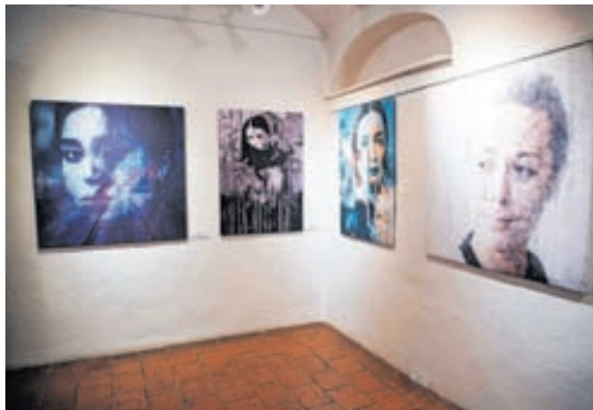
Na razstavi so med drugim na ogled dela iz starejših serij, katerih osnova so predvsem portreti.

talno grafiko, v tokratno razstavo pa je vključil nekatera dela iz starejših serij, katerih osnova so predvsem portreti, z najnovejšimi deli pa se s serijo Fruits of passion posveča nekakšnim sodobnim tihožitjem.