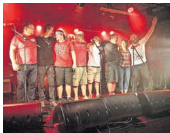
Jeseniška zasedba Guni se bo tokrat predstavila v akustični verziji.