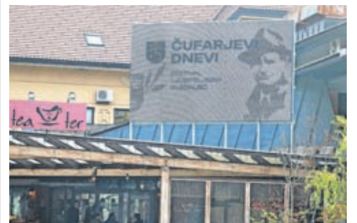
Prikazovalnik na Čufarjevem trgu

ma sodoben digitalni zaslon. Na njem vabijo na Čufarjeve dneve, v prihodnje pa bo omogočal objave aktualnih dogodkov in celo prenose.