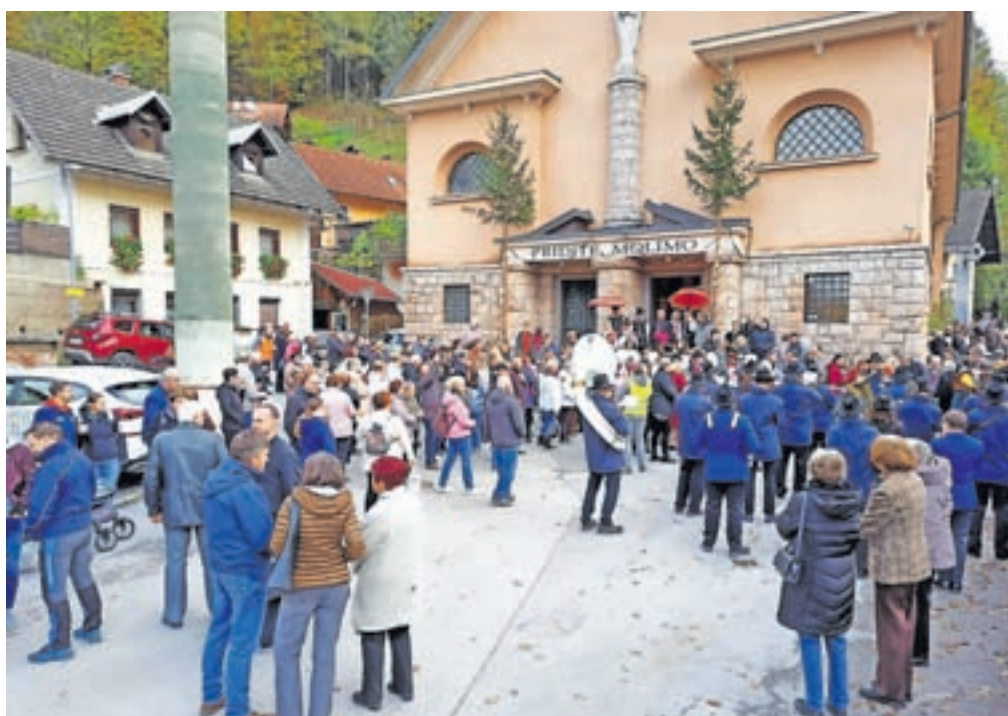
Z zahvalno sveto mašo so v soboto, 4. novembra, v cerkvi svetega Lenarta na Jesenicah zaokrožili praznovanje 500-letnice župnije.