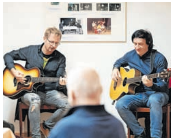
V kulturnem programu so obiskovalci prisluhnili Francijevi poeziji v glasbi in besedi.

skih predstav, predvsem komedij. Pomembno sled je pustil kot pesnik z več samostojnimi pesniškimi zbirkami in proznimi deli. Na razstavi je bilo veliko fotografskega gradiva o njegovih vlogah na odru, režijah in priznanjih, ki jih je prejel. Njegovo delo so prepoznali širše, pred leti je prejel Linhartovo plaketo, najvišje priznanje Javnega sklada Republike Slovenije za kulturne dejavnosti na področju ljubiteljske gledališke dejavnosti. Na odprtju so prebrali več njegovih pesmi in skupaj z jubilarantom obujali spomine na njegovo dolgoletno udejstvovanje v kulturi.