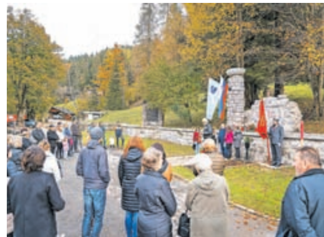
Komemoracija v Planini pod Golico