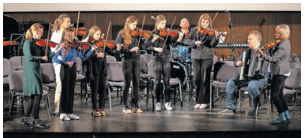
Petelinje kolo – Petlič kolo