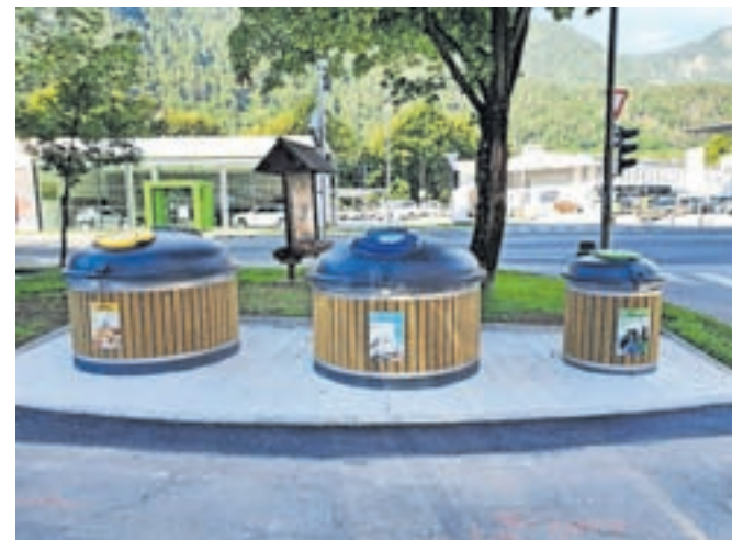
Občina Jesenice ureja sodobnejše potopne ekološke otoke.

na Občini Jesenice, gre za preureditev obstoječih ekoloških otokov, na katerih so bili doslej postavljeni zabojniki za papir, steklo in embalažo. Na novo urejeni ekološki otoki bodo potopni, posode za steklo, papir in embalažo bodo v zemlji oz. urejenih ugreznjenih mestih.