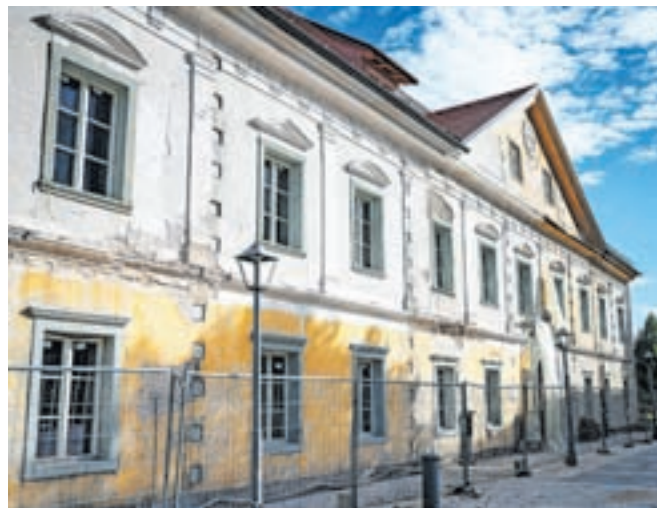
V proračunu za prihodnje leto bodo za nadaljevanje obnove Ruardove graščine namenili 200 tisoč evrov.