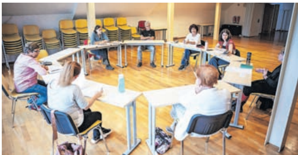
Že četrta sezona delavnic se bo zaključila z javnim branjem v Kolpernu 12. junija 2024.

na območju naše, jeseniške izpostave. Želimo si med seboj povezati pisce, ki se zaradi narave ustvarjalnega procesa v literaturi, ki je individualno naravnana dejavnost, pogosto med seboj niti ne poznajo,« je še dejala ter ob tem poudarila, da obenem želijo tudi omogočiti spoznavanje, medsebojno podporo, izmenjavo mnenj ter spodbujati produkcijo kvalitetne in sporočilno bogate literature ljubiteljskih ustvarjalcev.