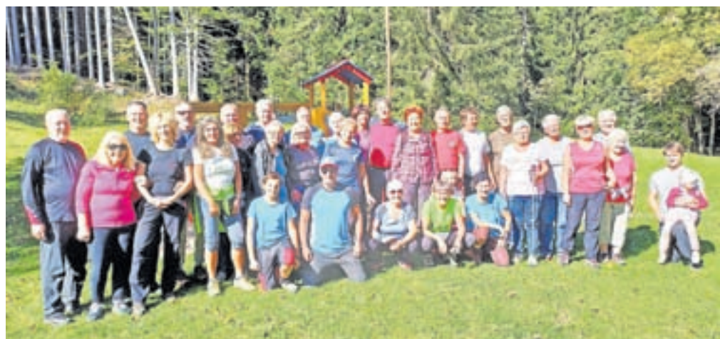
Udeleženci pohoda

loženju več kot sto krajanov, najbolj vneti so ob poslušanju glasbenika in pevca Hajnija Blagneta tudi zaplesali.