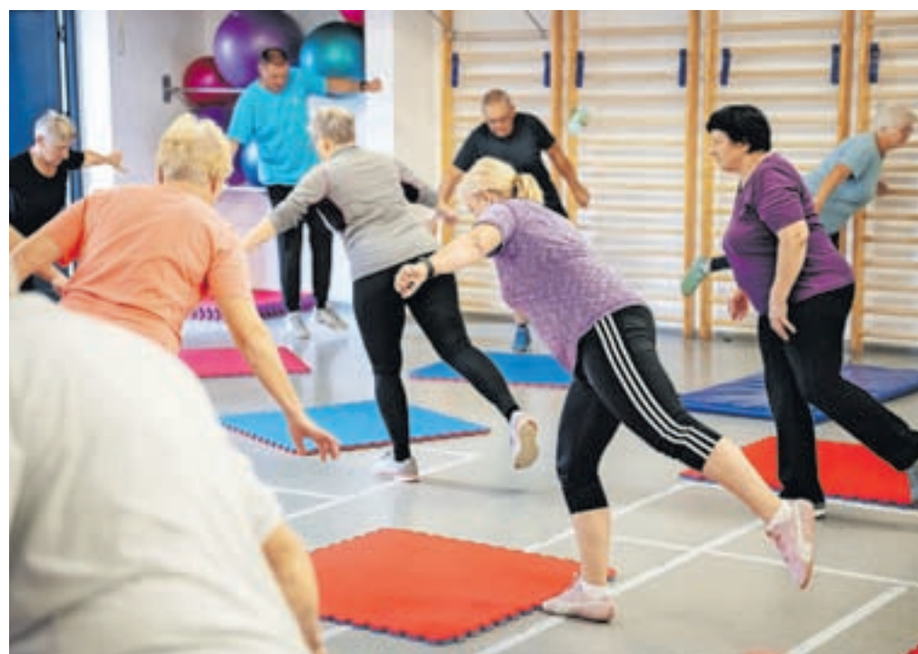
Vaje so prilagojene starejšim, sama izvedba pa ne predstavlja težave nobenemu od udeležencev, ki so za svojo starostno skupino zelo aktivni.

lovadbi za starejše temelji na tem, da bi lokalnemu okolju ponudili nekaj, kar še nimamo,« je poudaril Samar. Vaditelja vadbo prilagajata starejšim, in kot je pojasnil Šorn, vanjo večkrat vključita tudi vaje, vezane na izboljšanje koordinacije, ravnotežja