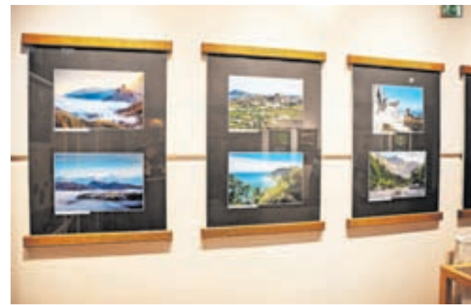
Fotografije za koledar so na ogled v fotogaleriji v avli gledališča.