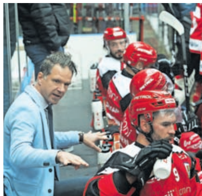
Prva ekipa HDD SIJ Acroni Jesenice je v oktobru odigrala enajst tekem v Alpski ligi in še tri tekme v državnem prvenstvu. / FOTO: GORAZD KAVČIČ

cu so si le priigrali podaljšek in kazenske strele, po katerih so tekmo dobili s 3 : 2 (Planko, G. Seršen). Poraz z Unterlandom doma s 5 : 2 (Pance, Urukalo) je krizo še poglobil. Presenetljivo je v голу začel mladi Bor Glavič, ki pa ni imel dobrega dne, in pri zaostanku z 2 : 4 ga je v vratih zamenjal Žan Us. Mirno lahko napišemo, da je celotna ekipa odigrala tekmo brez prave energije in da je bila zmaga gostov več kot zaslužena. Dva dni po porazu je sledil derbi, saj je v dvorani Podmežakla prišla vodilna ekipa Zell am See. Jeseničani so hitro pozabili poraz, zaigrali zavzeto, s pravo energijo in bili na koncu nagrajeni z zmago s 4 : 1 (Čimžar, Pance, Planko, G. Seršen). November ne bo tako pester, saj