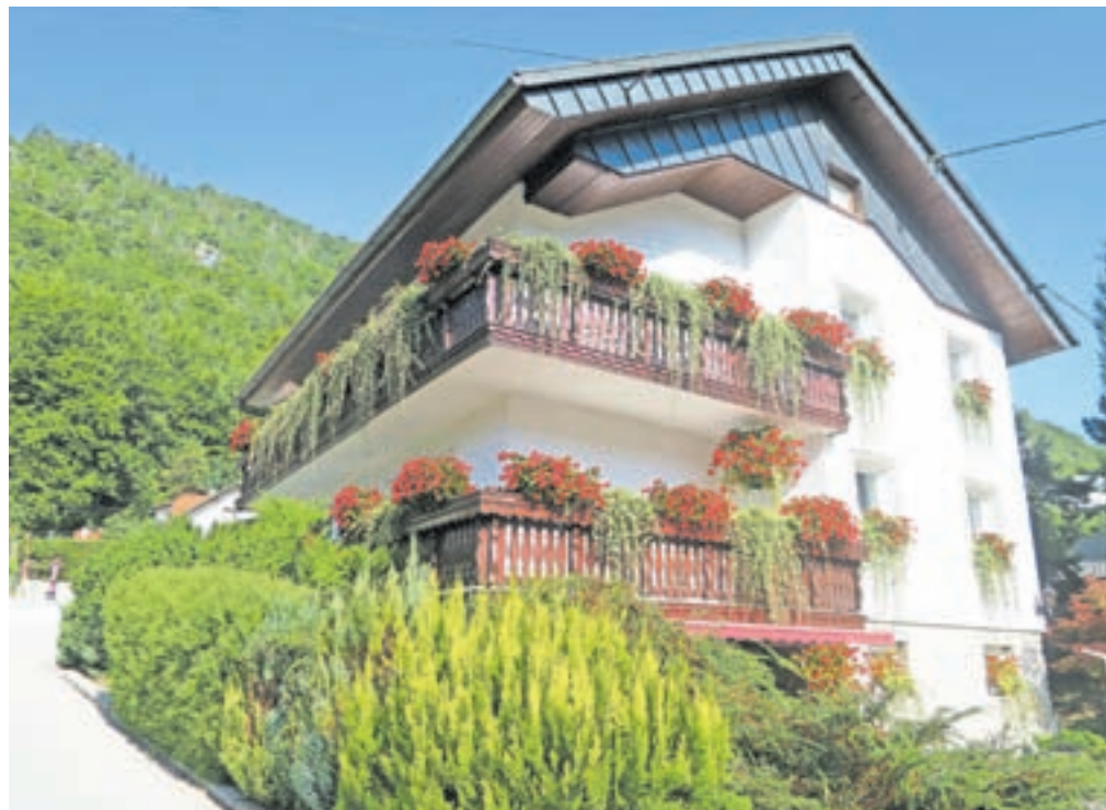
Razkožje cvetja na balkonih Marije Dobravec