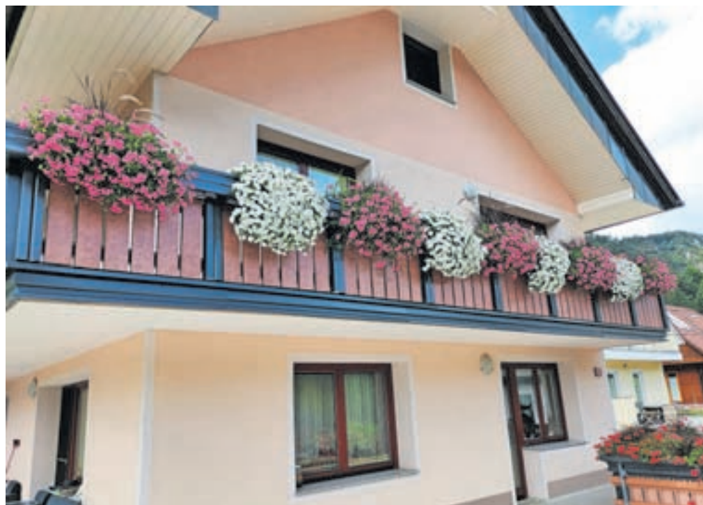
Cvetlična zasaditev v belih in rožnatih odtenkih na balkonu Tanje Pajek