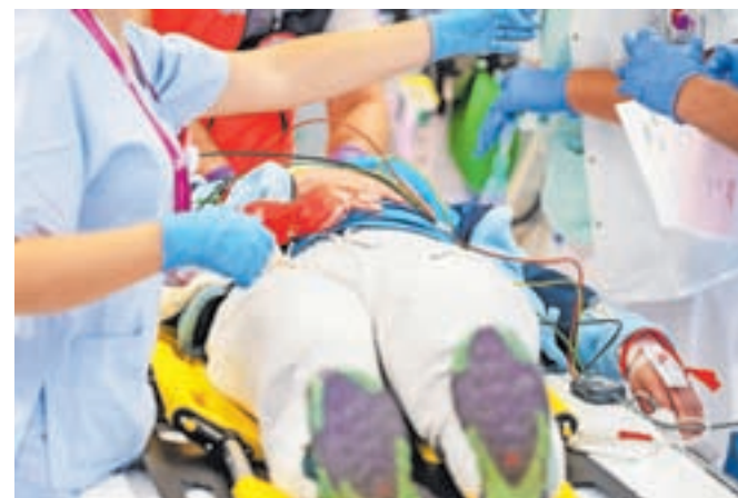
Množična nesreča na Jesenicah s petnajstimi poškodovanci je bila k sreči le priprava na morebitne situacije v prihodnosti.

različne stopnje alarma. »Vedeli smo, da bo vaja potekala, nismo pa bili predhodno obveščeni o tem, kdo, kako in zakaj bo prišel. Tako da smo dejansko približno upoštevali tudi realne čase.