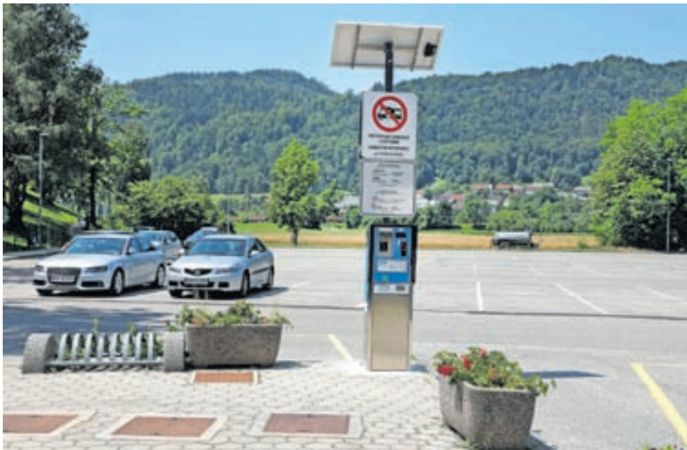
Parkirni avtomat na parkirišču pri pokopališču na Blejski Dobravi ne vrača denarja.

ni dobra izkušnja za turiste. Zanimalo ga je, ali se lahko na tem parkomatu spremeni programska oprema, tako da bo parkomat vračal denar. Kot so pojasnili v občinski upravi, je plačilo na parkomatih na Blejski Dobravi možno na dva načina. Prvi način je plačilo z gotovino,