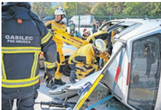
Scenarij je obsegal tudi rezanje avtomobilske pločevine, v kateri so bili ujeti poškodovanci, ki so jo dobro odnesli.

Po opravljeni vaji je sledila analiza. Po mnenju bolnišničnega osebja je ena izmed glavnih težav, s katerimi se soočajo, prostorska omejenost bolnišnice. Ozki in nepregledni hodniki predstavljajo izziv, vendar je simulacija nesreče omogočila vpogled v prednosti in slabosti obstoječega sistema ter ponudila osnovo za nadaljnje izboljšave. »Množične