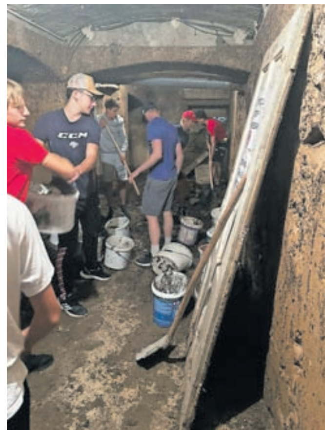
Mladi hokejisti so v delovni akciji priskočili na pomoč Mladinskemu centru Jesenice, ki jim je v avgustovskem deževju zalilo klet.

Za pomoč so se jim v Zavodu za šport Jesenice iskreno zahvalili.