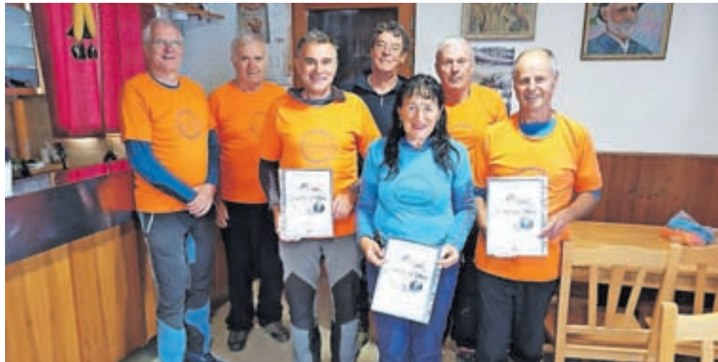
Šest najbolj vztrajnih udeležencev, ki so se podali do Koče na Golici, s priznanji

Pri Planinskem društvu Jesenice so leta 2017 s krožno planinsko potjo Jeseniški cirkel uvedli novost za ljubitelje pohodništva na območjih, kjer imajo svoje postojanke. Cilj je predvsem še bolj približati postojanke in spodbujati zdravo gibanje v gorski naravi. Poti niso zahtevne, primerne so tudi na družine. Začetniško traso so po treh letih razširili na vrh Golice in na Sleme na Vršiču. Na postojankah so kontrolne točke z žigi akcije, ena je na poti Via Alpina z Vršiča v Trento. V letošnjih poletnih mesecih je pot prehodilo 17 pohodnikov z Jesenic, Hrušice, Lesc in Begunj. Ob zaključku akcije so se udeleženci zbrali v Koči na Golici, kjer je predsednik Planinskega društva Jeseni-