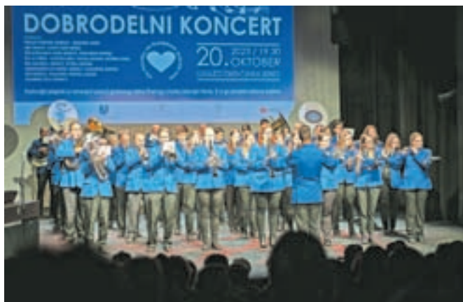
Pihalni orkester je prijateljem z Raven na Koroškem priskočil na pomoč z dobrodelnim koncertom.