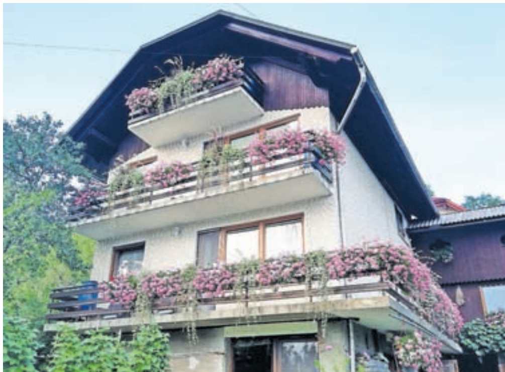
Čudovita rožnata zasaditev Damjane Klinar