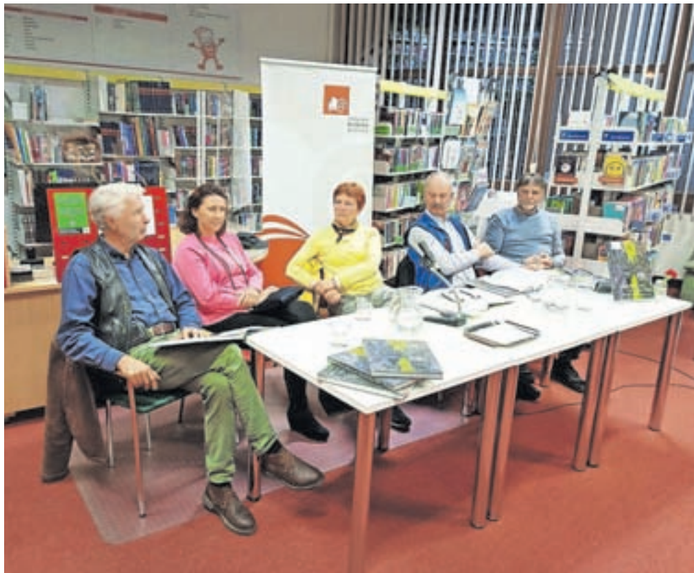
Predstavitve zbornika v jeseniški knjižnici