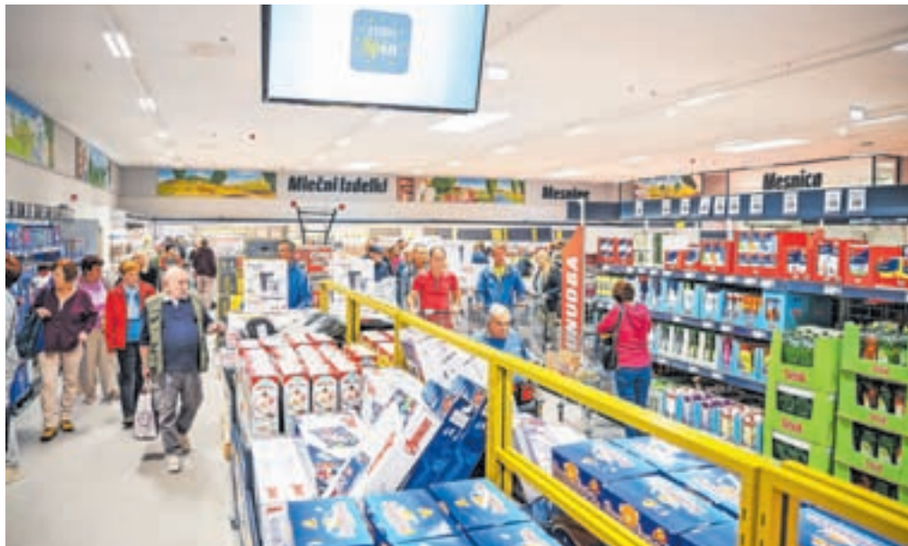
Odprtje je privabilo številne kupce, ki so polni pričakovanj zapolnili prodajni prostor.