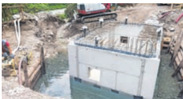
Izgradnja regulacijskega jaška

Po zaključku teh del so bili vzpostavljeni pogoji, da se vodooskrba lahko začne izvajati po novi cevi, hkrati pa se je začelo z deli na lokaciji, kjer bo vgrajen UV dezinfektor. Tre-