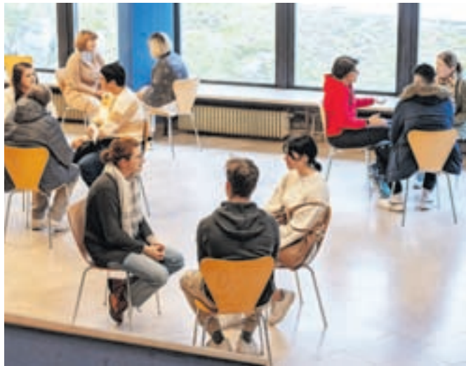
Vsak posamezni pogovor obiskovalcev z »živimi knjigami« je trajal po pol ure.

Dogodek sta v okviru projekta Mladi@Jesenice organizirala Zavod Jdrce in Anže Bertonec in sodelovanju z Razvojno agencijo Zgornje Gorenjske in Občinsko knjižnico Jesenice ter ob finančni podpori Občine Jesenice.