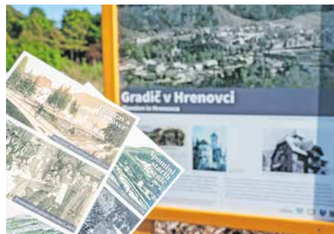
Poleg postavitve šestih informativnih tabel so izdali tudi razglednice.

zaključili krožno pot, ki se začne na Murovi, nadaljuje po nekdanji Gosposvetski cesti, tretji del pelje od Tancarjeve hiše do TVD Partizan, četrti pa po Hrenovci.