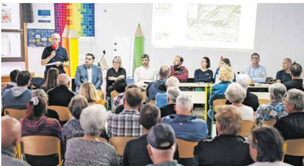
Strokovnjaki so krajanom predstavili trenutno stanje na plazovih nad vasjo in gradbeno-tehnične ukrepe, ki jih bodo izvedli za zagotovitev večje varnosti.