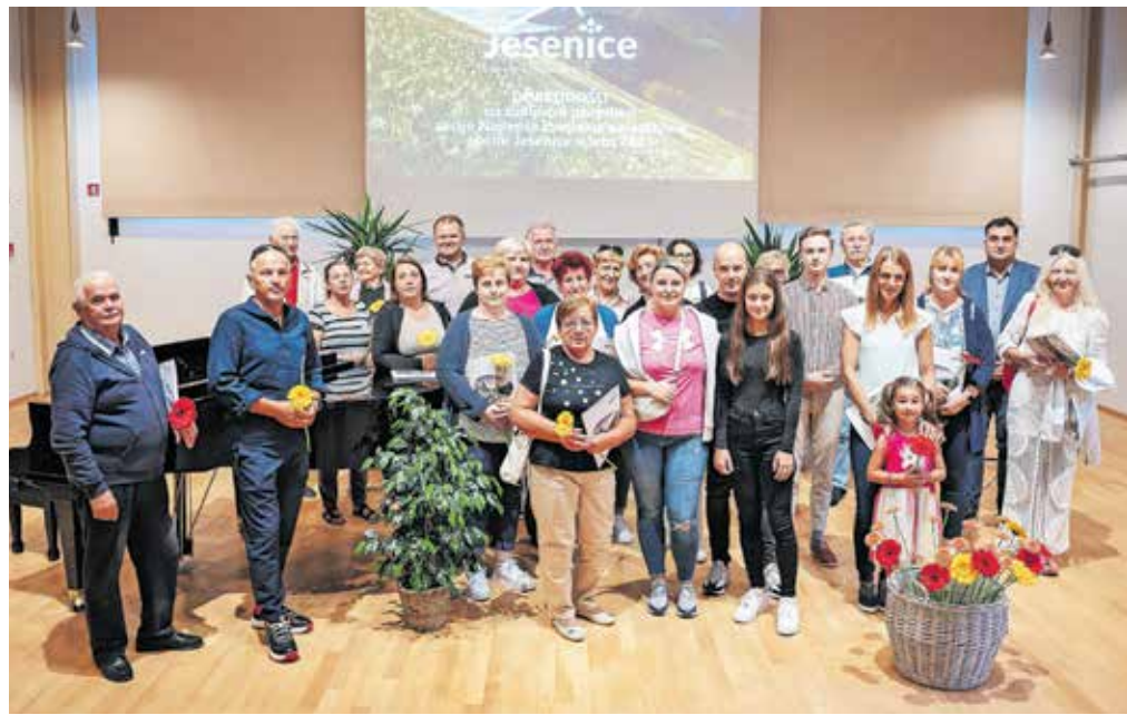
Prejemniki priznanj na podelitvi v Kolpernu

lepše urejene poslovne prostore pa so prejeli: Društvo upokojencev Jesenice, Restavracija Ejga Jesenice, Šiviljstvo Castello in Trgovina Štof.