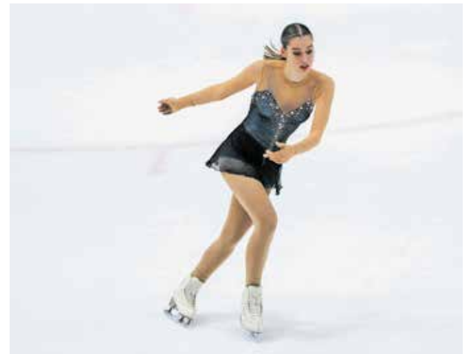
Drsalni klub Jesenice poleg nastopov na številnih tekmovanjih čakajo pomembni organizacijski zalogaji.

Veseli december na Jesenicah bodo pri klubu obogatili z veliko drsalno pravljico na ledeni ploskvi v dvorani Podmežakla. Svoje tekmovalne vrste želijo še pomladiti in razširiti. Od 15. oktobra naprej vsako soboto in nedeljo ob 15. uri na domači ledeni ploskvi prirejajo drsalni tečaj za otroke od četrtega do dvanajstega leta starosti. Cena je 30 evrov.