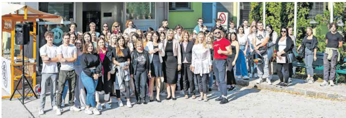
Prvi študijski dan za novo generacijo jeseniških študentov