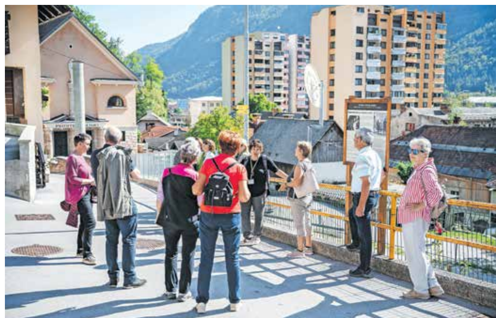
Ob svetovnem dnevu turizma so pripravili tudi strokovno vodenje po tematski poti Spomini starih Jesenic.

čine kot obiskovalce želijo popeljati v stare čase. Tako so v Hrenovci postavili šest informativnih tabel z zanimivimi informacijami in fotografijami o Hrenovci nekoč in danes ter izdali tudi razglednice. V projektu so moči združili Občina Jesenice, Razvojna agencija Zgornje Gorenjske, Gornjesavski muzej Jesenice in TIC Jesenice.