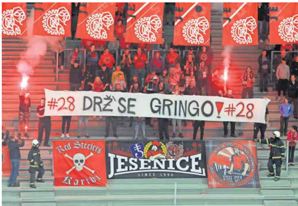
Srčni navijači so na tribuni dvorane Podmežakla razvili transparent z napisom Drž' se, Gringo! Zbralo se jih je kar tisoč.

na olimpijskih igrah, tokrat v Južni Koreji. Ob koncu svoje bogate kariere se je še enkrat vrnil bližje domu, tokrat je oblekel dres ljubljanske Olimpije, uradno pa je svoje zadnje tekme odigral v vrstah nemškega EV Lindau, tudi zaradi težav z zdravjem, ki so se po tiho že pretihotapile v njegov vsakdan.