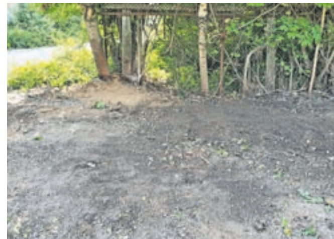
Območje je zdaj pospravljeno in upajmo, da takšno tudi ostane.