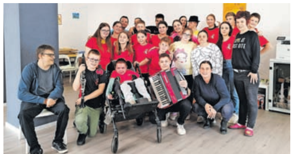
Člani društva Lepa si v novih prostorih

Društvo Lepa si je bilo ustanovljeno z glavnim ciljem omogočiti osebam s posebnimi potrebami enakovredno vključevanje v družbo, večjo samostojnost in nudenje raznovrstne pomoči. Pomembna pridobitev za uresničevanje ambiciozno zastavljenega programa so novi prostori na Ulici Cirila Tavčarja 3b na Jesenicah, kjer izvajajo različne aktivnosti, delavnice ali zgolj prijetna srečanja, ki tem osebam vedno veliko pomenijo. Med pomembnimi nalogami so pridobivanje novih znanj in veščin ter ohranjanje že pridobljenih, večanje samostojnosti, socialna in delovna integracija, reševanje osebnih stisk, informiranje glede pravic invalidov in zmanjševanje diskriminacije. V septembru bodo v okviru društva izvedli projekt Vsi mladi, zdravi, enaki, ki