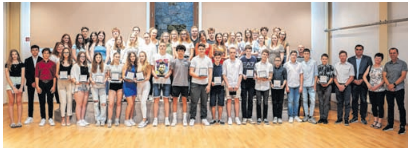
Najboljši učenci in dijaki z županom in ravnatelji na sprejemu v Kolpernu