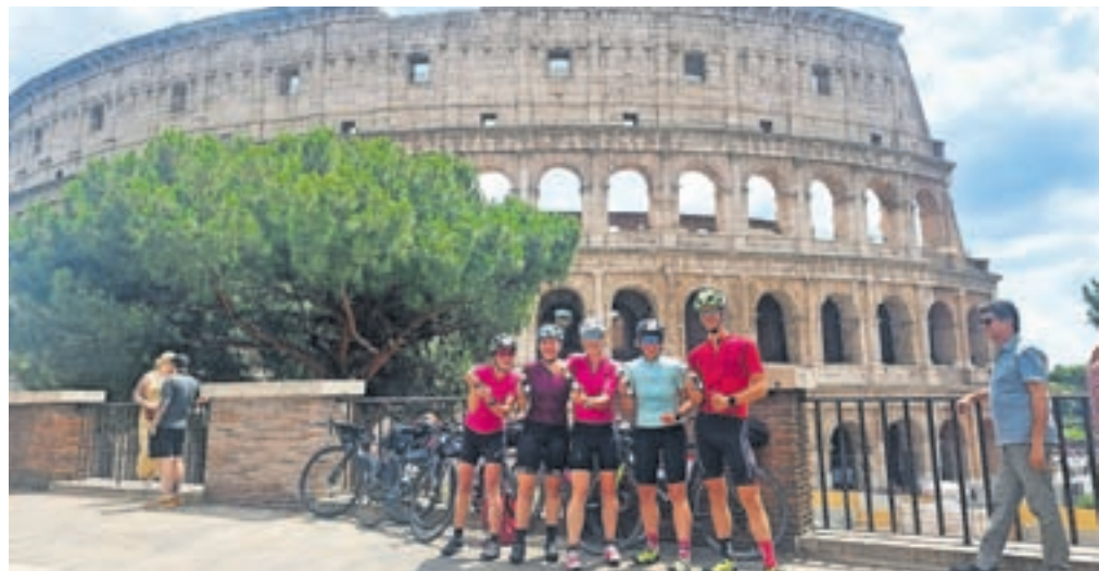
Na cilju pred rimskim kolosejem