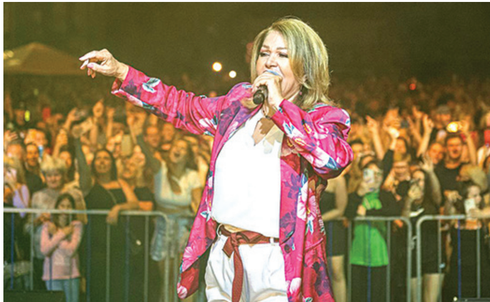
Vrhunec Jeseniškega poletja je bil nastop legendarne Nede Ukraden, ki je navdušila s starimi in novimi hiti in razgrela občinstvo od blizu in daleč.