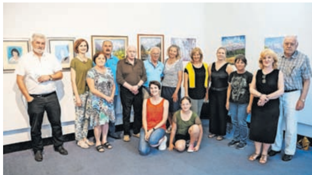
S paleto različnih motivov – pokrajine, gorska narava, tihožitja in portreti – se predstavlja 21 članov.

Razstavni salon Dolik na Jesenicah je po polletnem premoru spet odprl vrata. Vzrok za nekajmesečno zaprtje je bila dotrajanost objekta, v prtiličju katerega se nahaja salon in ki je v zasebni lasti. Občina Jesenice je vrsto let zagotavljala sredstva za vzdrževanje, člani likovnega kluba pa so vlagali velike napore za zagotavljanje pogojev za ustvarjanje in izvedbo razstav in drugih dogodkov. Po pogovorih z lastnikom objekta in Občino Jesenice pa so vendarle našli začasno rešitev. Po delni sanaciji in obnovi so razstavni salon ponovno odprli in v juniju na ogled postavili pregledno skupinsko razstavo likovnih del članov Likovnega kluba Dolik.