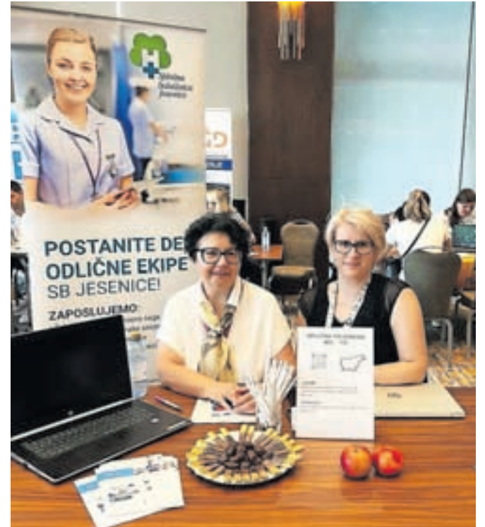
Jeseniška bolnišnica se je predstavljala na zaposlitvenem sejmu v Skopju.

Kljub temu jim je doslej uspelo zaposliti nekaj sodelavcev, ki so prišli iz drugih držav. »Vsi zaposleni se trudimo, da bi se novi sodelavci počutili čim bolj sprejete, da bi bili zadovoljni in da bi karseda hitro usvojili potreb-