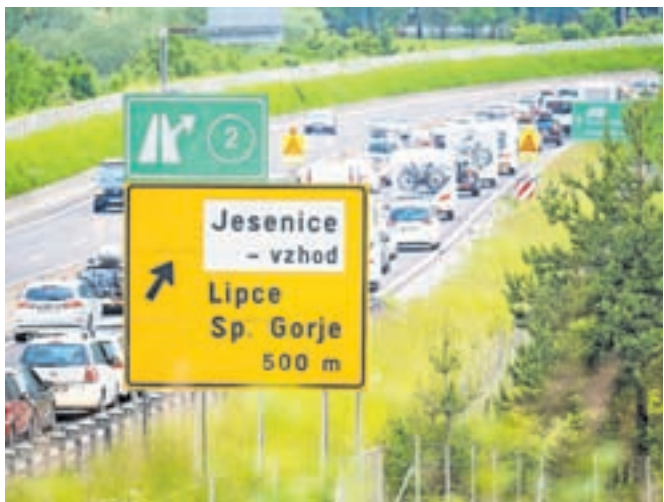
Ob zastojih na avtocesti se poveča tudi prometna obremenitev občinskih cest v jeseniški občini.

Tudi to poletje je zlasti ob koncih tedna občasno povečan promet skozi Jesenice, saj zaradi zastojev na avtocesti nekateri vozniki uporabljajo ceste skozi mesto. Kot so povedali na Občini Jesenice, so se s policijo in DARS-om dogovorili za sistem vodenja prometa po avtocesti, da bi bile občinske ceste čim manj obremenjene. Povečan promet pričakujejo tudi na Blejski Dobravi, predvsem na pokopališču, kjer se parkirni prostori uporabljajo za obisk soteske Vintgar. »Medobčinski inšpektorat in redarstvo občin Jesenice, Gorje, Kranjska Gora in Žirovnica se bo skupaj z ostalimi službami potrudil, da bo promet skozi Jesenice potekal čim bolj nemoteno in da bo življenje Jeseničanov moteno v čim manjši meri,« so povedali na Občini Jesenice.