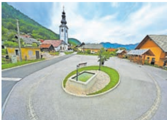
Vaško jedro urejajo od leta 2016, kmalu pa bo dobilo dokončno podobo.

Štefanovo, koledovanje, praznovanje krajevnega praznika, za potrebe sejemske dejavnosti, prikaz običajev, obrti, kulinarike in drugih dogodkov. Urejen vaški trg prispeva k lepšemu in privlačnejšemu videzu vasi ter spodbuja in ohranja družabno življenje na podeželju, ki privablja tudi številne obiskovalce iz okoliških krajev,« so pojasnili na Občini Jesenice. Projekt Živa dediščina delno financira Evropska unija, vodilni partner projekta pa je BSC Kranj.