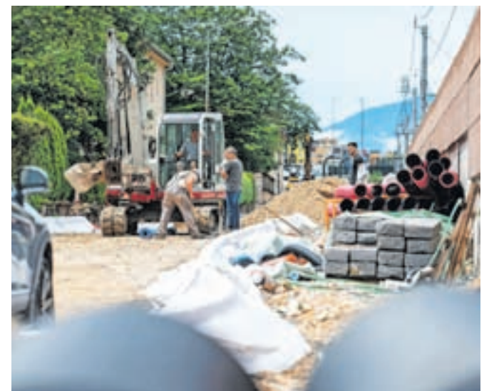
Obnova dveh najbolj dotrajanih jeseniških ulic, Delavske in Kejžarjeve, se počasi bliža zaključku.

Glede na trenutni potek del na Občini Jesenice pričakujejo, da bodo ta zaključena v prvi polovici septembra.