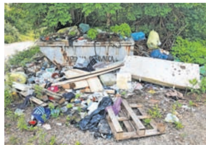
Nakopičeni odpadki na zemljišču v lasti Slovenskih železnic

cah opozorili, da so z odstranitvijo imeli velike stroške, ki jih v prihodnje ne nameravajo več kriti. »V primeru, da se bo zadeva ponovila, apeliramo na vas, da krajane in meščane o pravilnem odlaganju kosovnih odpadkov tudi pisno opozorite, saj v bodoče ne bomo več krili teh stroškov,« so zapisali v odzivu Občini Jesenice, kjer se pridružujejo pozivu občanom, naj spoštujejo trud lastnika in ne odlagajo odpadkov na tem območju. »Urejeno okolje je tudi odraz naših navad in osebne kulture,« so zapisali.