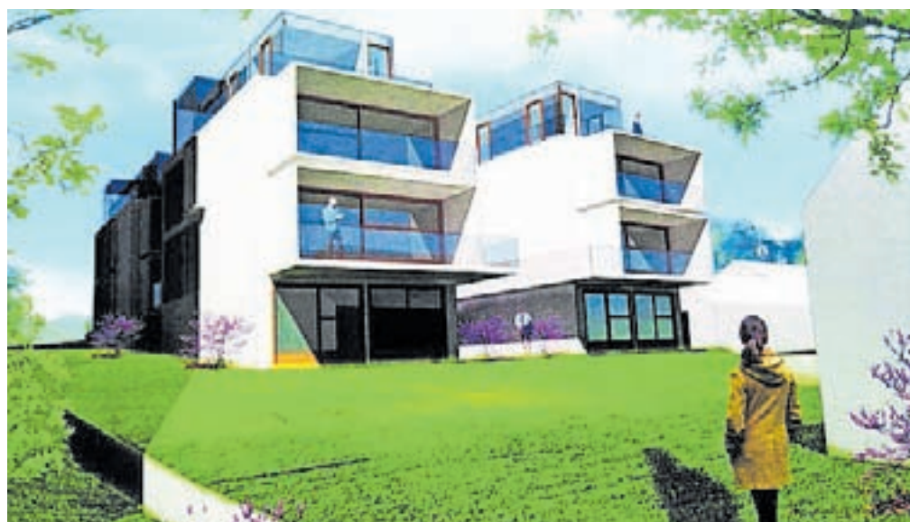
V štirih dvostanovanjskih enotah bo skupaj osem stanovanj.

Ta čas pripravljajo gradbišče, investitor ureja financiranje, stanovanja pa naj bi bila vseljiva konec prihodnjega leta.