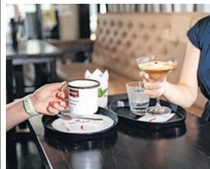
Delavska in jeklena kava, kot jo postrežejo v kavarni na jeseniški železniški postaji

stveni kavi, jekleno in delavsko. Krepkejša jeklena kava vsebuje črno kavo espresso, kavni liker Kahlua in vaniljev sladoleđ, kava pa je postrežena v kozarcu za koktajl. Brezkofeinska različica z imenom delavska kava pa je pripravljena iz ječmenove kave, ki ji je dodana obilna porcija spenjenga mleka.