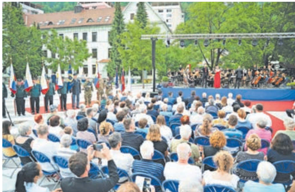
Trg se je spremenil v čudovito poletno prizorišče.

nostjo, podjetnostjo, predanostjo, pravičnostjo, odprtostjo, strpnostjo in poštenjem gradimo naše Jesenice in naše Slovenijo. Če se bomo pogovarjali in se slišali, če se bomo upoštevali, bodrili in si pomagali, če bomo povezana in solidarna