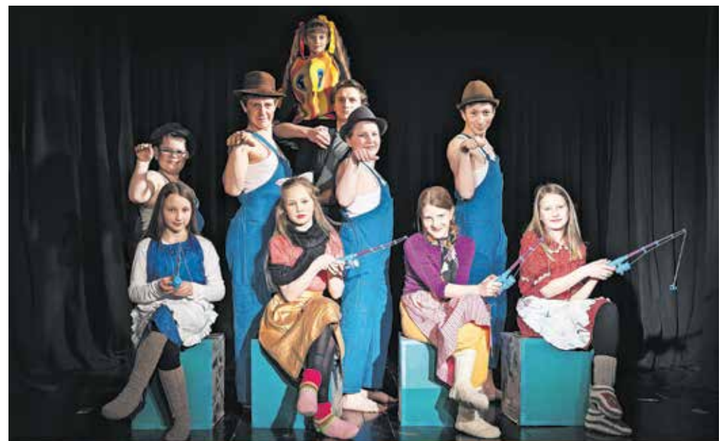
Otroci so uživali tako med pripravami na premiero kot tudi na premieri in po njej. Ponos je bil opazen.

Devet otrok med sedmim in trinajstim letom starosti je v nedeljo, 19. marca, v Kultur-nem hramu na Koroški Beli uprizorilo igro z naslovom O ribiču in njegovi ženi. Kot je pojasnil režiser Čušin, 20-le-tnik, ki se z gledališčem ukvarja že dobrih deset let, zgodba govori o revnem paru, ki je živel v steklenici od kisa. Nekega dne je ribič ujel ča-robno ribo in jo iz dobrote iz-pustil, žena pa je zahtevala, naj se vrne in od ribe zahteva hišo. Riba jima je ustregla, žena pa je postajala vse bolj pohlepna in zahtevala vedno več. Na koncu jima riba vza-me vse, kar jima je podarila, in ju vrne v steklenico. »Spo-ročilo zgodbe je precej moč-no. Eno je zagotovo to, da ljudje ne smemo biti pohlepni, drugo pa, da je včasih tre-ba reči ne, ko vemo, da neka stvar ni v redu,« je pojasnil Čušin, ki je dodatno priredil že prirejeni scenarij, po isto-menski zgodbi Fimfaruma, tako da so vsi igralci lahko do-bili svoj košček predstave.