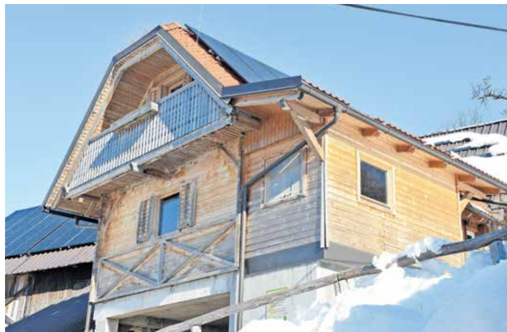
Apartmentja so zgradili v središču kmetije in ponujajo pravo kmečko izkušnjo.

Apartmentja sta po kakovosti storitev na turističnih kmetijah ocenjena z dvema jabolkom, sprejemata pa po štiri oziroma osem gostov. »Apartmentja se od drugih v bližnji okolici razlikujeta predvsem po sami lokaciji, nahajata se namreč v središču kmetije, poleg tega pa