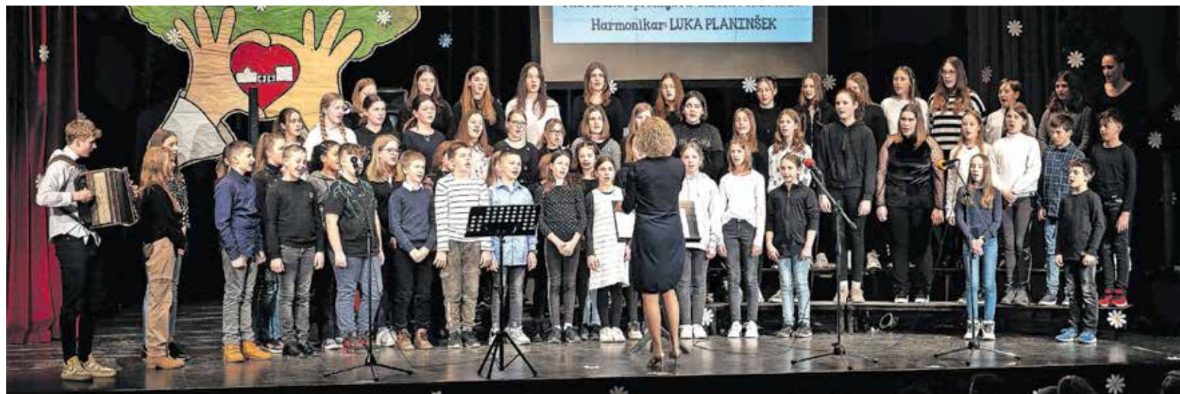
Zapeli so: šolski pevski zbori Prvi črvi, Škrjančki in Mladinski pevski zbor.

zbrali 1800 evrov, poslali pa so tudi nekaj prošenj za do-nacijo podjetjem. Zbiranje tako še ni zaključeno.