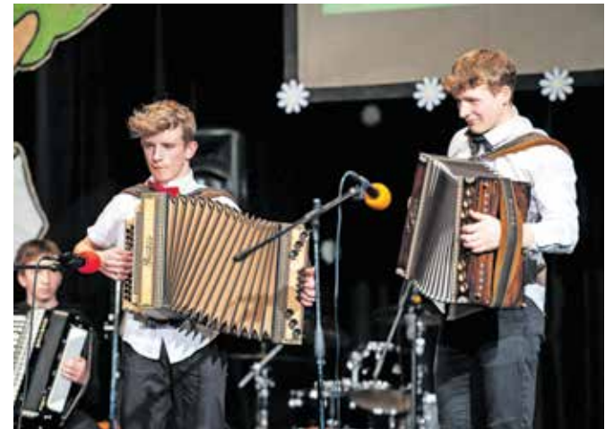
Šolski glasbeniki so zaigrali na harmoniko in klavir ter zapeli dve pesmi.