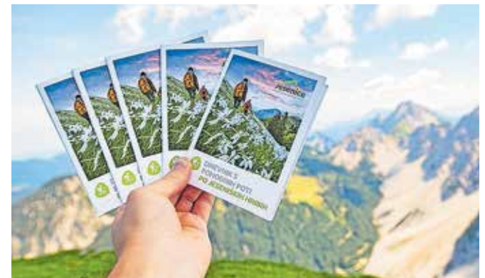
Žige navdušeni planinci zbirajo v knjižici Po jeseniških hribih.

Vključenih je 17 pohodniških točk: vrhov, razgledišč, koč in znamenitosti v občini. Žigi so na lokacijah, ki so zapisane v knjižici nad posameznim mestom za žig, bodisi je to vrh, razgledišče, koč, naravna ali kulturna znamenitost. Na žigih so zapisani zaporedna številka, ime in nadmorska višina lokacije. Vključenih je sedem vrhov v visokogorju Karavank, šest v sredogorju in štirje na Mežakli. To so: Hruščanski vrh,