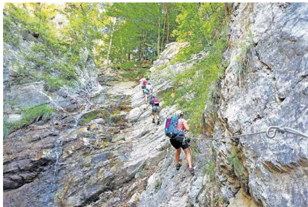
Ferata Dobršnik poteka po slikoviti soteski potoka s sedmimi slapovi

ski potoka s sedmimi slapovi v dolžini tisoč metrov in z višinsko razliko 270 metrov. V zimskih mesecih obisk ferate zaradi snega in narasle vode ni varen. Uradno je spet odprta od 1. aprila naprej. Po besedah Gabra Šorna z Zavoda za šport Jesenice, ki ima upravljanja ferato, so pred letošnjim odprtjem