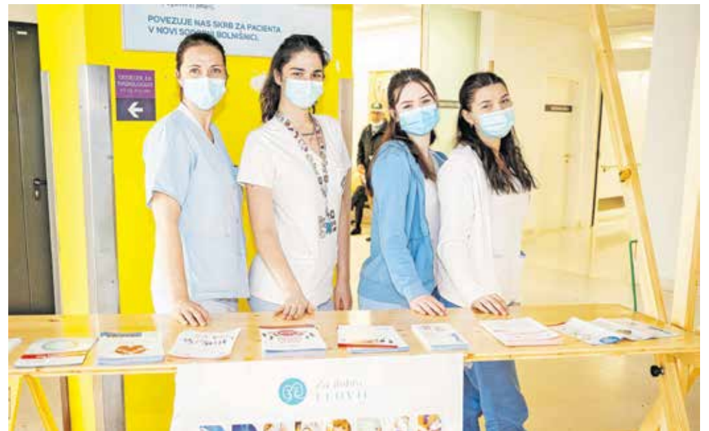
Na stojnici so sodelovale dijakinje zdravstvene nege Srednje šole Jesenice.

»Ledvične bolezni so žal pogoste, njihova pojavnost pa se še povečuje. Ocenjujemo, da ima okoli deset odstotkov odraslega prebivalstva v Sloveniji kronično ledvično bolezen, ki bistveno vpliva na zdravje telesa in močno skrajša življenjsko dobo bolnikov. Največkrat je kronična