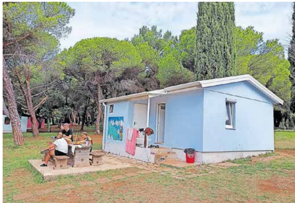
Letos obnavljajo dve hiški, v preteklih dveh letih so že štiri.

pogovorili, ovrkli govorice, ki krožijo po Jesenicah. Pinea se ne prodaja, se obnavlja, nadgrajuje z namenom, da letovišče postane bolj sodobno oziroma otrokom prijaznejše. Zob časa je pokazal