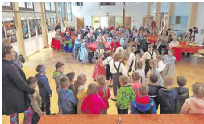
Za prisrčno popostritev občnega zbora so poskrbeli otroci z vzgojiteljicami iz Vrtca Jesenice, enote s Koroške Bele.

pomenijo srečanja, kjer velikokrat že prijazen klepet pomaga pri premagovanju vsakdanjih težav in tegob. Na nedavnem občnem zboru so celotno delo društva ocenili kot uspešno – z željo, da se programi v takšni meri in s takšno zavzetostjo vodstva društva nadaljujejo.