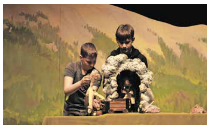
Lutkovna predstava članov lutkovne šole nosi naslov Čisto nova/nora ZGODBA.

Premierno so lutkovno predstavo uprizorili konec marca.