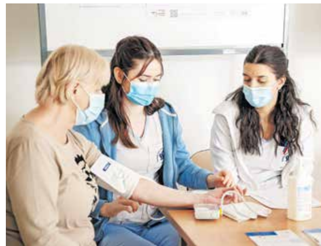
Obiskovalcem so merili krvni tlak, lahko pa so oddali tudi urin za osnovne laboratorijske preiskave.

ledvična bolezen povezana s povišanim krvnim tlakom, sladkorno boleznijo in srčno-žilnimi boleznimi, zato je