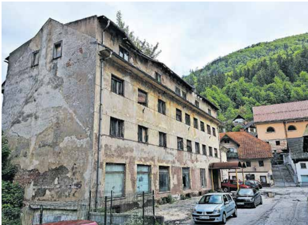
Hotel Pošta v Centru II je še vedno v zasebni lasti, Občina Jesenice čaka na dokončanje dednih postopkov.

Na Občini Jesenice poudarjajo, da so za nakup nepremičnine po ureditvi premoženjskopравnih zadev še vedno zainteresirani, saj bi z nakupom in rušitvijo objekta, ki sedaj zaradi svojega stanja predstavlja tudi potencialno nevarnost, pridobila površino za ureditev mirujočega prometa v Centru II. »Obstoječi prostor skupaj s sosednjo prasto parcelo v občinski lasti bi se namreč namenil za gradnjo garažne hiše, s katero bi pridobili parkirna mesta, del obstoječih zunanjih parkirnih mest pa bi potem lahko uknili in prostor uredili kot mestni parter, ki bi bil prvenstveno