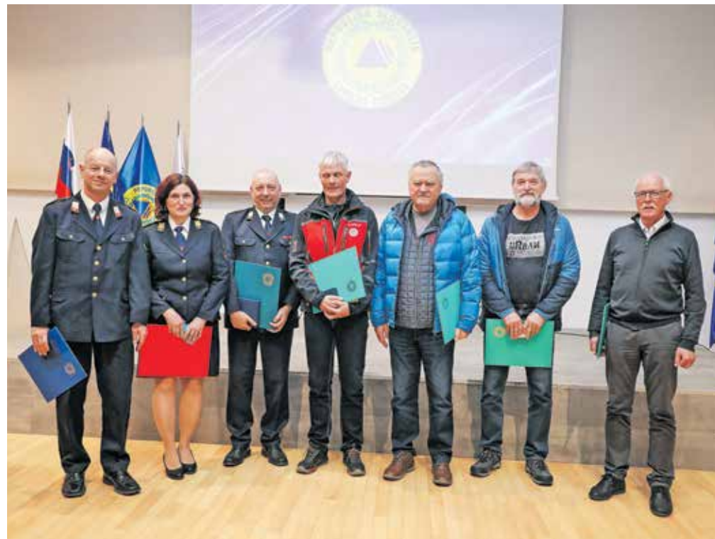
Na Jesenicah so podelili regijska priznanja Civilne zaščite.