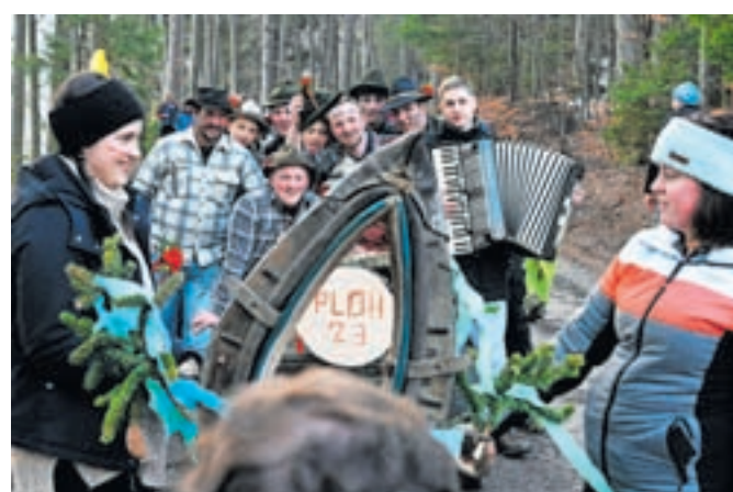
Fantje, ki običaj oživljajo v Javorniškem Rovtu

ročeni fantje odsekajo veliko smreko, imenovano ploh, in jo vlečejo po vasi. Od leta 2020 je ta običaj vpisan v Register nesnovne kulturne dediščine Slovenije.