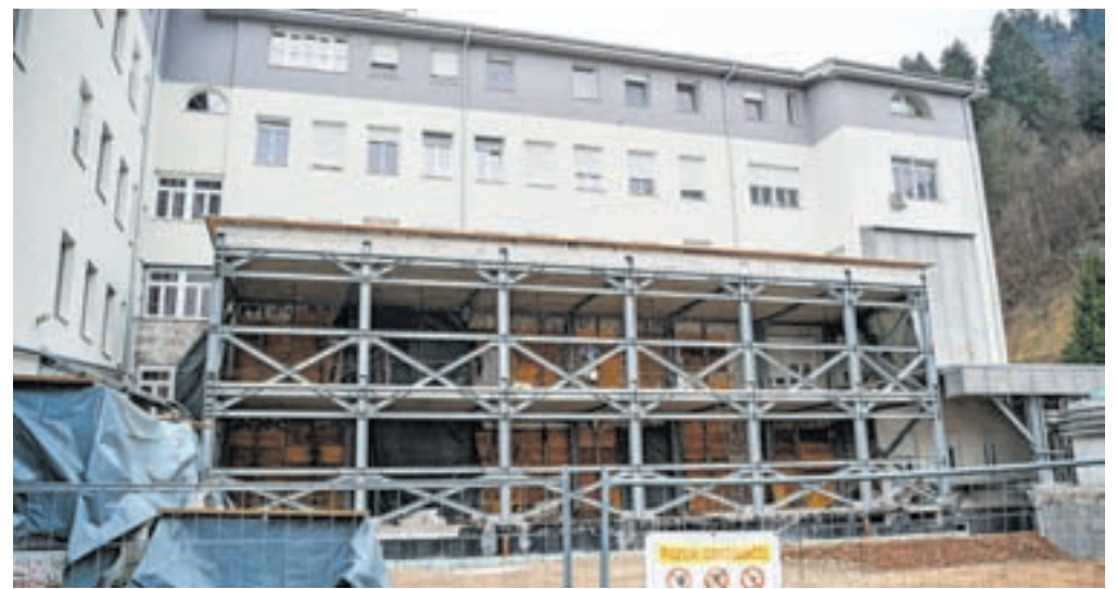
V bolnišnico so v zadnjih letih vložili na milijone evrov, ta čas poteka gradnja prizidka intenzivnega bloka, vredna 3,7 milijona evrov.

Poleg tega za namen širitve bolnišnice Občina Jesenice že vrsto let s prostorskimi akti ščiti območje stavbnih zemljišč vzhodno od bolnišnice, poleg tega pa ima v