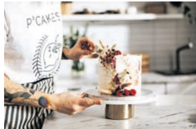
Petrine sladke dobrote niso le okusne, temveč tudi prava paša za oči.

Petra ustvarja za vse priložnosti – rojstne dneve, poroke, poslovne zabave ali pa samo za razvajanje ob koncu tedna, ki si ga lahko privoščite z njenimi sladkimi paketi. V letu 2020 se je zgodbi Pcakes pridružil tudi Petrin mož Jure, za katerega pravi, da je njen največji podpornik že od samega začetka. »Ko sem začela ponujati še spletne tečaje in spletno trgovino, sva se odločila, da se Jure pridruži na polno. Skrbim predvsem za nabavo, administracijo in spletno trgovino ter tečaje. Pri peki ni najbolj spreten, zelo dobro