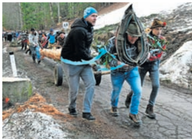
Ker je bilo premalo snega in cesta kopna, so se morali kar pošteno potrudili, da so ploh privlekli do cilja na Pristavi.