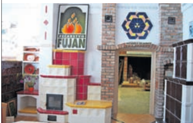
Pečarska in keramičarska delavnica praktičnega pouka

Zaradi upokojitve potrebujemo učitelja praktičnega pouka. Če vas veseli delo z mladimi in obvladate veščine pečarstva in keramičarstva , vas vabimo k sodelovanju. Za izvajanje praktičnega pouka pečarstva in keramičarstva imamo na šoli odlične pogoje. Za podrobne še informacije se obrnite na nada.smid@sckr.si ali 041 790 325. Vabljeni, da se pridružite učiteljskemu zboru gradbene stroke.