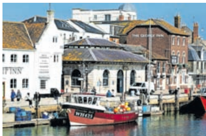
Restavracija je le nekaj korakov stran od morja in gostje lahko skozi okno opazujejo ribiče. Riba ne more biti bolj sveža...