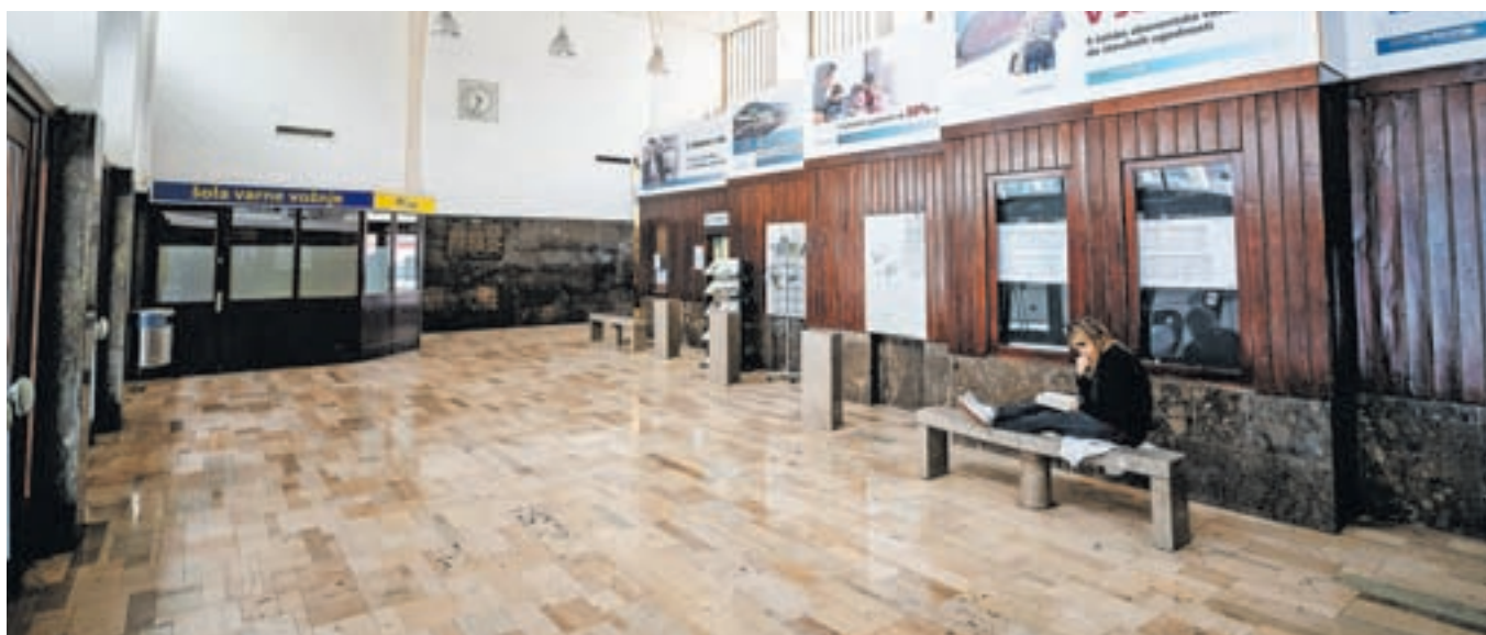
V prostorih postajnega poslopja je predvidena ureditev avle s čakalnico in prodajo vozovnic, medtem ko umestitev modulne makete v avlo ni predvidena.