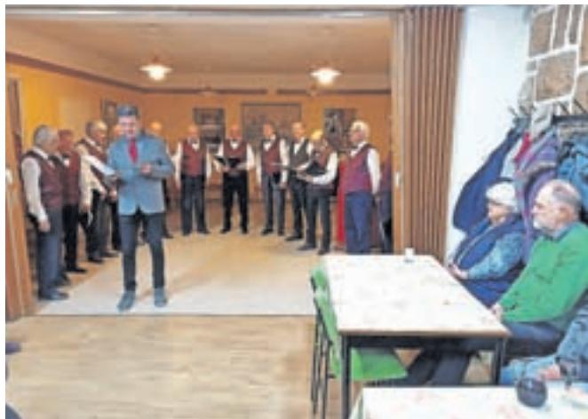
Praznični koncert zboru DU Jesenice

V Društvu upokojenцев Jesenice so letos v počastitev slovenskega kulturnega praznika izvedli koncert društvenega pevskega zboru, ki so ga združili z družabnim srečanjem z znanimi ljudmi iz domačega okolja. Petje je med jeseniškimi upokojenci priljubljeno.