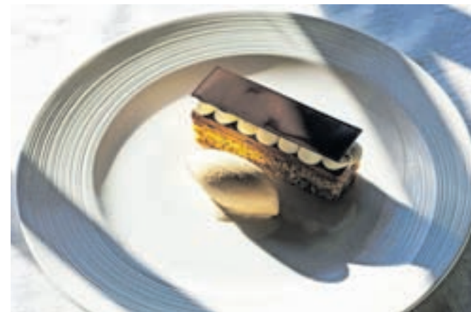
Ena od Tijinih kreacij: lešnikov biskvit, kavin mus in karamelni sladoled