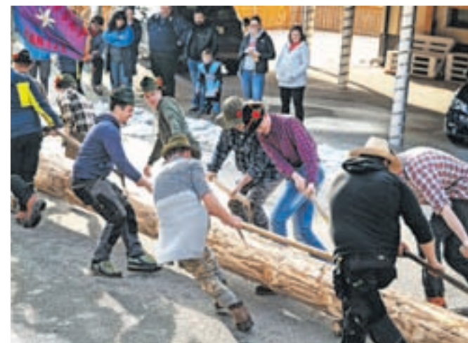
Ploh je bil kar zalogaj za sicer krepke fante, da so ga po cesti privlekli od gasilskega doma do Čopa.

Podobno je bilo v Planini pod Golico, kjer je bila dolžina ploha nekaj metrov krajša, kljub temu pa kar pravi zalogaj za sicer krepke fante, da so ga na smojkah (saneh, ki se uporabljajo za vleko lesa) po cesti privlekli od gasilskega doma do