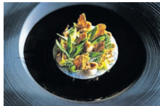
Mariniran brancin s topinamburjem