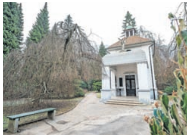
V pripravi je konservatorsko-restavratorski načrt za celotni Spominski park.

Odgovor so pripravili v javnem komunalnem podjetju Jeko. Kot so zapisali, je bila 31. marca 2021 v Spominskem parku ugotovljena poškodba sredinskega zidu in udor enega od grobnih mest. »S predstavniki Občine Jesenice se je izvedel terenski ogled, na katerem je bila sprejeta odločitev, da Jeko neposredno ne pristopi k sanaciji, ampak skladno s postopki varovanja kulturne dediščine Občina Jesenice pridobi mnenje Zavoda za varstvo kulturne dediščine (ZVKDS). Na podlagi kulturnovarstvenih pogojev, ki jih je izdal ZVKDS, Območna enota Kranj, je v pripravi konservatorsko-restavratorski načrt za celotni Spominski park na Plavžu. Končna verzija načrta je predvidena do konca meseca februarja 2023, Občina Jesenice pa bo v okviru proračunske postavke Spomeniškovarstvene akcije nadaljevala predvidene posege v Spominskem parku na Plavžu in sanacijska dela vojaške kapele. V juniju 2022 se je v sklopu naročila oddelka za družbene dejavnosti in splošne zadeve izvedlo visokotlačno čiščenje grafitov in nečistoč na kape-