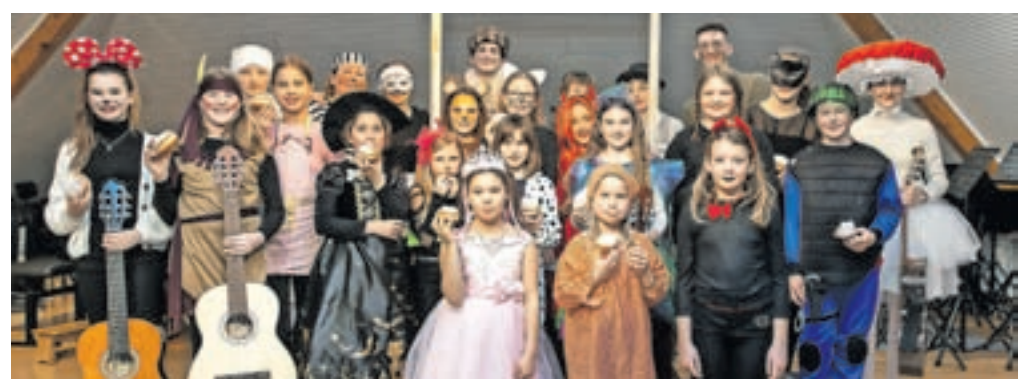
Pustni nastop na debeli četrtek

pozabijo pa niti na pustni nastop na debeli četrtek, ko učenci nastopijo v maskah, nastop pustnih šem pa se je letos prepletal z zabavno in poučno igrico, ki so jo pripravili učitelji. Seveda niso manjkali niti krofi. V začetku marca pa je potekal tudi nastop citrarjev, na katerem so nastopili tudi učenci Glasbene šole Škofja Loka. Aprila pa bodo jeseniški citrarji vrnili obisk in nastopili v Gorenjski vasi.