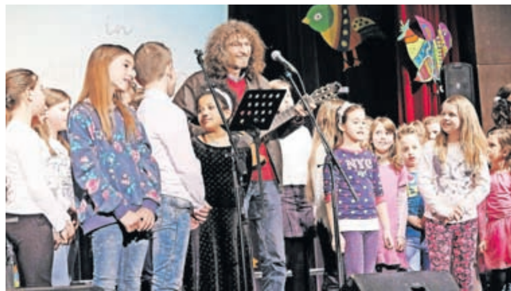
Marca 2019 so pripravili prvi dobrodelni koncert, ki je več kot uspel.

nova okna; takrat je sodelovalo kar 150 nastopajočih, od šolskih pevskih zborov, Pihalnega orkestra Jesenice - Kranjska Gora, Mešanega pevskega zboru Vox Carniola do Adija Smolarja, Rok'n'Banda, Elvisa Fajka, dua Acoustic Rainbow, Denisa Porčiča - Chorchypa in drugih. Takrat so zbrali kar 20 tisoč evrov, ki so jih namenili zamenjavi dotrajanih oken.