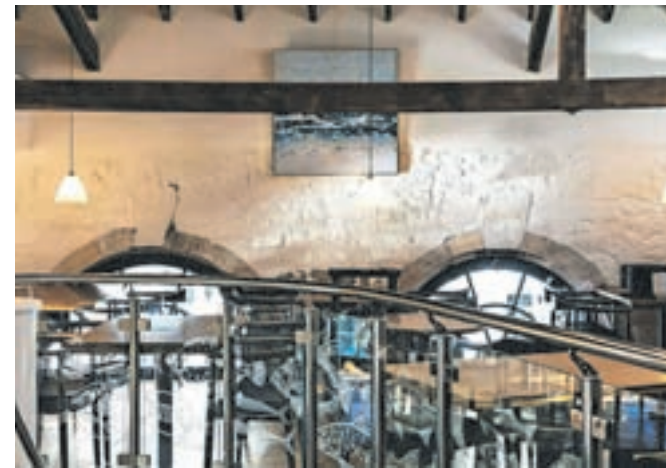
Mala restavracija, ki lahko sprejme 46 gostov, se nahaja nad ribarnico, ki je bila zgrajena leta 1855 in še vedno deluje.

Kako pa vas je izoblikovalo okolje, iz katerega prihajate?