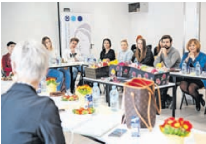
Študenti so z zanimanjem prisluhnili Tinkini in Nežini zgodbi.