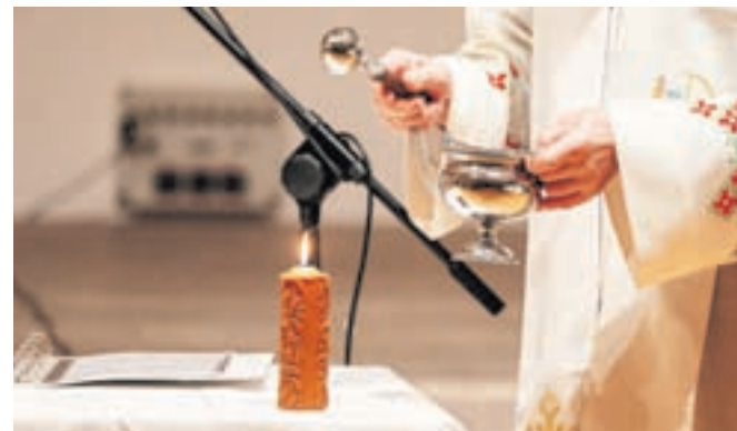
Sveči, blagoslovljeni na svečnico, se pripisuje posebna moč.

Sveči, blagoslovljeni na svečnico, se pripisuje posebna moč, ljudje jo imajo vedno pri roki, da jo prižgejo pri umirajočem, nekateri pa tudi ob hudi uri, da bi sveti plamen odgnal grozeče oblake, odvrnil strel in točo. Prižgejo jo tudi ob nevarnosti poplave. Svečnica je krščanski praznik, ki se obhaja 40 dni po božiču.