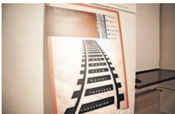
Boris Drobnak je na ogled postavil železniške žebelje – numeratorje, ki so označevali pragove na nekdanji progi Jesenice-Trbiž. Vsak žebelj označuje kraj in leto izdelave železniškega pragu.