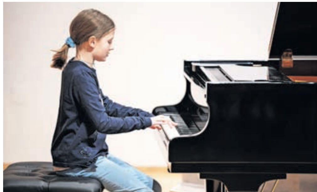
Mladi glasbeniki so skupaj z družinskimi člani poskrbeli za lepo soboto.