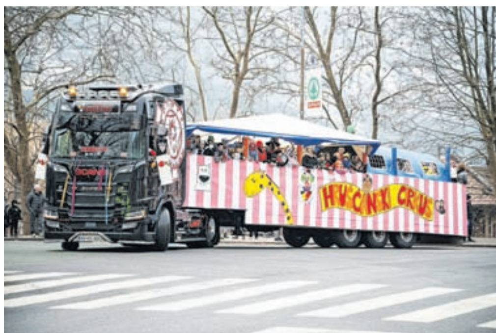
Cirkuški šotor na glavnem vozilu, dolg 23 metrov, na njem pa ciganke, ki so v teh čudnih časih, ko ne vemo, kam gre svet, napovedovale svetlo prihodnost.