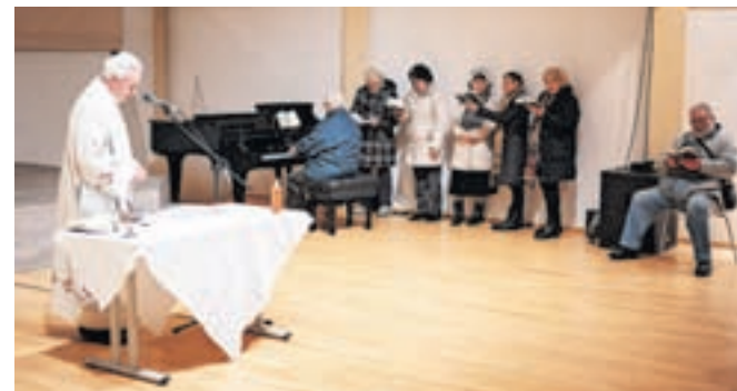
Blagoslov sveč zadnja leta poteka v Kolpernu.