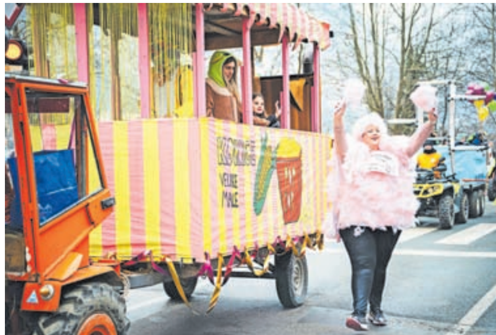
Kot se za vsak pravi cirkus spodobi, tudi na hruščanskem ni manjkalo niti sladkorne pene in pokovke.