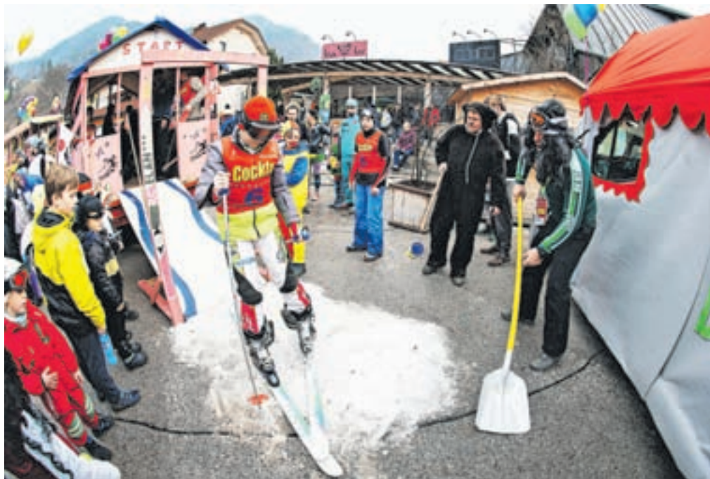
Hruščičani so na Čufarjev trg pripeljali tudi najkrajšo smukaško progo na svetu, hruščanski Streif.