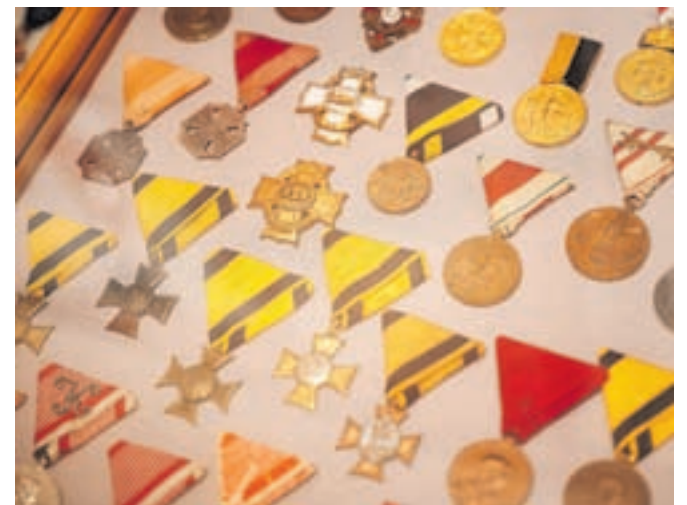
Ivko Blenkuš iz Kranjske Gore ima zavidljivo zbirko medalj, odlikovanj in znakov, zlasti gasilskih.