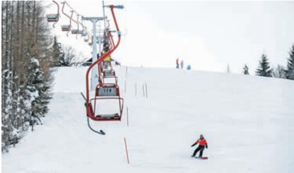
Januarska zimska pravljica na smučišču Španov vrh

Med počitnicami so v sodelovanju z Zavodom za šport Jesenice omogočili brezplačno smučanje mladini, Športni center Španov vrh je podaril 50 smučarskih vozovnic, Zavod za šport Jesenice pa 25. S tem so mladim ljubiteljem smučanja iz jeseniške občine omogočili smučarske užitke na domačem smučišču.