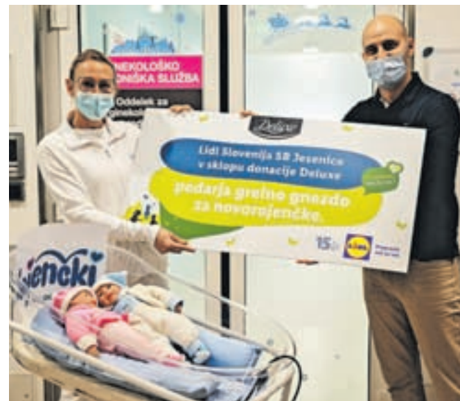
V jeseniški porodnišnici so se razveselili grelnega gnezdeca, ki nudi mehko in toplo zavetje prezgodaj rojenim otrokom.

nekološko-porodniškega oddelka se najlepše zahvaljuje za donacijo podjetju Lidl Slovenija in društvu Slojenčki. V naši porodnišnici se že leta trudimo za prijetno in varno bivanje tako mamic kot novorojenčkov. Grelno