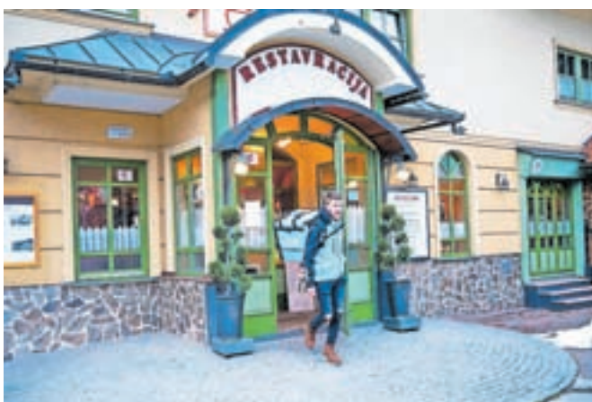
Za zdaj je na Jesenicah v ponudbo vključenih sedem restavracij.

Podjetje Wolt, ki omogoča dostavo iz restavracij, trgovin z živili in drugih lokalnih trgovin, je odslej prisotno tudi na Jesenicah. Kot so sporočili, Jeseničani lahko naročijo dostavo iz restavracij prek platforme Wolt, katere največja prednost je, da omogoča dostavo v 30 minutah, uporabniki pa lahko plačajo s kartico ali z gotovino. Za zdaj je na Jesenicah v ponudbo vključenih sedem restavracij, in sicer Ejga, restavracija Turist, Picerija