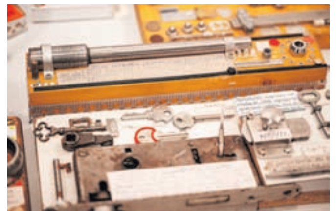
Zbirka inovacij Petra Papića, med njimi je tudi patent mikro povrtala z žepki. Doslej je bila na ogled v njegovi garaži.