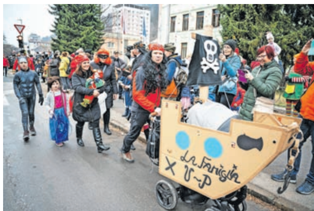
Osrednja tema letošnjega karnevala je bil cirkus: čisto pravi, družinski, otroški, beli, politični ...