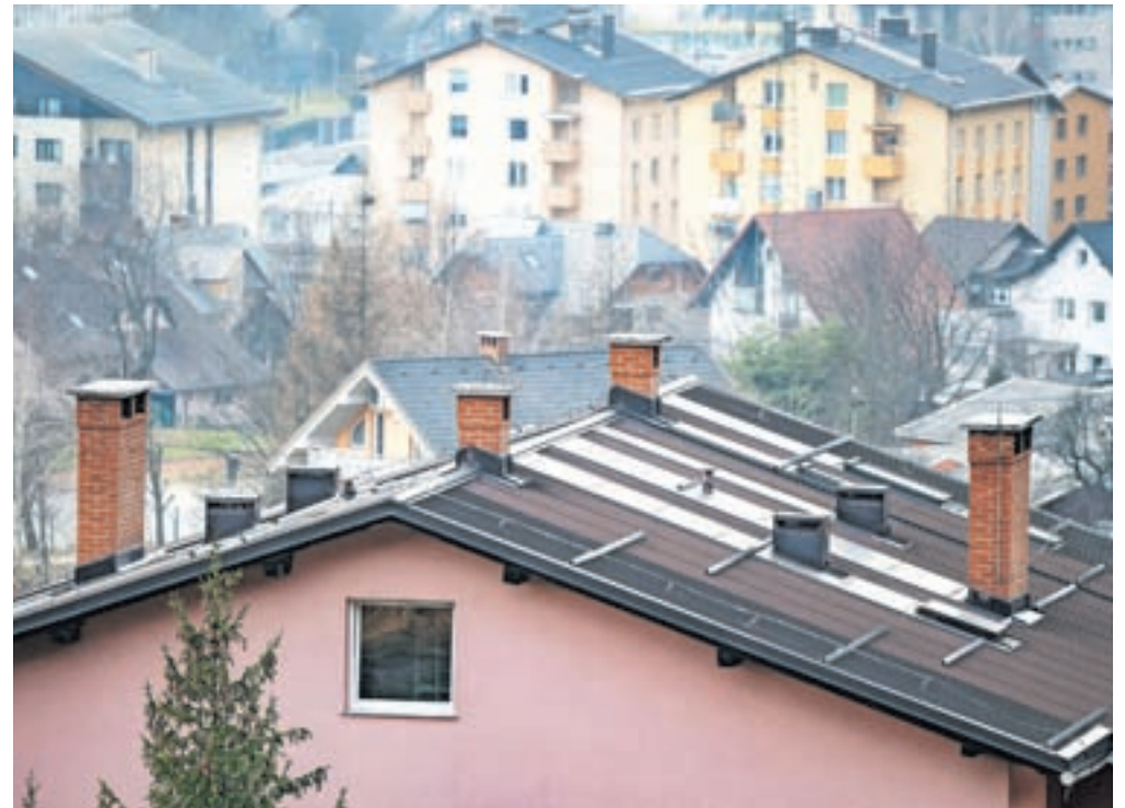
Fosilna goriva v sistemu naj bi vsaj do polovice nadomestili z obnovljivimi viri energije ali odvečno toploto.

Podobno naj bi se zgodilo v javnih stavbah, ki niso priključene na sistem daljinskega ogrevanja. V prihodnjih desetih letih naj bi v čim večji meri začeli uporabljati lokalne vire, kot so sekanci, odvečna toplota, vodik in podobno.