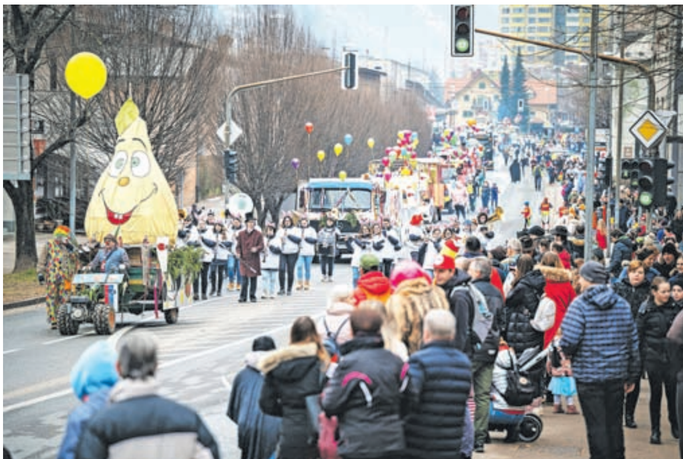
Pustna povorka s 23 vozovi in nekaj sto udeleženci je navdušila na poti od Hrušice do Čufarjevega trga.