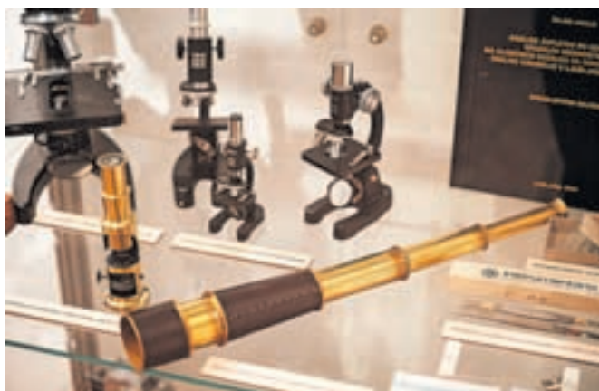
Željko Jakelić že vrsto let zbira medicinske instrumente, tokrat se predstavlja z zbirko mikroskopov in optičnih naprav.