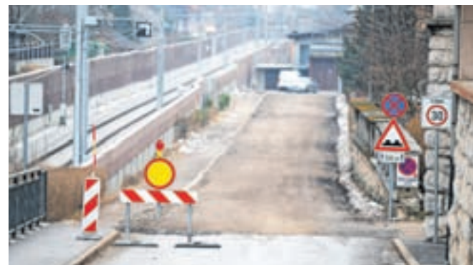
Dela naj bi končali maja.

Zaradi okoliščin izvajalca so se malce kasneje, kot je bilo predvideno, začela dela na Kežjarjevi in Delavski ulici. Cesta mimo kitajske restavracije do TVD Partizan je zaprta, omogočen pa je dostop prebivalcem do njihovih objektov.