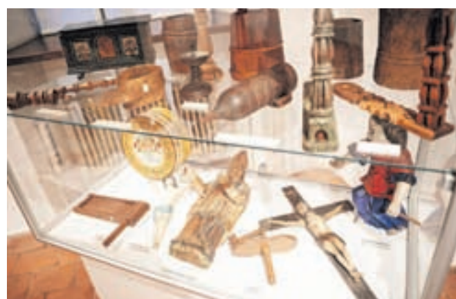
Dušan Prešern se predstavlja z zbirko uporabnih in okrasnih lesenih hišnih predmetov. Na razstavah Iz zasebnih zbirk sodeluje že od začetka, vselej z drugo tematiko.