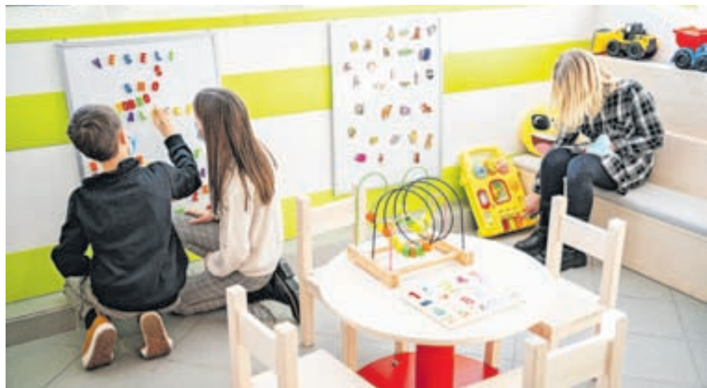
Novi otroški kotichek v avli pediatričnega oddelka