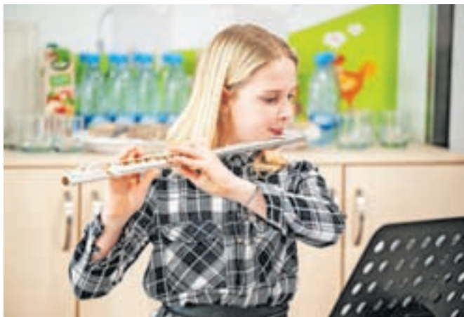
Z odprtja čarobnega koticheka

V projektu so sodelovale polnoletne ženske iz drugih kulturnih okolij, ki so pridobile različna znanja, s pomočjo katerih se bodo lažje zaposlile in se lažje vključile v okolje.