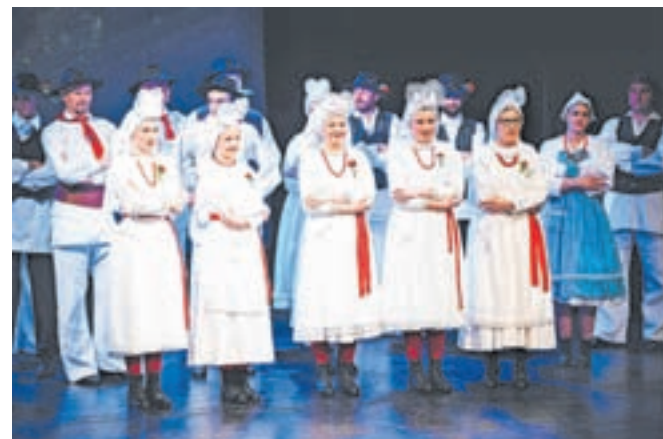
Metliška folklorna skupina je navdušila na Jesenicah.

Jesenice so se v Metliki predstavile predlani, ko je Gledališče Toneta Čufarja je uprizorilo predstavo Vozi, Miško!