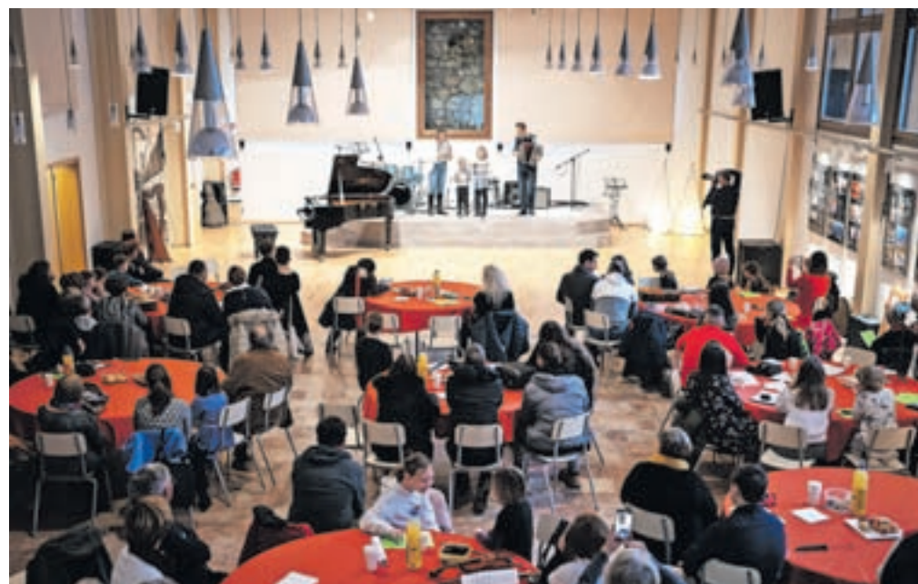
Banketna dvorana v Kolpernu se je zapolnila z glasbenimi radovedneži.