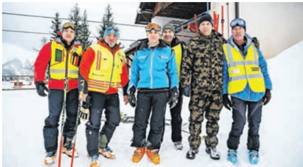
Del ekipe, ki skrbi, da je smučišče urejeno in varno