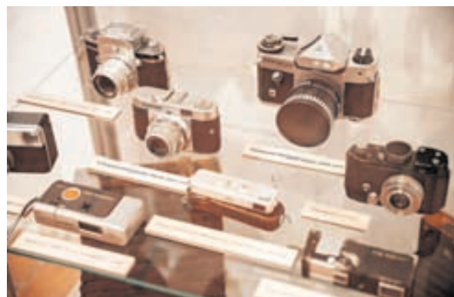
Zbirka fotoaparatorov Vitomirja Pretnarja; v njej sta tudi fotoaparata iz zapuščine znanih jeseniških fotografov Jožeta Žerjela in Jaka Čopa.