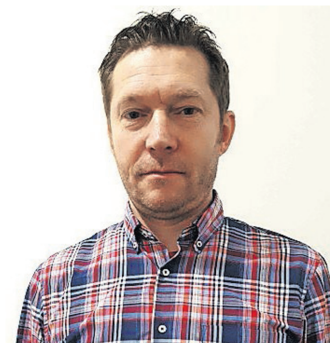
Marko Pazlar

Najpomembnejše tekmovanje za nas je državna liga. Posamezno se, kdor hoče, lahko udeleži državnega prvenstva v hitropoteznem in pospešenem šahu. V klubu se dogovorimo in se nas na-