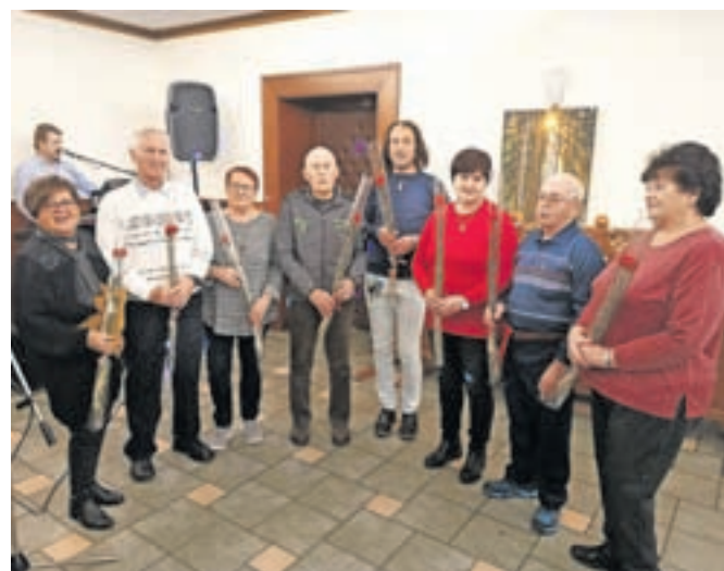
Jubilanti Društva invalidov Jesenice / FOTO: JANKO RABIČ

Pri Medobčinskem društvu invalidov Jesenice, ki združuje člane iz občin Jesenice in Žirovnica, so z decembrskim srečanjem jubilarntov zaokrožili izvedbo različnih dejavnosti v lanskem letu. Pripravili so ga za vse, ki so v letu 2022 praznovali okrogle jubileje, povabili so tudi ostale člane, ki so skupaj v prijetni družbi in preživeli lep večer in nazdravili novemu letu 2023.