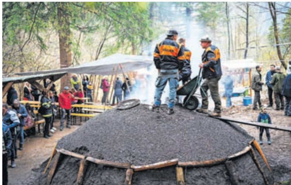
Lani so na Koroški Beli organizirali tudi vseslovensko srečanje oglarjev.

leta 2018 pa vsako leto postavijo in zakurijo kopo za Štefelinovo novino pod Kozjim hrbtom nad Koroško Belo. Oglje kuhajo izključno z namenom ohranjanja znanja in železarske tradicije, dvakrat so tudi uspešno pozkusili pridobiti volka (železo) s taljenjem železove rude v vetrni peči. Kuhanje oglja predstavljajo tudi po solah in vrcih, leta 2019 so skuhalo kopo iz bezgovega lesa in to oglje podarili v vse izobraževalne ustanove v občini Jesenice za ustvarjanje pri likovnem pouku. Lani pa je društvo organiziralo tudi vseslovensko srečanje oglar-