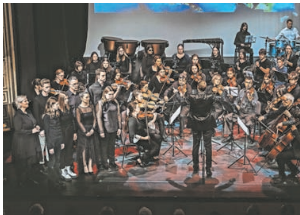
Simfonični orkester s pevci in pevkami

stika in žive glasbe željni tako učitelji, učenci kot tudi publika, se je med drugim odrazilo v kar presenetljivo številnem obisku naših nastopov, kar nas seveda zelo veseli,« je dejala Valantova in se zahvalila tako učencem kot staršem, poslušalcem in občinam, ki podpirajo delovanje šole.