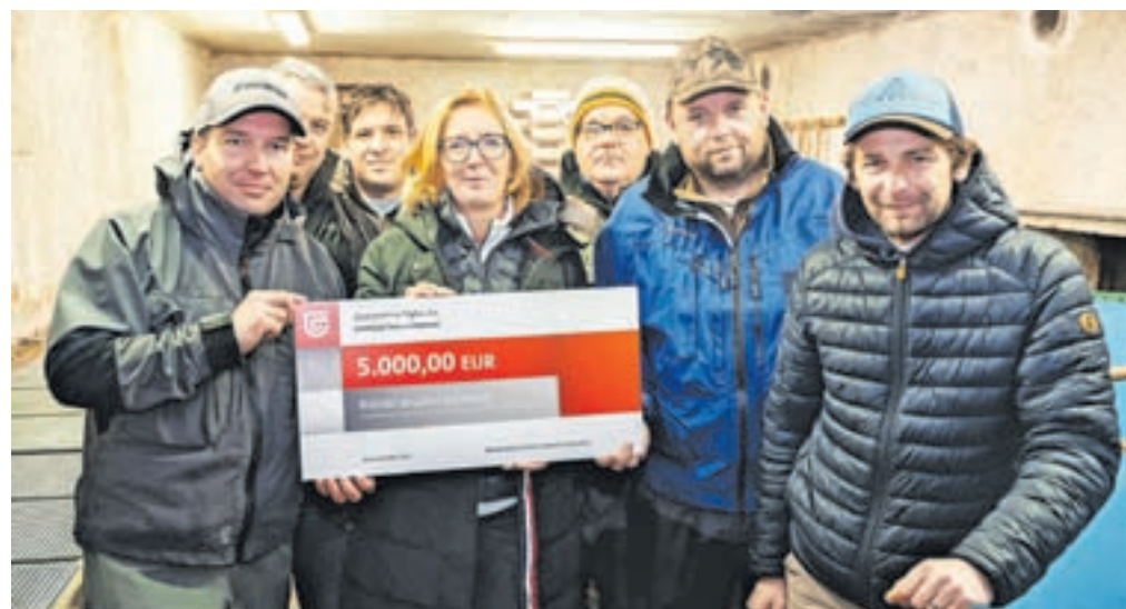
Donacija Območne enote Kranj Zavarovalnice Triglav Ribiški družini Jesenice

smerni električni tok, s katerim omrtvičimo ribe, nato jih izlovimo z mrežami ter nepoškodovane premestimo v vališče,« je še dodal Mezek.