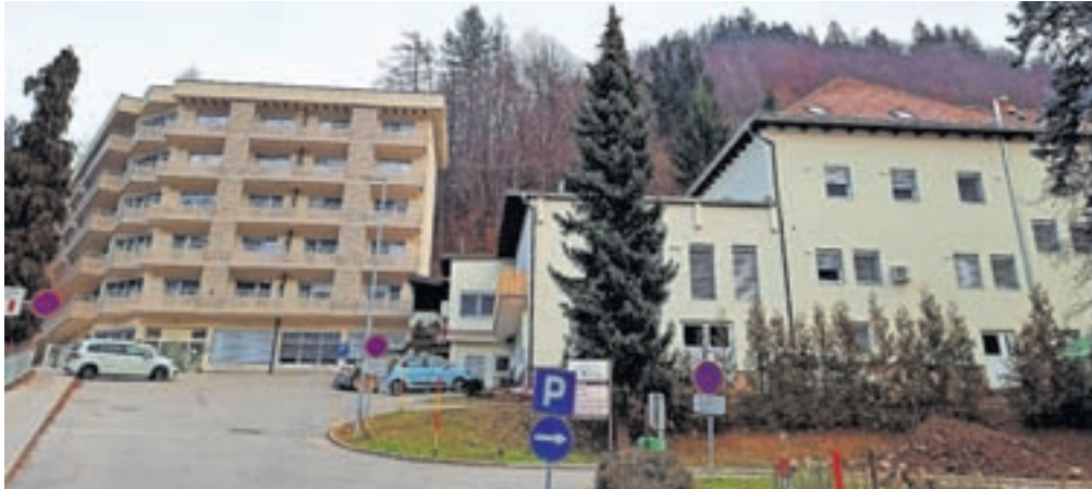
Zunanost energetska prenovljenega doma

ti pogodbo s koncesijskim partnerjem Petrolom. Zamenjali smo vsa okna, vrata in svetila, obnovili štiri kotlovnice, dom ima novo fasado, obnovljeno streho in žaluzije. Z investicijo v vrednosti 1,5 milijona evrov smo pridobili tudi zračne in svetle prostore in s tem pomembno izboljšali kvaliteto bivanja stanovalcev,« je dejala. Luka Omladič iz kabineta ministra za delo, socialne zadeve in enake možnosti je ob čestitkah za uspešno izvedbo poudaril, da je to mo-