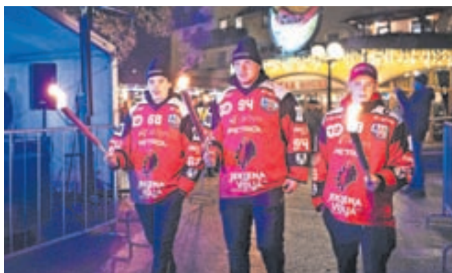
Sprevod športnikov z baklami: sodelovali so člani HDD SIJ ACRONI Jesenice, Curling kluba Jesenice, Drsalnega kluba Jesenice, Karate kluba Huda mravljica, Kegljaškega kluba na ledu in asfaltu, Košarkarskega kluba Jesenice in Nogometnega kluba Jesenice. Takt so dajali bobnarji Pihalnega orkestra Jesenice - Kranjska Gora.