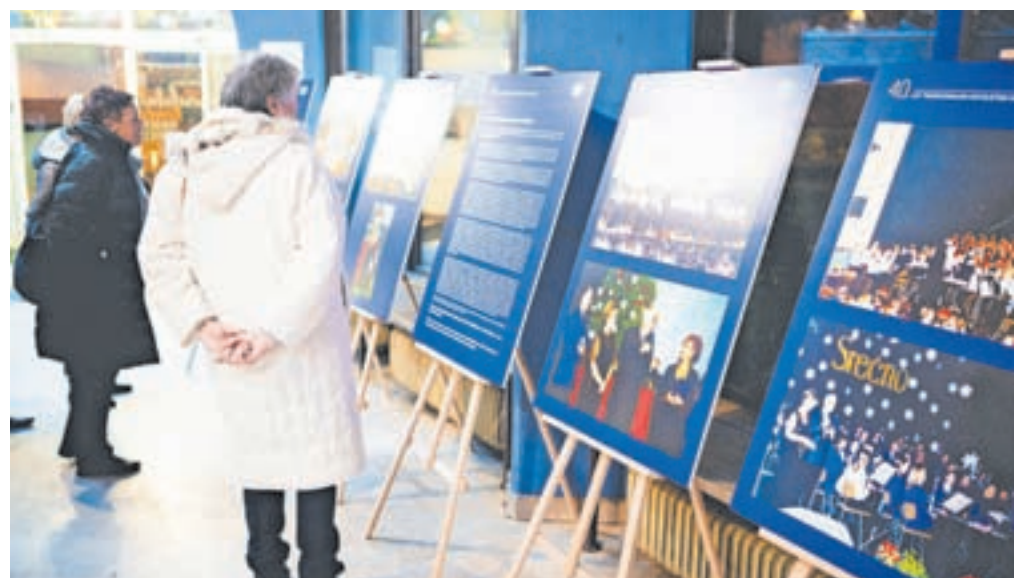
Razstava o zgodovini orkestra v avli gledališča