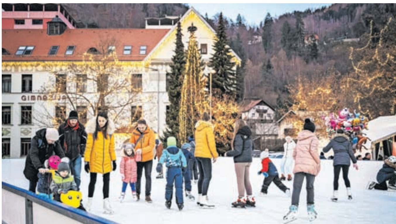
Na montažnem drsališču na prostem na Čufarjevem trgu je bilo v prazničnih dneh ves čas živahno.

December na Jesenicah so po dveh letih ponovno zaznamovali številni dogodki, od obiska dedka Mraza, spreveda z baklami, silvestrovanja na Čufarjevem trgu ... Glavni organizator je bil Zavod za šport Jesenice v sodelovanju z Občino Jesenice in ostalimi soorganizatorji.