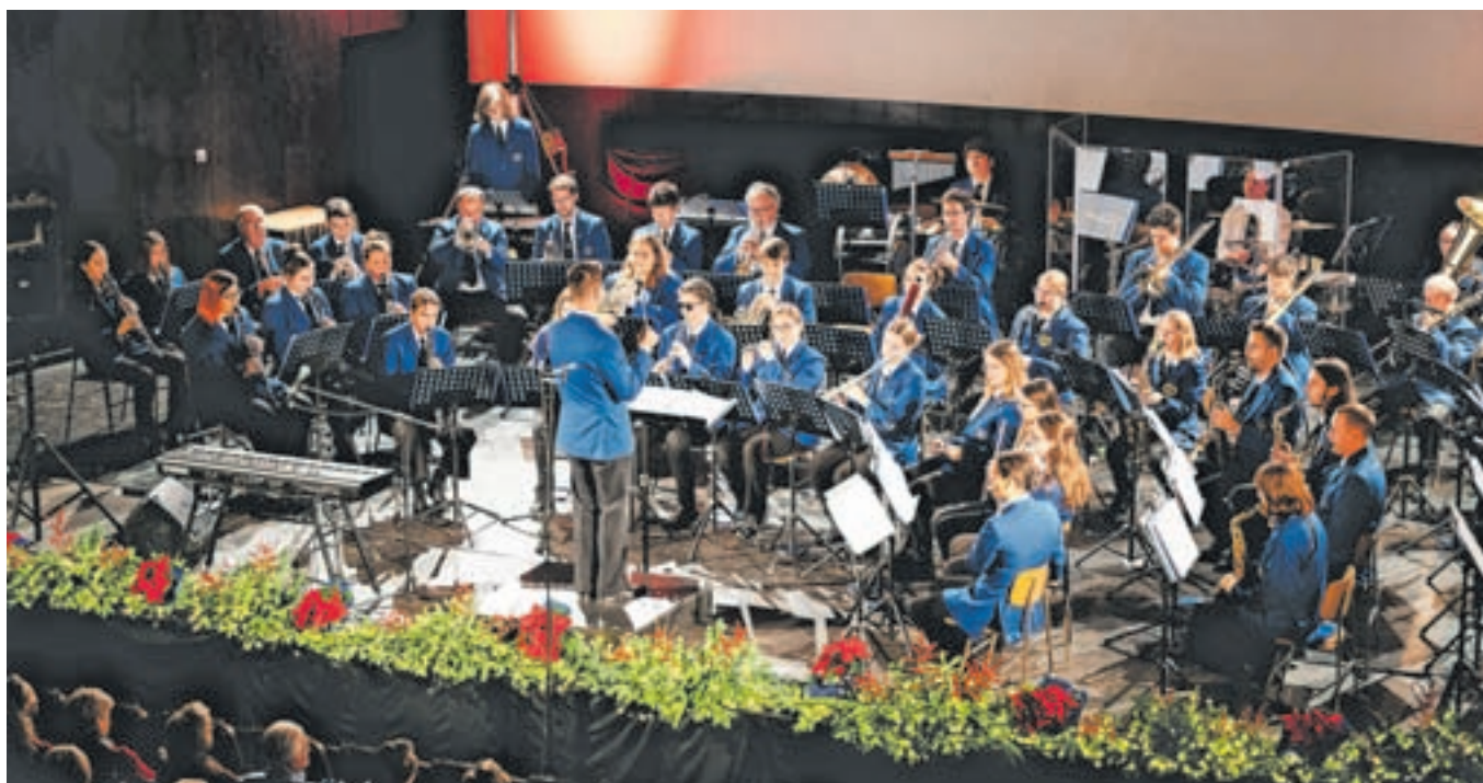
Program je v prvem delu obsegal znane skladbe, ki so jih pred desetletji prepevali velikani različnih glasbenih zvrsti, v drugem delu so zaigrali božične in novoletne skladbe.