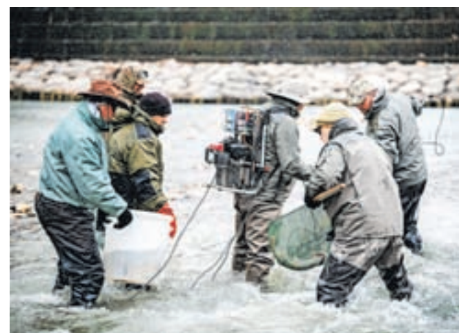
Ribiško delo, ki obsega najrazličnejše aktivnosti oskrbovanja rek, poteka ne glede na vremenske razmere.

smerni električni tok, s katerim omrtvičimo ribe, nato jih izlovimo z mrežami ter nepoškodovane premestimo v vališče,« je še dodal Mezek.