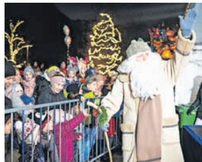
Najmlajše je na Čufarjevem trgu obiskal tudi dedek Mraz, družbo mu je delal Čarodej Toni.