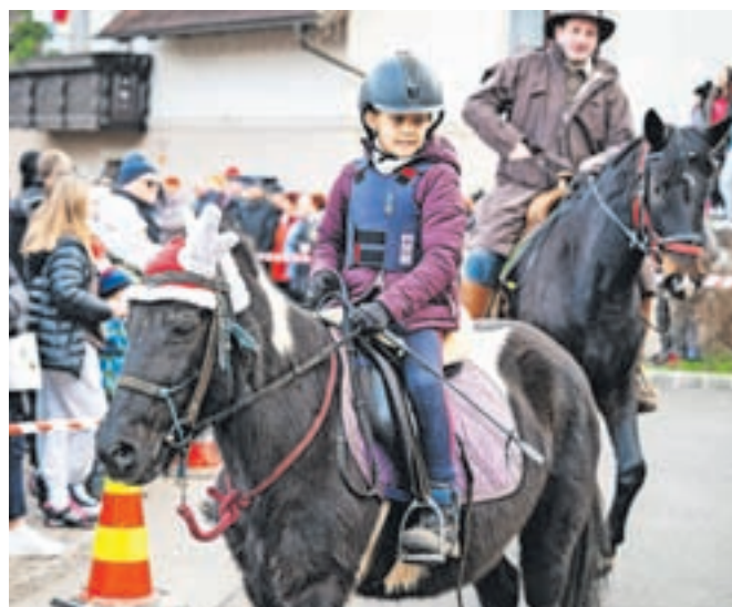
Ena najmlajših udeleženk

Po sveti maši je 49 konj blagoslovil župnik Matija Se-