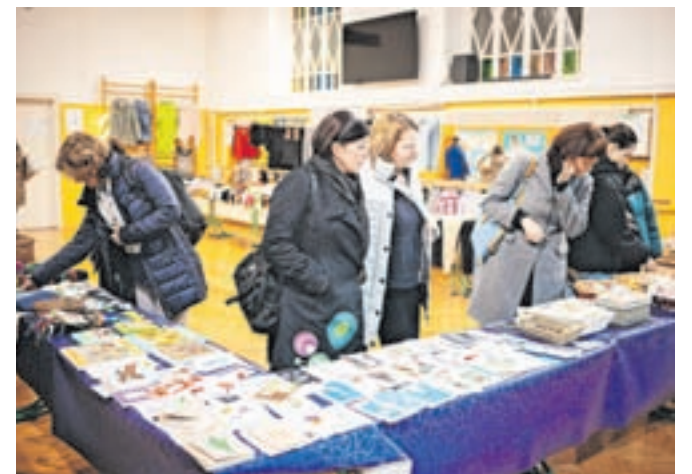
Dobrodelni prispevki, zbrani na bazarju, so bili namenjeni šolskemu skladu za pomoč dijakom iz socialno šibkejših družin.

Dobrodelni praznični bazar je na Gimnaziji Jesenice postal že prava tradicija, saj ga izvajajo že vrsto let. Gre za priložnost za druženje dijakov, profesorjev, staršev in občanov, ki je obenem napolnjena z dobrodelno noto. Na bazarju so tokrat ponudili različne izdelke, ki so jih izdelali dijaki. Obiskovalci so lahko izbirali med čudovitimi ročnimi izdelki, zapesticami, voščilnicami, izdelki iz blaga, naravno kozmetiko ... ter si ogledali razstavo umetniških del dijakin in dijakov, ki so bogatile letošnji koledar Gimnazije Jesenice.