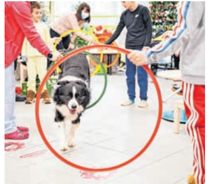
Štirinožni kosmatinci so otrokom prikazali svoje spretnosti, tudi skakanje skozi obroče.