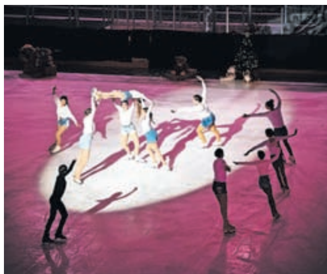
Sedemindvajset umetnostnih drsalcev, starih med šest in osemnajst let, je predstavilo programe tekmovalnega umetnostnega drsanja.