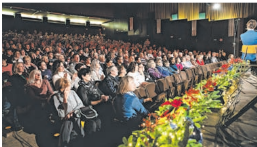
Polna dvorana poslušalcev

članica Dunajske državne opere. Z orkestrom je že večkrat sodelovala na nastopih, tokrat je nekajdnevni praznični obisk na rodnih Jesenicah izkoristila tudi za obisk koncerta. »Zelo sem uživala, bila je topla in prisrčna atmosfera. Kar ne moreš verjeti, kako glasba združuje ljudi. Program je bil prečudovit, ravno pravšnji za ta praznični čas.«