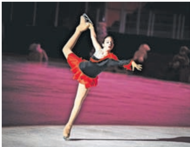
Letošnja revija je nosila naslov Zimska pravljica.

Kot so pojasnili pri DK Jesenice, je trenutno tekmovalna sezona v polnem teku, zato so imeli drsalci za pripravo na razpolago le en teden oziroma šest ur priprav na ledu. Namen revije pa je bil predvsem predstaviti umetnostno drsanje in s tem navdušiti otroke, da se pridružijo temu športu.