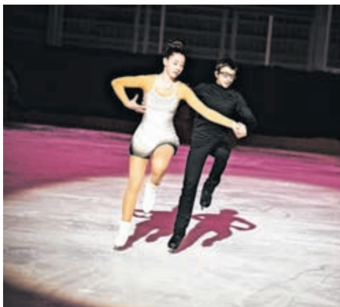
Drsalci so nastopili tudi v parih.