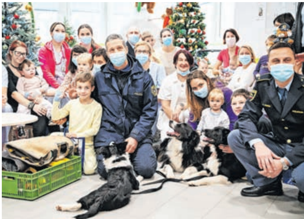
Obisk policistov in policijskih psov pri otrocih v bolnišnici