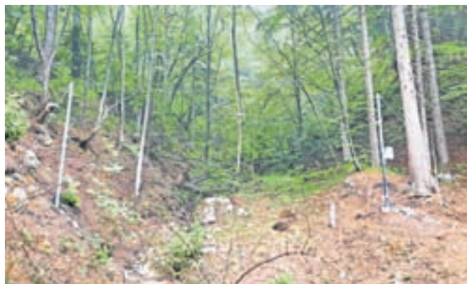
Spremljanje zemeljskih plazov

Slovenije ter Občine Jesenice in Civilne zaštite Občine Jesenice izvajajo v okviru različnih raziskovalnih, tehničnih in evropskih projektov. V letu 2022 je bil postavljen alarmni sistem na zemeljskih plazovih Urbas in Čikla, ki bo ob morebitnem proženju prebivalce Koroške Bele opozoril na pretečo nevarnost. Premike zemeljskih plazov strokovnjaki Geološkega zavoda RS