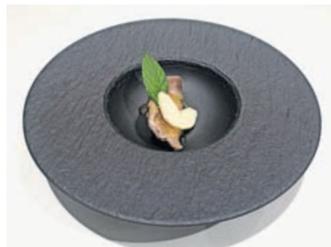
Ajdovi krapji na moderen način Jona Zupana

Priprava: Iz sestavin umešamo testo, ki naj bo bolj goste kot testo za palačinke. S pomočjo žlice testo polagamo v vročo mast.