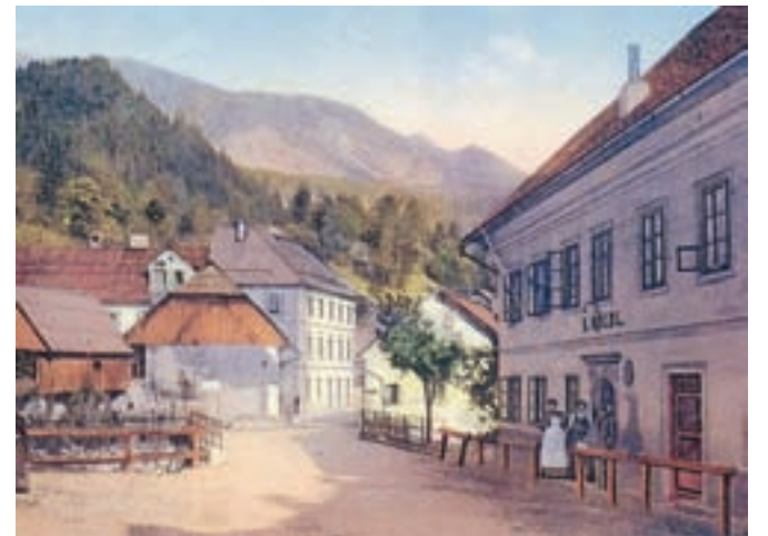
Pogled na vzhodni del naselbinskega jedra Javornik v prvi četrtini 20. stoletja

najst pripadajočih poslopij. Kasneje so zaradi gradnje novih železarskih obratov prestavili še cesto Kranj-Jesenice, južno od železnice. Spomin na izginulo vas pa so prekrili še s prenosom preostalih domačij na levem bregu potoka Javornik v katastrsko občino Koroška Bela tudi po upravni poti, tako da je danes zgodba starega Javornika popolnoma izgubljena tudi v kolektivnem spominu.