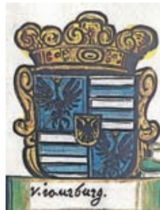
Grb gospodov Javorniških

Takoj po drugi svetovni vojni, leta 1945, so Kranjsko industrijsko družbo preimenovali v Železarno Jesenice, katere lastnica je bila po takratni zakonodaji država. "To pa je tudi začetek konca pestre zgodovine vasi Javornik, njegovih prebivalcev in njegove materialne dediščine ter posledično kolektivnega spomina, ki ga ta ohranja," z grenkobo ugotavlja Humerca. "Železarna Jesenice je od leta 1955 postopno skoraj v celoti porušila in degradirala prvotno vaško jedro Javornika. Najprej je bilo leta