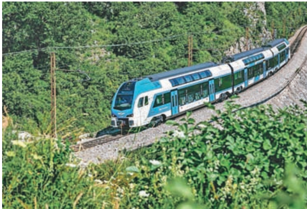
Novi dvonadstropni vlaki imajo velika panoramska okna nadstropje višje, kar je posebno doživetje za potnike.

Novi vlaki so hitrejši, udobnejši in prostornejši. Imajo hitrejšo pospeševanje in potovalne hitrosti do 160 kilometrov na uro. Omogočajo enostavnejši vstop in izstop tudi gibalno ovira-