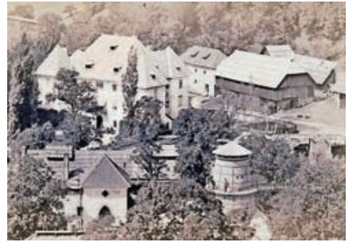
Javorniška grajska posest v letu 1862

1955 zaradi potrebe po širitvi valjarne podrti naselbinsko jedro na desnem bregu potoka Javornik. Razen domačije pri Kosmač so odstranili vse domačije skupaj z gospodarskimi poslopiji. Odstranjeno je bilo tudi vaško jedro s kamnitim vodnjakom in tlakovanjem iz mačjih glav. Porušeno območje je bilo zasuto z visokim nasipom oz. platojem, na katerem so zgradili železarske obrate. Skupno je bilo podrtih vsaj deset objektov." Leta 1959 je Železarna Jesenice zaradi ponovnega širjenja porušila še javorniško graščino in več kot pet-