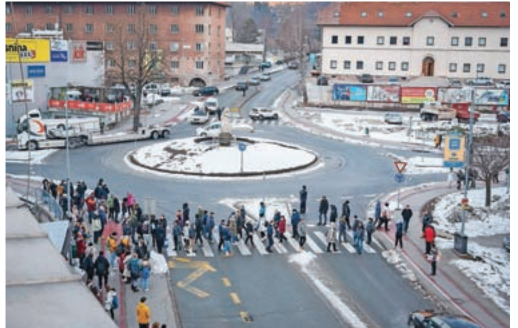
Protest proti visokim cenam ogrevanja v bližini občinske stavbe

"Župan je ponovno izrazil zavedanje problematike podražitev daljinskega ogrevanja v občini Jesenice in s tem stiske občanov, hkrati pa je prisotne obvestil o aktivnostih in rešitvah, ki jih je v tem času opravila oziroma sprejela Občina Jesenice. Na prvem sestanku sta se direktorja podjetij Enos in Enos OTE zavezala, da se bo za končne uporabnike variabilni del cene