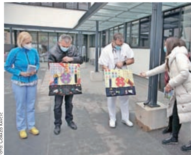
Dve didaktični tabli so prejšnji teden podarili pediatričnemu oddelku Splošne bolnišnice Jesenice.

Izdelale so pet tabel, ki so jih podarile pediatričnemu oddelku Splošne bolnišnice Jesenice, Centru za socialno delo in Zdravstvenemu domu Jesenice, ena pa je na voljo mlajšim udeležencem Ljudske univerze Jesenice. Udeleženke so pripravile tudi zloženko, v kateri so opisale, kako so Dido izdelale in kako jo otroci lahko uporabijo.