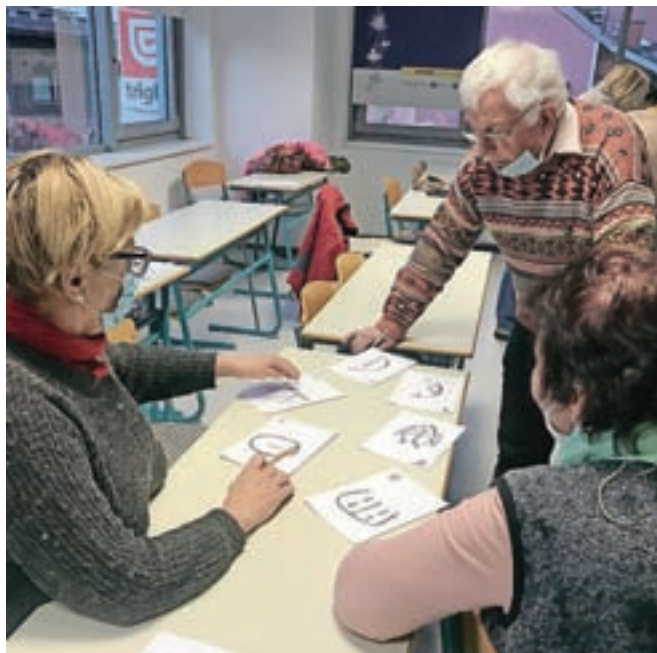
Udeleženci delavnice so se seznanili s kitajskimi pismenkami.