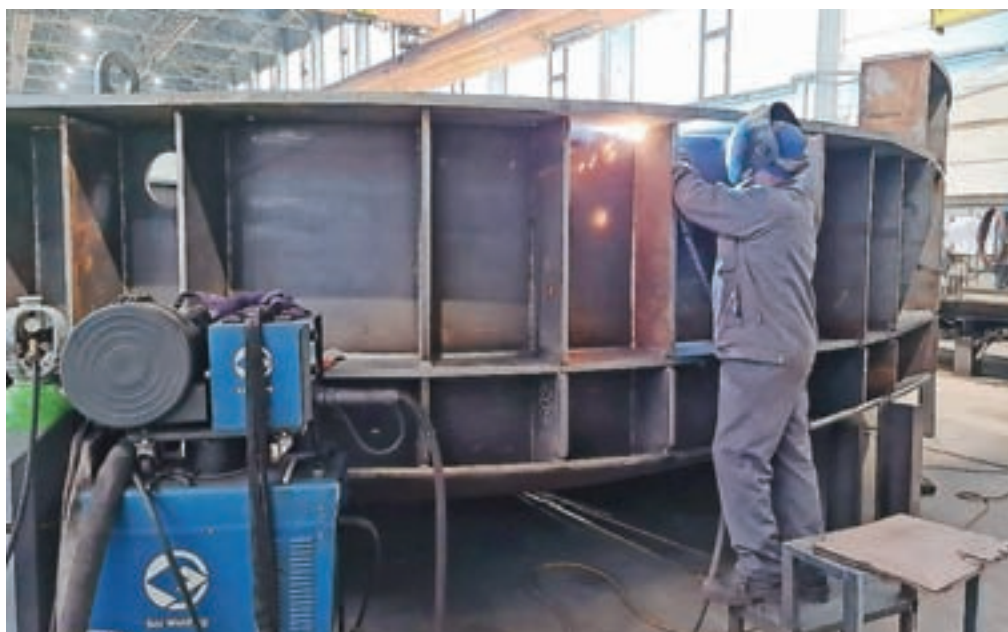
Zaključna dela na okvirju nove elektroobložne peči v delavnici podjetja KOV

V podjetju je okrog petdeset zaposlenih, skupaj z zunanjimi sodelavci in podizvajalci pa jih je okrog šestdeset.