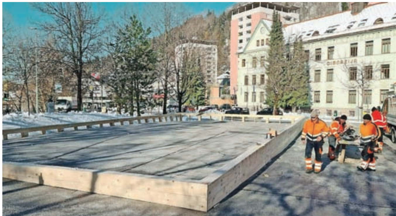
Dršališče na prostem na Čufarjevem trgu bodo odprli v prihodnjih dneh.