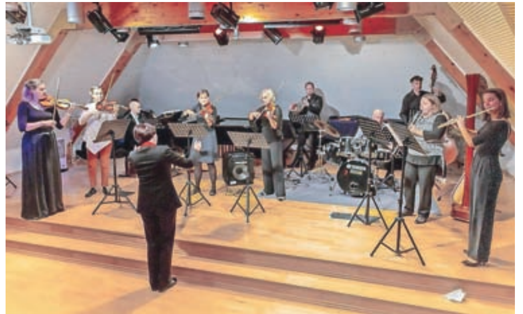
Koncert učiteljev je bil že osemnajsti po vrsti, nadgradili so ga z orkestrsko točko, s katero so zaznamovali leto Josipa Ipvavca.