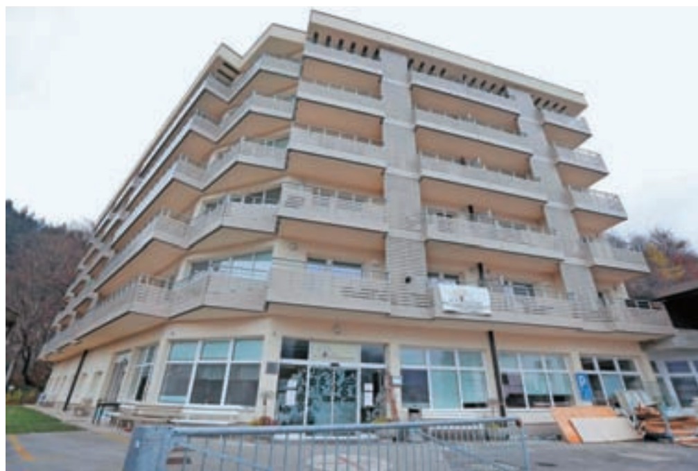
Domu dr. Franceta Bergelja Jesenice je uspelo na razpisu, zgradili bodo objekt E.