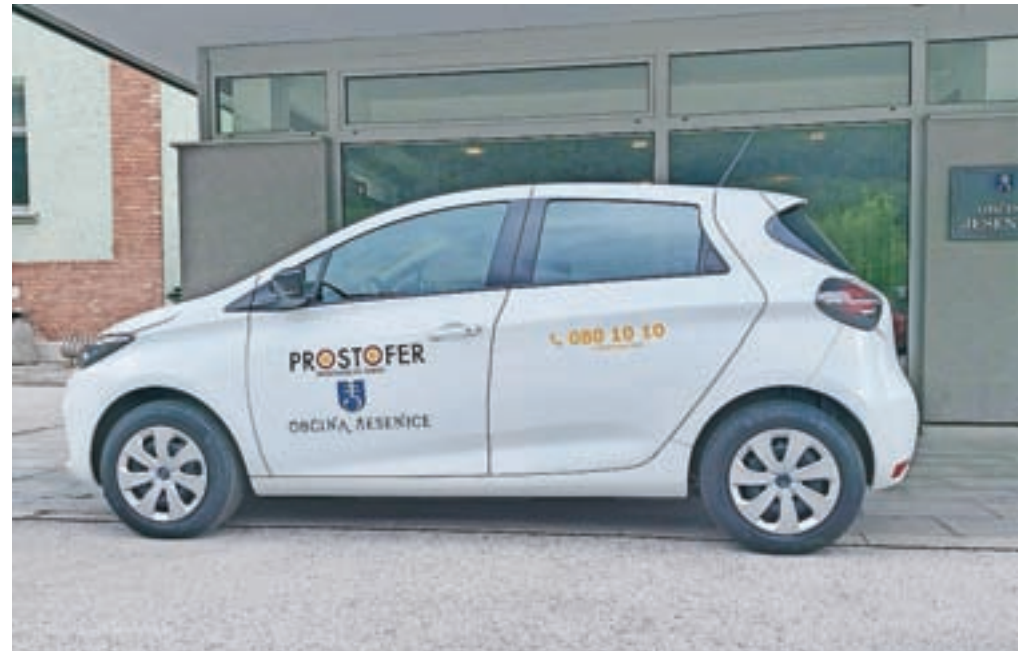
Vozilo, s katerim izvajajo prevoze, je električno, zagotovila ga je Občina Jesenice.

Vozniki v projektu so prostovoljci, ki pravijo, da jim tovrstna pomoč soljudem prinaša tudi osebno zadovoljstvo. Obenem v projektu spoznavajo nove ljudi in sklepajo nova prijateljstva, se počutijo koristne, obe-