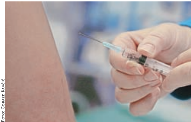
Cepijo s cepivom proizvajalca Pfizer/BioNTech.

ponedeljek, 20. december, med 8. in 13. uro; sredo, 22. december, med 13. in 18. uro; četrtek, 23. december, med 13. uro in 18. uro. Cepili bodo še v četrtek, 30. decembra, med 13. in 18. uro.