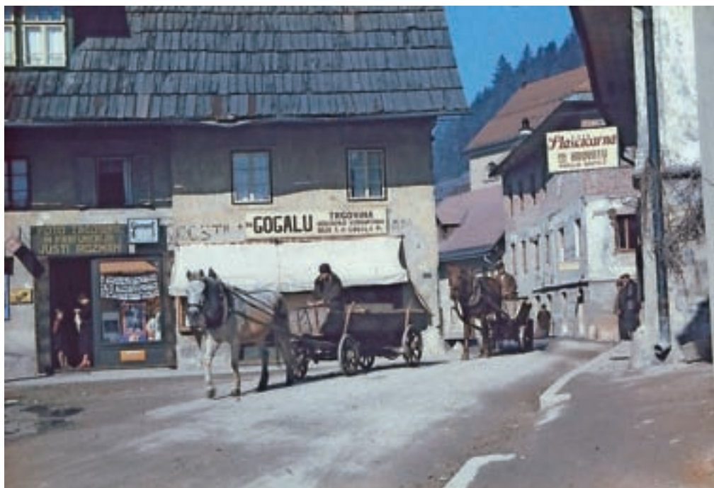
Hrovatova hiša, današnja Titova 49, leta 1939 ali 1940