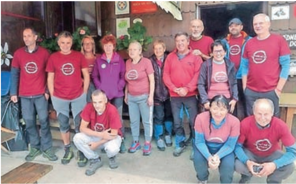
Del udeležencev krožne poti s predstavniki PD Jesenice ob zaključku akcije v Koči na Golici