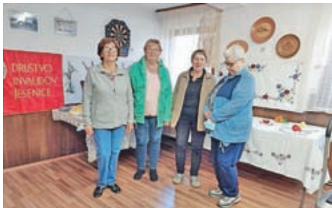
Nekatere od članic društva, ki so sodelovale na razstavi

ja do enajst članic. Udeležujejo se tudi usposabljanj, ki jih organizira Zveza delovnih invalidov Slovenije. Pridobljeno znanje s pridom uporabljajo pri svojem delu. Na razstavi so bili na ogled okrasni in uporabni pred-