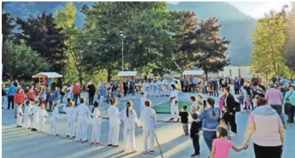
Športni navdušenci so napolnili Čufarjev trg.

otrok oziroma mladine in ostalih občanov k večji telesni aktivnosti in posledično h krepitvi njihovega zdravja in s tem splošnega zdravja v občini Jesenice. Kot še en del aktivnosti pa bodo otroci in starši v šolah in vrtcih prejeli tudi e-informator o možnih športnih aktivnostih, ki se jim otroci lahko pridružijo na Jesenicah v šolskem letu 2021/2022," so ob tem povedali na Občini Jesenice.