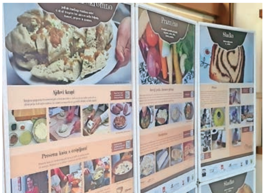
V avli jeseniške knjižnice je na ogled razstava utrinkov kuharskih delavnic.