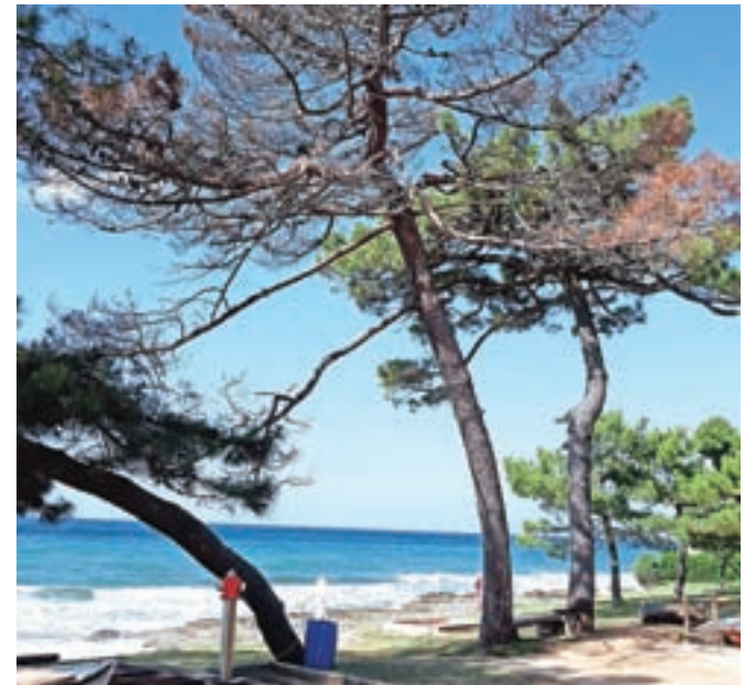
Borovci v letovišču so stari, poškodovalo jih je tudi neurje, zato bodo zasadili nove.

Kot že vrsto let doslej so v avgustu maxovci izvedli tudi nov rekreacijski podvig z Jesenice do Novigrada. Tokrat so se odločili za kolesarjenje, pot pa so popestrili s šestnajstimi zabavnimi igrami.