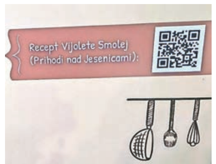
Obiskovalci razstave lahko poskenirajo QR-kode in si tako na telefon prenesejo izbrane recepte.