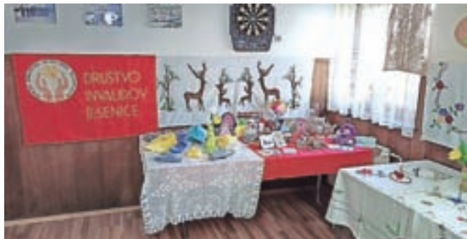
Na razstavi so bili na ogled okrasni in uporabni predmeti, pletenje, prti, slike, vizitke in nakit.