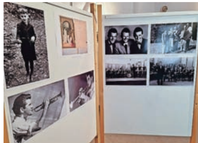
Prvi del razstave govori o Koširjevih začetkih.