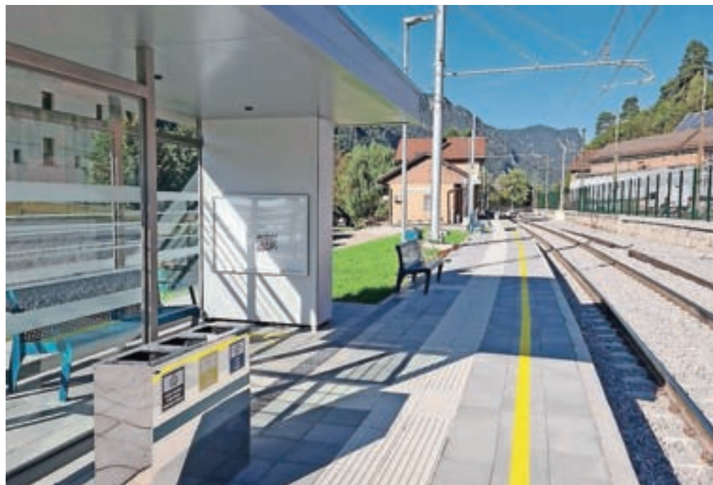
Postavili so tudi nov nadstrešek za potnike, klopi, koše za smeti, table za obvestila ...

V sklopu nadgradnje gorenjske železniške proge med Kranjem in Jesenicami so obnovili tudi peronsko infrastrukturo na nekaterih železniških postajah. Tako je tudi na Slovenskem Javnem železniškem postajniku, kjer je peron že lepo urenjen, postavili so tudi nov nadstrešek za potnike, ki čakajo na vlak, klopi, koše za smeti, table za obvestila ... Ob tem pa obnova proge še ni zaključena, potniki še naprej opozarjajo na velike zamude vlakov na tem odseku. S problematiko so se seznanili tudi župani šestih zgornjegorenjskih občin, ki so poudarili, da nadgradnjo gorenjske železniške proge podpirajo, saj bo zagotovo pozitivno prispevala k trajnostni mobilnosti. Ob tem pa razumejo težave, s katerimi se v zadnjem letu srečujejo potniki. »Z investitorji in izvajalci si ves čas gradnje prizadevamo, da bi bila dela čim