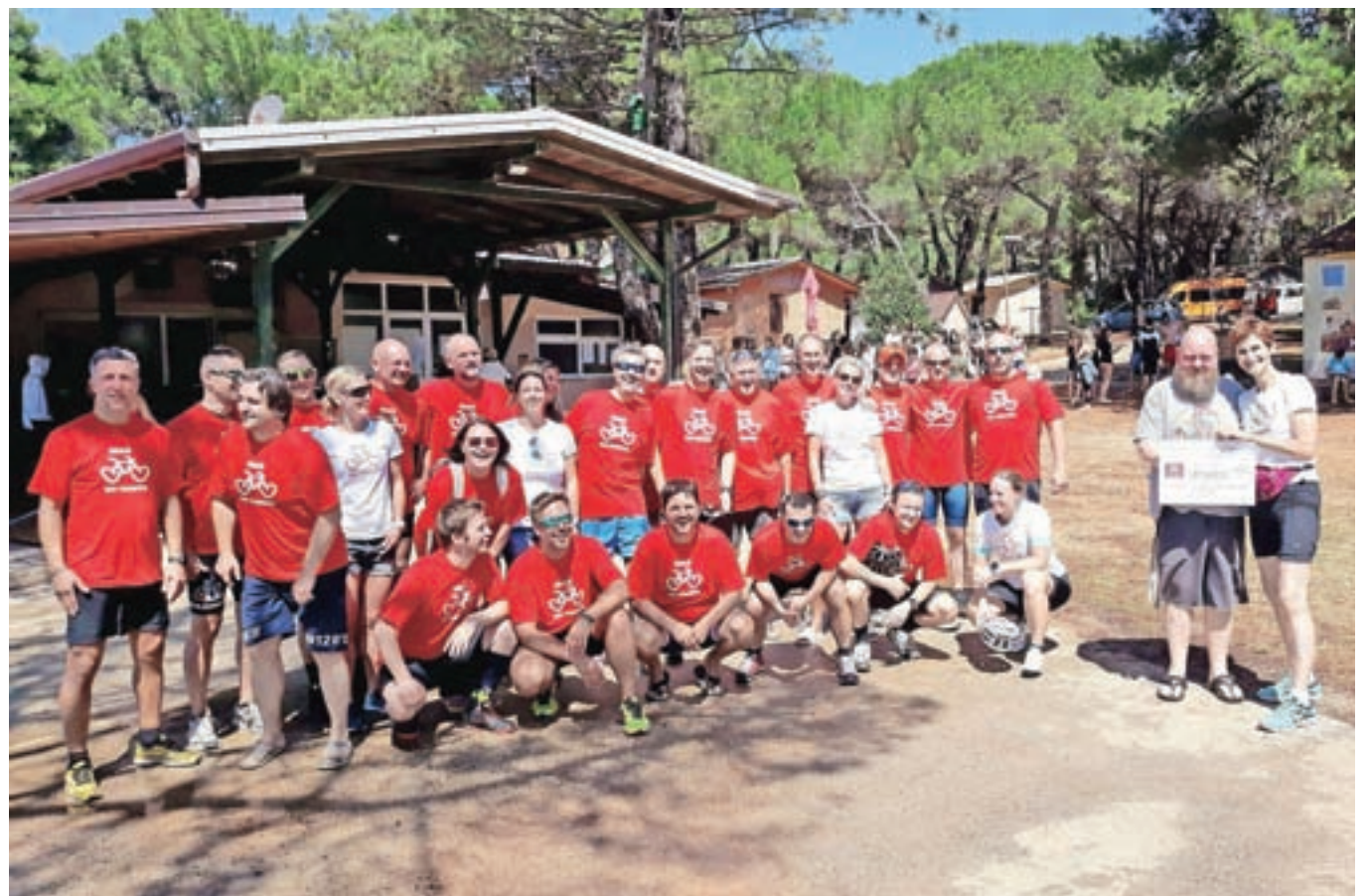
Maxovci so letos kolesarili do Pinete.