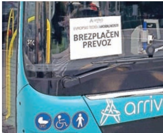
Avtobusi mestnega prometa, ki so vozili brezplačno, so bili označeni s posebnimi tablam.

Občina Jesenice je letos v projektu Evropskega tedna mobilnosti sodelovala že osmo leto. Čeprav zaradi trenutnih epidemioloških razmer letos ni bilo organiziranih večjih javnih dogodkov, v organizacijo katerih se vključijo tudi različne jeseniške organizacije, pa je Občina Jesenice tudi letos v sodelovanju z Arrivo Slovenija zagotovila enodnevni brezplačni avtobusni prevoz. Z avtobusi mestnega potniškega prometa so se potniki lahko brez nakupa vstopnice peljali v sredo, 22. septembra.