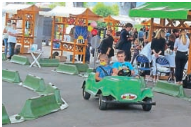
Na poligonu Jumicar so se otroci preizkusili v vožnji z mini avtomobilčki.

sicer vse elemente pravega vozila, od varnostnega pasu, zavornega pedala in pedala za plin. Na prireditvi pa so podarili tudi kolesarske čelade in druge praktične nagrade osmim učencem iz osnovne šole in petimi otrokom in vrtcev, ki so sodelovali v izobraževalni nagradni igri Bisstro glavo varuje čelada oziroma Varni v prometu. Poudarek igre je bil na uporabi zaščitnih kolesarskih čelad in na obvezni opremi za kolo, otroci pa so na to temo ustvarjali risbice.