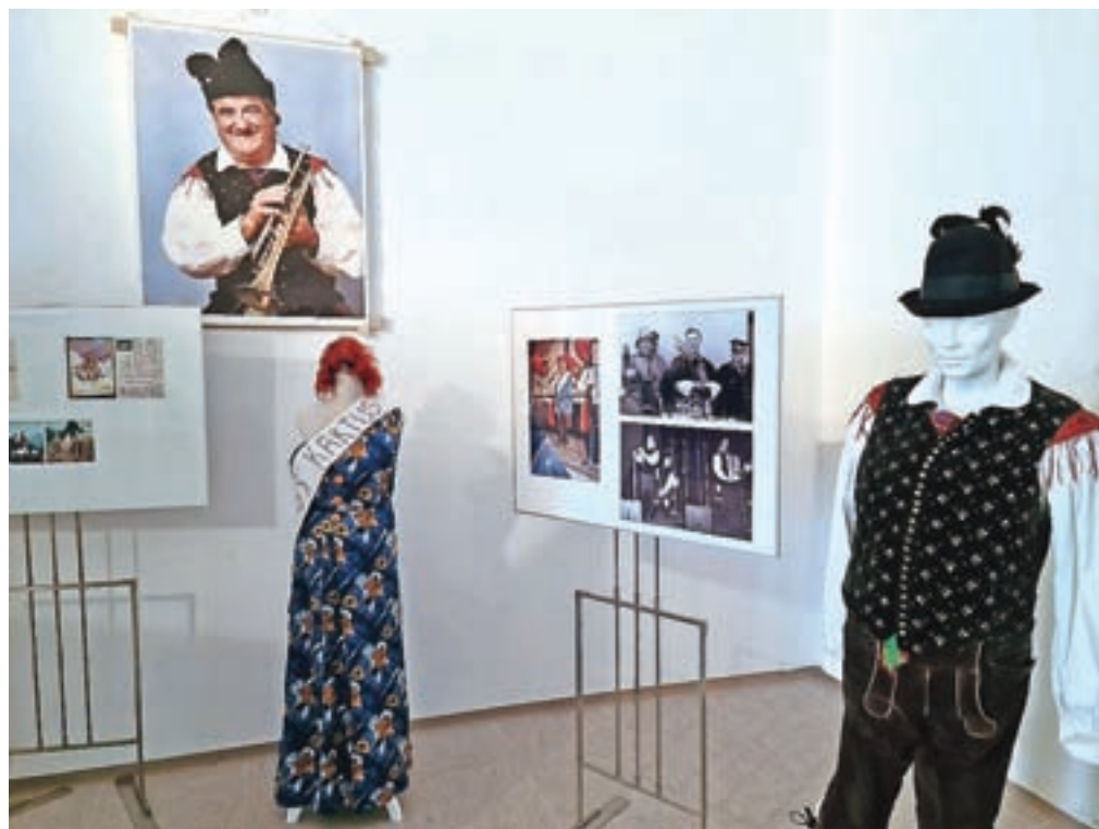
Na ogled je tudi Koširjeva narodna noša, v kateri je nastopal, ter pustni kostum miss kaktus.