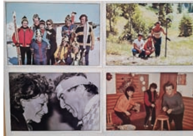
Fotografije iz družinskega albuma, ki jih je prispevala družina Košir / FOTO: URŠA PETERNEL