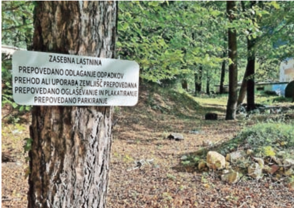
Stanovanjski sklad je že začel parcelacijo, čiščenje in manjše rušitve na zemljišču ob TVD Partizan sredi Jesenic.

Kot so nam pojasnili na stanovanjskem skladu, bodo v letošnjem letu uredili zemljišče, ki je že v lasti sklada, tako že potekajo parcelacije, čiščenje in manjše rušitve. Še letos naj bi pridobili tudi idejno zasnovo območja in začeli pripravljati dokumentacijo za pridobivanje gradbenega dovoljenja.