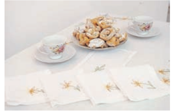
Za razstavo so ocvrle, skuhale in spekle razne dobrote: flancate, kruh, potice, štruklje ...

Sponzor križanke je DRUŠTVO KRIŽEMKRAŽEM , sekcija, ki deluje v okviru Ljudske univerze Jesenice in Društva upokojencev Jesenice že od leta 2012. Z igro se lahko seznanite v živo v prostorih LUY-a. Možna je tudi igra na spletu. Več informacij dobite na spletu pod Društvo KRIŽEMKRAŽEM (društvo-krizemkrazem.si). Podarjajo štiri nagrade: 1. igralni komplet igre Križemkražem, 2. in 3. dežnik in copate, 4. ročno izdelan kvačkan prt.