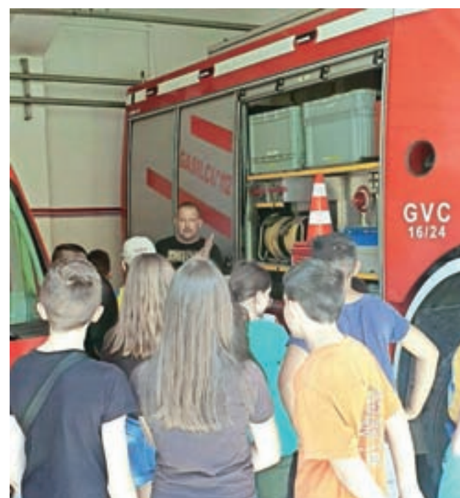
Obiskali so Prostovoljno gasilsko društvo Jesenice.

V sklopu Društva Žarek imajo tudi sprejemni center na Jesenicah, Bledu in v Radovljici, kjer omogočajo individualne pogovore, delujejo pa tudi skupine za svojce zasvojenih. Dosegljivi so na telefonskih številkah 040/790 345 ali 030/348 153. Obstaja pot iz zasvojenosti in vabimo vas k iskanju rešitev in premikov, pravijo.