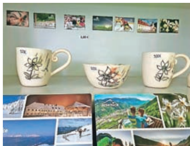
Na policah TIC-a Jesenice so obiskovalcem na voljo različni spominki, tudi nove razglednice Jesenic z različnimi motivi.

TIC Jesenice je skrbel tudi za promocijo Jesenic v sklo-