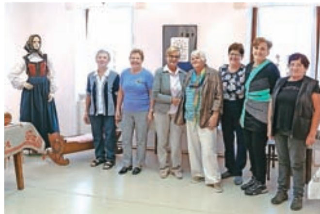
Članice dveh krožkov, ki so pripravile zanimivo in okusno razstavo

Na ogled je še do sobote, 2. oktobra, vsak dan od 15. do 19. ure.