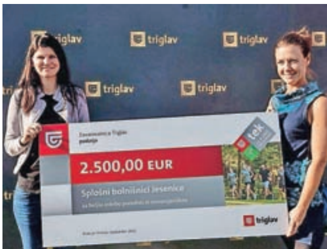
Donacija z dobrodelnega Triglav teka za Splošno bolnišnico Jesenice

Na Brdu pri Kranju je potekal Triglav tek, ki se ga je udeležilo več kot tisoč tekačev. Tek je imel dobrodelno noto, saj so tekači, njihovi spremljevalci in vrhunski slovenski športniki z udeležbo podprli dober namen, to je boljšo oskrbo porodnic in novorojencev. Donacijo za boljšo oskrbo novorojencev in porodnic so prejeli štirje porodniški oddelki splošnih bolnišnic, tudi Splošne bolnišnice Jesenice. Prejeta sredstva v višini 2500 evrov bodo namenili za porodno pručko in pediatrični stetoskop.