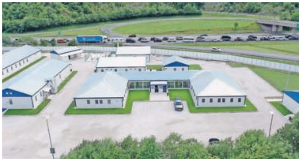
Naselje, v katerem bivajo turški delavci, je tik ob avtocesti pred predorom Karavanke, pod Hrušico. Je ograjeno in izredno urejeno.

Kot so nam pojasnili, ta čas v naselju biva okrog sto zaposlenih pri Cengizu, gre tako za delavce kot inženirje in tudi adminis-