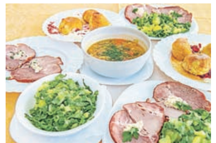
Suh vratnik in endivija s krompirjem ter zelenjavna župa in češplove knedlni iz Doma Pristava