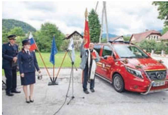
Ob prazniku so člani PGD Blejska Dobrava prevzeli novo gasilsko vozilo za prevoz moštva, ki ga je blagoslovil tudi domači župnik.