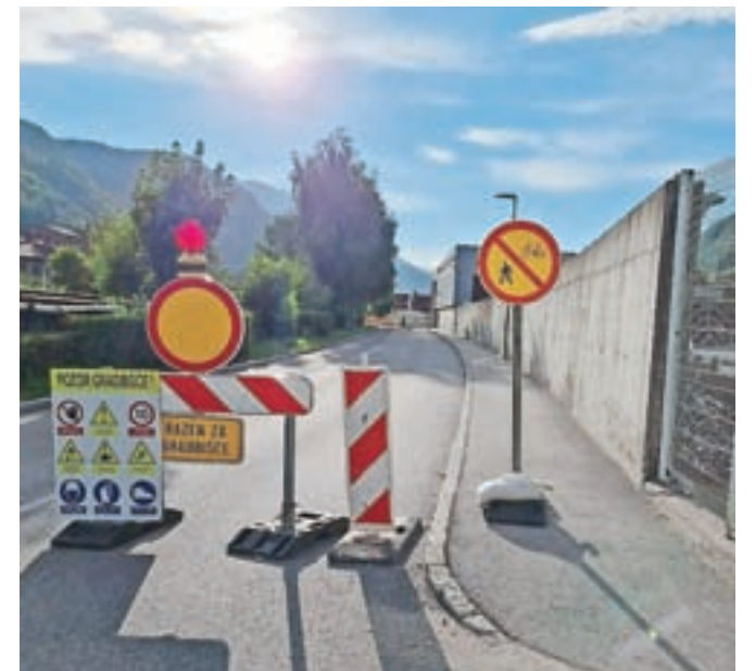
Izvajalec je podjetje Inkaing, dela naj bi bila zaključena v prvi polovici oktobra.

Cesta Franceta Prešerna je vzporedna glavni cesti skozi Jesenice in jo vozniki v času zapor in gneče uporabljajo kot obvozno cesto. Ker je zdaj zaprta, ves promet poteka po glavni regionalni cesti skozi mesto. Ta pa je še dodatno obremenjena v času turistične sezone, saj jo za obvoz uporabljajo številni vozniki, da se izognejo zastoju na avtocesti pred predorom Karavanke.