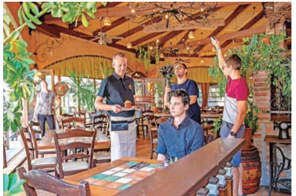
Posneli so tudi promocijske filmčke, v katerih so sodelovali učenci turističnih krožkov iz projekta Turizmu pomaga lastna glava.

Vse te jedi so vključili v nabore jedi, ki jih gostinci lahko ponujajo pod enotnim imenom Delavska malca. Pri-