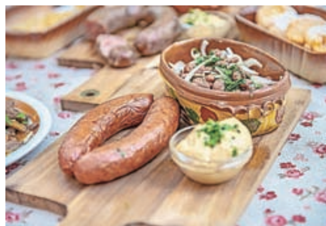
Kranjska klobasa in okisan fržov iz Restavracije Kazina Jesenice