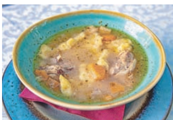
Ajmoht z vaseršpocni iz restavracije Turist