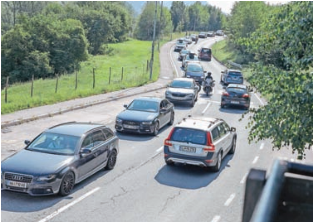
Izvoz z avtoceste na Javorniku je bil poln pločevine.

so težave zmanjšali in olajšali življenje domačinov, in sicer z zaporami, usmerjanjem in pospeševanjem prometa. Tako so v času največjih kolon občasno zapirali izvoze z avtoceste za tranzitni promet, na mestu semaforjev so ročno usmerjali promet, spremenjeni so bili intervali semaforjev, nekatere lokalne ceste so zaprli za tranzit, so pojasnili. Med drugim so uvedli začasno zaporo pro-