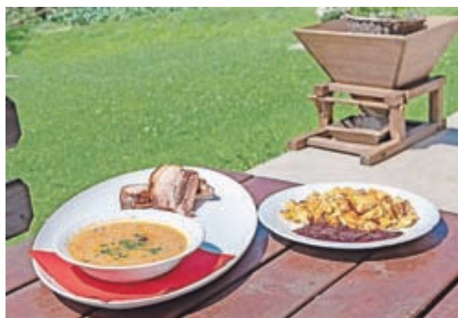
Ješprenj s suhimi rebri in šmorn z marmelado iz kmečkega turizma Pr' Betel