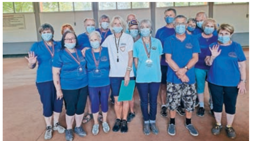
Zmagovalne ekipe / FOTO: ANUŠA FERJAN

krbela že kar izkušena ekipa pod vodstvom Jelke Volarič in sodnice Tatjane Čepon.