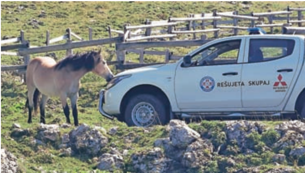
Utrinek z akcije: "poljub" ...

ciji v okolju ter znanju določitve GPS-lokacije. Poznavanje lokacije je zlasti pomembno, ko pokličemo na pomoč reševalce, pa zaradi nepoznavanja terena ne