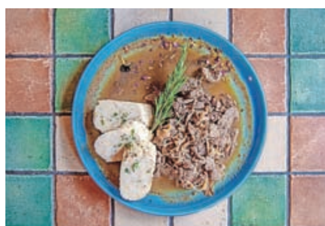
Tenstana jetra s kruhovim cmokom iz Gostilnice Chilli