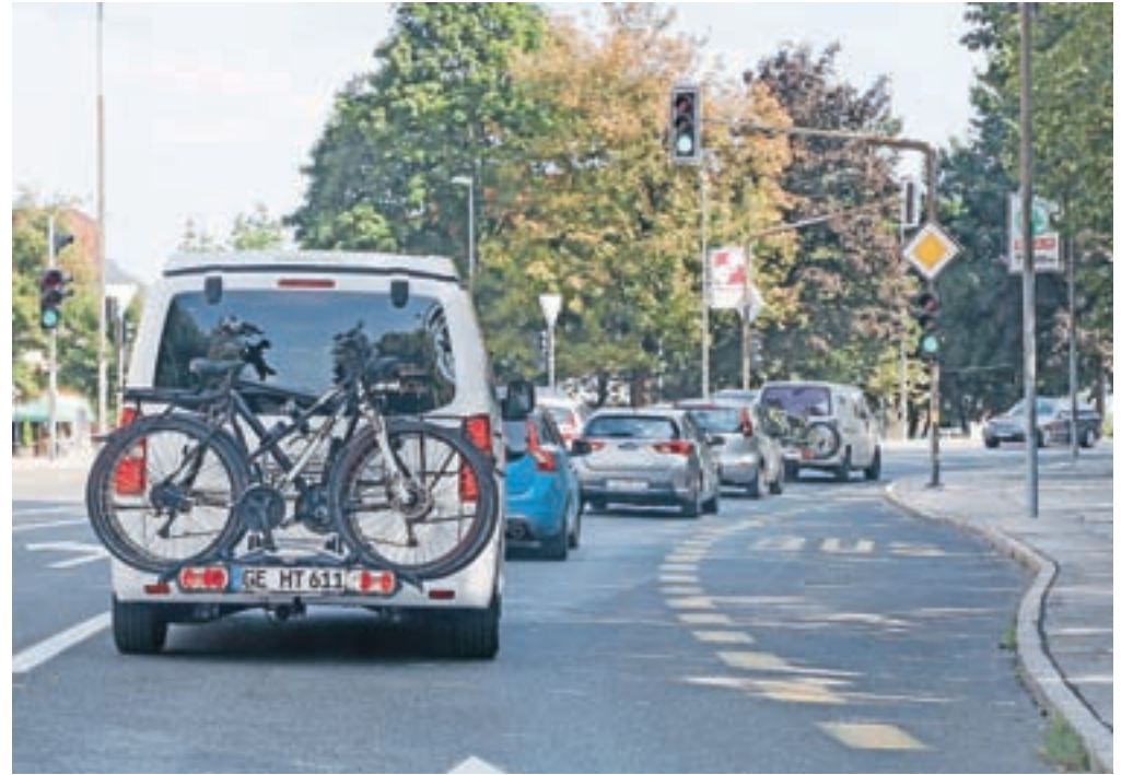
V koloni sredi mesta se bili tudi številni tujci. Eden od občanov se je na Facebooku jezil, zakaj jim ne znajo ponuditi vsaj vode in reklame za občino Jesenice, če že ne kakšne 'šamrole' ...

meta skozi Podmežaklo, promet je bil dovoljen samo lokalnim prebivalcem.