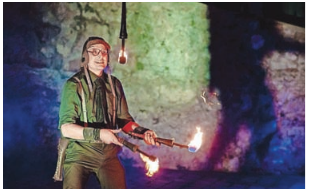
Skupina Čupakabra je žonglerska in ognjena skupina.