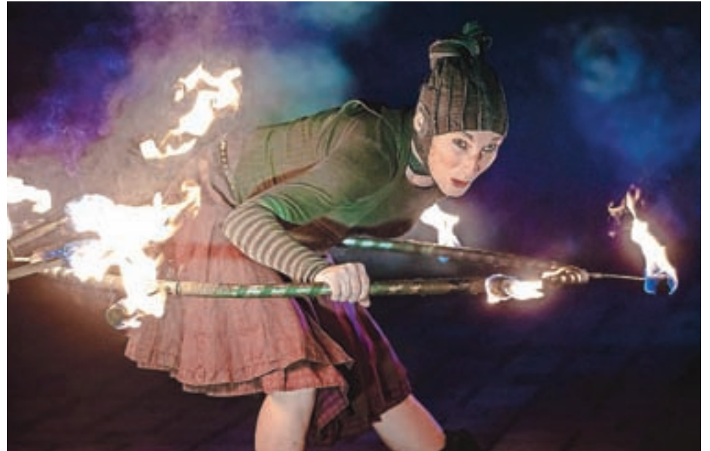
Lučka je pravljica o pogumni mali deklici.