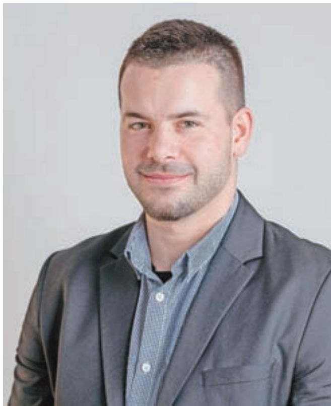
Alen Škrbo

Smo relativno mlad klub, ki deluje šest let. Žal v zadnjem letu in pol ni bilo nobene tekme. Vsi v klubu komaj čakamo, da se stanje izboljša in se s tem omogo-