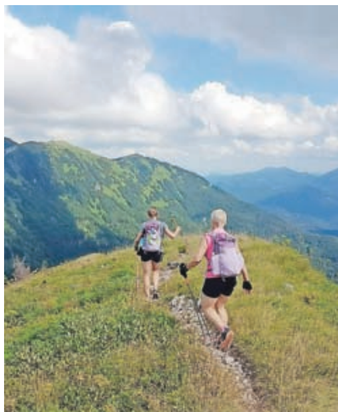
"Teden dni dopusta sva posvetili svoji najljubši dejavnosti, gibanju v naravi, in ga na ta način dodobra in v popolnosti izkoristili," pravita dekleti.

Na pot sva se odpravili z namenom, da jo prehodiva, in ne da bi postavljali hitrostne rekorde. Teden dni dopusta sva posvetili svoji najljubši dejavnosti, gibanju v naravi, in ga na ta način dodobra in v popolnosti izkoristili. Uživali sva na potkah in stezicah, na ravninskih delih sva samodejno preklpili v tekaški korak, uživali sva v lepih razgledih, v prvih in zadnjih žarkih dneva ter njihovi igri z meglicami na vrhovih. Eno samo zadovoljstvo je v tem, ko z zadnjim težkim korakom prestopiš prag koč in se v mislih ozreš na vso prehojeno pot, zjutraj pa lahko stopiš v nov dan.