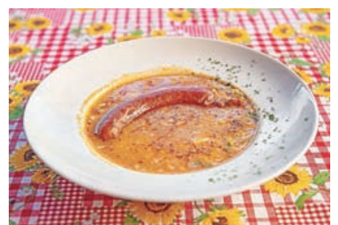
Pasulj s klobaso iz restavracije Oaza