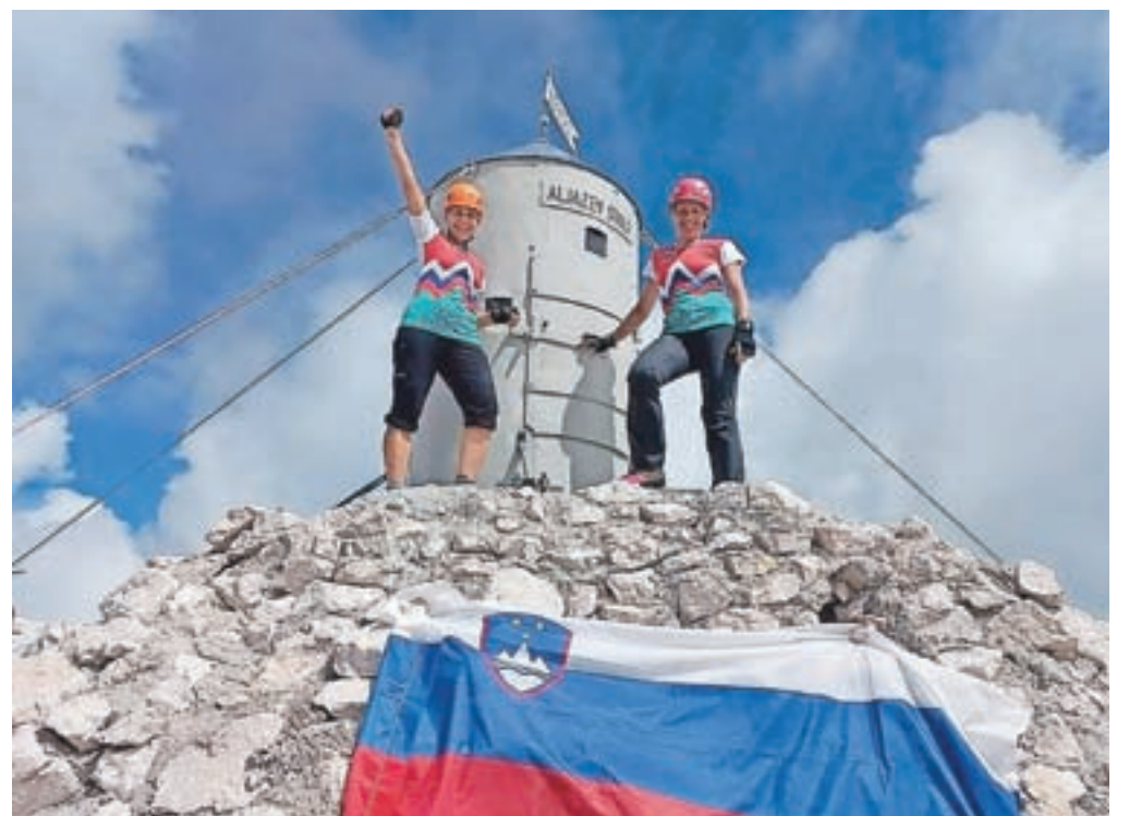
Na vrhu Triglava