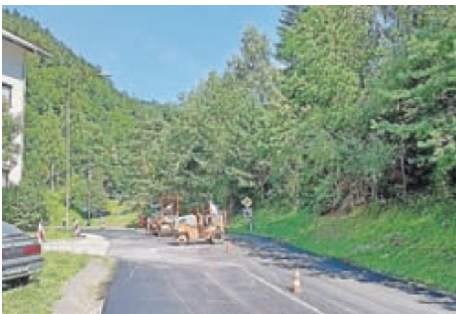
Cesto od krožišča do nadvoza proti Kopavniku je obnovil Strabag v zameno za uporabo ceste v času obnove železniškega predora.

bljali v času nedavne skoraj enoletne tehnične in varnostne nadgradnje predora. Za obnovo ceste se je s podjetjem Strabag dogovorila Občina Jesenice, ki je tudi podpisala dogovor o pogojih uporabe lokalnih cest pri izgradnji železniškega predora Karavanke.