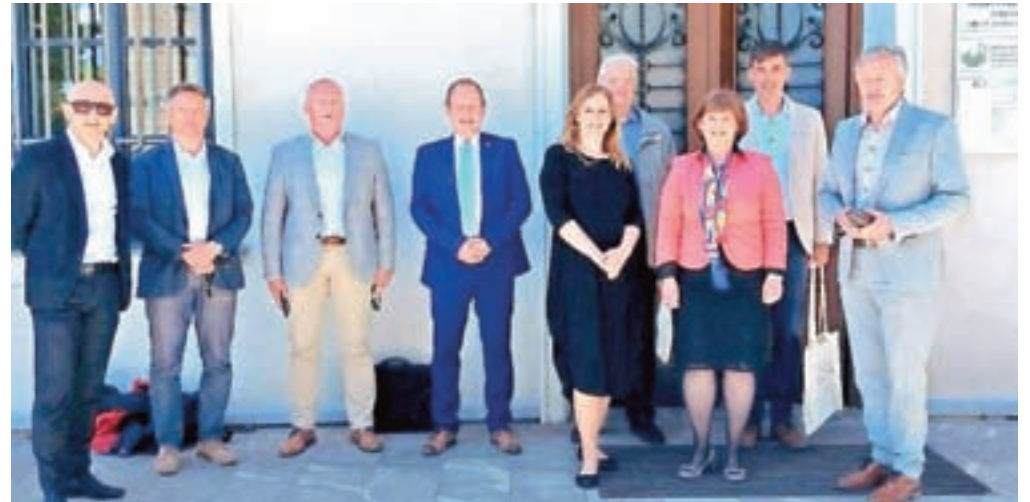
Župani so se tokrat srečali v Radovljici, poleg direktorice RAGOR-ja pa so se jim pridružili še predstavniki ZVKD in ministrstva za kulturo.