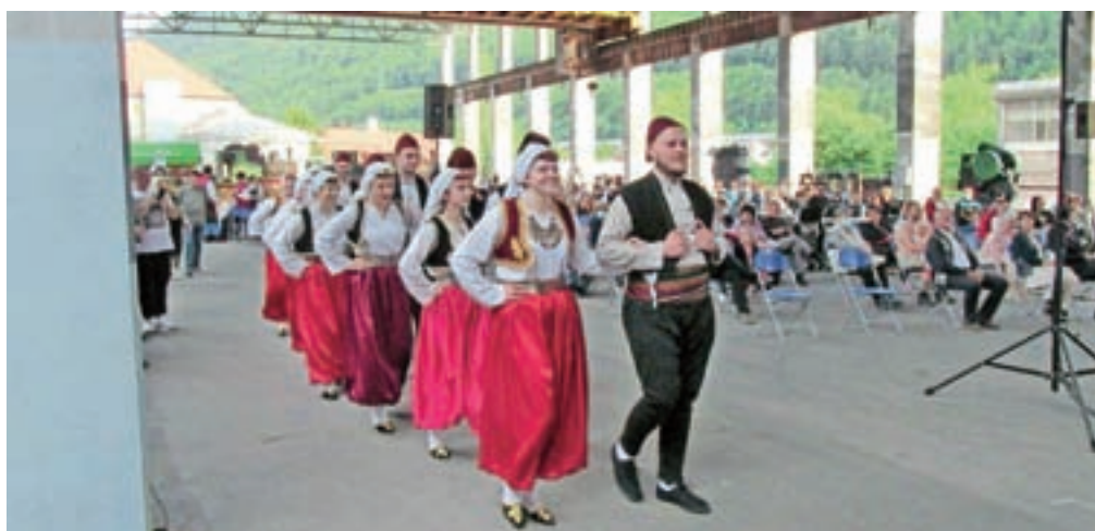
Osrednja prireditev je potekala v Muzeju na prostem na Stari Savi.