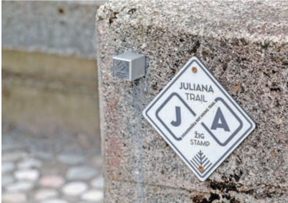
Žig je nameščen na prostoru med cerkvijo in Kasarno na Stari Savi.

Juliana Trail je 270 kilometrov dolga pohodniška pot, ki obkroži Julijske Alpe. Zdaj so jo dopolnili s štirimi novimi etapami v smeri Goriških brd in jo tako razširili na skupaj 330 kilometrov oziroma dvajset etap. Po celotni poti je zdaj mogoče nabrati 24 žigov. Pohodnike po poti spremlja in vodi elektronski vodnik na platformi OutdoorActive, na voljo sta tudi posebna aplikacija in klasični vodnik, ki vključuje tudi dnevnik za zbiranje žigov.