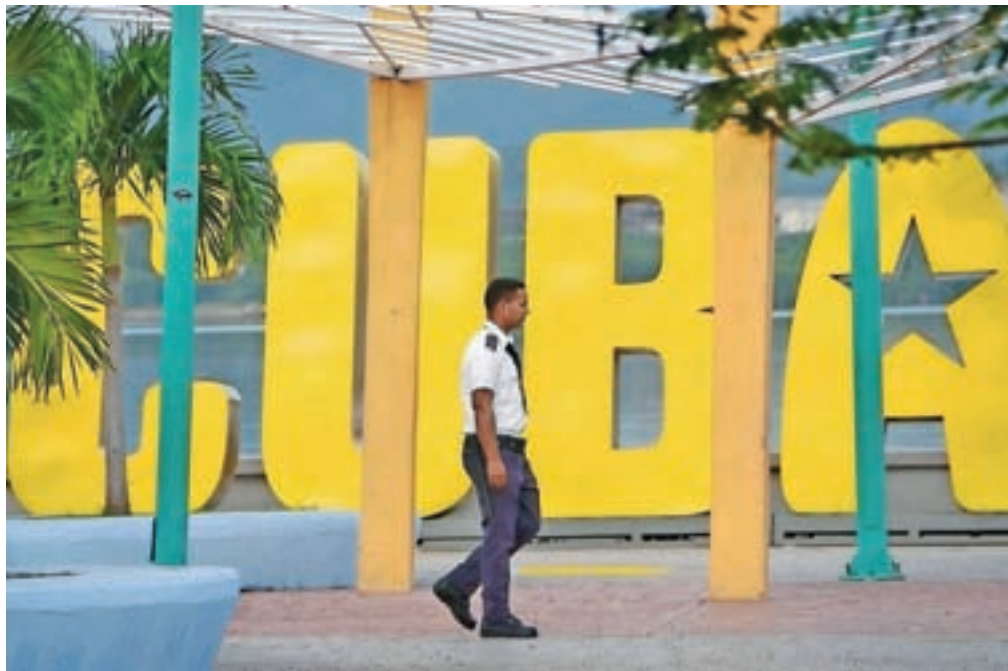
Na razstavi Kuba je dvajset fotografij, ki obiskovalcu ponudijo doživetje te edinstvene dežele.

čine fotografiranja, bolj sem se zavedala, kako je težko narediti dobro fotografijo. Pridobljene osnove sem vedno izkoristila na popotovanjih in ravno popotniška fotografija je tista, ki me najbolj navdušuje, saj nudi raznolike možnosti in omogoča različne vrste fotografira-