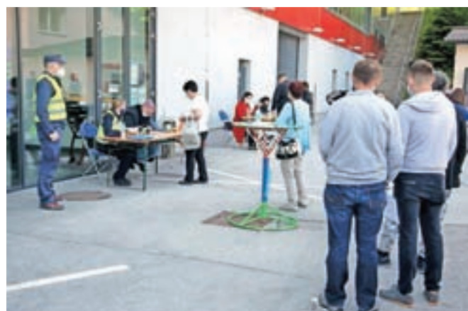
Cepljeni so kar pred dvorano pridobili mobilno identiteto smsPASS, ki omogoča dostop do portala zVEM, na katerem si bodo lahko sami natisnili potrdila o cepljenju ali testiranju. Mnogi omenjena potrdila želijo za prečkanje meje.

vsemi odmerki cepljena že skoraj polovica vseh občanov. Na Gorenjskem imajo najboljšo precepljenost občine Bohinj, Bled in Jezerško, kjer je z vsemi odmerki cepljenih že okrog 35 odstotkov občanov.