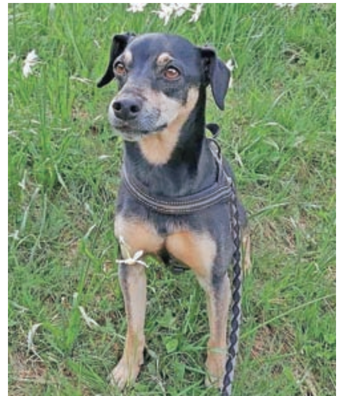
Domači kuža Nodi v narcisnem raju