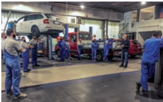
Izobraževanje in ločeno zbiranje odpadkov v podjetju INTEGRAL AVTO d.o.o. Jesenice

V maju se je podjetje JEKO, d.o.o. odzvalo povabilu podjetja INTEGRAL AVTO d.o.o. Jesenice z več kot 60 letno tradicijo. Podjetje, kot del skupine Arriva, se zaveda pomembnosti družbenega in naravnega okolja. Verjamejo, da poslovni uspeh podjetja temelji na ekonomski racionalnosti, uravnoteženem razvoju in vpetosti v naravno in družbeno okolje, in da družbena odgovornost pomeni ne le konkurenčno prednost, ampak enega od elementov nadaljnjega razvoja skupine. Za zaposlene smo izvedli praktično delavnico na temo ravnanja z odpadki.