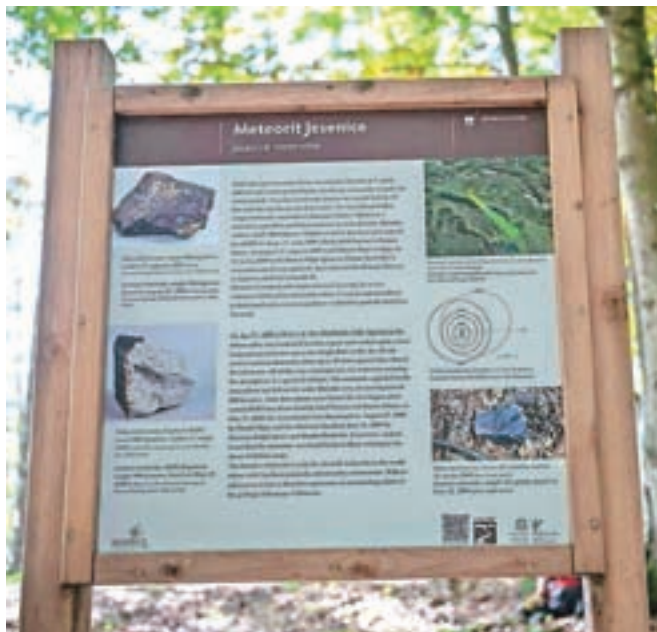
Pohod Po poti meteorita bo jutri, v soboto, 19. junija.

Dom društva upokojenecv Javornik Koroška Bela ob 19. uri