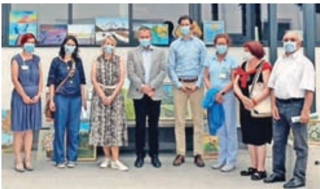
Donacija likovnih del bolnišnici

Kot so povedali v bolnišnici, bodo slike razobesili po hodnikih bolnišničnih oddelkov in v prostorih uprave.