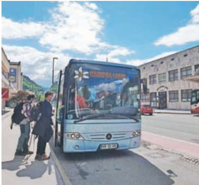
Med narcise z avtobusom: namesto načrtovanih treh so zaradi slabega vremena avtobusi vozili dva majska konca tedna.

Letošnji maj je bil precej specifičen v več pogledih. Zamujalo je cvetenje narcis, veliko je bilo slabega vremena, manj je bilo obiskovalcev, svoje so dodale razmere zaradi koronavirusa. Čeprav letošnji maj še