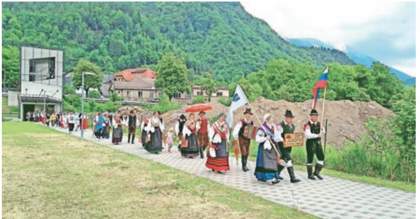
Udeleženci so v sprevedu krenili do Čufarjevega trga in nazaj do Stare Save.