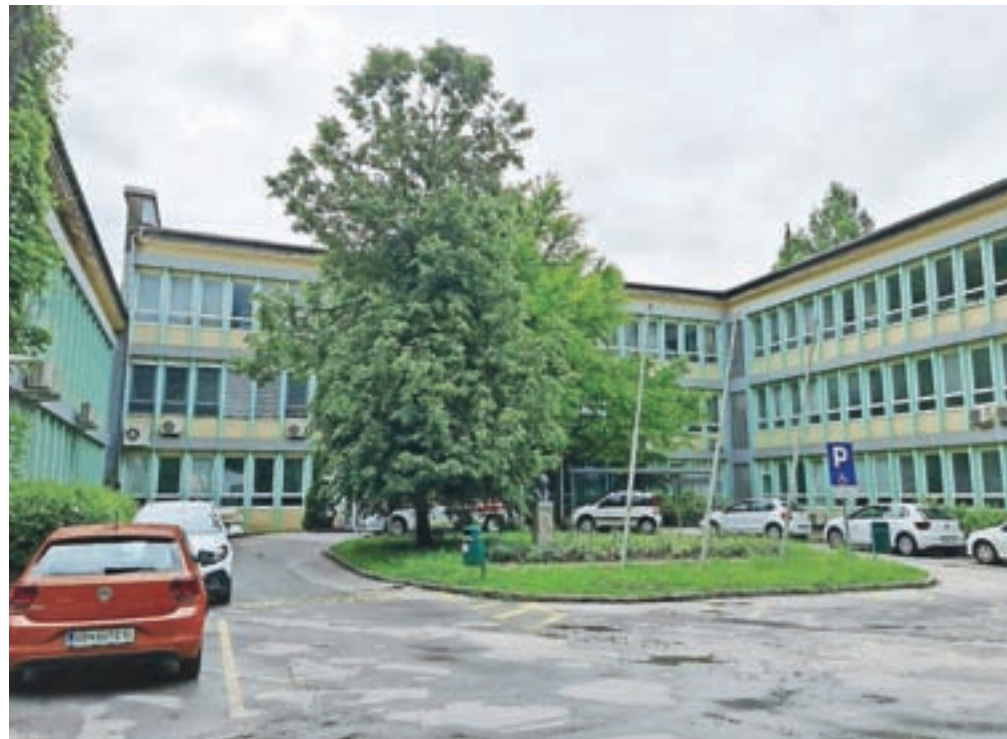
Najvišje stroške za ogrevanje med jeseniškimi javnimi zavodi ima Zdravstveni dom Jesenice, letno 82 tisoč evrov.

Zelo visoko porabo so ugotovili tudi v OŠ Prežihov Voranc, obod stavbe so pregledali tudi s termokamero. Ugotovili so, da je eden od vzrokov za večjo