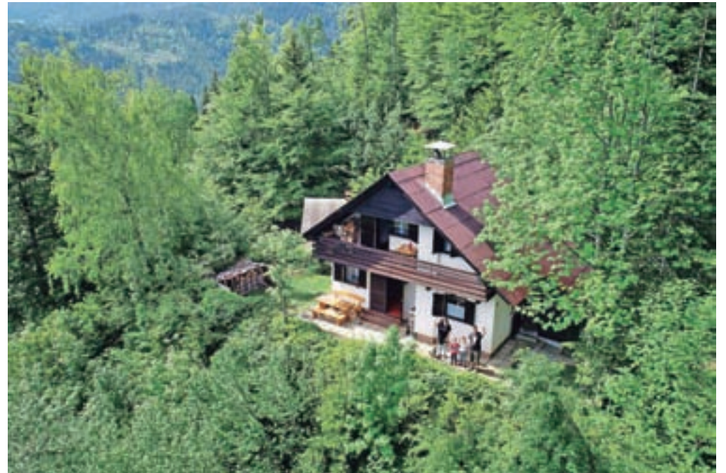
Počitniška hiša Viktorija v zeleni oazi Planine pod Golico

Posebno pozornost namenijo najmlajšim gostom, na voljo so jim otroška posteljičca, stolček za hranjenje, previjalna podloga, celo kahlica ter kopica družabnih iger. Kot že omenjeno, pa so dobrodošle tudi živali in tudi zanje je posebno lepo poskrbljeno. Katja in Gregor pravita, da je bila prva živalska gostja lani mačka, gostili so že par papagajev in več psov;