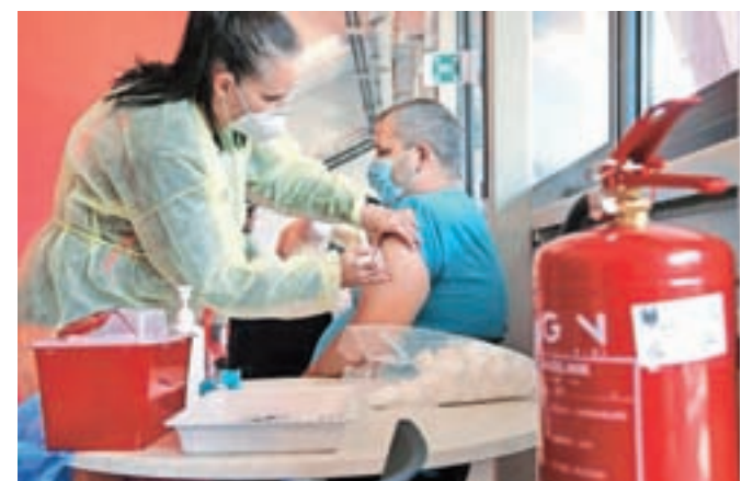
Cepili so s cepivom Comirnaty proizvajalca Pfizer/BioNTech, za drugi odmerek bodo ponovno organizirali cepljenje v dvorani Podmežakla, predvidoma prihodnji teden v sredo.

Je pa minulo sredo tudi na Jesenicah, tako kot v drugih cepilnih centrih po državi, potekal dan odprtih vrat s cepljenjem brez naročanja. Cepili so s cepivom Janssen proizvajalca Johnson & Johnson, pri katerem je potreben le en odmerek. Cepljenje je potekalo v Zdravstvenem domu Jesenice, več o tem, koliko odmerkov so imeli na voljo in kakšen je bil odziv občanov ter o morebitnih novih datumih tovrstnih akcij, pa bomo objavili v naslednji številki.