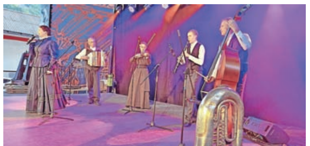
V programu je sodelovalo več folklornih skupin, pevci, pihalni orkester in tamburaši.