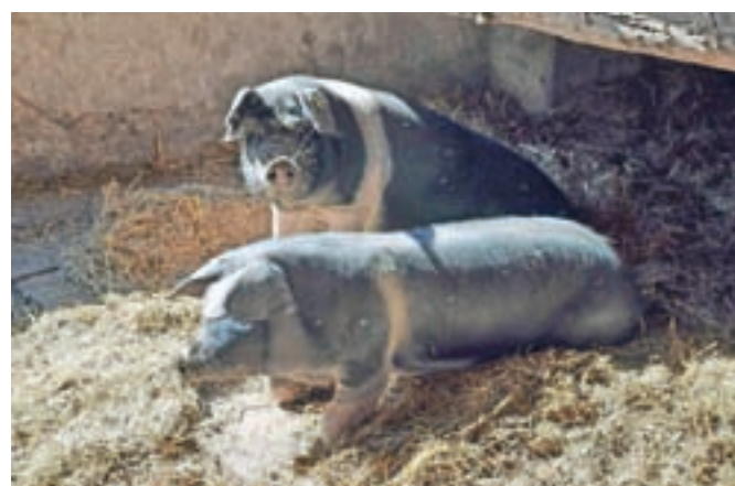
Krškopoljska pujsa (Pipi in Melkijad)