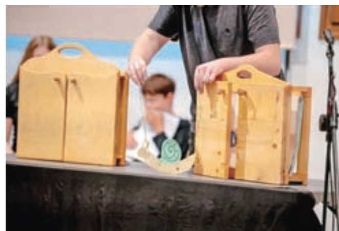
Kamišibaj je pripovedovanje zgodb ob slikah.