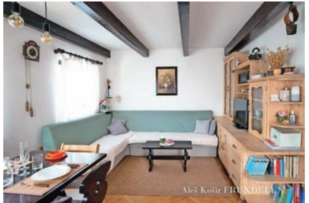
V hiši je dovolj prostora za pet oseb, namenjena je družinskim počitnicam.