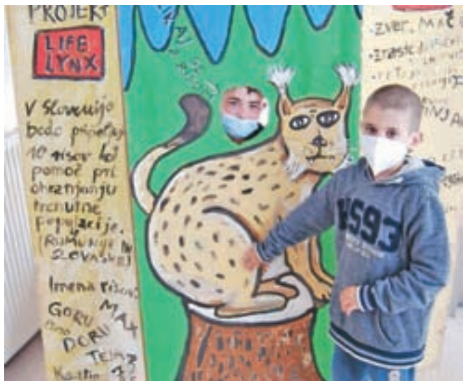
Risomat za fotografiranje s skoraj čisto pravim risom

dnevu Zemlje pripravijo razstavo izdelkov, ki so narejeni iz odpadne embalaže ali odsluženih predmetov. Vključili so se tudi v projekt RAGOR-ja Ohranimo narcise, spoznavali naravno dediščino in izdelali veliko različnih narcis. Učenci šestega razreda so spoznali legendo o Ajdovski deklici, prizore ilustrirali in nato legendo prikazali z japonskim papirnatim gledališčem kamišibajem. Na šolski spletni strani so objavljene živalske uganke, povezane z različnimi posebnimi dnevi, kot so dan Zemlje, dan biotske raznovrstnosti ... Učenci spoznavajo različne vrste živali in njihove značilnosti. Mesec maj pa je bil posvečen čebelam. Učenci so spoznavali življenje čebel, njihov pomen in tudi njihovo ogroženost. Poleg branja knjig in izdelave plakatov so izdelovali različne izdelke na temo čebel: sestavljanke, nakit, okrasne čebele iz odpadnih materialov, pekli pa so tudi medenjake.