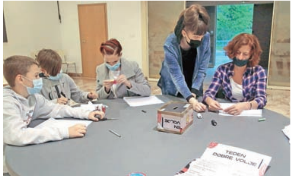
Na "zero waste" delavnici, ki je potekala v Kolpernu, so izdelovali vrečke za nakupovanje iz bioloških materialov.