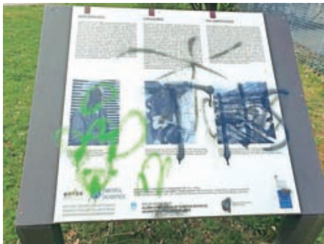
Poškodovana tabla ...

la nepoškodovana. Stara Sava je bila predlani proglašena za kulturni spomenik državnega pomena, Občina Jesenice pa si že vrsto let prizadeva, da bi lepo obnovila in oživila ta zgodovinsko pomemben del mesta. Zato je vandalizem na tem območju še toliko bolj nesprejemljiv.