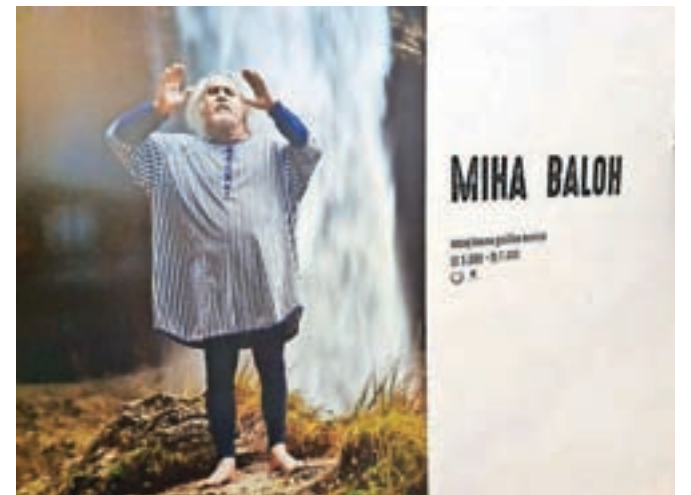
V Kosovi graščini je na ogled muzejska razstava o Mihi Balohu.