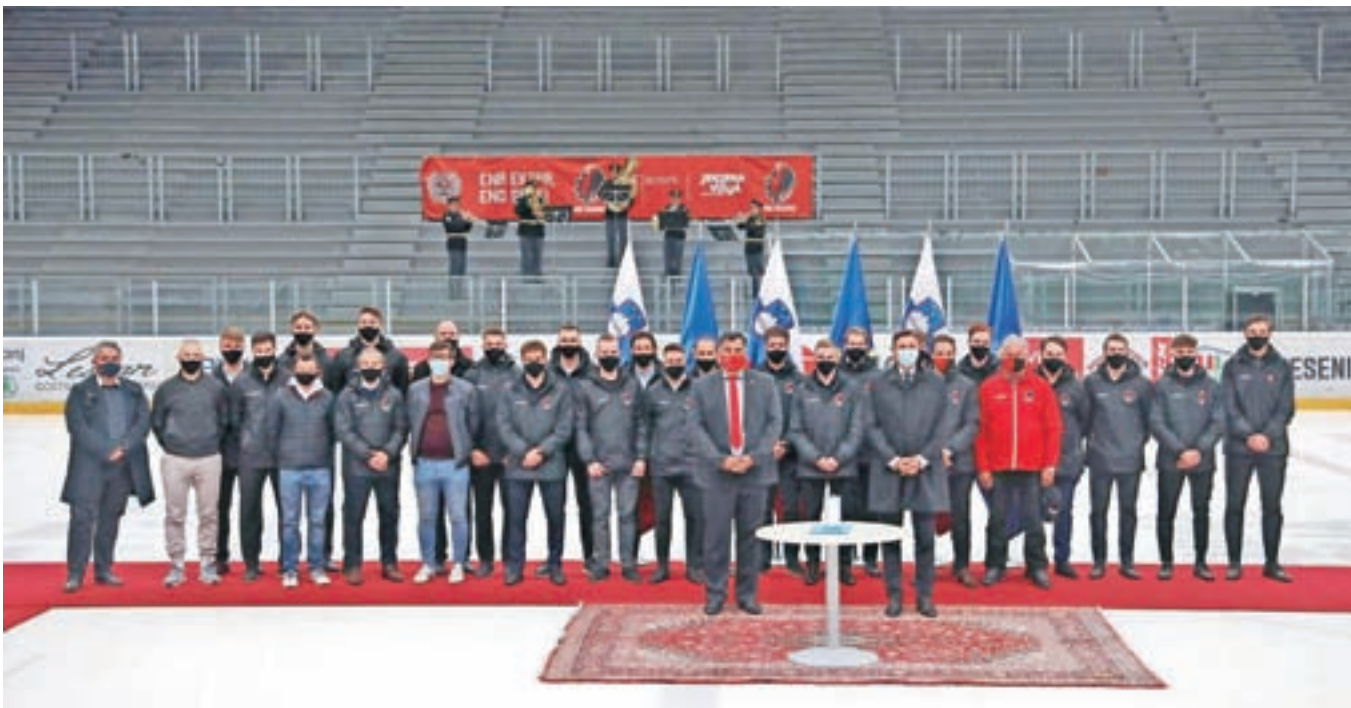
Slovesnost je potekala v ledni dvorani Podmežakla.

ji morali narediti več. Ob sprostitvi epidemioloških ukrepov so na slovesnost povabili zaslužne člane, podpornike, sponzorje. Državno himno je zaigral policijski orkester, krajšo vajo so prikazali mladi hokejisti, pod strop dvorane pa so dvignili tudi zastavo, ki obeležuje osvojitve 36. naslova državnih prvakov.