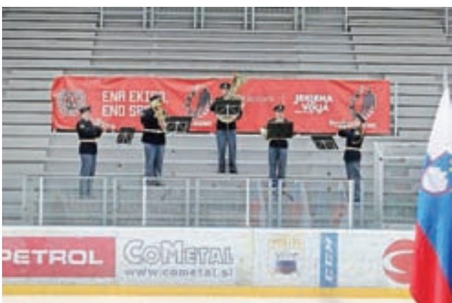
Policijski orkester je s tribune zaigral državno himno.