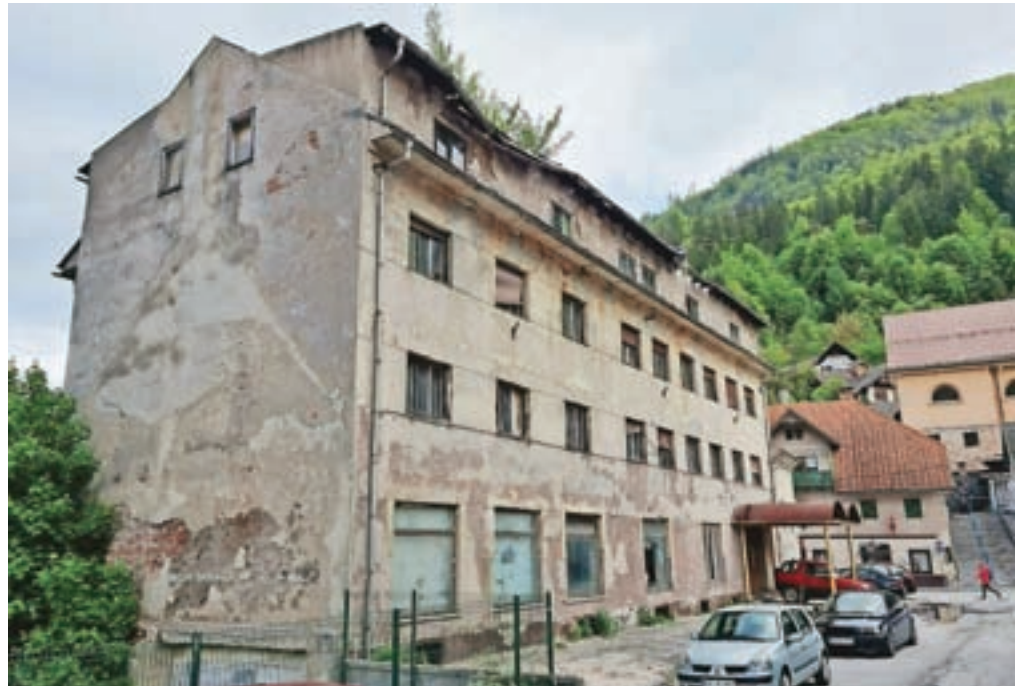
Občinski svetniki so imeli različno stališče glede načrtovanega odkupa Hotela Pošta. Po mnenju nekaterih bi denar namesto za odkup morali nameniti za sanacijo zajetja Peričnik.

Na seji so sprejeli tudi dopolnitev Načrta razpolaganja z nepremičnim premoženjem v lasti Občine Jesenice in dopolnitev Načrta pridobivanja nepremičnega premoženja v lasti Občine Jesenice za leto 2021. Predmet prve je prodaja dveh nepremičnin na Hrušici, ki v naravi predstavljata use-