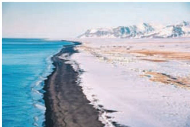
Zelo rad potuje, s seboj pa vedno vzame fotoaparatom. Fotografija je nastala na njegovem potovanju po Islandiji.

nil v Fotografsko društvo Jesenice, sodeluje tudi z Mladinskim centrom Jesenice in Gledališčem Toneta Čufarja Jesenice. Že četrto leto dela v jeseniškem fotografskem studiu Foto Vidmar, kjer je spoznal še druge plati fotografiranja, od studijskih fotografij, obdelovanja do tiska fotografij, in obenem dobil priložnost, da je svoje teoretično znanje prenesel v prakso. Svoje fotografsko znanje širi tudi med mlade na fotografskih krožkih in delavnicah. "Ravnokar vodim delavnico, kjer mlade poučujem osnove fotografije. Na ta način lahko združim svojo pedagoško izobrazbo in ljubezen do fotografije," je povedal. V času epidemije se je seznanil še z video produkcijo. "Snemali smo odprtje in predstavitev razstave, a upam, da to ne bo postalo stalna praksa, ker je obisk razstave v živo bolj pristen in doživet," nam je zaupal in še dodal, da si nekoč želi sodelovati z večjo svetovno ali slovensko medijsko organizacijo.