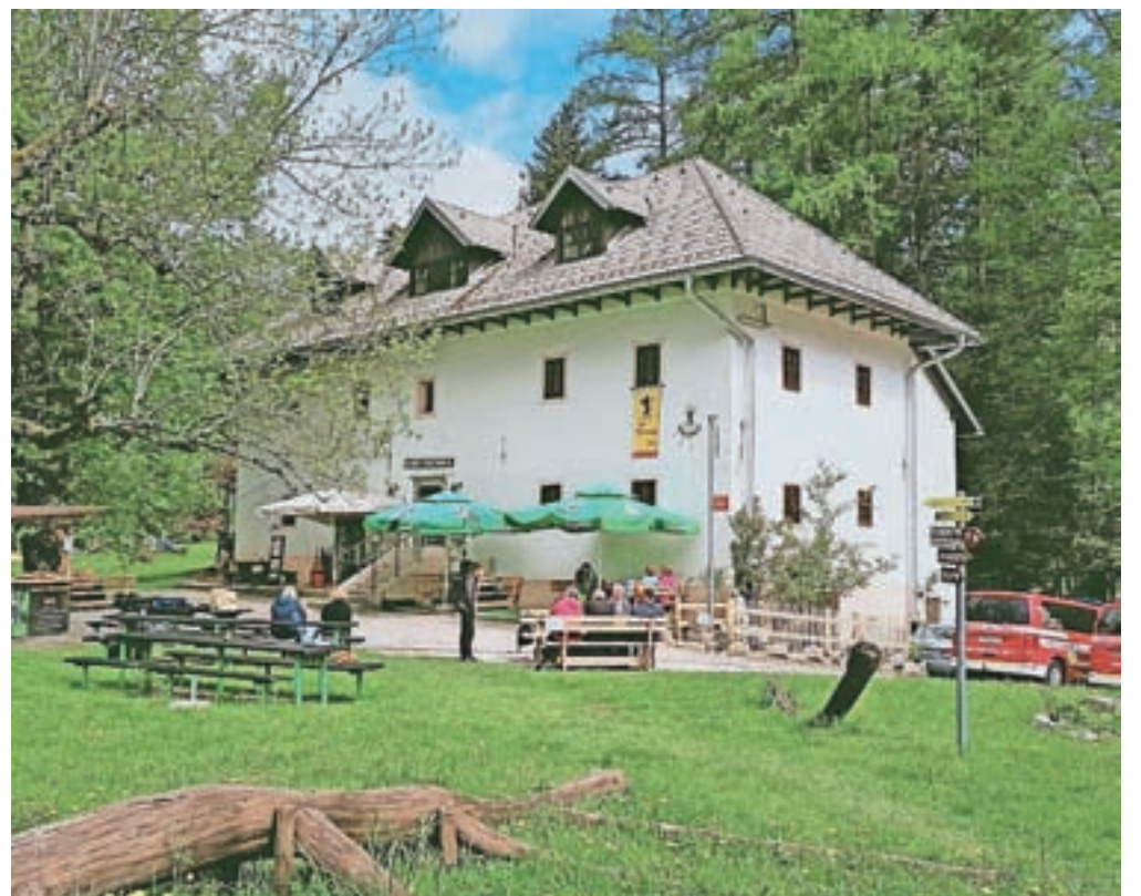
"Veseli smo planinca, ki se bo okrepčal s 'čorbo', veseli smo družinice, ki pride na kosilo, veseli smo gosta, ki si privoščijo kaj več kot običajno," pravijo v Domu Pristava.