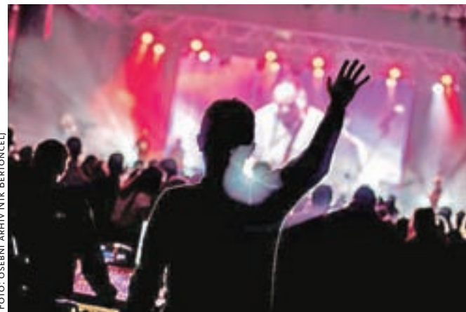
Blizu mu je reportažna fotografija, kjer lahko ujame poseben trenutek in ga za večno zabeleži na fotografiji. Fotografija s koncerta Martina Smitha.