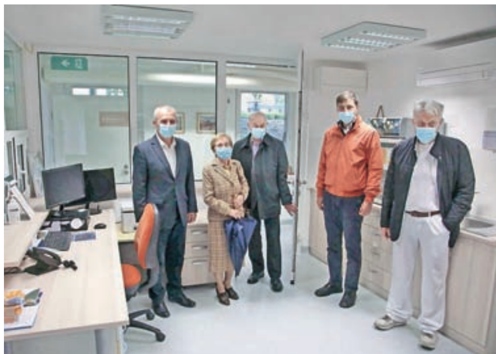
Fajdigova ambulanta ima prostore v Zdravstvenem domu Jesenice.

Odprta je ob torkih med 17. in 19. uro, v njej pa lahko brezplačno zdravniško pomoč poiščejo osebe, ki nimajo urejenega zdravstvenega zavarovanja.