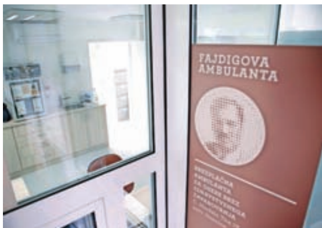
Ambulanta nosi ime po legendarnem kranjskem zdravniku Božidarju Fajdigi, ki je bil poseben tip zdravnika, pošten in ljudski človek, ki je imel zelo rad svoj poklic. Za svoje storitve je pacientom zaračunal simboličnih pet kovačev, revnim pa pogosto prav nič.