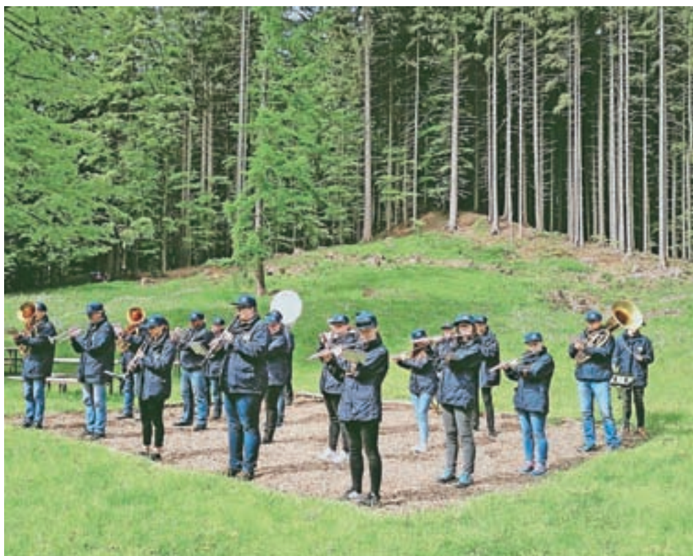
Pihalni orkester Jesenice - Kranjska Gora je zadnjo majsko soboto popestril s koncertom, ki so mu dali naslov Odmev ključavnic.