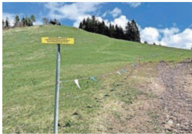
Del poti proti zgornji postaji žičnice je označen z zastavicami, pohodniki naj se držijo desnega roba pobočja.

V spodnjem delu poti na Španov vrh iz Planine pod Golico je Zavod za šport Jesenice v sodelovanju z domačini, Občino Jesenice ter Razvojno agencijo Zgornje Gorenjske postavil opozorilno tablo, s katero pohodnike prosijo, da uporabljajo označeno planinsko pot. Na poti naj se izogibajo hoji po travnikih, v zadnjem delu poti proti zgornji postaji žičnice pa naj se držijo desnega roba pobočja. Del poti so tudi označili z zastavicami.