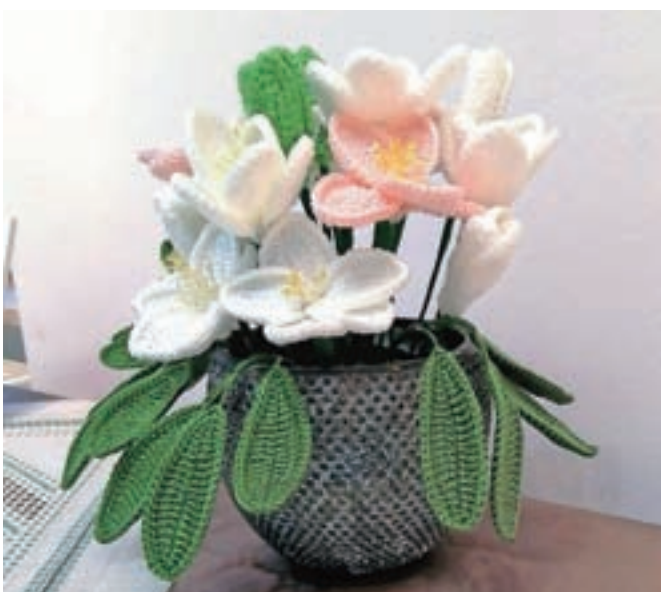
Čudoviti izdelki, ki jih izdelujejo članice krožka ročnih del.

Krožek ročnih del pri Farnem kulturnem društvu Koroška Bela je pripravil razstavo z naslovom Korona vezenine. Pridne roke članic krožka v času pandemije in ukrepov samozolacije niso mirovale, ampak so ustvarile vrsto lepih izdelkov v različnih tehnikah. Izdelki so bili na ogled v Kulturnem hramu na Koroški Beli.