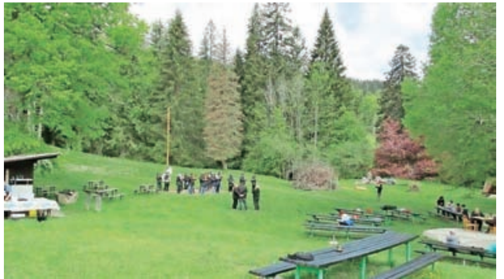
Pristava v Javorniškem Rovtu, zelena oaza nad Jesenicami

Lepo majsko soboto so za obisk Pristave izkoristili tudi člani Pihalnega orkestra Jesenice - Kranjska Gora. Na prostoru ob travniku z narcisami so izvedli nastop v okviru letošnjega Tedna ljubiteljske kulture v občini Jesenice. Z veselimi koračnicami so ta dan marsikomu pregnali temne misli preteklih mesecev. Iz bogatega repertoarja orkestra so zaigrali tudi nekaj skladb z zgoščenke Odmev ključavnic, ki so jo izdali leta 2004.