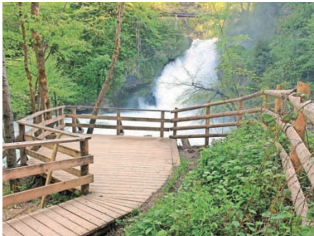
Lesena razgledna ploščad, s katere si je mogoče ogledati slap Šum, je obnovljena.

nancirala Občina Jesenice. Soteska je v juniju med tednom odprta med 10. in 16. uro, ob sobotah in nedeljah pa med 9. in 17. uro.