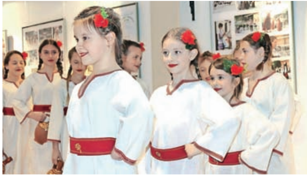
Letos bo zaradi razmer potekala Mini kulturna mavrica Jesenic.

Potekala bo v soboto, 5. junija, na prireditvenem prostoru na Stari Savi.