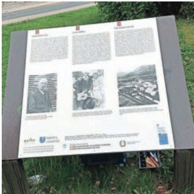
... in tabla po tem, ko so jo obnovili.