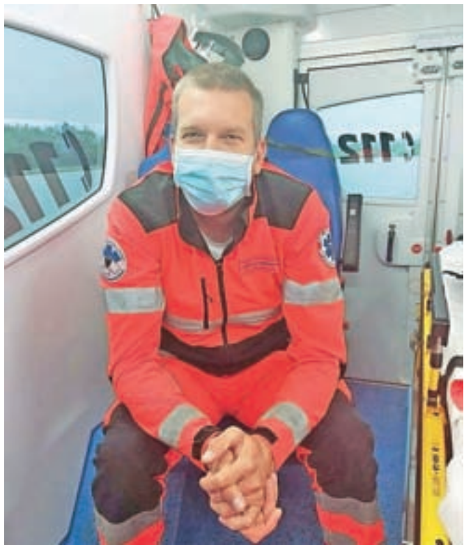
Dijaki so izvedeli tudi, kakšen je poklic reševalca.

Na Srednji šoli Jesenice, kjer izobražujejo za poklice v zdravstveni negi, so v pomoč dijakom pri načrtovanju kariernih poti v goste povabili zaposlene iz Splošne bolnišnice Jesenice, Psihiatrične bolnišnice Begunje, Zdravstvenega doma Jesenice in NMP Kranj. Srečanje je potekalo po spletnem orodju Teams, dijaki pa so iz prve roke slišali, kako je biti član negovalnega tima na ginekološkem, porodniškem, pediatričnem, kirurškem in psihiatričnem oddelku ter v operacijskem bloku in kaj pomeni biti dietetik, patronažna medicinska sestra, ortopedski tehnolog, reševalec in fizioterapevt.