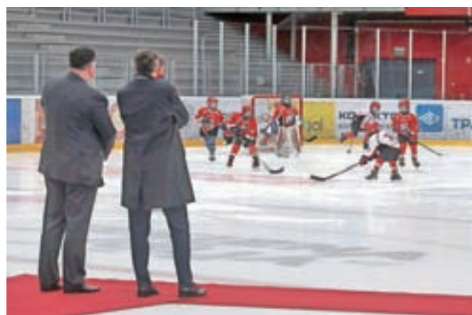
Predsednik si je ogledal vajo mladih hokejistov na ledu.