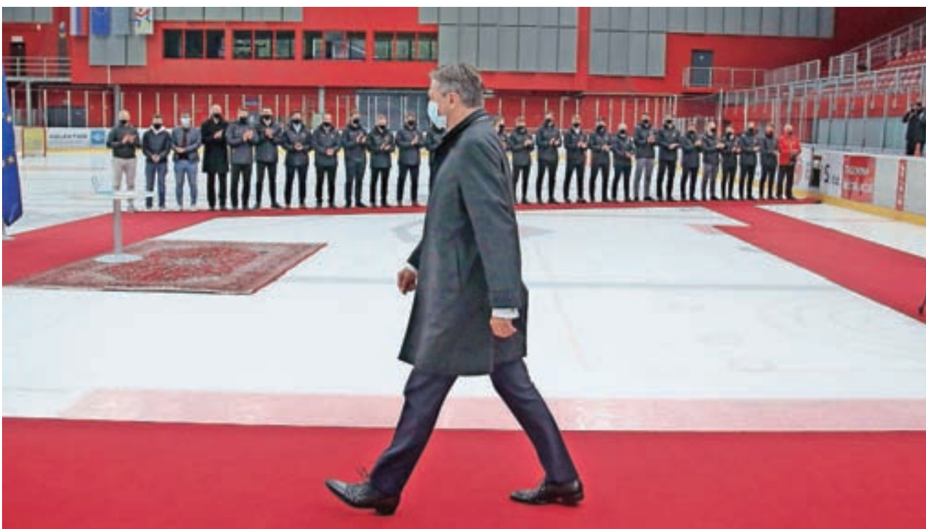
Rdeča preproga na ledu za predsednika