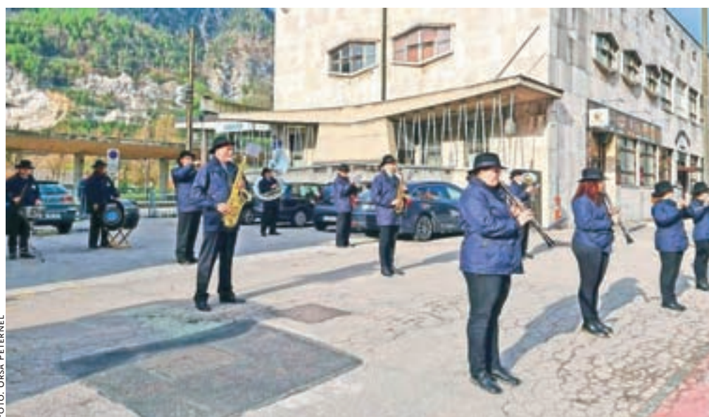
... druga pa je budnico zaključila z nastopom pred jeseniško železniško postajo.