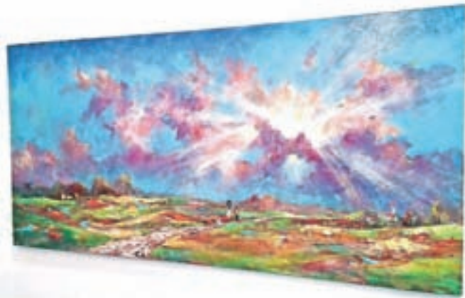
Na ogled so likovna dela šestindvajsetih članov Dolika.