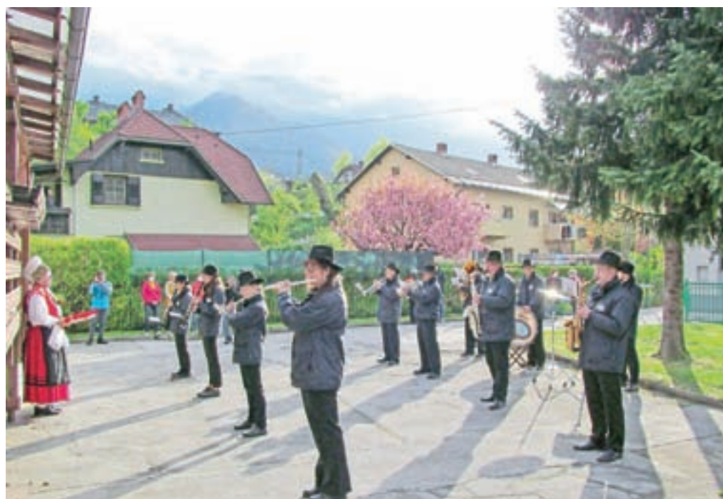
Ena skupina godbenikov je med drugim zaigrala pred domom upokojencev na Slovenskem Javorniku ...

nimi koračnicami pričarali nekaj vedrejšega vzdušja v tem drugačnem času. Prav čutili je bilo sproščenost, da so lahko spet imeli v rokah instrument, to je bil njihov prvi javni nastop od lanskega oktobra. Vsi ljudje, ki so jih pozdravljali, so upoštevali ukrepe glede