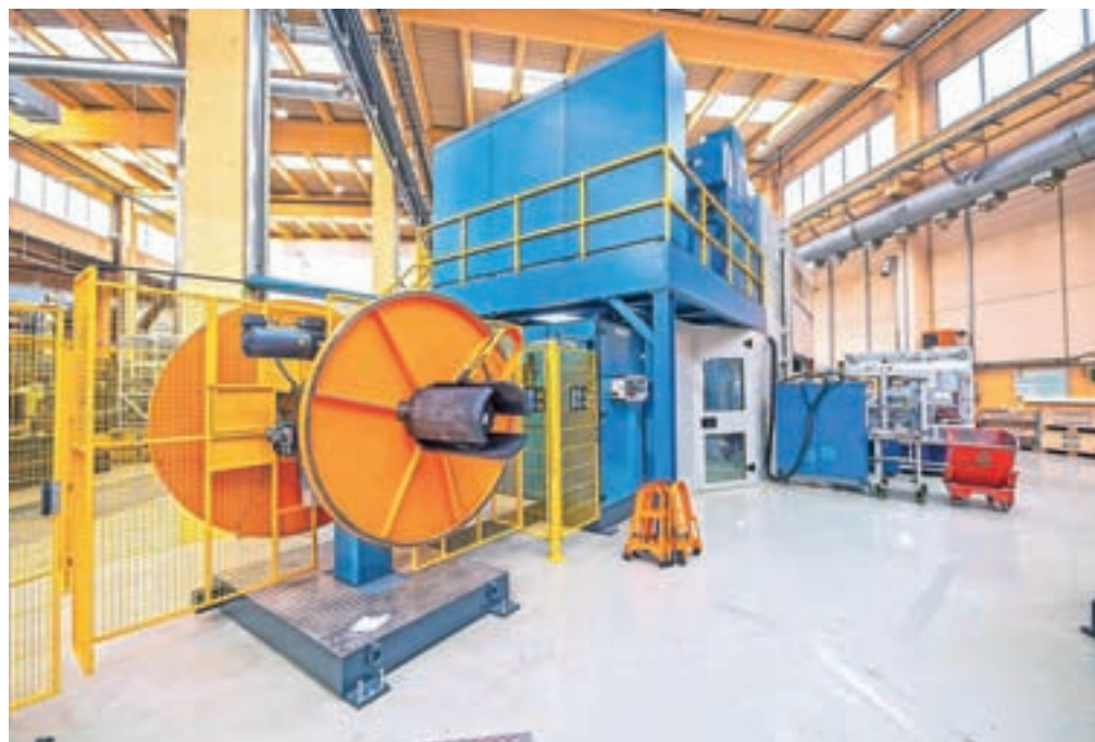
V jeseniški enoti Hidria Lamtec so letos izvedli že sedemmilijonsko investicijo v novo proizvodno linijo za projekte za električna in hibridna vozila.

V jeseniški poslovni enoti Lamtec pa ponujajo tudi štipendije, ta čas imajo šest štipendistov, in sicer za poklice elektrotehnik, strojni tehnik, diplomirani inženir strojništva in diplomirani inženir elektrotehnike. Dobro sodelujejo s Srednjo šolo Jesenice in dijakom omogočajo opravljanje obvezne prakse, počitniškega dela ter jim ponujajo