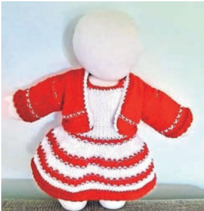
Virtualna razstava fotografij Punčke iz cunj Lare Blažič

Ogled razstave fotografij humanitarnega projekta »UNICEF SLOVENIJA – PUNČKE IZ CUNJ« Lare Blažič