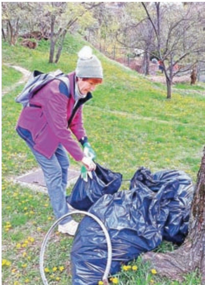
Na več mestih v občini so čistili zavzeti prostovoljci, ki jim ni vseeno za okolje.

Med najbolj zavzetimi izvajalci čiščenja so bili v krajevni skupnosti Blejska Dobrava, kjer so se čiščenja lotili organizirano v vseh treh naseljih, Kočna, Lipce in Blejska Dobrava. Moči so združili člani Gasilskega društva Blejska Dobrava, Kulturnega dru-