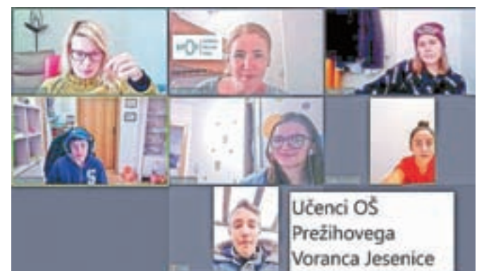
Podjetniški krožki so letos potekali na Zoom konferencah.

fotoaparata in objektivov. Na njegovih delavnicah so dobrodošli začetniki, kjer