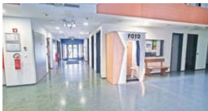
Fotoavtomat v avli Upravne enote Jesenice

V avlo Upravne enote Jesenice so pred kratkim postavili fotoavtomat, na katerem se je mogoče fotografirati tudi za dokumente. Fotografije so namreč primerne tudi za izdelavo osebne izkaznice, potne listine, orožne listine in dovol-