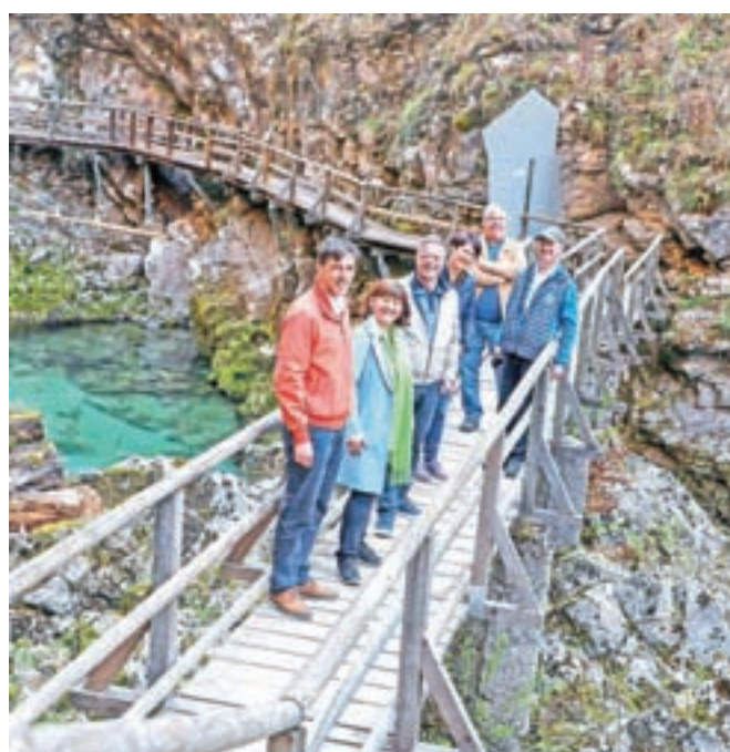
V soteski Vintgar so predzadnji konec tedna v aprilu znova odprli vrata za obiskovalce.

Tudi v letošnji sezoni režim obiskovanja v soteski ostaja enak kot lani, in sicer enosmerni ogled z vstopno točko v Podhomu, za vrnitev na izhodišče pa so urejene okoliške pohodne poti, ki so tudi ustrezno označene. Dostop do soteske je možen tudi z jeseniške strani, kjer