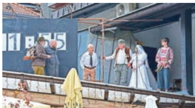
Pet pred dvanajsto so igralci jeseniškega gledališča nastopili kar na strehi.