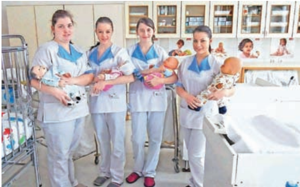
Letošnji informativni dnevi so potekali po spletu, tako so svojo šolo devetošolcem predstavili tudi dijaki Srednje šole Jesenice.