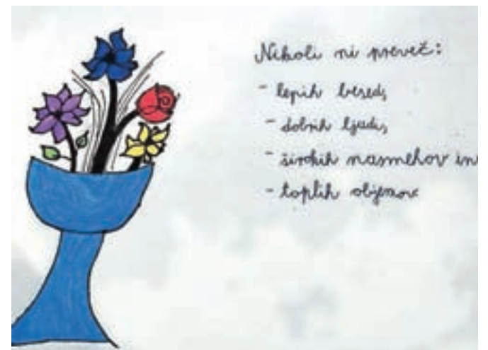
Že jeseni so z risbicami in lepimi mislimi obdarili tudi stanovalce jeseniškega doma upokoencev.