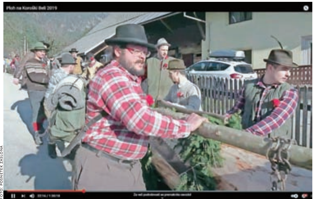
Vleko ploha so začeli pri Zavelcinu in pot nadaljevali mimo Boltarja proti vasi.

Ker se v predpustu ni poročilo nobeno dekle v vasi, so fantje posekali najlepšo smreko v srenjskem gozdu, jo očedili in pripravili za vleko skozi vas. Vleko ploha so