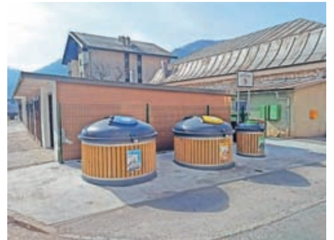
Nov potopni ekološki otok na Koroški Beli

Za večino od nas bo verjetno najbolj pozitiven impulz, ko se življenje vrne v ustaljene tirnice, brez omejevanj in prepovedi. Optimistična misel? Se vidimo ob obeleževanju praznika naše krajevnih skupnosti!