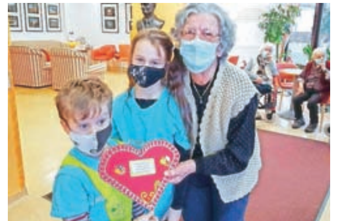
Učenci so s srčki razveselili stanovalce radovljiškega doma starejših.

stanovalce doma. Dogovorili so se tudi, da se bodo po normalizaciji razmer ponovno srečali na kakšnem skupnem družabnem dogodku. Učenci, ki sodelujejo v prostovoljski skupini Ježki, pa so že jeseni sodelovali tudi v akciji Pošljimo nasmeh. Na pobudo študentov zdravstvene nege in medicine so narisali risbice, napisali lepe misli in voščila, s katerimi so starostnikom dali vedeti, da niso sami in da mislijo nanje. V dopisu so jih prosili, naj nekaj izdelkov pošljejo tudi v Dom upokoencev dr. Franceta Bergelja Jesenice.