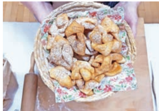
Kvašeni flancati

Priprava: V čvrsto kislo smetano damo rumenjake, sladkor in vaniljev sladkor ter premešamo v enotno zmes. V skledo damo tri četrte moka in naredimo jamico, vanjo damo pecilni prašek, pomešamo in dolijemo kislo smetano z rumenjaki in sladkorjem. Dodajamo še preostalo moko in zamesimo testo. Testa ni treba vzhajati. Testo razdelimo na