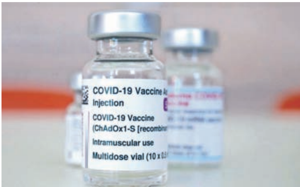
Hitrost cepljenja je odvisna od števila odmerkov, ki jih dobijo.

Vsi, ki so preboleli covid-19, pa ne potrebujejo hitrega testa v nobeni dejavnosti (v šolstvu, trgovinah, na smučiščih ...). Za dokazilo prebolele bolezni velja pozitivni izvid testa PCR oziroma hitrega antigenskega testa, ki ga je mogoče dobiti na por-