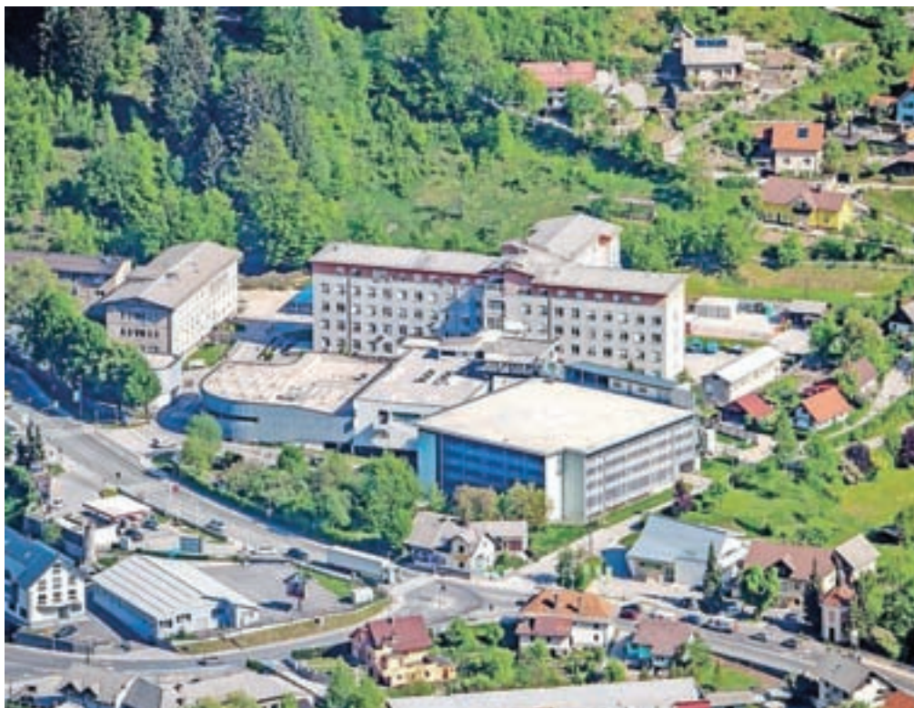
Splošna bolnišnica Jesenice