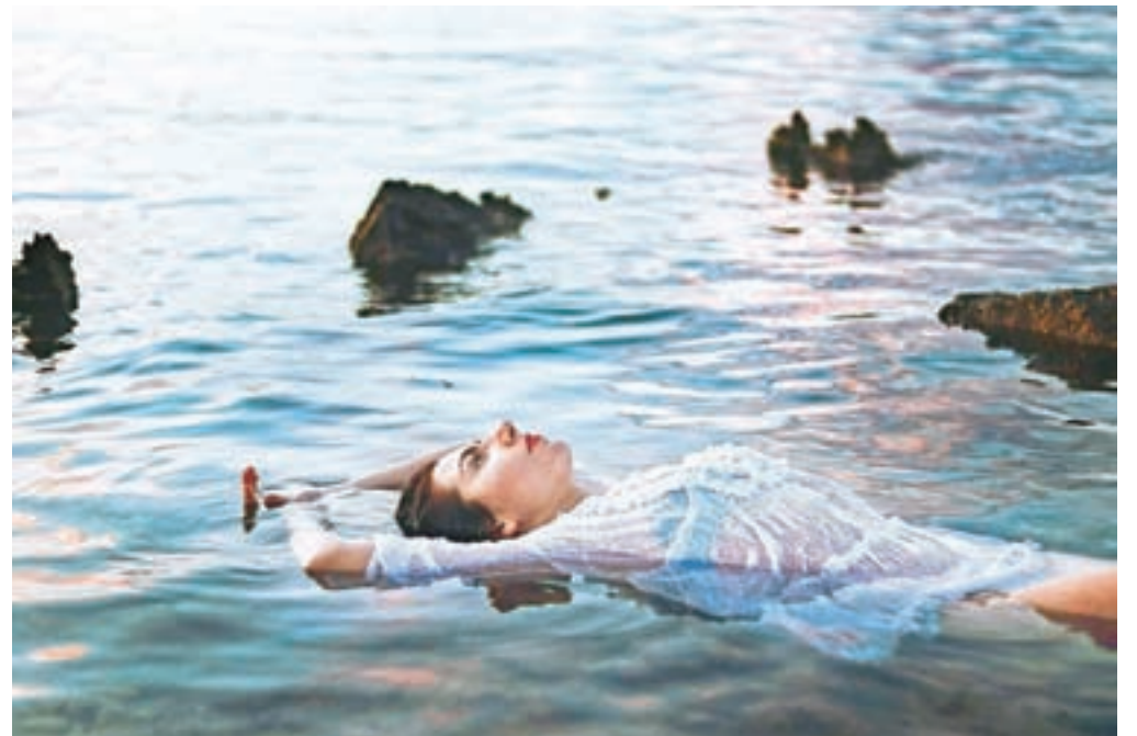
V starostni kategoriji od 15 do 29 let si je prvo nagrado prislužila fotografija Izgubljeni avtorice Nine Petek.

med mladimi veliko zanimanja za fotografijo. Pri mlajših avtorjih smo opazili veliko dobrih idej, ki bodo z leti izkušeni pridobile tudi na tehnični plati. Nagrajene fotografije od ostalih izstopajo in si pohvale resnično zaslužijo. V starostni skupi-