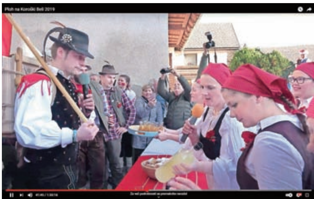
Dekleta so pri Frtinovmu koritu pripravile šrango in fantom postavile nekaj nalog, preden so jih spustile mimo.

Za pusta leta 2019, točno na pustni torek, 5. marca, so ob 15.30 namreč na Koroški Beli po desetih letih obudili star običaj vlečenja ploha.