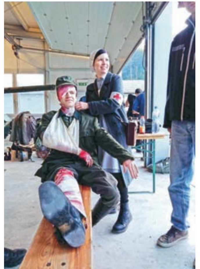
Na snemanju filma

Tisto poletje, ko sem se včlanila, se je naša nemška enota – Wehrmacht (31. Infanterie Regiment) odpravljala na uprizoritev bitke na Slovenskem. Šlo je za uprizoritev bitke med Nemci in Rusi iz obdobja druge svetovne vojne. Ker smo Slovenci pred-