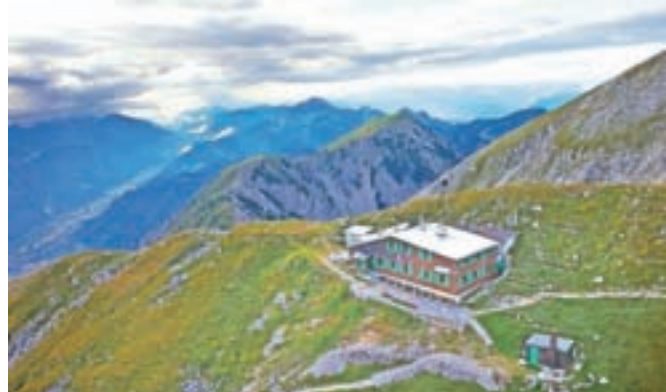
Prešernova koč na Stolu