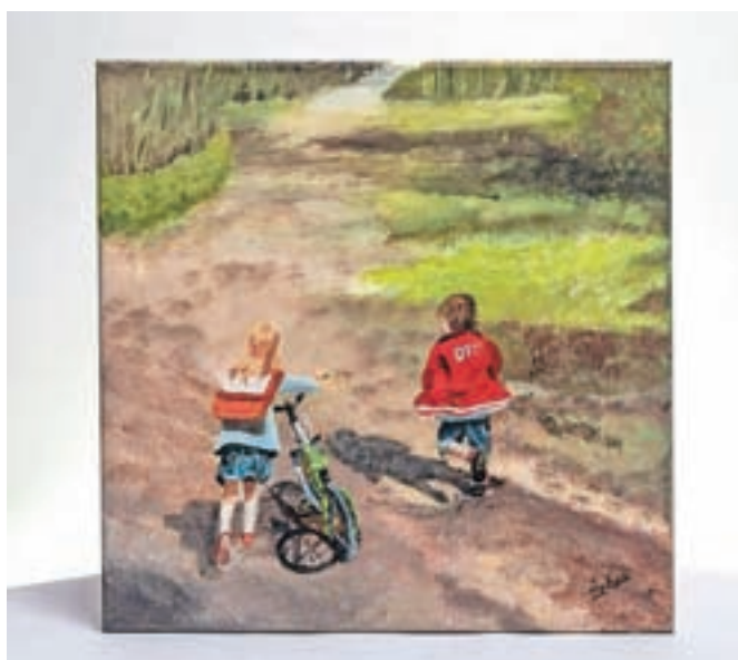
Ena od slik na dražbi, ki je jo naslikala Marjeta Žohar prav za to priložnost

Ob tem se zahvaljujejo vsem umetnikom, ki so podarili likovna dela, vsem sodelujočim, ki so slike kupili, fotografskemu studiu Foto Vid-