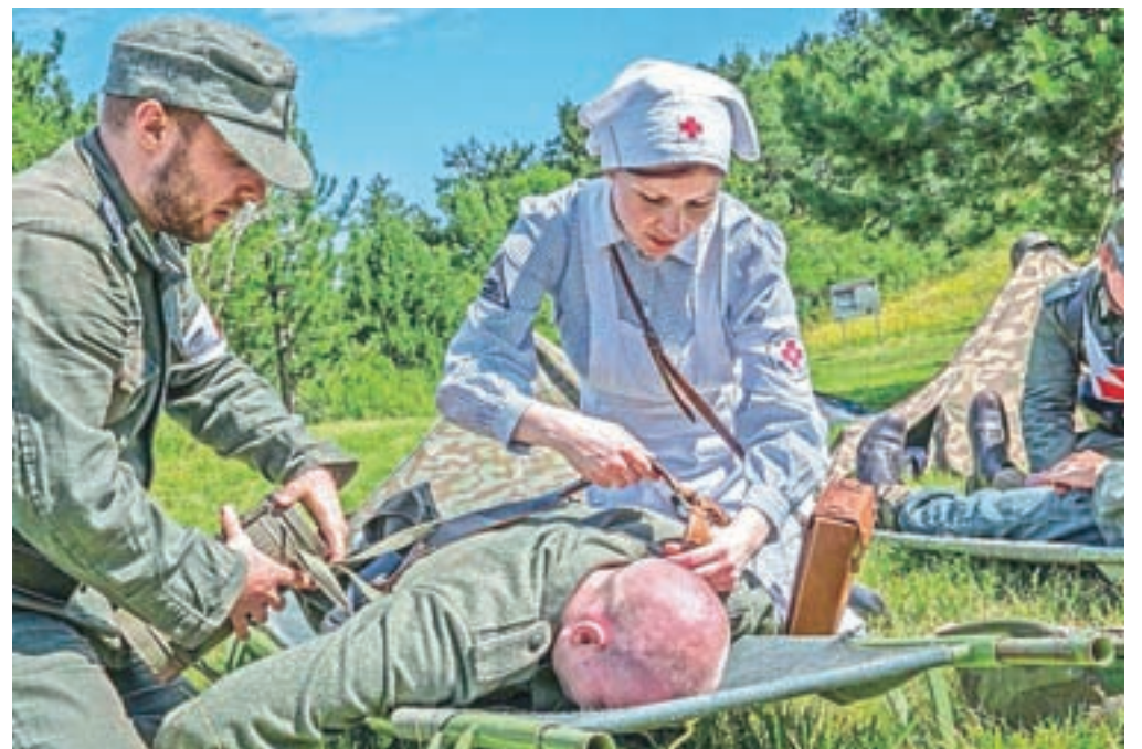
Vaja v Pivki