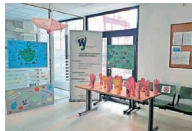
V Splošni bolnišnici Jesenice so zaznamovali svetovni dan umivanja rok.

Petnajsti oktober je svetovni dan umivanja rok. V Splošni bolnišnici Jesenice so tudi letos v sodelovanju s Srednjo šolo Jesenice kljub izrednim razmeram zaradi koronavirusa pripravili stojnico v pritličju stavbe B ter izobesili plakat še v stavbi E in na pediatričnem oddelku. Kot so pojasnili, so na ta način želeli vse paciente in zaposlene ponovno opozoriti, kako pomembna je ustrezna higiena rok, še zlasti v teh časih.