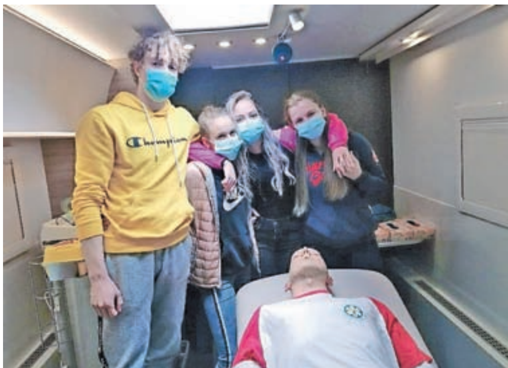
Dijaki zdravstvene usmeritve Srednje šole Jesenice so v manjših skupinah vadili temeljne postopke oživljanja.

dijaki tretjega letnika zdravstvene usmeritve, ki so se ob tej priložnosti usposabljali v temeljnih postopkih oživljanja. "Praktični pouk v sedanjih covid razmerah v šolskih kabinetih ali virtualno ne more odtehtati realnega sti-