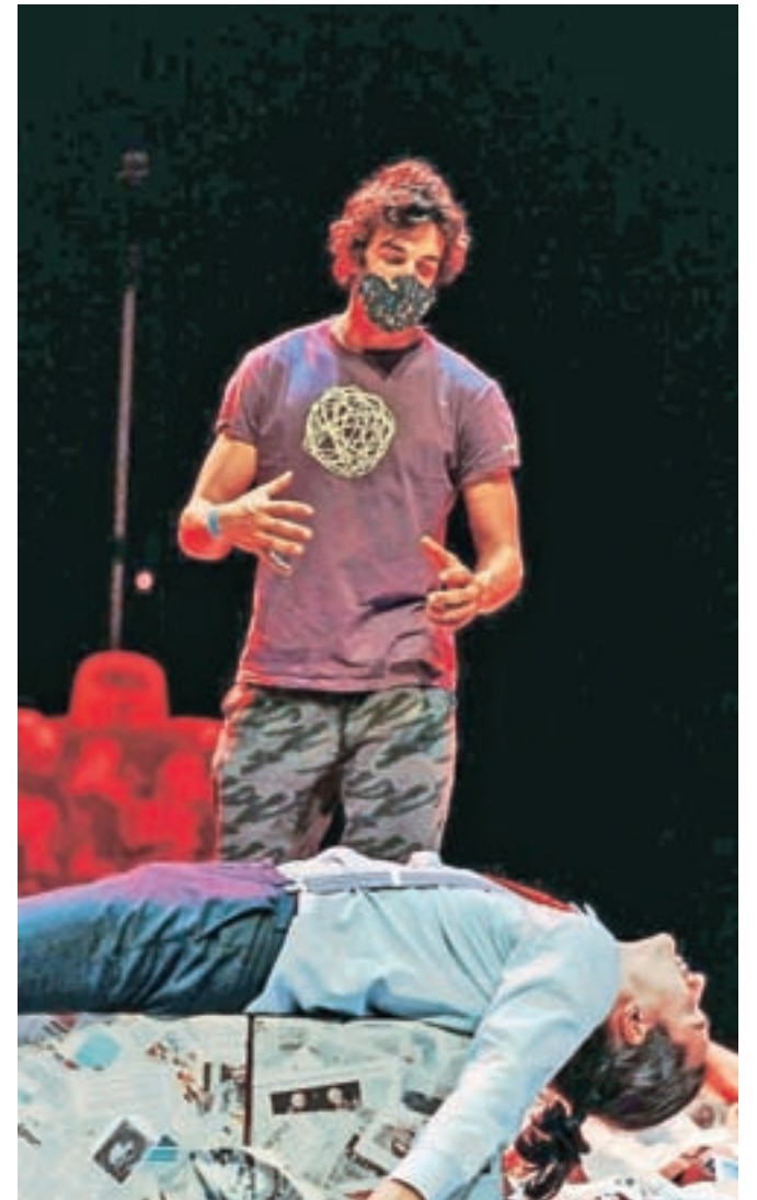
Groteskna komedija Slastni mrlič je režijski prvenec Gašperja Stojca.