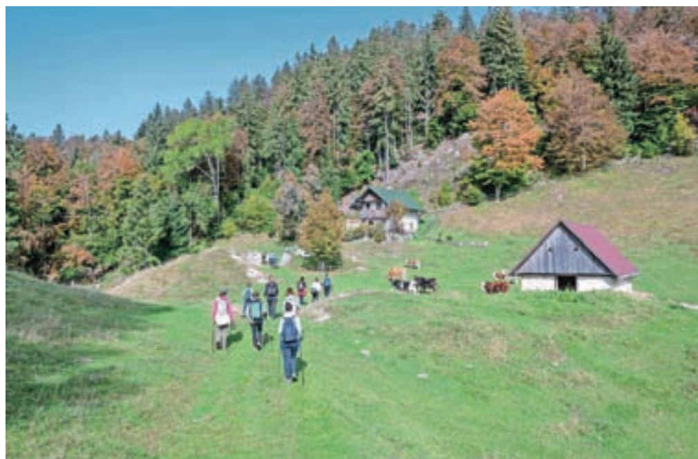
Po čudoviti Mežakli ...

vsebine, seveda v prvi vrsti gre za rekreativno dejavnost, ki pa vključuje ogled naravnih in kulturnih znamenitosti ob poti kot tudi eno izmed največjih znamenitosti v Sloveniji in tudi mednarodno – točko padca meteorita na Mežakli leta 2009. Še posebno nas veseli, da so pohodniške poti na območju občine Jesenice prepoznale različne ciljne skupine pohodnikov, zlasti družine z otroki in aktivna populacija ne glede na starost, ki cenijo naravo, odmaknjenost in varnost v teh nepredvidljivih časih.«