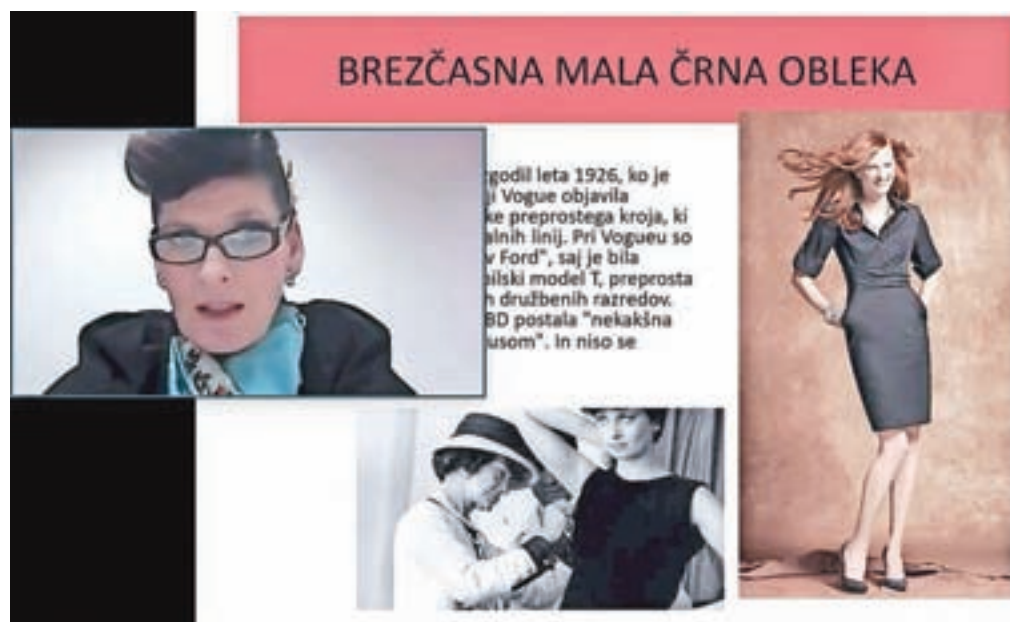
Delavnica Triki poslovnega oblačenja in vedenja za konkurenčnejši nastop na trgu je zaradi razmer s covidom-19 potekala virtualno.

poslovna obleka, ki se uporablja pri delu v pisarnah, za interne sestanke in izobraževanja ter srečanja s kolegi, ko ne pričakujemo pomembnejših poslovnih partnerjev. »Kljub večji svobodi pa morajo biti oblačila brezhibno negovana in urejena. Ne potrebujemo kravate in uniformiranosti v slogu klasičnega ženskega kostima, zato pa še vedno poskrbimo za profesionalni videz.« Četrta raven je sproščena elegantna obleka, ki je sinonim za sproščeno in udobno oblačenje. »Navadno je ta raven oblačenja primerna za nevedilna delovna mesta in okolja, ki niso strogo vezana na pisarne. To ni raven oblačenja, ki jo Slovenci tako radi imenujemo športno-elegantno. Kot športni narod pogosto pozabimo, da nekaj, kar je športno, ne more biti hkrati tudi elegantno, saj je pojem elegancije običajno vezan na priložnosti, ki so uradne in svečane,« je sklenila Merlakova.