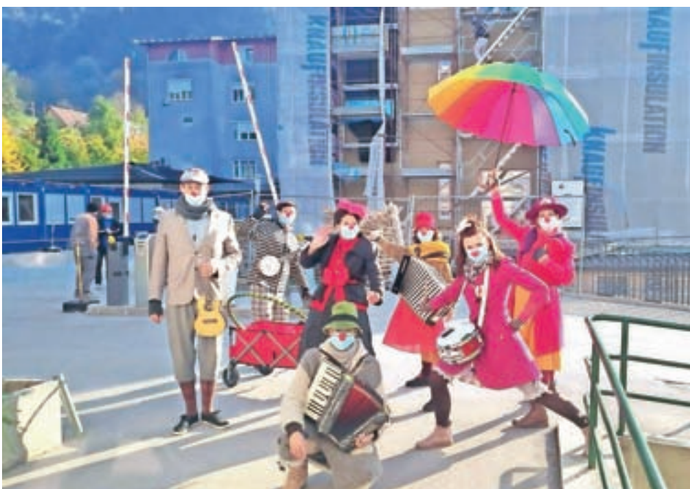
Rdeči noski so naklonjenost, radost, pesem, dobro voljo in smeh prinesli tudi pod okna jeseniške bolnišnice.

nov, prišli do pomembnega zaključka, tako rekoč do znanstvenega odkritja. »Namreč, ne glede na razdaljo, ovire iz stekla, betona ali opeke, lahko z gotovostjo trdimo, da obstaja zakon prepustnosti, ki prepušča naklonjenost, radost, pesem, dobro voljo in smeh. Pa ne le to – kljub razdaljam smo blizu.«