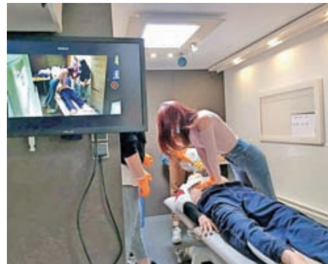
Mobilna enota je opremljena z vrhunsko opremo, v njej so simulator profesionalnega defibrilatorja, simulator poroda, lutka hudo poškodovanega ...

Enota deluje pod okriljem Simulacijskega centra (SIM) Zdravstvenega doma Ljubljana in je prvi tovrstni program v Sloveniji in celo v tem delu Evrope. Kot poudarjajo, usposabljanje v SIM-enoti daje zdravstvenemu osebju priložnost, da se soočijo z vitalno ogroženim