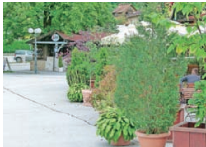
Priznanje v kategoriji najlepše ocvetličen poslovni objekt je letos prejel tudi Tea-ter bar.