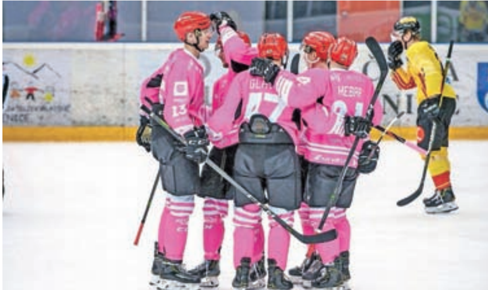
Člani HDD SIJ Acroni Jesenice so že drugo leto zapored sodelovali v rožnatem oktobru. Z licitacijo rožnatih dresov jim je letos uspelo zbrati kar 2799 evrov, ki jih bodo podarili združenju za ozaveščanje o raku dojk Europa Donna Slovenija.

Koronavirus je močno posegel v šport in tudi hokej ni nobena izjema. Če pogledamo v slovenski hokejski prostor, sta bili normalno odigrani tradicionalna blejska Poletna liga in Pokal Slovenije. Dokaj normalno se je začela Alpska liga, kjer med 16 klubi iz Avstrije in Italije najdemo tudi dva slovenska kluba – HDD SIJ Acroni Jesenice in ljubljansko SŽ Olimpijo. V uvodnem delu, kjer so bile ekipe razdeljene v štiri skupine po štiri ekipe, so jeseniški hokejisti odigrali pet tekem. Tri tekme (poraz z Olimpijo s 6 : 1 in neodločen rezultat doma 2 : 2 ter zmaga doma s 5 : 0 proti drugi ekipi Linza) smo že »obdelali« v prejšnji številki. Povratno tekmo v Linzu so gostitelji odigrali bolje. V zadnjo minuto sta šli ekipi poravnani, rezultat je bil 2 : 2. Gostitelji so si želeli vsaj prestižno zmago, a z dvema prejetima zadetkoma so ostali popolnoma praznih rok. Jeseničani so z dvema zmagama prišli do prvih treh točk v Alpski ligi v letošnji sezoni. Tretji nasprotnik Jesenic v uvodnem delu je bila druga ekipa celovškega KAC-a. Jeseničani so dobro delo opravili v Celovcu in »prvi polčas« dobili s 3 : 2. »Drugi polčas« žal ni bil odigran, saj so Celovčani sporočili, da imajo v ekipi težave s koronavirusom.