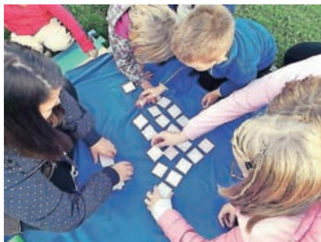
Mladi so na igrišču preživljali čas ob igrah in druženju ter pogovorih.