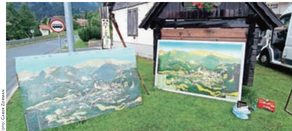
Obe tabli so rekonstruirali in ju natisnili na aluminijasti plošči v enakem slogu.