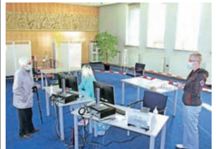
Cepljenje proti gripi poteka v sejni sobi v pritličju Zdravstvenega doma Jesenice.

dne. Na Jesenicah so jih imeli na voljo 870, v sosednjih zdravstvenih enotah pa v Žirovnici 200 in v Kranjski Gori 150 odmerkov. Naročanje letos poteka prek osebnih zdravnikov in povpraševanje je še naprej