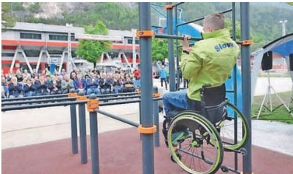
Jekleni poligon v jeseniški Podmežakli. Sestavljen je iz 86 metrov jeklenih cevi, izdelan pa je v jeseniški družbi SIJ Acroni.

Gorenjskem pa dva, v Podmežakli na Jesenicah in v Trziču. Vsak poligon ima tudi svojega ambasadorja, uspešnega športnika iz kraja, kjer je postavljen. Na Jesenicah je to smučarka