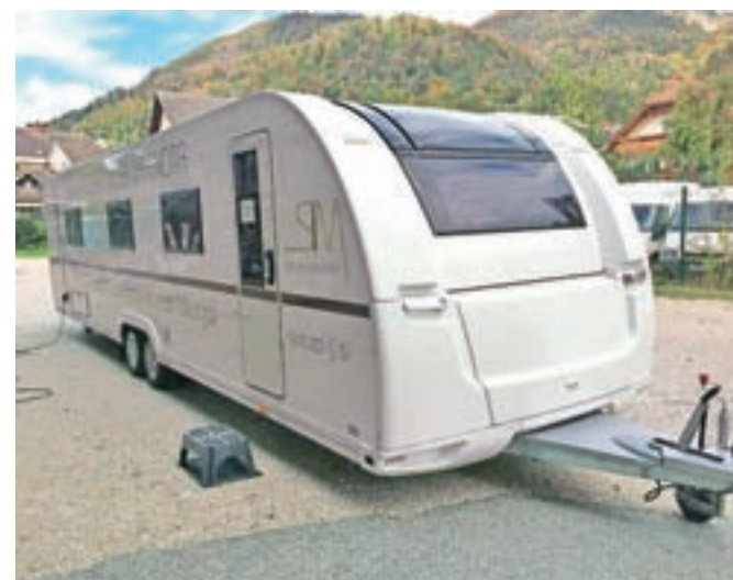
Šestnajst metrov dolga mobilna enota z dvema prostoroma za izvajanje simulacij v zdravstvu.

pacientom ter redkimi situacijami v kliničnem okolju, kot so porod na terenu, vitalno ogrožen otrok ... Večina zdravstvenih timov v Sloveniji namreč le nekajkrat na leto naleti na kritično bolnega ali poškodovanega pacienta. V mobilni enoti pa lah-