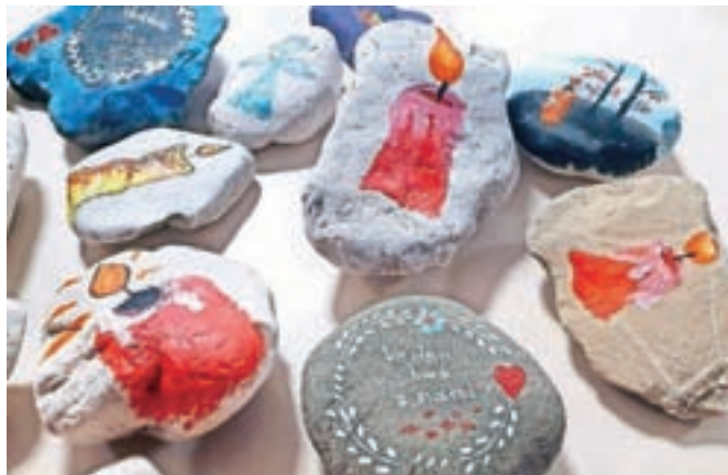
Ročno poslikani unikatni žalni kamni so lahko izvirno nadomestilo za plastične sveče.