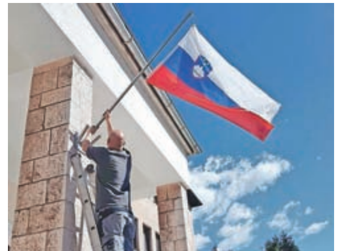
Nova nosilec in drog za zastavo pri vhodu v šolo