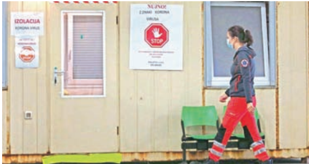
V jeseniški občini je bilo doslej potrjenih 23 primerov okužbe.

V jeseniški občini so doslej potrdili 23 primerov okužbe, dve osebi s koronavirusno boleznijo sta umrli.