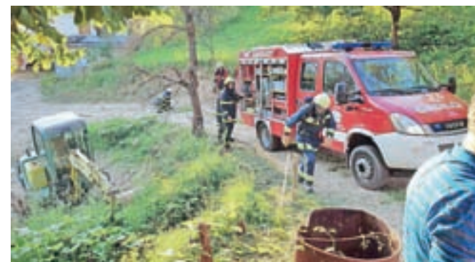
Na kmetiji Pri Kosmatu v Prihodi so izvedli gasilsko vajo.

V krajevni skupnosti Planina pod Golico zaradi znanih razmer s koronavirusom letos ni bilo tradicionalnih prireditev ob krajevnem prazniku. Dne 21. avgusta so izvedli le gasilsko vajo na kmetiji Pri Kosmatu v Prihodi. Sodelovali so člani domačega PGD Planina pod Golico in sosednjega PGD Javorniški Rovt. S praznikom obeležujejo spomin na rudarski red grofov Ortenburških, ki nosi datum 24. avgust 1381, s tem dokumentom, ki je eden najstarejših tovrstnih, pa je grof Friderik Ortenburški določil pravice in dolžnosti rudarjev v Planini pod Golico.