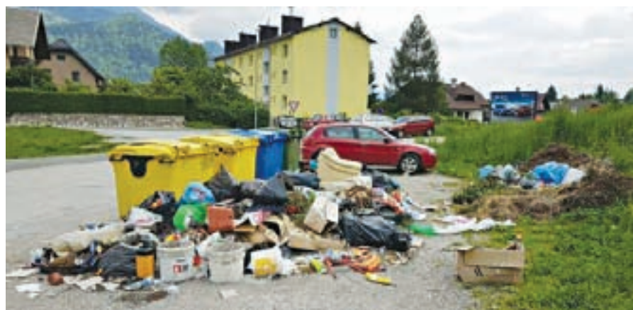
Pripravila: Željko Šmitran in Maja Kržišnik, JEKO, d.o.o.

Obveščamo vas, da je Občina Jesenice sprejela odločitev, da ekološki otok, ki se nahaja na Dobravski ulici, začasno umakne. Vzrok za to odločitev je stalno nepravilno odlaganje odpadkov. Ob zabojnikih se odlagajo kosovni odpadki, zeleni odrez, gradbeni odpadki, nevarni odpadki, ... Kljub večkratnim opozorilom se stanje na ekološkem otoku ni izboljšalo. V septembru bomo tako okolico ekološkega otoka pospravili, zabojnike za ločeno zbiranje pa izpraznili in odpeljali. Ekološkemu otoku na Dobravski ulici sta najbližja ekološka otoka na Savski cesti 21 in parkirišče nasproti Savske ceste 1, lahko pa ločeno zbrane odpadke brezplačno pripeljete v Zbirni Center Jesenice.