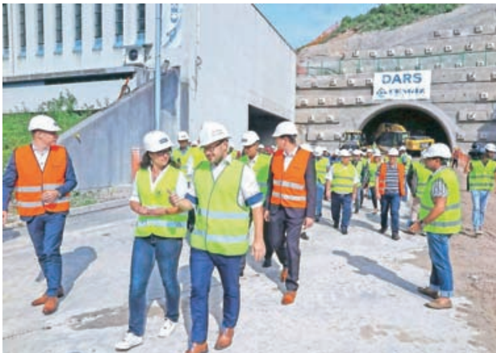
Začetek del si je ogledal tudi minister za infrastrukturo Jernej Vrtovec; na sliki v družbi gorenjske poslanke Mateje Udovč.

Po županovih besedah bodo kot multikulturalna občina prijazno sprejeli tudi turške delavce, ki bodo naslednjih