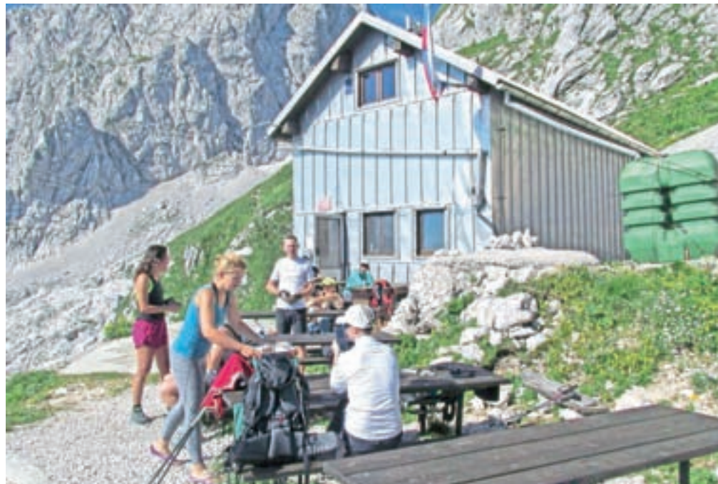
Zavetišče pod Špičkom na nadmorski višini 2064 metrov je najvišja postojanka Planinskega društva Jesenice.

redujeva različne informacije, ki planince zanimajo o poteh in vrhovih. Glede obutve jasno poveva, da na Jalovec pač ni moč priti v opankah. Planinci so sicer dobro opremljeni, najdejo pa se tudi takšni s slabo opremo." Največ planincev prihaja ob koncih tedna in takrat je treba še bolj poprijeti za delo. Zelo se trudita ustreči z jedmi, ki jih na