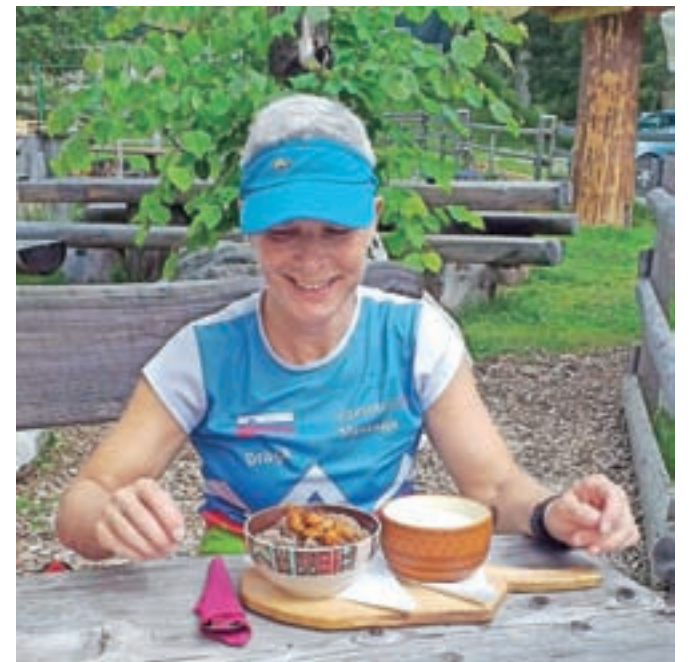
Žganci na Pokljuki

V večini etap je pot speljana mimo rek (Sava, Bača, Soča) ali jezer (Šobec, Bled, Bohinj, jezero pri Mostu na Soči). Zadala sem si, da prav vsak dan na koncu etape (ali pa že prej) zaplavam, kar se mi je uresničilo in se je tudi zelo prileglo. Nekaj je tudi slapov ob ali zgolj malo s poti (Sopota, Kozjak, Zaročenca). V poletnih dneh je že pogled na vodo osvežujoč, četudi gre zgolj na razgled na jeseniški bazen, ki vabi tik pred koncem druge etape. Večinoma je ob poti dovolj tudi pitne vode (8., 9. in 10. etapa), kjer pa je ni, pa se da znajti.