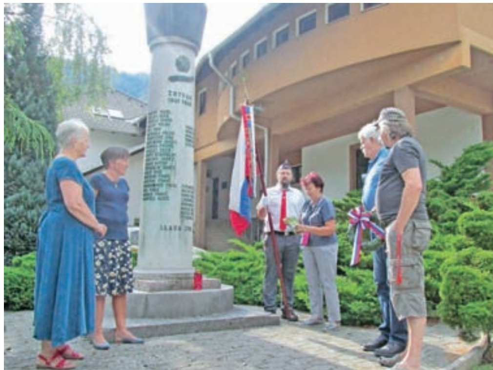
Ob prazniku KS Blejska Dobrava so letos obiskali spominska obeležja iz časov NOB.