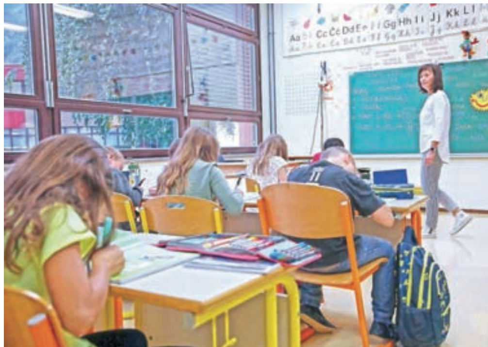
Začetek šolskega leta v največji jeseniški osnovni šoli, OŠ Toneta Čufarja.

Pouk se je sicer za učence in dijake začel po modelu B, ki predvideva izvajanje