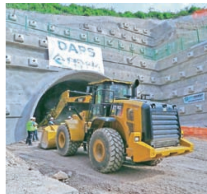
Turški izvajalec Cengiz Insaat je začel vrtati v Karavanke, prejšnji teden so izvrtali prvih šest metrov druge cevi.