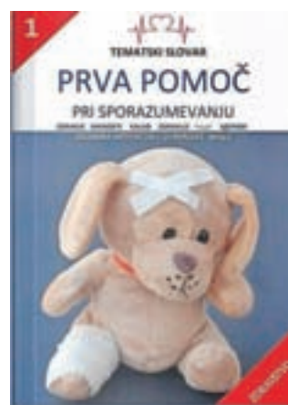
Šestjezični slovar, ki je namenjen sporazumevanju v zdravstvenih ustanovah

V mesecu septembru je program začela že druga skupina, v katero so vključene ženske iz Poljske, Bolgarije, Ukrajine, Makedonije, Filipinov, Kosova ter Bosne in Hercegovine.