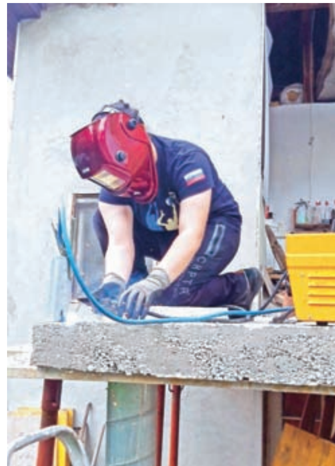
Pri varjenju konstrukcije za ograjo

Osemnajstletnica se je v razredu, polnem fantov, dobro počutila. Kot pravi, so bili sošolci do nje zelo prijazni in zaščitniški, kot ena redkih deklet pa se je sama počutila nekako 'materinsko', saj je fantom morala pogosto pomagati in jih usmerjati. "To je bila zelo dobra življenjska izkušnja,"