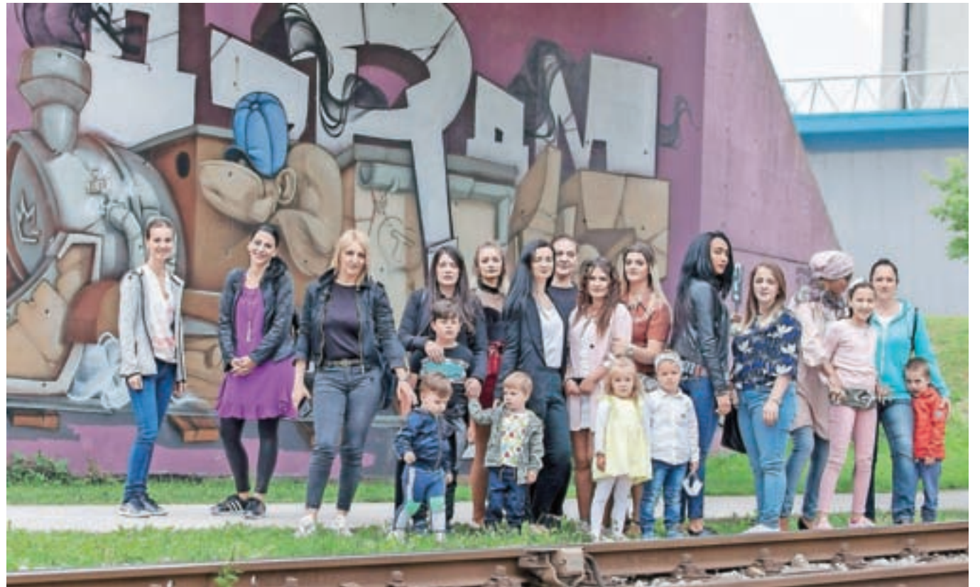
Ženske, ki so sodelovale v projektu Socialna aktivacija žensk iz drugih kulturnih okolij

Skupina žensk iz drugih kulturnih okolij, ki živijo na Jesenicah, je med drugim oblikovala tudi šestjezični tematski slovar, namenjen uporabi v zdravstvenih ustanovah.