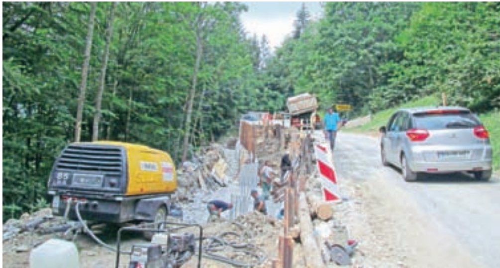
Prejšnji teden je bilo postavljenih že 25 od 47 pilotov.

Vrednost projekta je nekaj več kot 358 tisoč evrov, Občina Jesenice pa se je prijavila tudi na javni razpis Ministrstva za okolje in prostor za sofinanciranje iz programa