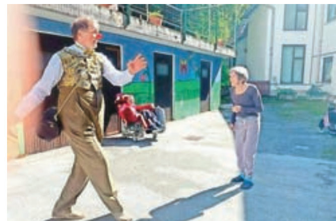
Klovni iz društva Rdeči noski so zabavali stanovalce jeseniškega doma starejših.

humorjem. Obkroženi z milnimi mehurčki so izvedli tudi nekaj čudovitih čarovniških trikov ter vse navzoče osupnili s cirkuškimi spretnostmi, kot so vrtenje krožnikov na palicah in vrtenje zastavic. Tako sta se dobra volja in smeh razširila med stanovalce, klovni pa so obljubili, da se še vrnejo.