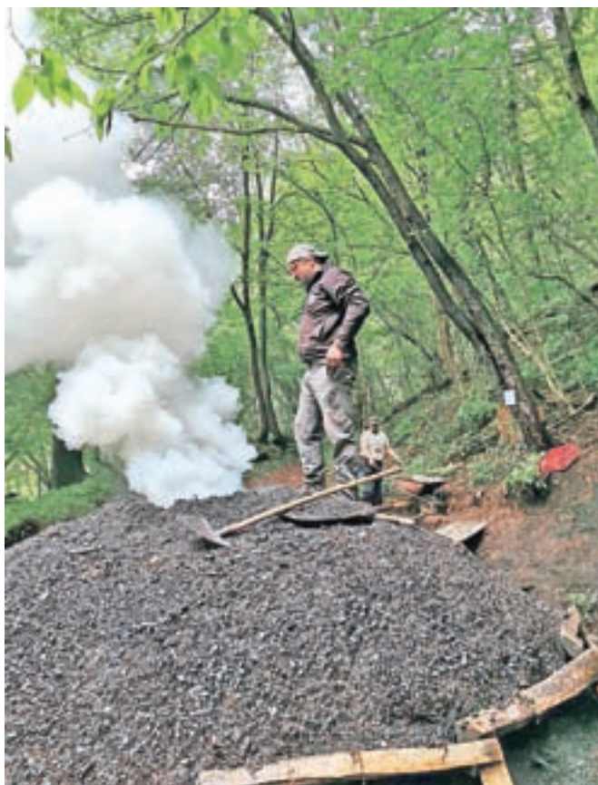
Kopa je prižgana...