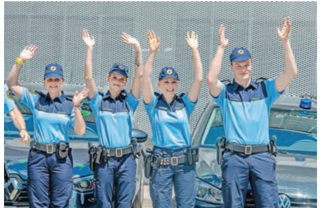
Tudi policisti so v času epidemije skrbeli, da so vsi osnovni sistemi v državi delovali.