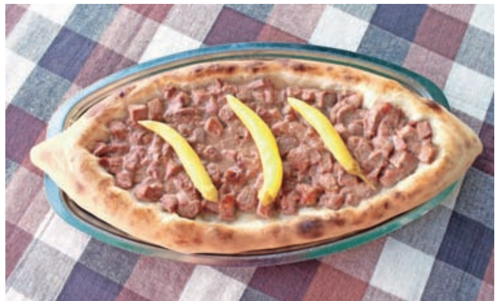
Pastrmajlija je makedonska krušna pita z mesom.