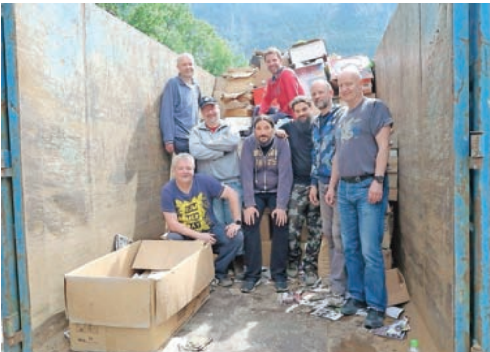
Ekipa predanih prostovoljcev, ki so tri dni, tudi v močnem dežju, prelagali pripeljani papir iz avtomobilov v zabojnik. Preložili so ga več kot sedemdeset ton.