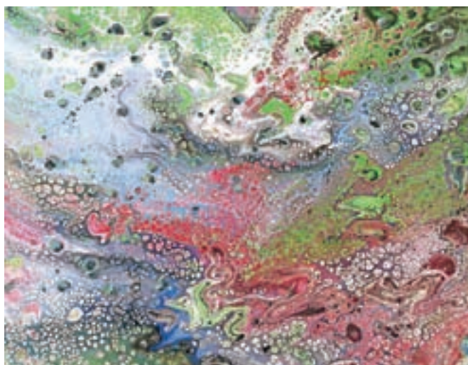
Slike v tehniki prelivanja barv na platno