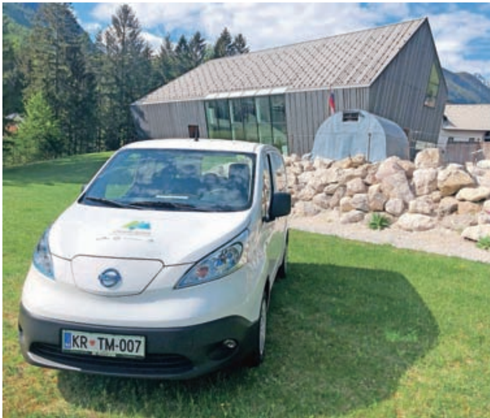
Novo električno vozilo, s katerim bodo brezplačno vozili obiskovalce z jeseniške železniške postaje do dolin Vrata in Krma ter muzejskih enot.

Z železniške postaje na Jesenicah se je po novem mogoče odpeljati do dolin Vrata in Krma ter do muzejskih enot v Kranjski Gori z električnim kombijem, ki so ga pridobili v Slovenskem planinskem muzeju (ta sodi pod okrilje Gornjesavskega muzeja Jesenice). Gre za projekt Obisk gora v času podnebnih sprememb, s katerim želijo spodbujati trajnostno mobilnost. Z Jesenic do Vrat kombi vozi vsak torek in četrtek, do Krme vsako sredo, od Jesenic do Kranjske Gore med muzejskimi enotami pa vsak petek in soboto. Prevozi v alpske doline so brezplačni, za prevoz med muzejskimi enotami pa je potreben nakup vstopnice za vsaj eno muzejsko enoto. Je pa potrebna rezervacija prevoza, in sicer na spletni strani https://www.planinskimuzej.si/prevozi-v-gore/ , kjer so objavljeni tudi urniki prevozov ter vse dodatne infor-