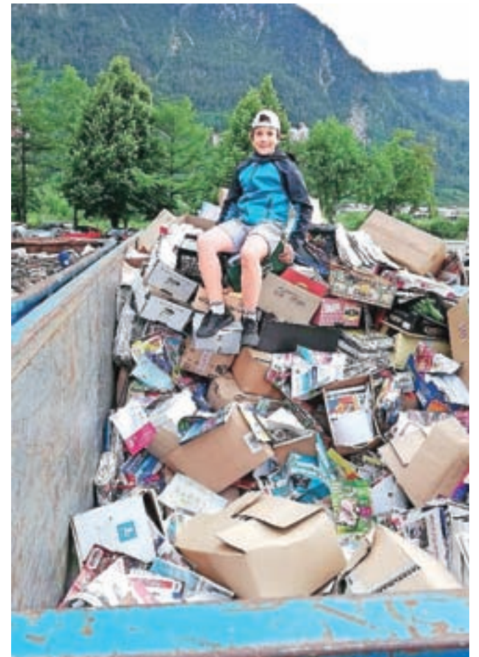
Jeseničani so tri dni dovažali odpadni papir, vsak dan se ga je nabralo za več kot dvajset ton.