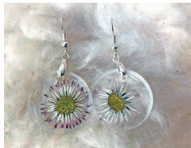
Unikatni nakit: cvetice, ulite v smolo