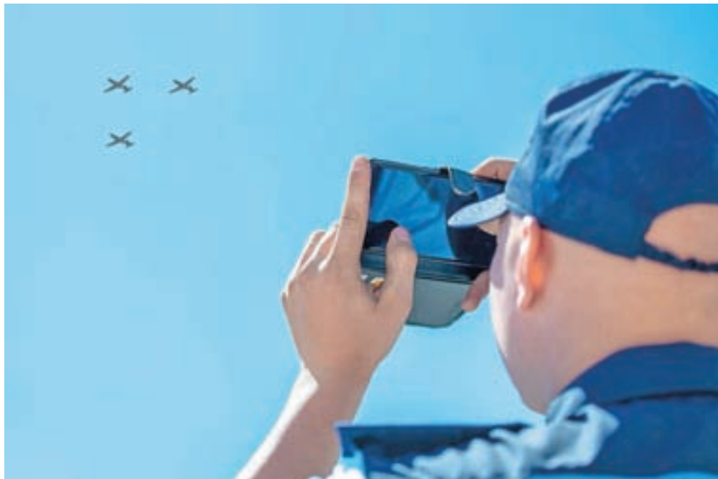
Letala so Jesenice preletela v dveh ešaloni, med katerima je bila milja razmika, in sicer na višini približno 1200 metrov s povprečno hitrostjo 425 kilometrov na uro.

Jelšah, Brežice, Novo mesto, Metliko, Postojno in Izolo. Ameriški piloti pa so v znak zahvale podobno pred tem preleteli tudi nekatera italijanska mesta, ki jih je pandemija še huje prizadela.