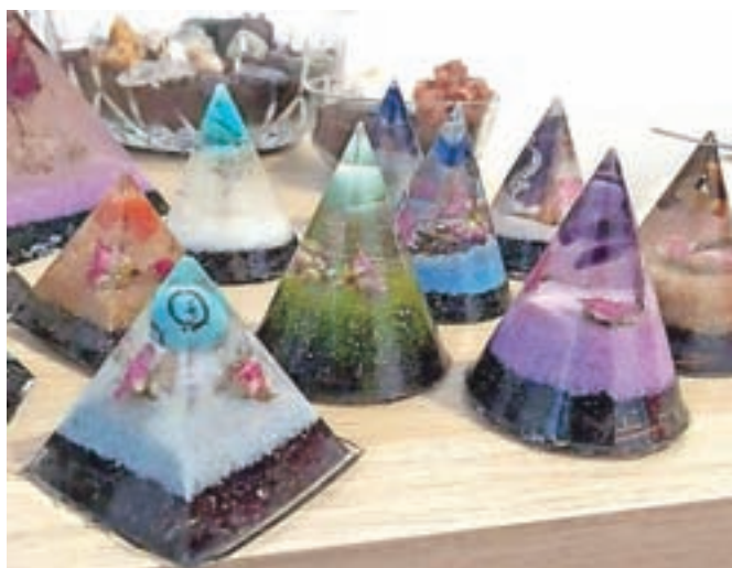
Orgoniti so energetski stožci oziroma piramide.

Razstava bo na Slovenskem Javorniku na ogled do 2. julija.