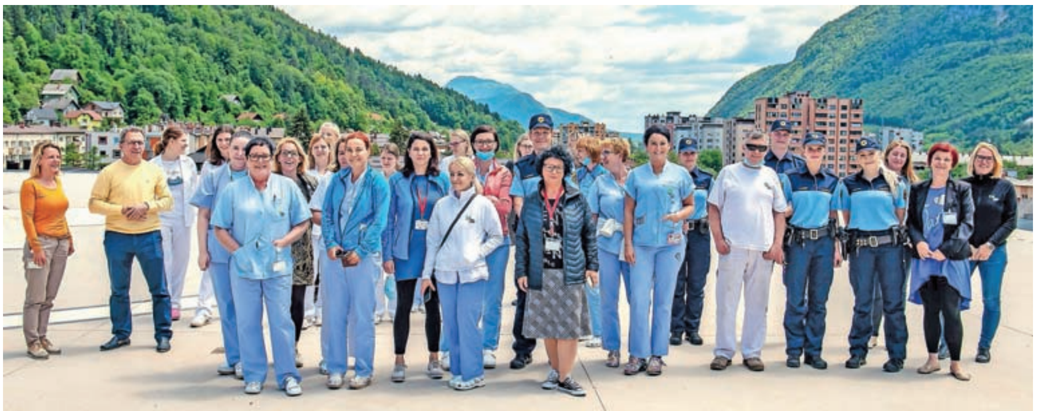
Zaposleni Splošne bolnišnice Jesenice so prelet letal pozdravili na strehi bolnišnice. / FOTO: NIK BERTONCEJ