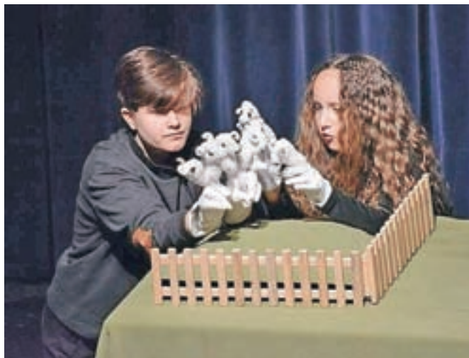
Kot animatorji lutk nastopajo osnovnošolci.

Lutkovna premiera je bila po koncertu Tanje Zajc Zupan 8. marca po osemdesetih dneh zatišja prva predstava po sprostivni nekaterih ukrepov.