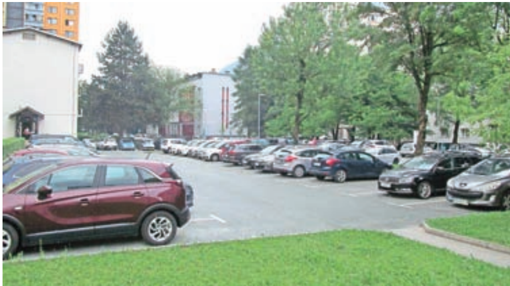
Po ocenah na Plavžu primanjkuje od 1500 do 2000 parkirnih mest.

Predsednica Sveta KS Plavž Ivanka Zupančič poudarja, da je čas za ukrepanje in hitrejše iskanje rešitev. "Po nekaterih ocenah sedaj na Plavžu primanjkuje od 1500 do 2000 parkirnih mest. Včasih je bilo ocenjeno, da na stanovanje za parkiranje pripada 0,8 avtomobila, danes sta to dva avtomobila ali morda še več. Avto je danes vsakdanja potreba več ljudi v enem stanovanju, temu se ni moč izogniti. Seveda ob vseh rešitvah ne smemo pozabiti tudi na zelene površine, ki jih ne smemo prepustiti za nova parkirnišča. Ena od možnih rešitev je tudi izgradnja garažne hiše, nekaj lokacij je bilo že v igri." Na seji je bil tudi vodja skupne občinske uprave Medobčinskega inšpektorata in redarstva Jesenice Gregor Jarkovič, ki na problematiko gleda širše in obenem opo-