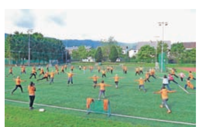
Šola zdravja: jutranja telovadba v značilnih oranžnih majicah. Fotografija je iz Radovljice.

ce. Člani – povprečna starost v skupinah je 69 let – vsako jutro v značilnih oranžnih majicah telovadijo na prostem in s tem skrbijo za redno gibanje ter ohranjanje zdravja. Na ta način se ohranja in izboljšuje zdravje prebivalcev, kar je prepoznalo tudi ministrstvo za zdravje, še dodaja.