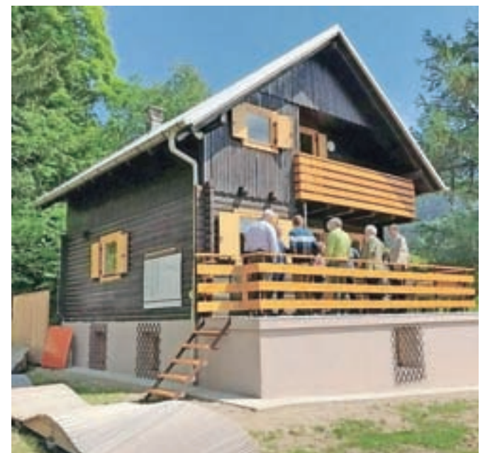
Ogledali so si prenovljeni Kurirski dom.