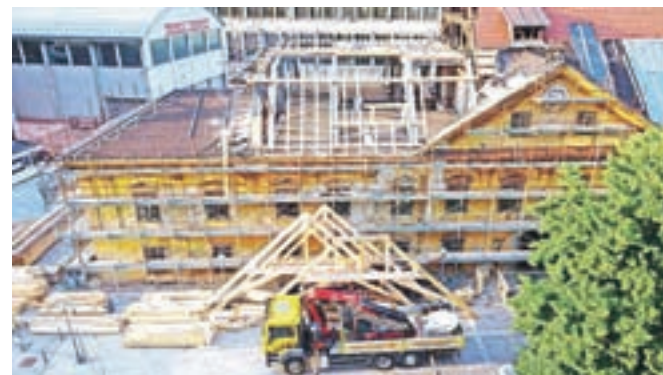
Pri obnovi Bucelleni-Ruardove graščine izvajajo dela na strehi.

dediščine, Območne enote Kranj. Po terminskem načrtu bi se obnova morala zaključiti konec letošnjega leta, ni pa še znano, ali oziroma za kako dolgo se bodo dela zavlekla zaradi omejenega izvajanja v času epidemije. Vrednost investicije znaša 2,6 milijona evrov, Občini Jesenice pa je uspelo pridobiti sofinanciranje iz Kohezijskega sklada in Republike Slovenije.