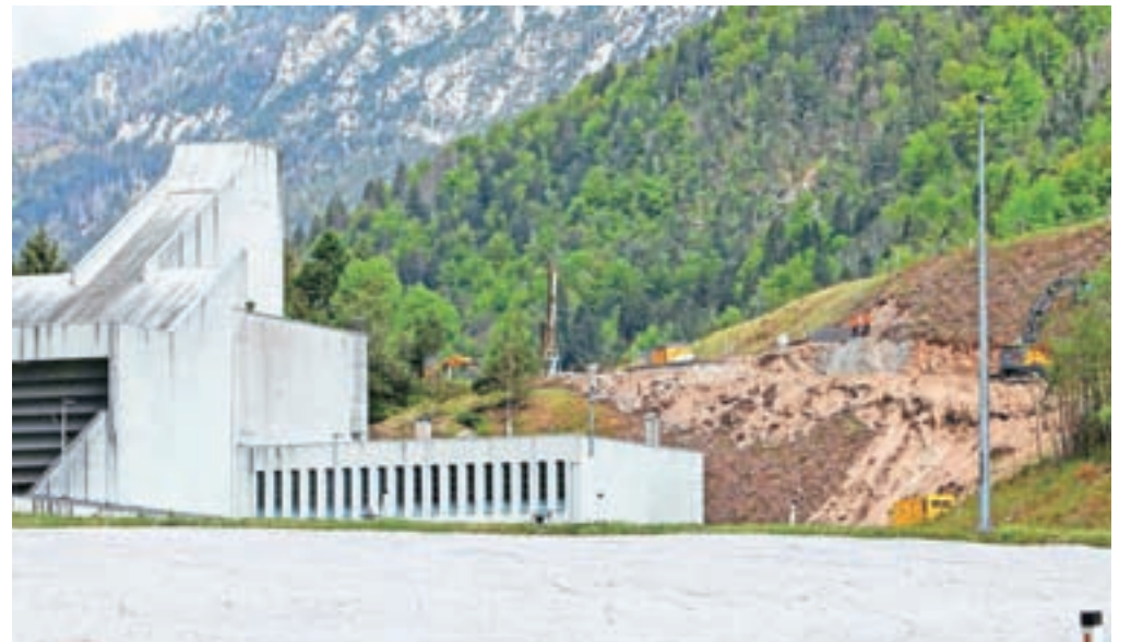
Od 2. marca je podjetje Cengiz Insaat izvajalo pripravljala dela na platoju, ta čas pa potekajo dela na začasnem portalu, kar je predpogoj za začetek izkopa predora. Ta dela naj bi dokončali do konca avgusta.

Predstavnika izvajalca in nadzora sta prisotne seznanila z do sedaj opravljenimi deli; od 2. marca je podjetje Cengiz Insaat izvedlo pripravljala dela na platoju, ta čas pa potekajo dela na začasnem portalu, kar je predpogoj za začetek izkopa predora. Ta dela naj bi dokončali do konca avgus-