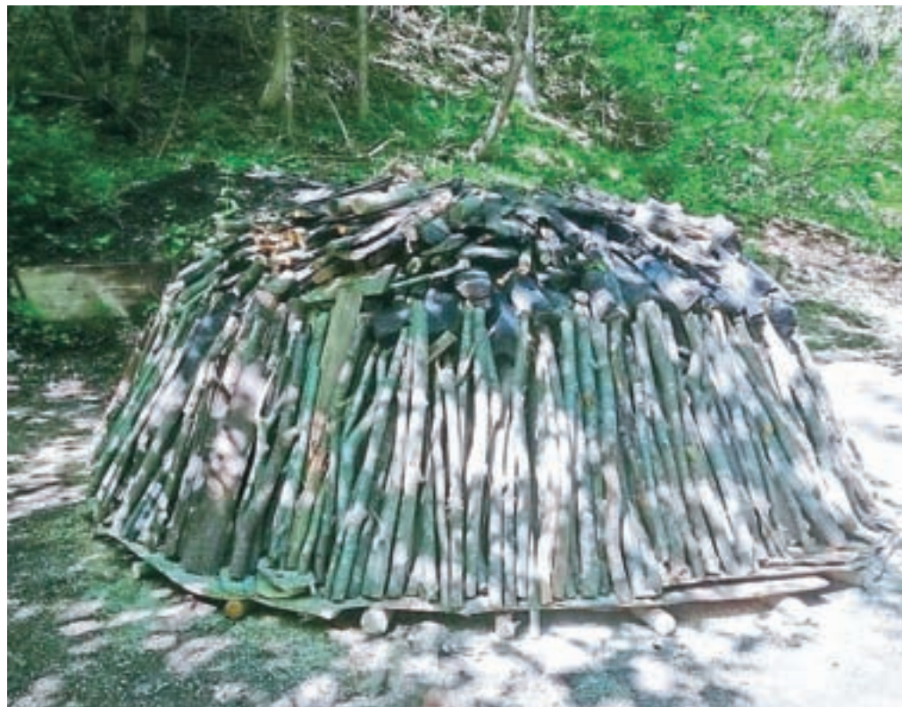
Kuhanje oglja je star običaj, ki ga ohranjajo tudi na Koroški Beli.

in osnovni šoli in jim podarili oglje, ki so ga potem uporabili pri pouku, pri likovnem ustvarjanju. Letos so žal že dogovorjene predstavitve zaradi epidemije morali odpovedati, kljub temu pa upajo, da bodo v prihodnje to dejavnost še lahko predstavljali najmlajšim.