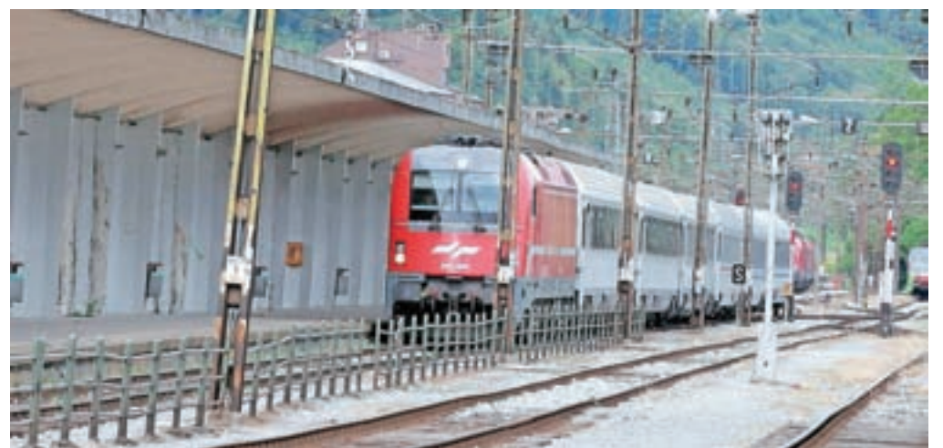
Zaposleni v turizmu upajo, da se bodo čim prej odprle meje in bodo začeli voziti tudi mednarodni vlaki.