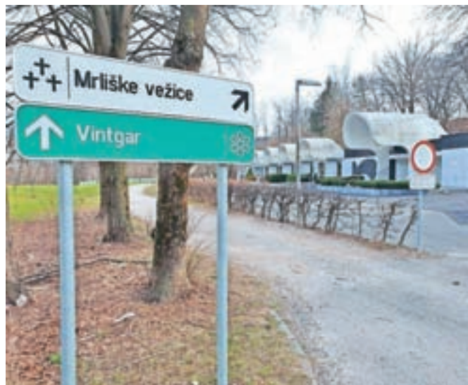
Občina Jesenice bo asfaltirala makadamsko cesto mimo poslovnih vežic, da se ne bo več prašilo, poskrbeli pa bodo za postavitve pregrade, ki bo poslovnice vežice ločila od pogledov s ceste.

osnovno infrastrukturo skrbi TD Gorje, ki pa je letos namenilo tudi 20 tisoč evrov donacije, s katero bo Občina Jesenice asfaltirala makadamsko cesto mimo poslovnih vežic, da se ne bo več prašilo, kar je bilo moteče zlasti v času pogrebnih slovesnosti. Prav tako bodo poskrbeli za postavitev pregrade, ki bo poslovnice vežice ločila od pogledov s ceste. Občina Jesenice pa pripravlja tudi predlog prometne ureditve, v sklopu katere bodo določili tudi režim parkiranja na parkirišču pri pokopališču. Jeseniški občinski svetniki ga bodo obravnavali na seji ta mesec,