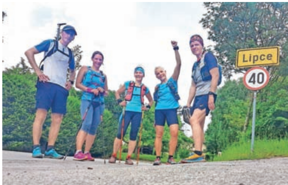
Na cilju v Lipcah: sklenjen krog