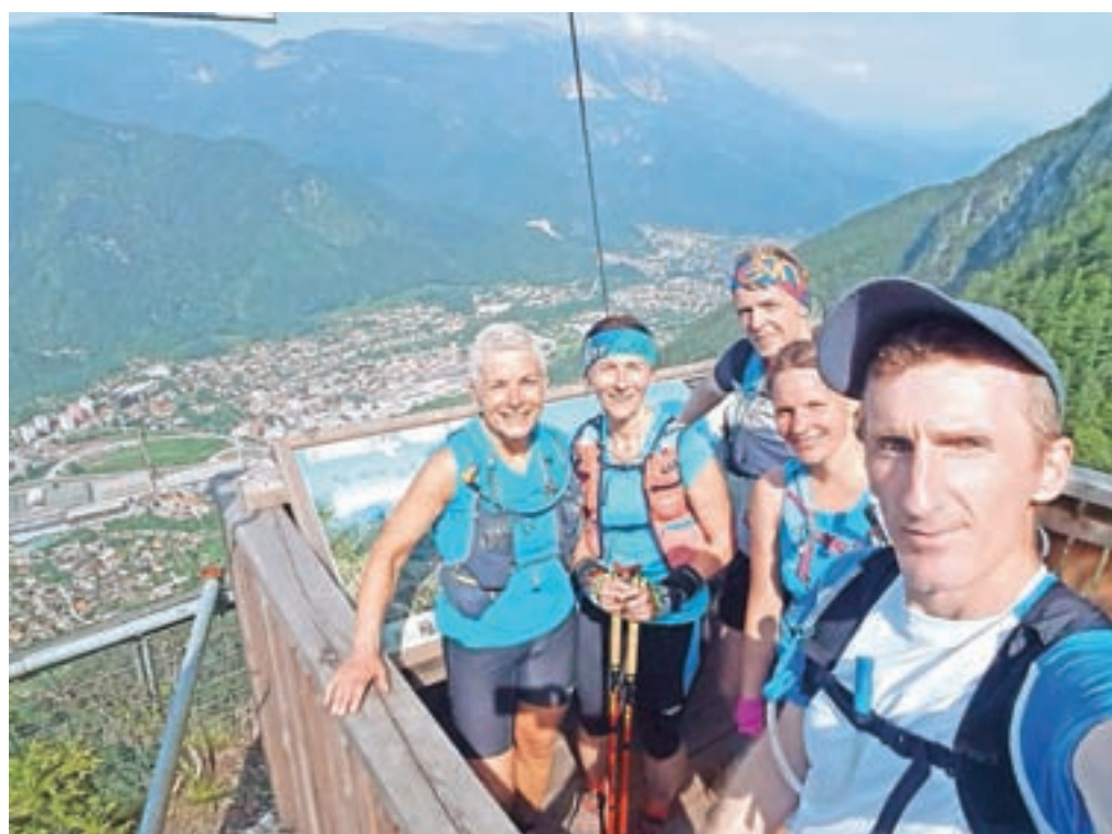
Na razgledišču na Mežakli

K uspešni izvedbi pa je veliko pripomogel ekipni duh. Kot pravi sogovornica, v družbi sotekačev kilometri tečejo hitreje. "Vse je v glavi, ekipni duh pa pri izvedbi takega dneva močno pripomore. Ponosni smo, da nam je skupaj uspelo udejanjiti še eno dobro zgodbo, nekaterim tudi zgodbo osebnih zmag," še dodaja sogovornica.