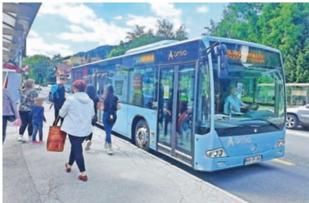
Avtobusi mestnega prometa na Jesenicah ponovno vozijo po običajnem voznem redu.

Tako vozniki kot potniki morajo ob uporabi avtobusnega prevoza upoštevati navodila in priporočila NIJZ. To pomeni, da lahko prevoz uporabljajo le zdrave osebe, ki morajo paziti na priporoče-