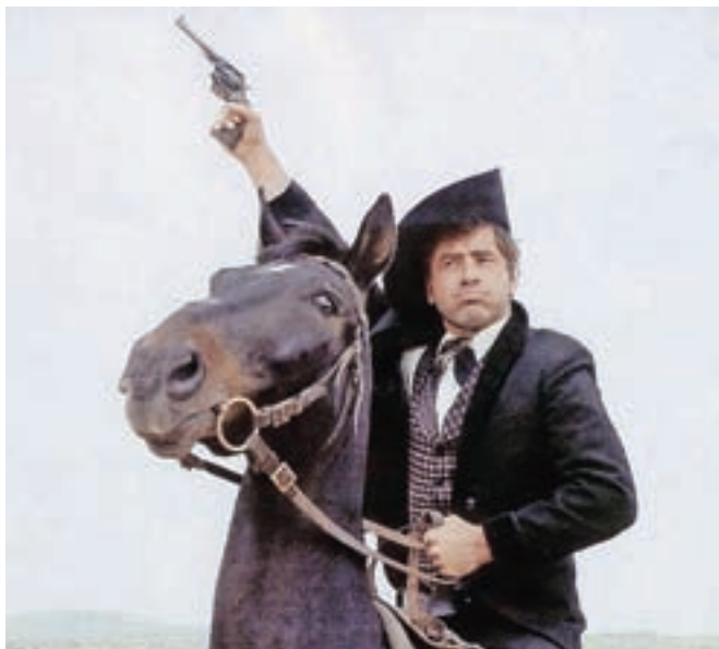
Vloga v filmu Winnetou in Apanači