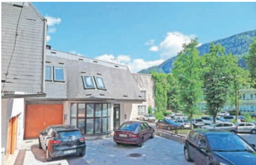
Stavba na Cesti maršala Tita 78a je v delni lasti Občine Jesenice in delni lasti ministrstva za obrambo.

Prostora v stavbi zdravstvenega doma že primanjkuje, imajo deset ambulant družinske medicine, dva zdravnika pa delo opravljata v isti ambulanti.