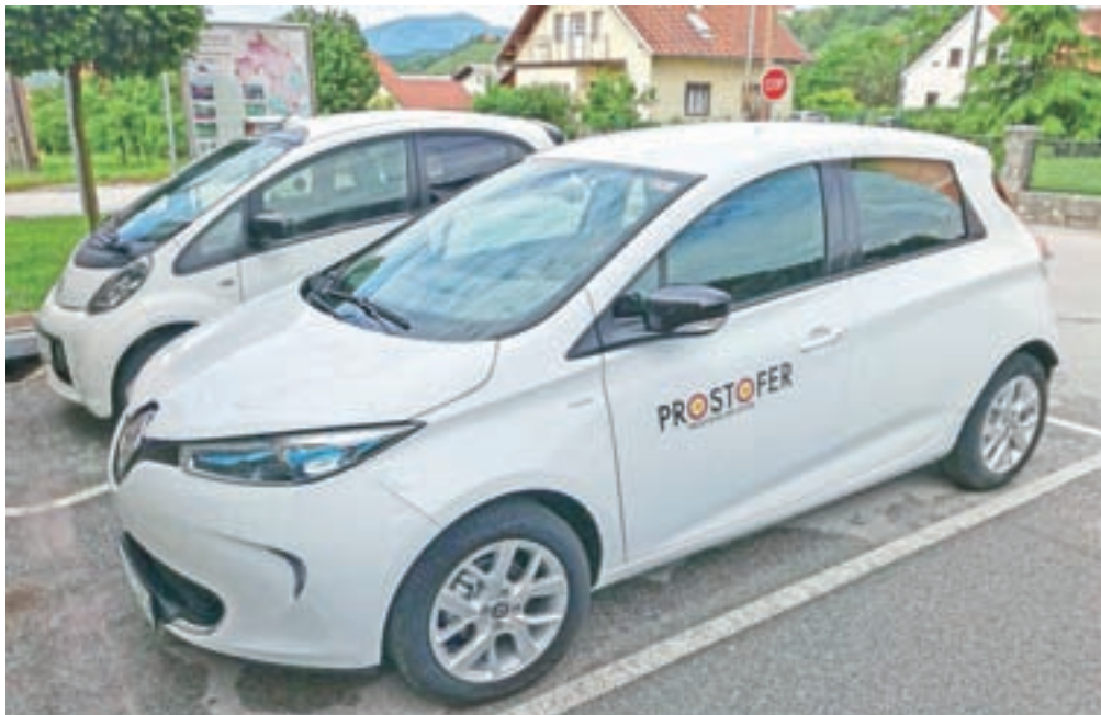
Občina Jesenice je zagotovila električno vozilo, tako je projekt prijazen tudi do okolja.

Prostofer ali "prostovoljni šofer" je projekt brezplačnih prevozov za starostnike, ki ga bosta izvajala Občina Jesenice in Zavod Zlata mreža. Občina je v ta namen priskrbelo novo električno vozilo Renault Zoe, Zavod zlata mreža pa je poskrbelo za izobraževanje voznikov prostovoljcev. Trenutno je prijavljenih 13 voznikov prostovoljcev, ki so v sodelova-