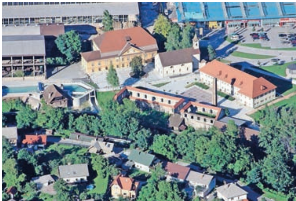
Fužinarsko naselje Sava je bilo leta 2019 razglašeno za spomenik državnega pomena Republike Slovenije.

V Gornjesavskem muzeju Jesenice bodo predstavili Gornjesavsko dolino, kraj, kjer Sava izvira oziroma začenja svojo pot, fužinarsko naselje Stara Sava, pogonsko moč reke Save, družino Bucelleni, ki je