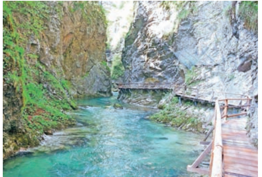
Soteska Vintgar je že odprta, letošnja novost je uvedba enosmerne poti, kar bo preprečilo srečavanja obiskovalcev na ozkih poteh.