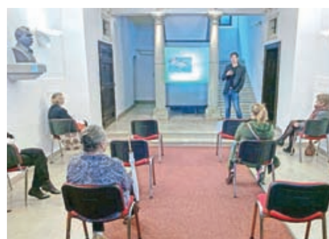
Zadnje srečanje prvega sklopa izobraževanja prostovoljcev je potekalo v živo v Kosovi graščini, ki bo prihodnje leto praznovala petstoletnico.