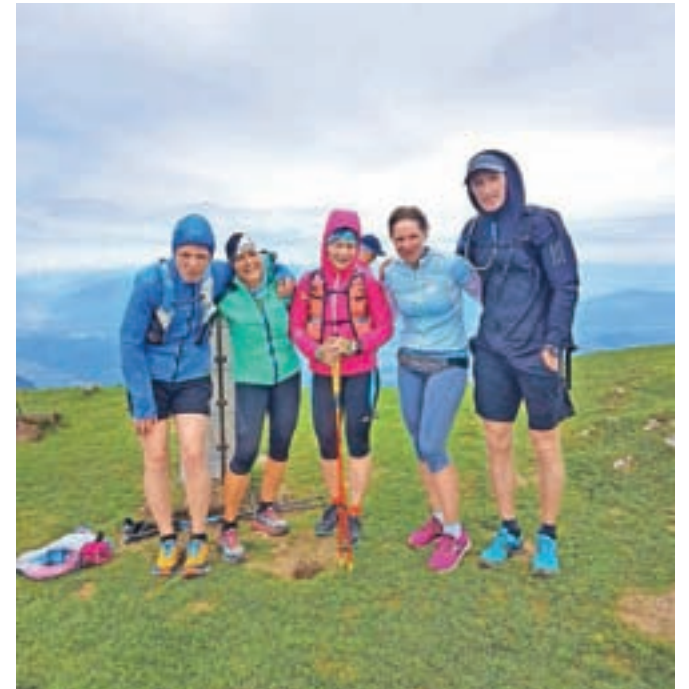
Na vrhu Golice

Startali so ob 5.30 na Lipcah, najprej tekli do Koroške Bele, kjer so takoj zagrizli v