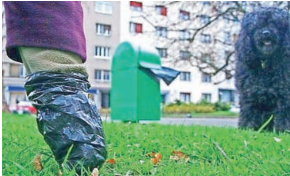
Lastnik oziroma vodnik psa je dolžan uporabljati označene smetnjake, ki so namenjeni za pasje iztrebke.

Kaj pa storiti, ko najdemo izgubljeno oziroma zapuščeno žival? "Žival poskusimo varno zadržati. Na telefonski številki 112 pridobimo podatke, katero zavetišče za živali je pristojno oziroma v katero občino spada območje, na katerem smo našli žival. Po kličemo v pristojno zavetišče in jim povemo vse o najdbi. Če je pes ali mačka na cesti in predstavlja nevarnost v prometu ali je pes videti nevaren in ga ne upate zadržati, že takoj na začetku pokličite policijo na 113 in jim povejte, kje točno se žival